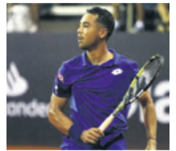
Dellien no entró a la fase principal

La agremiación justifica su petición del pago de un monto por jugar, argumentando que “los futbolistas somos los que generamos los recursos en el fútbol y más bien exigimos a la FBF una justa redistribución de esos recursos de acuerdo a los convenios suscritos con Fabol”.