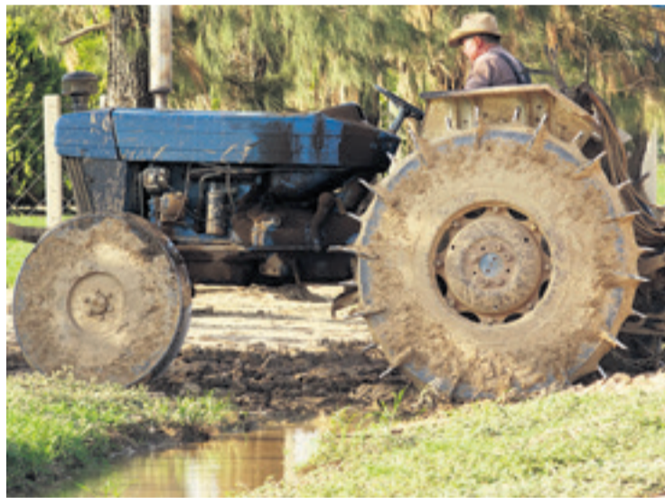
Tractores, con ruedas de hierro, son herramientas comunes en colonias

Pone como ejemplo lo que sucedió en la laguna Concepción, en Santa Cruz: “Hemos visto cómo los menonitas hacen canales de desagüe de lagunas para habilitarlas para poder sembrar, drenan