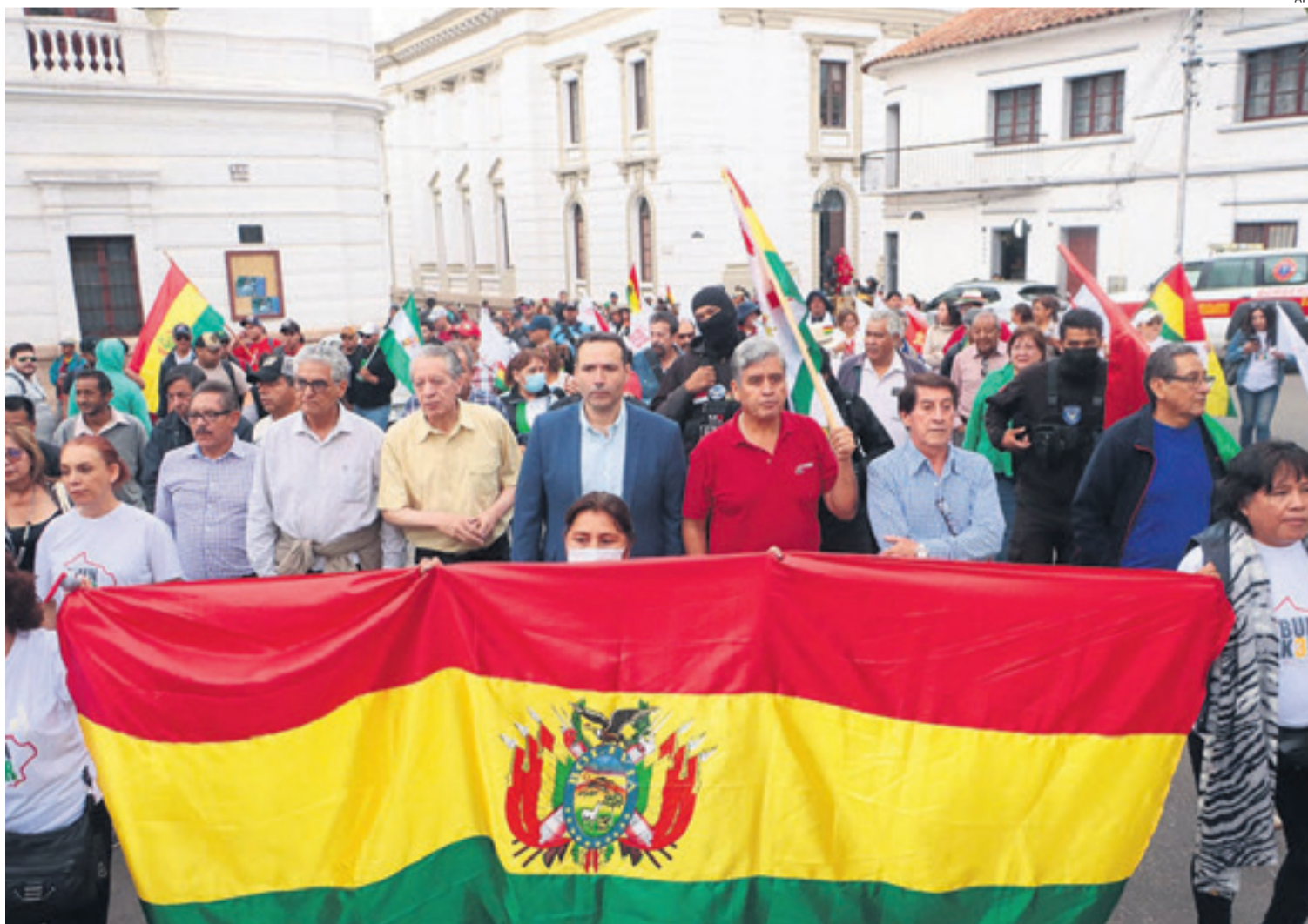
La plataforma El Búnker, Tercera República, en su marcha de protesta en la ciudad de Sucre. Fue ayer