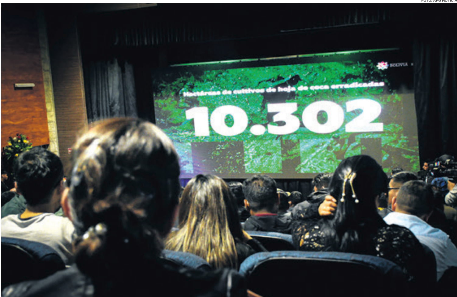
El Gobierno presentó el balance de erradicación en 2023 y la siguiente semana será la exposición de los datos de incineración de droga

Fiel a su discurso, el Presidente, Luis Arce, dijo que de ese modo se abrirá la industrialización de la coca.