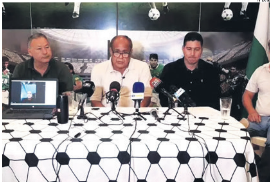
Fabol volvió a entrar en escena ayer, después del anuncio de la fecha de inicio de la temporada, para hacer conocer sus exigencias

En la lista de deudores hay quince clubes, la mayoría de ellos tiene pendientes de pago