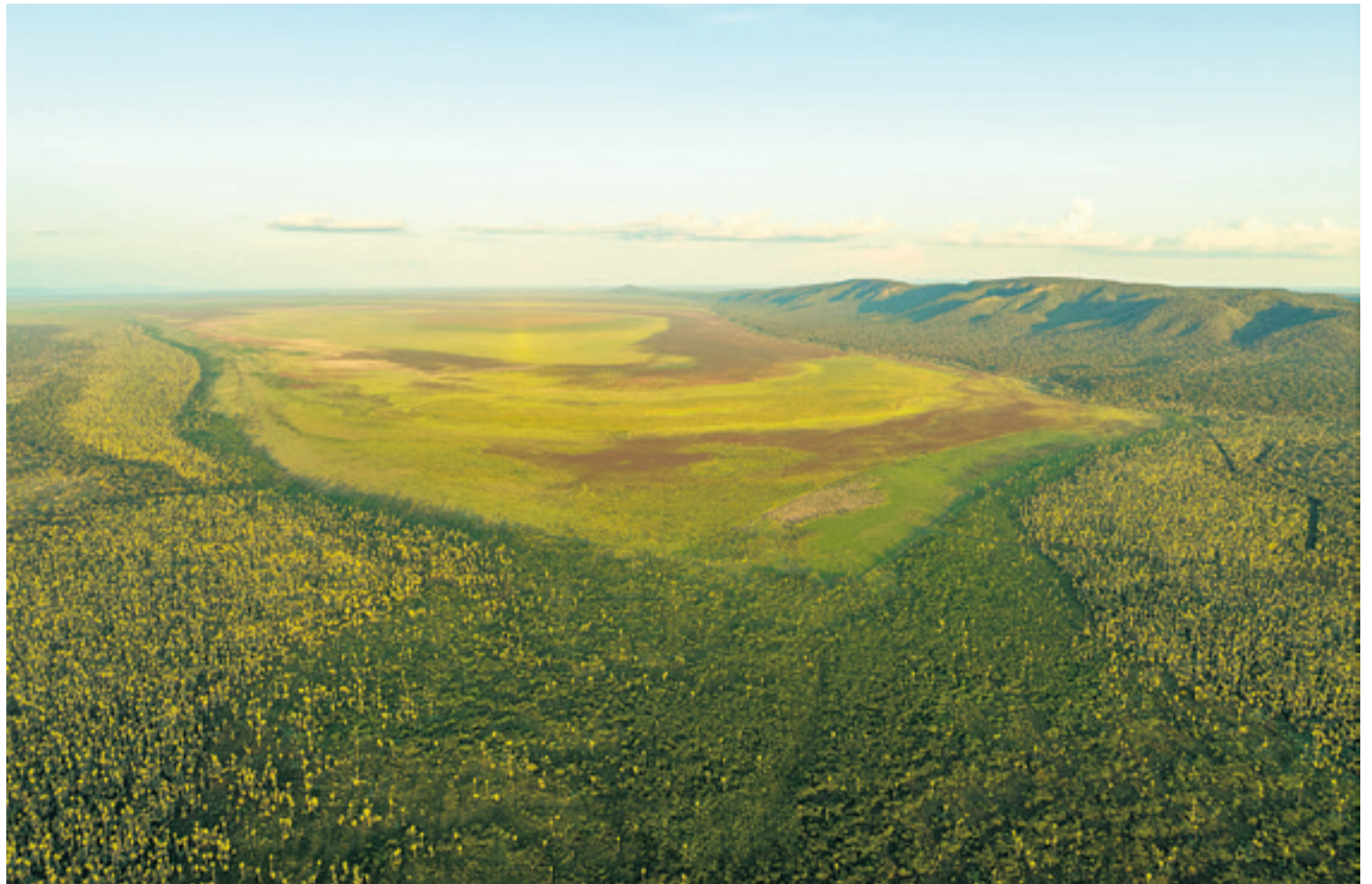
La laguna Concepción de más de 5.000 hectáreas, afectada por la deforestación, se ha convertido en un panteón de tierra seca.