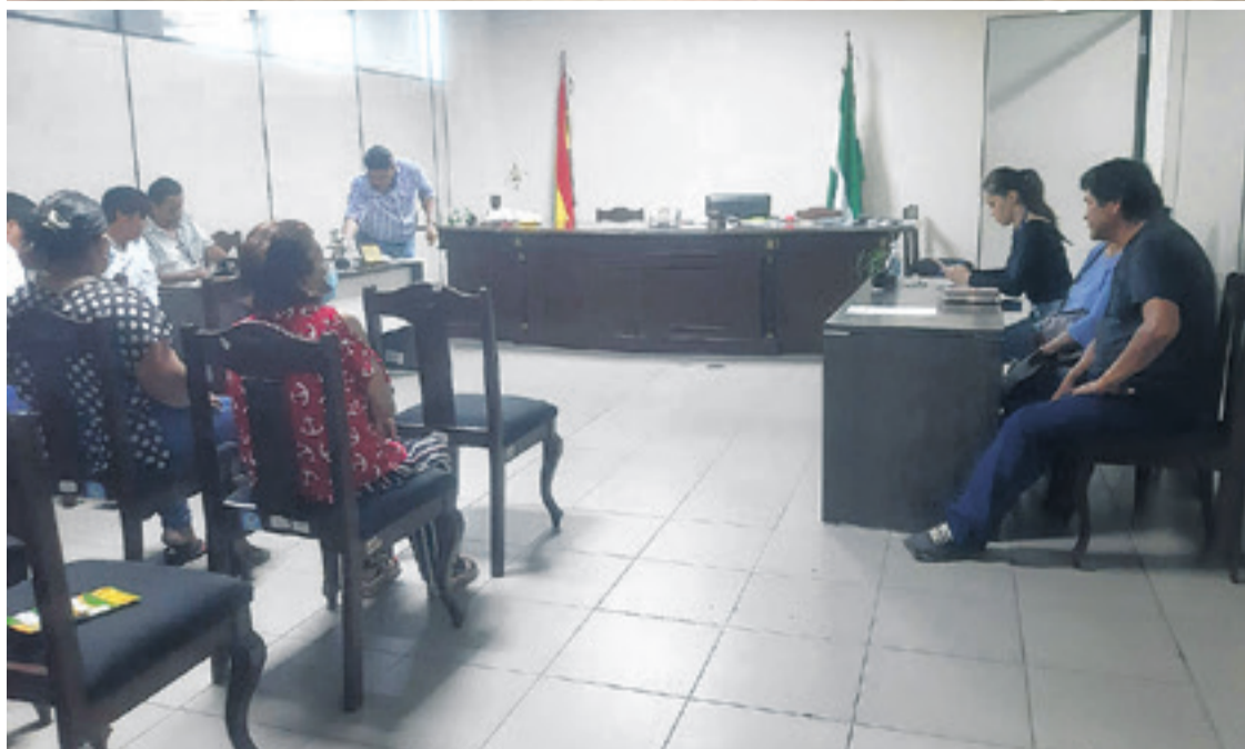
Las actividades judiciales en el tribunal de justicia de Santa Cruz todavía no son normales

Tras una sesión conjunta, el Tribunal Supremo de Justicia (TSJ) y Tribunal Constitucional Plurinacional (TCP) designaron a 13 vocales en materia constitucional para ocho de los nueve departamentos del país. De este modo, llenaron las acefalías que se generaron por el cumplimiento del plazo de sus designaciones.