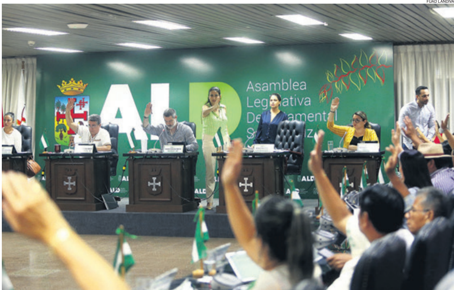
Los legisladores regionales votan con las manos en alto durante una sesión de la Asamblea Legislativa Departamental, donde existen pugnas