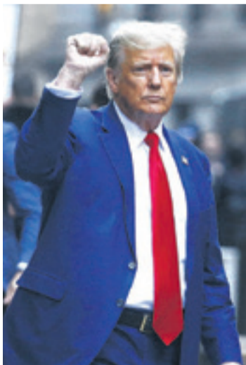
El exmandatario estadounidense pretende otra vez candidatear

Al regresar ayer al tribunal para los alegatos finales, Trump, volvió a arremeter ante la prensa contra las "injerencias políticas", las "injerencias electorales al más alto nivel" y un "juicio muy injusto", llegando a acusar al presidente Joe Biden de estar detrás de esa injerencia.