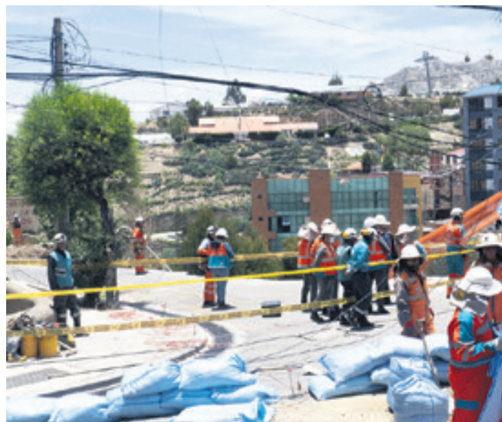
Vía de salida de vehículos de la avenida Kantutani quedó inutilizada

Se pide la actualización del mapa de riesgos de la ciudad de La Paz.