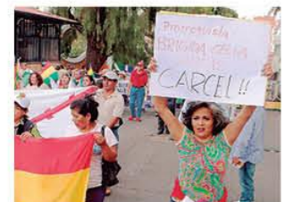
Rechazan prórroga de magistrados

además de Beni, con 48 hectáreas. La zona norte próxima a Choré es la de mayor volumen en la región cruceña. A8