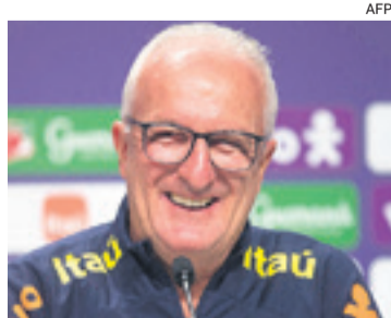
Dorival Júnior dejó el Sao Paulo para hacerse cargo de la selección brasileña

"Con el fútbol brasileño aprendimos el camino de la victoria y necesitamos reencontrarlo", dijo el técnico paulista, de 61 años, durante su presentación oficial en Río de Janeiro.