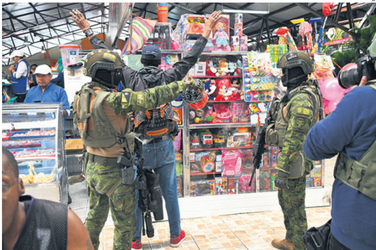
Soldados cachean a un hombre en un mercado en el barrio de Morán, en el norte de Quito. Ecuador se encuentra en un ‘estado de emergencia’

go, cuando uno de los capos más temidos desapareció de su prisión en Guayaquil (suroeste): Adolfo Macías, alias “Fito”, jefe de la principal banda criminal del país conocida como Los Choneros y señalado de haber amenazado al presidenciable Fernando Villavicencio días antes de su asesinato.