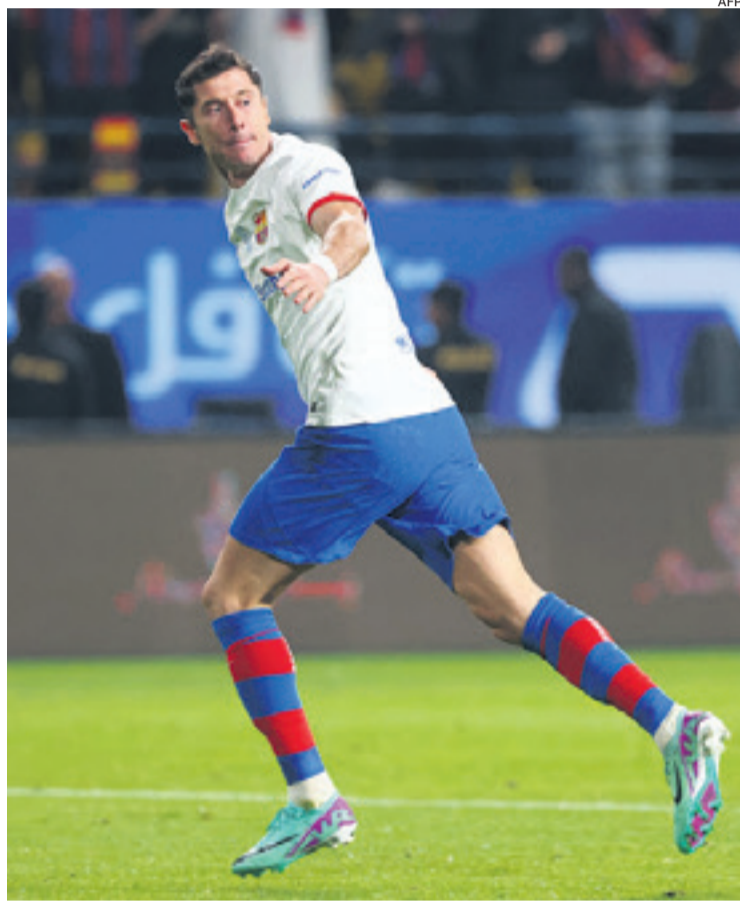
Robert Lewandowski encaminó la victoria del Barcelona con un gol en el segundo tiempo

para los hombres del Barça, especialmente para el delantero polaco Robert Lewandowski, que, pese a desatascar el encuentro, sigue lejos del rendimiento ofrecido la pasada temporada.