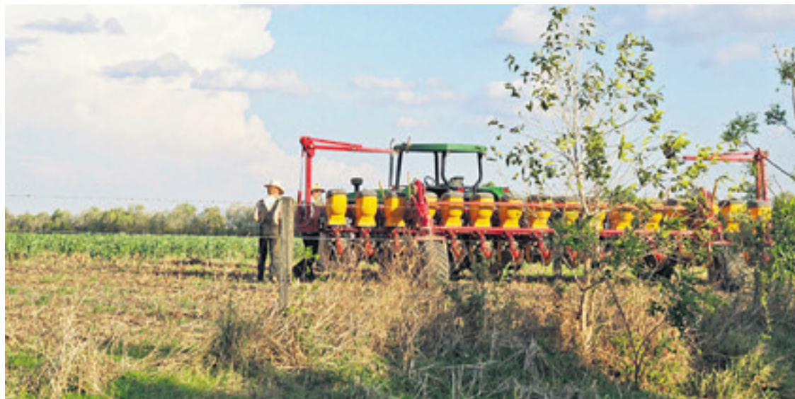
Jóvenes menonitas, en una colonia de Santa Cruz