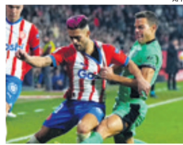
Girona puede recuperar el liderazgo en el campeonato español este domingo

Los cuatro participantes en la Supercopa disputarán sus partidos de la 20ª jornada a finales de enero y principios de febrero, lo que deja un fin