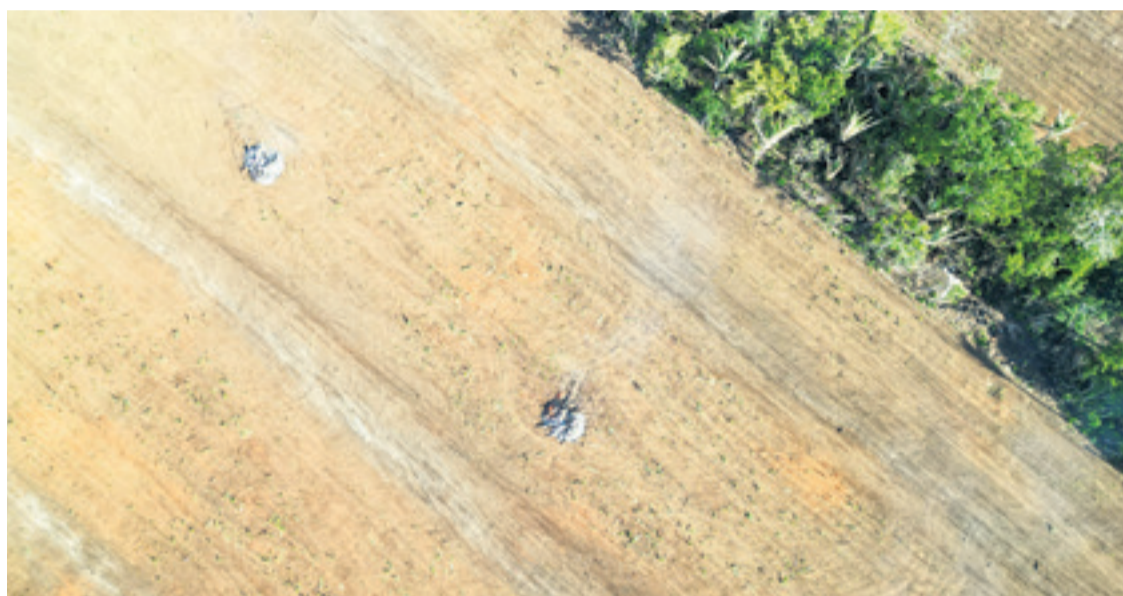
Desde arriba, el rostro de los desmontes, dentro del bosque Chiquitano

y Barbero solo le permite ocupar la mitad, es decir, 12,5 hectáreas, podrá cultivar menos de lo que tiene actualmente.