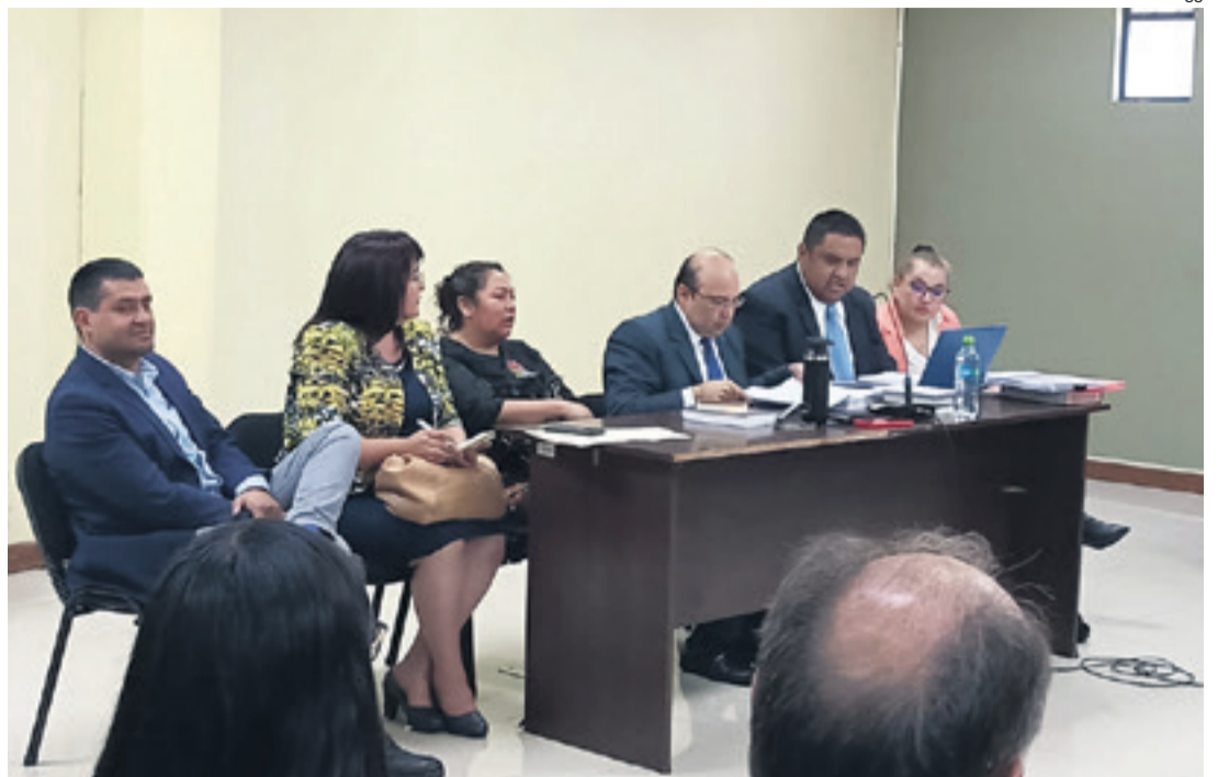
Magistrados del TCP en audiencia judicial. Human Rights también observó que su mandato culminó

Es un pequeño grano de arena que aporta esta ONG pero no va a cambiar nada, si ni siquiera cambia por informes de organismos como Naciones Unidas o de la Corte Interamericana de Justicia, que tiene mucho más rango y capacidad de actuación. Está claro que ninguna de las organizaciones políticas, ni los masistas disidentes, ni los oficialistas se atreven a llamar a las cosas directamente por su nombre. Es una tarea de la sociedad.