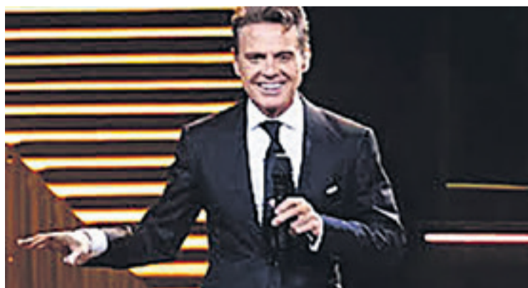
El mexicano Luis Miguel deleitará a los románticos en marzo