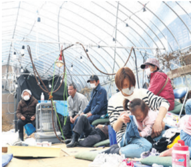
Varios albergues han sido habilitados para los damnificados

La mayoría de las casas de la ciudad de Suzu colapsaron