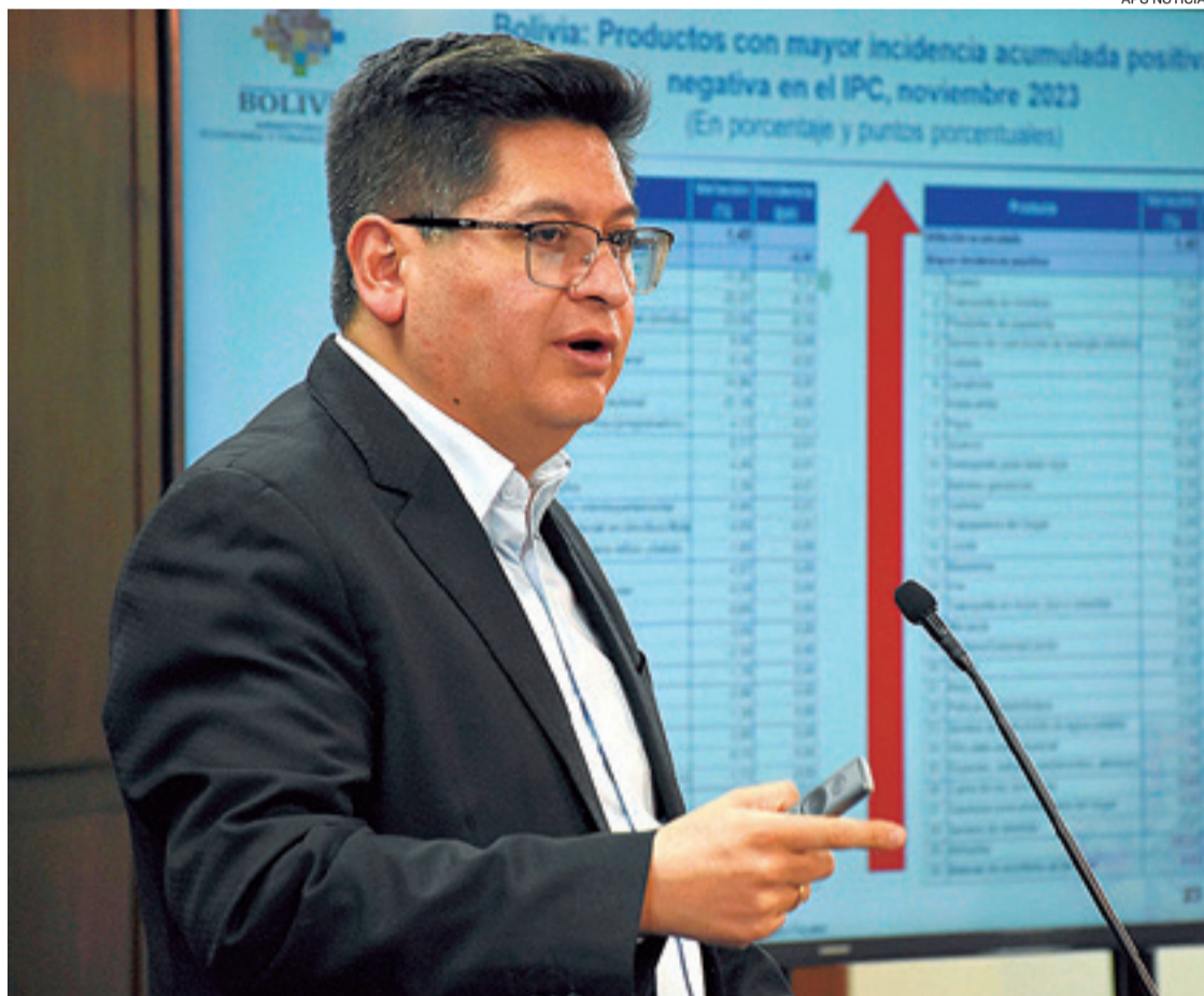
El ministro aseguró que el país creció pese a los 'sabotajes internos' y a la crisis económica global

“En términos de lo que los bancos y la provisión de dólares se ha ido, como decíamos, moderando y paulatinamente esto va en una tendencia a moderarse. Los ban-