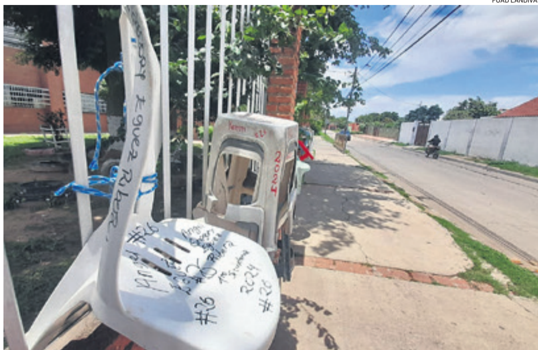
Estas sillas permanecen en las puertas de la unidad educativa El Mundo a la espera de un espacio