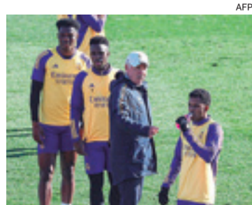
El Real Madrid es el favorito para quedarse con los puntos ante el Mallorca

El Real Madrid recibirá al Mallorca. El equipo blanco sólo ha sumado una derrota (contra el