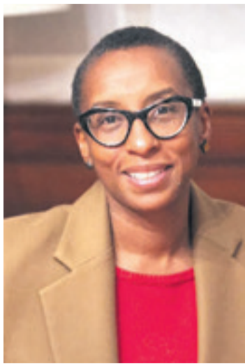
Claudine Gay renunció ayer al rectorado tras duras críticas

Pero la rectora también se vio envuelta en la polémica después de que se negó a decir de manera inequívoca si pedir el genocidio de los judíos violaba el código de conducta de Harvard, durante una audiencia ante el Congreso junto con los rectores del MIT y de la Universidad de Pensilvania. (AFP)