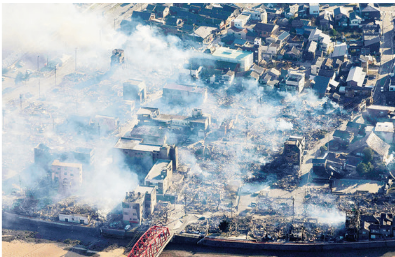
La grave devastación que fue ocasionada por el temblor que sacudió principalmente la prefectura de Ishikawa, en la península de Noto

Más de 30.000 casas están sin electricidad en la zona, que registró temperaturas gélidas durante la noche, dijo la compañía de electricidad. Muchas ciudades no tenían agua potable.