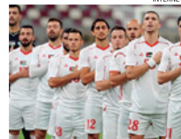
Palestina participará en la Copa de Asia bajo la sombra de la guerra en Gaza

"Todo el mundo sigue la actualidad antes y después del entrenamiento, en el bus hacia el hotel hay un sentimiento constante de ansiedad y pensamientos hacia sus