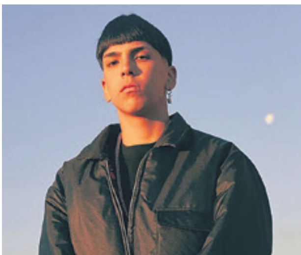
Milo J, cantante, rapero y compositor, estará en la ciudad