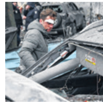
Ataques de Rusia en Kiev

La frontera entre Israel y Líbano era escenario de intercambios de disparos casi diarios entre el ejército israelí y Hezbolá desde el inicio de la guerra. Pero es la primera vez que un bombardeo alcanza los alrededores de Beirut desde el 7 de octubre.