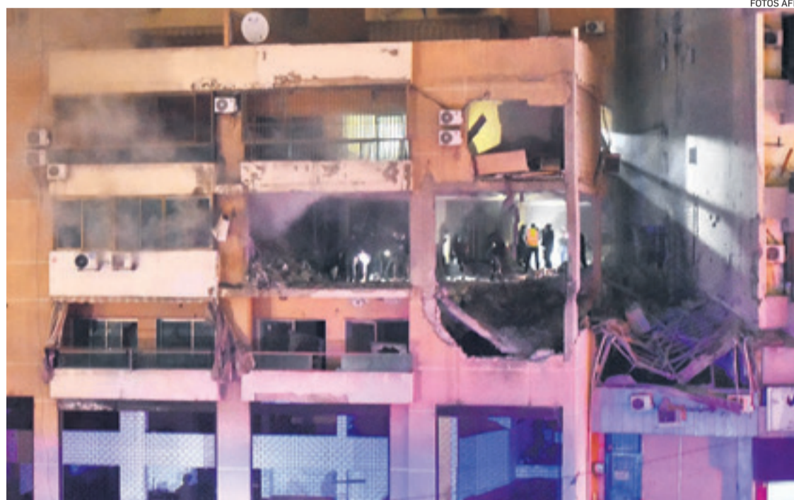
El número dos de Hamás se encontraba junto a sus guardaespaldas en este edificio cerca de Beirut

temores a una conflagración regional más de dos meses después del inicio de la guerra entre Israel y Hamás, que gobierna Gaza desde 2007.