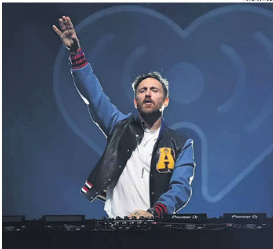
Mañana, David Guetta, regresa tras 12 años de su última presentación en el país