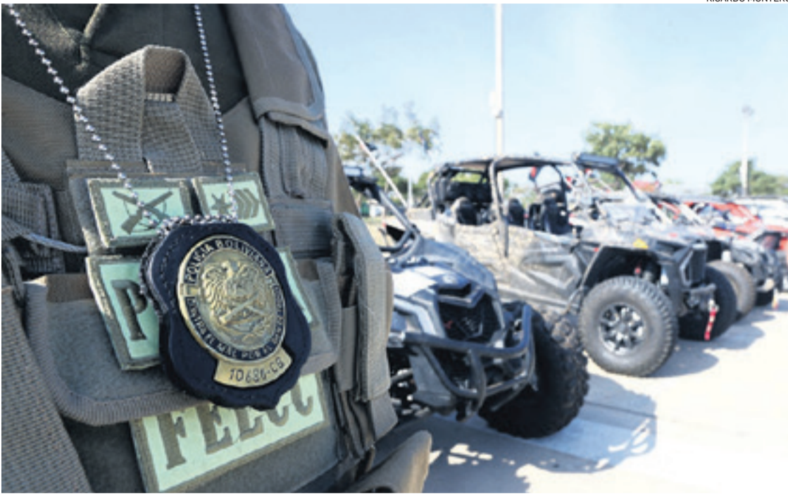
Vehículos que la Fiscalía le incautó a Misael Nallar que se encuentra detenido en Chonchocoro