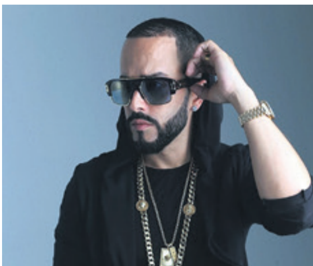
Yandel llegará para cantar en el Carnaval