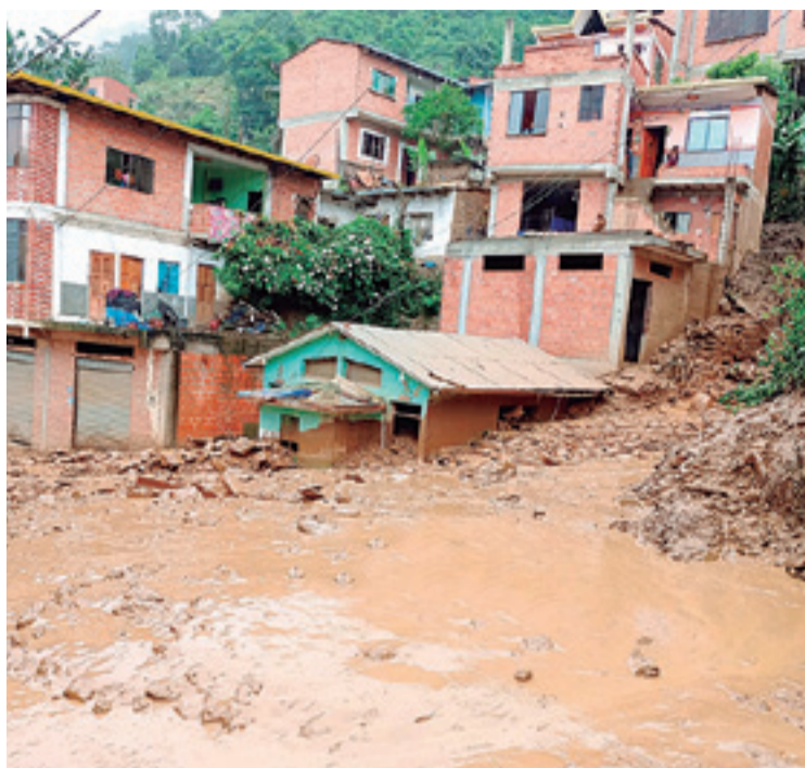
El norte y Yungas (La Paz) están sufriendo efectos de la deforestación

quebrada que causa estragos, ya sea en El Torno, La Guardia, pero que no llega a desborde”, aclaró.