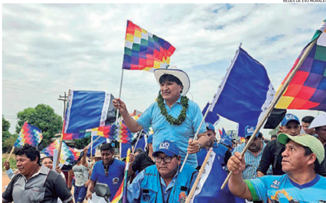
Evo Morales es cargado en hombros por sus simpatizantes en una marcha política a su favor.

Para el analista, el TCP, al emitir la última sentencia lo que hizo fue una “armonización normativa y constitucional” a partir de las normas