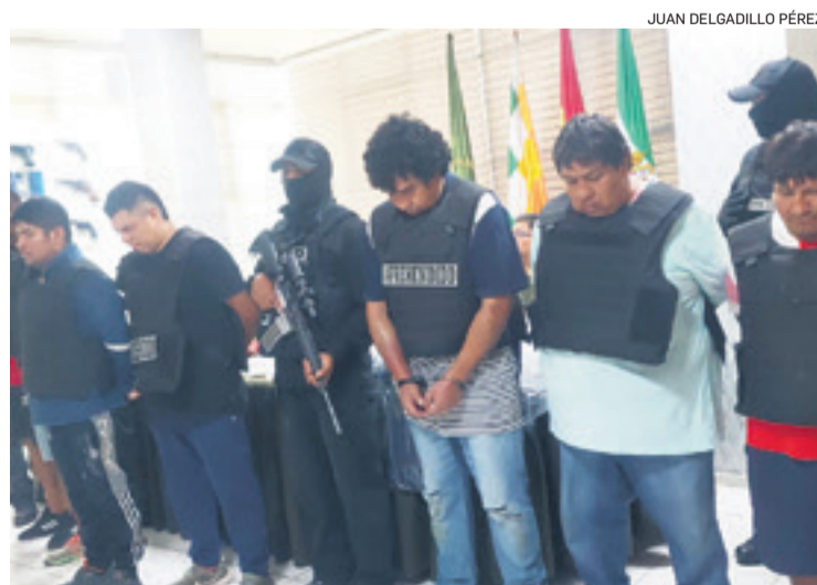
Detenidos que prepararon un atraco armado a una agencia de cerveza

El jefe policial aseguró que primero los sujetos habían planificado dar el golpe a la agencia de cerveza la noche de Navidad. Sin embargo como el mayor consumo de bebidas alcohólicas es en Año Nuevo, fue