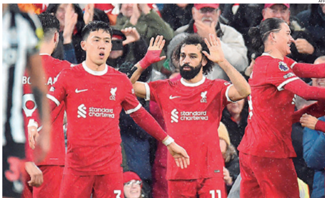
El Liverpool arrancó el año con una victoria ante el Newcastle y conserva su condición de líder en la Premier League