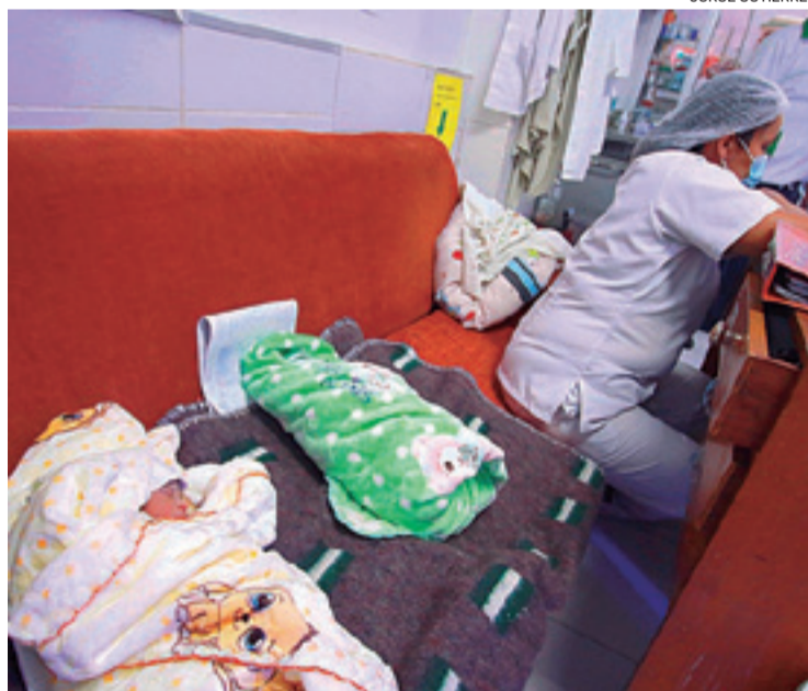
En la Maternidad los bebés duermen en sofás por falta de espacio