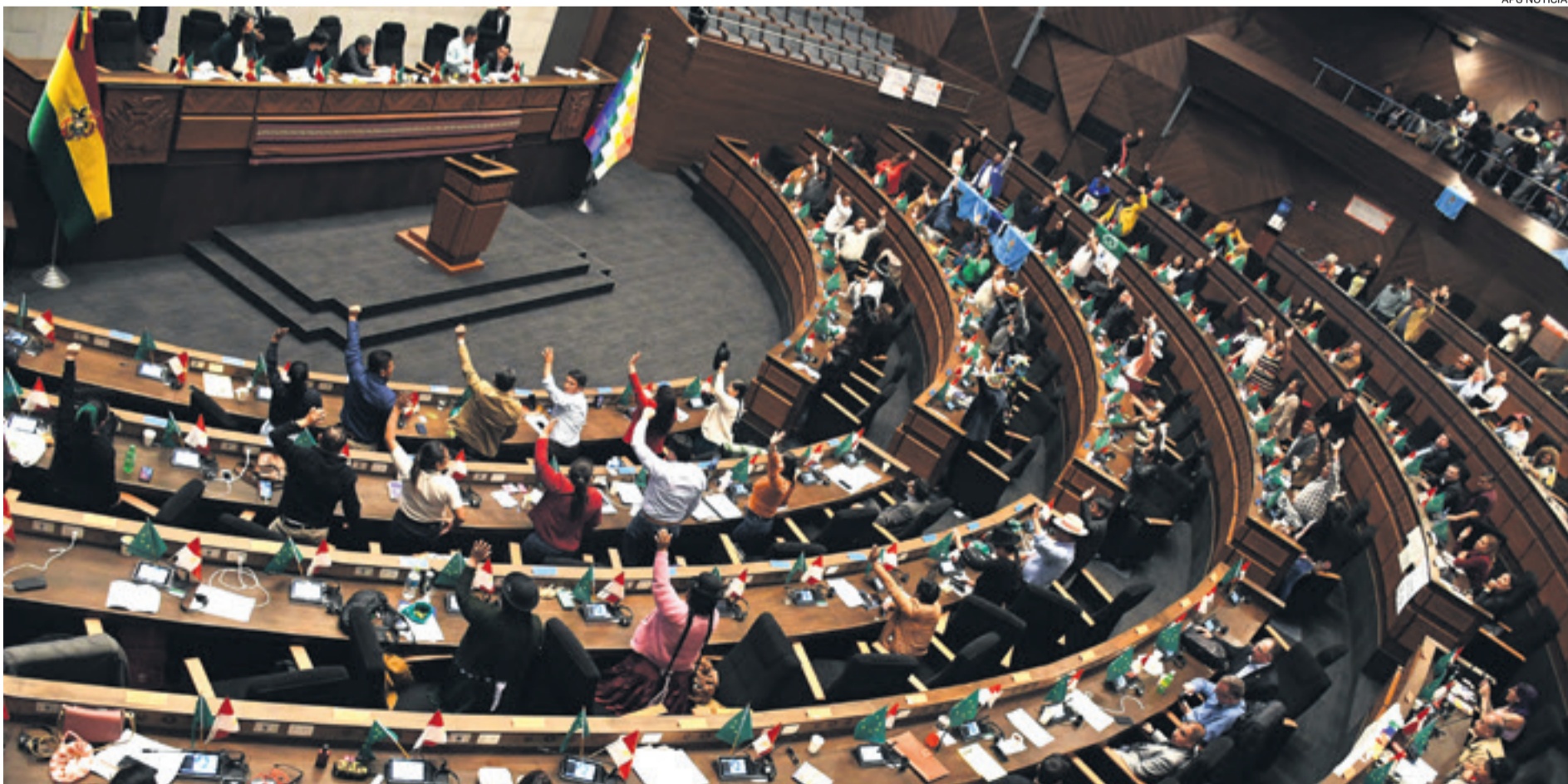
El voto en la Asamblea Legislativa Plurinacional se ha devaluado. Por la pugna en el MAS, Al menos dos de las decisiones que allí se han tomado fueron revertidas por decisiones judiciales.

Pero, el senador Tórriz fue categórico: "Claro que tiene que haber elecciones judiciales en 2024 y no es porque lo deseemos, sino por-