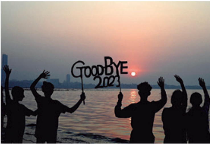
La despedida del año 2023 y la llegada del 2024 en India