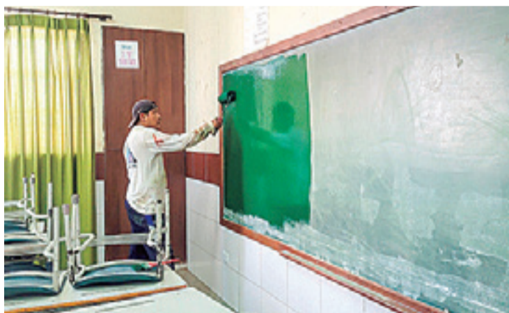
Los trabajos que se realizan en el interior de las aulas