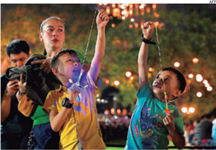
En Filipinas también celebraron la llegada del año nuevo 2024