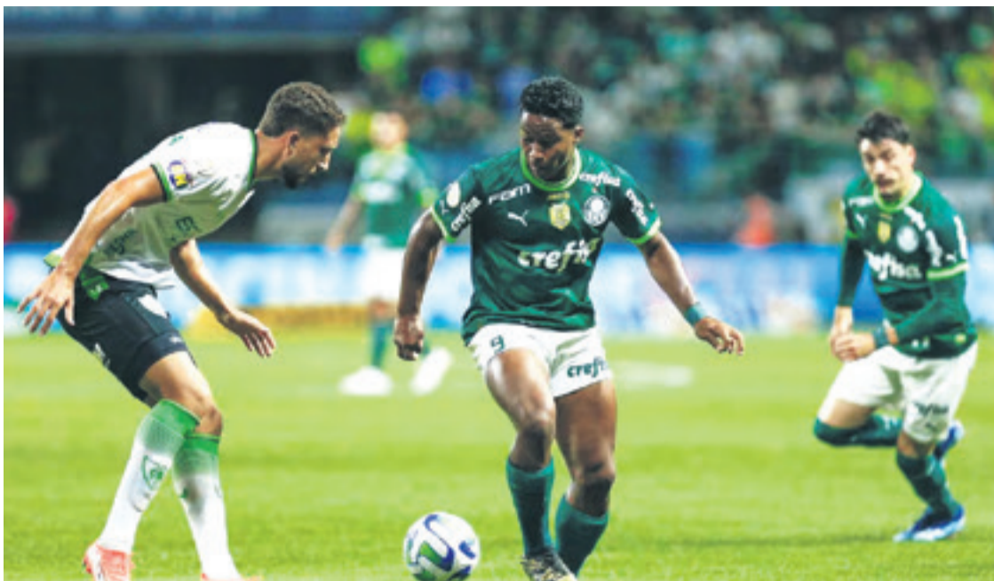
El fútbol brasileño se encuentra en problemas y con riesgo con ser suspendido por la FIFA de competencias internacionales