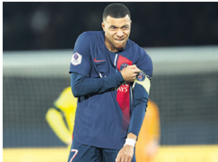
Kylian Mbappé tiene la libertad para elegir el club donde quiera seguir su carrera

Pero la tensión ha disminuido y la calma ha vuelto después del pulso que mantuvo con el PSG, durante el que el club, furioso ante la posibilidad de ni siquiera poder obtener el beneficio económico de un traspaso del jugador, valorado en 180 millones de euros (199 millones de dóla-