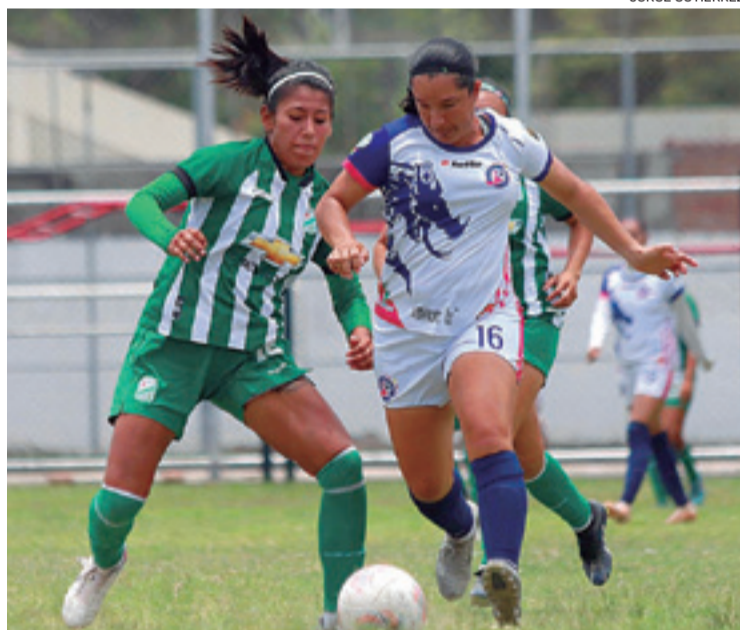
El fútbol femenino aún no tiene el reconocimiento esperado