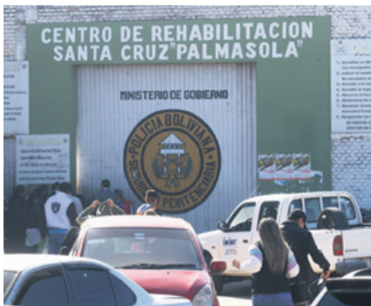
En todo el país hay 615 privados de libertad por casos de feminicidio.

Cada cuatro días muere una mujer producto de un feminicidio.