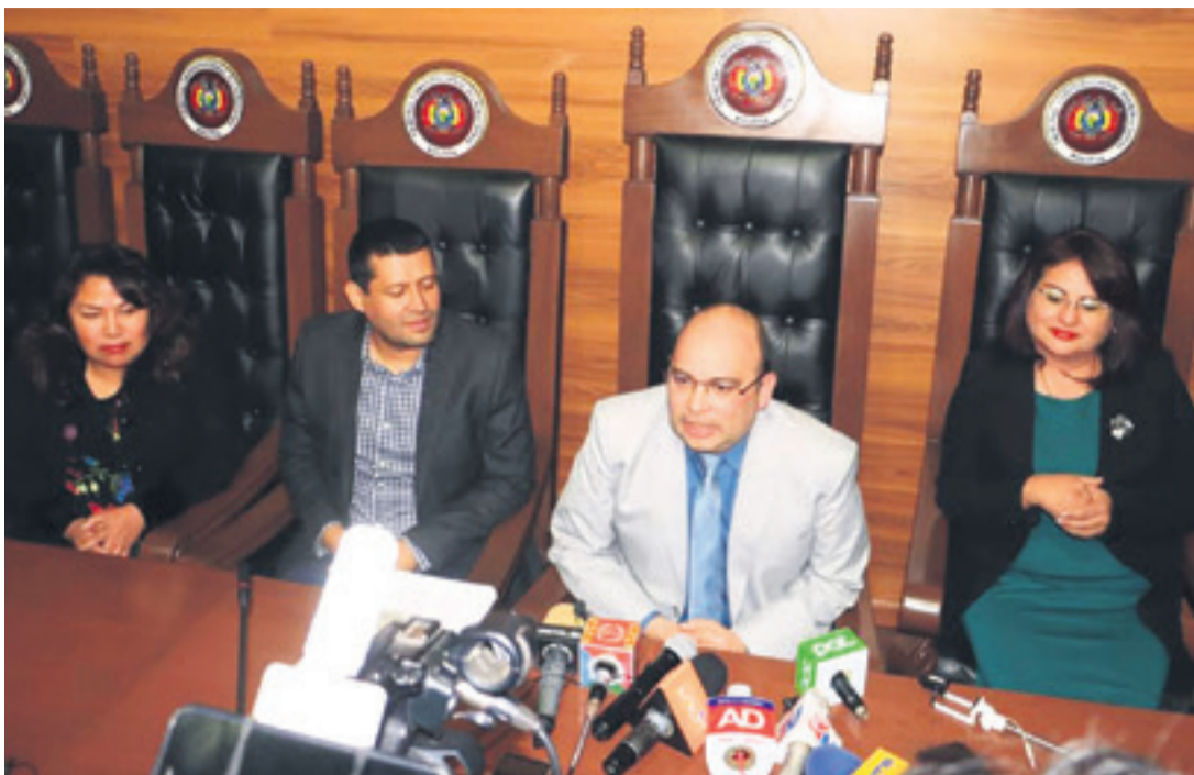
Los integrantes del TCP emitieron una resolución. Un jurista independiente asegura que es irreversible.

¿Garantiza que se llevarán adelante las elecciones judiciales?, se le preguntó. “Se realizarán en la medida en que tengamos una clase política que lea la CPE y podamos cumplir así los requerimientos que están ahí escritos”. ¿El arcismo buscará diálogo?, y respondió que más que eso “considero que debemos buscar razones jurídicas que no colisionen con la norma suprema”. No dio certeza de que haya elecciones.