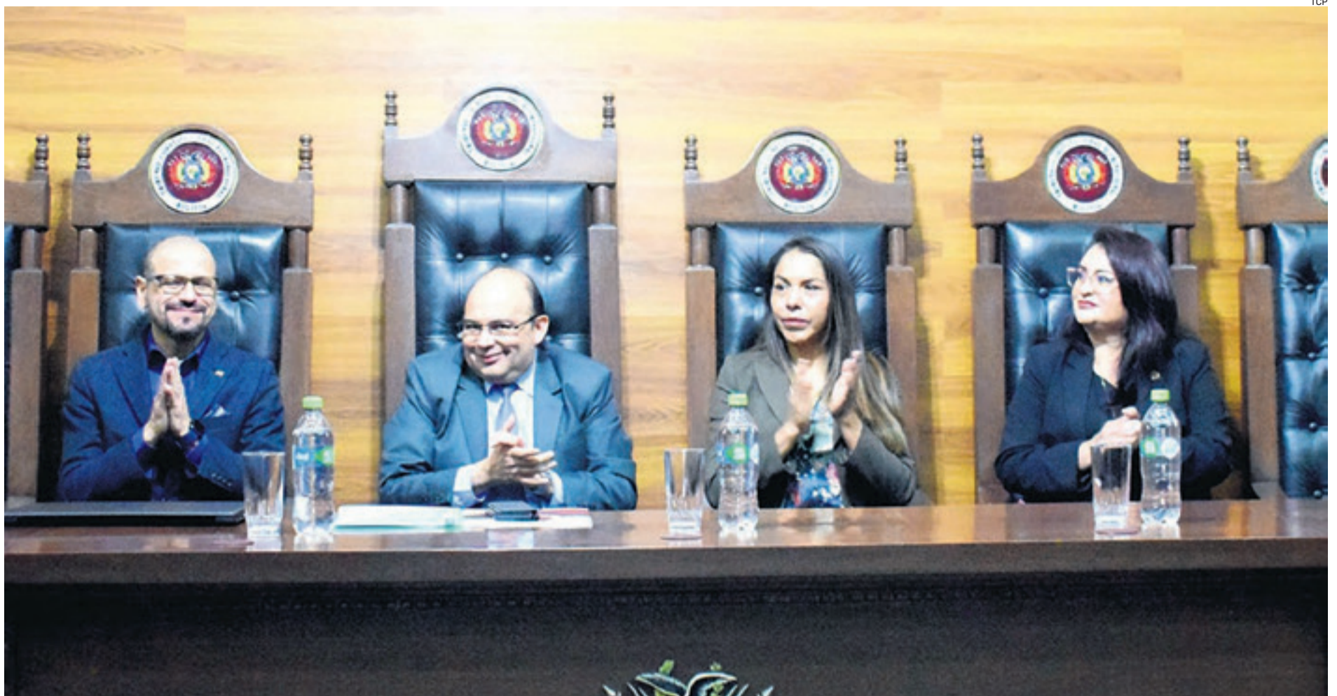
Magistrados del Tribunal Constitucional que aprobaron las sentencias constitucionales 0084/2017 y 1010/2023