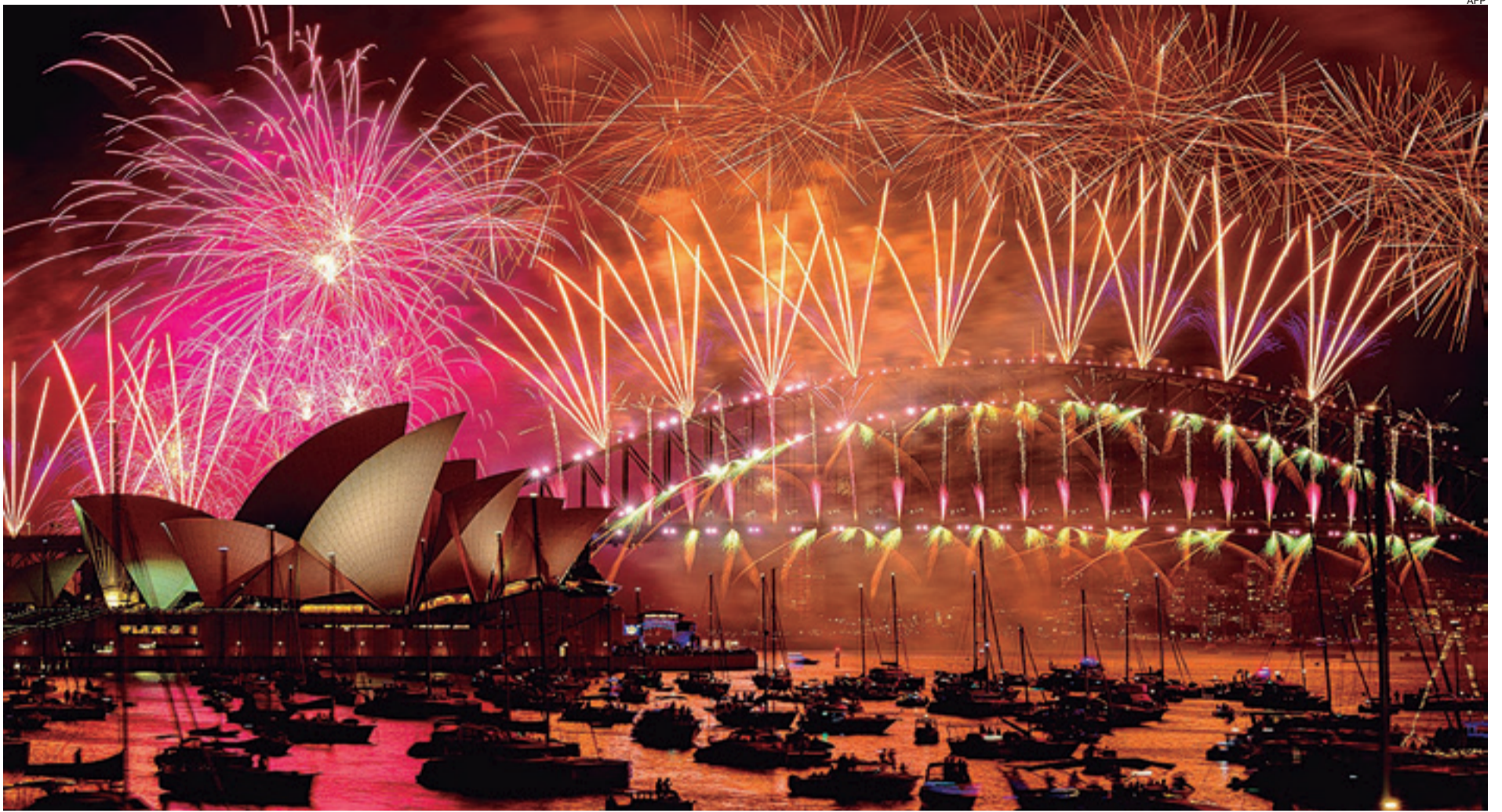
Más de un millón de personas abarrotaron el puerto de Sídney para admirar el espectáculo de inicio del Año Nuevo con más de ocho toneladas de fuegos pirotécnicos