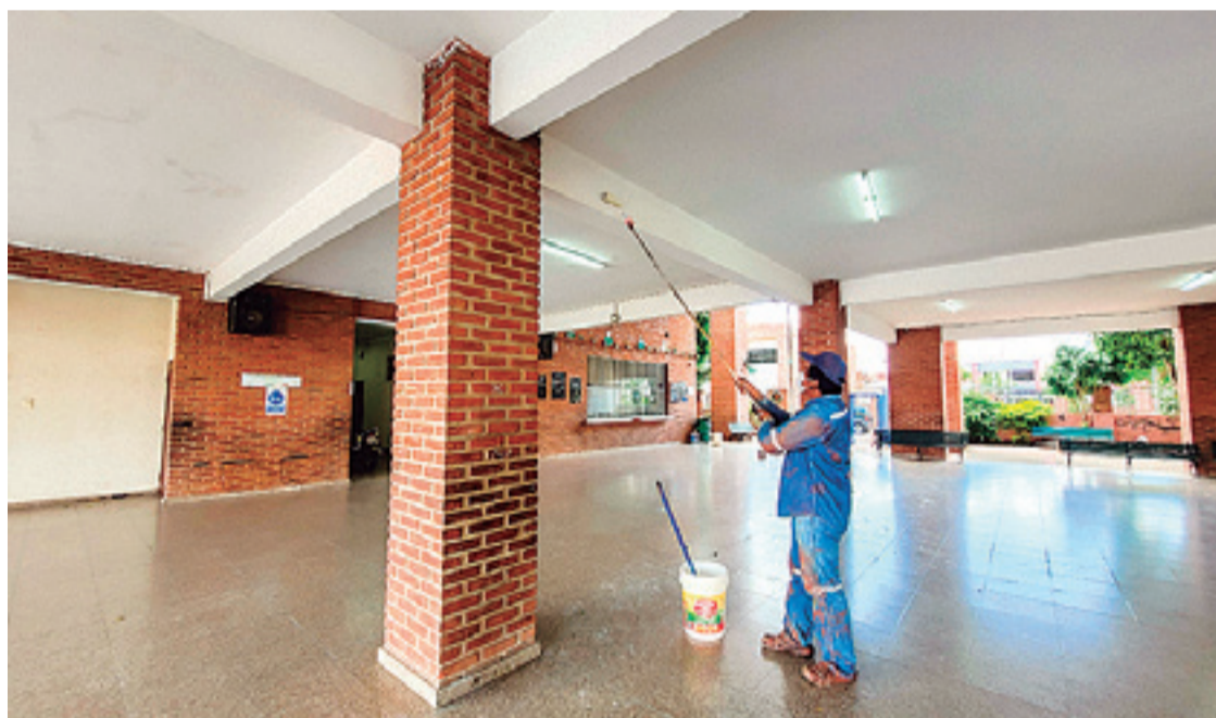
Pintan y acomodan los ambientes para evitar más deterioro y filtraciones en la temporada de agua