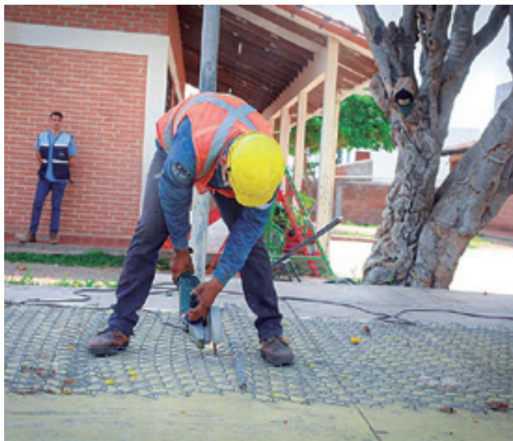
Las empresas comenzaron a trabajar desde el 18 de diciembre

La autoridad advirtió que no están permitidos los cobros o pagos de cuotas anticipadas de la pensión escolar. Pidió a los papás que ante cualquier irregularidad acudan a presentar denuncias a