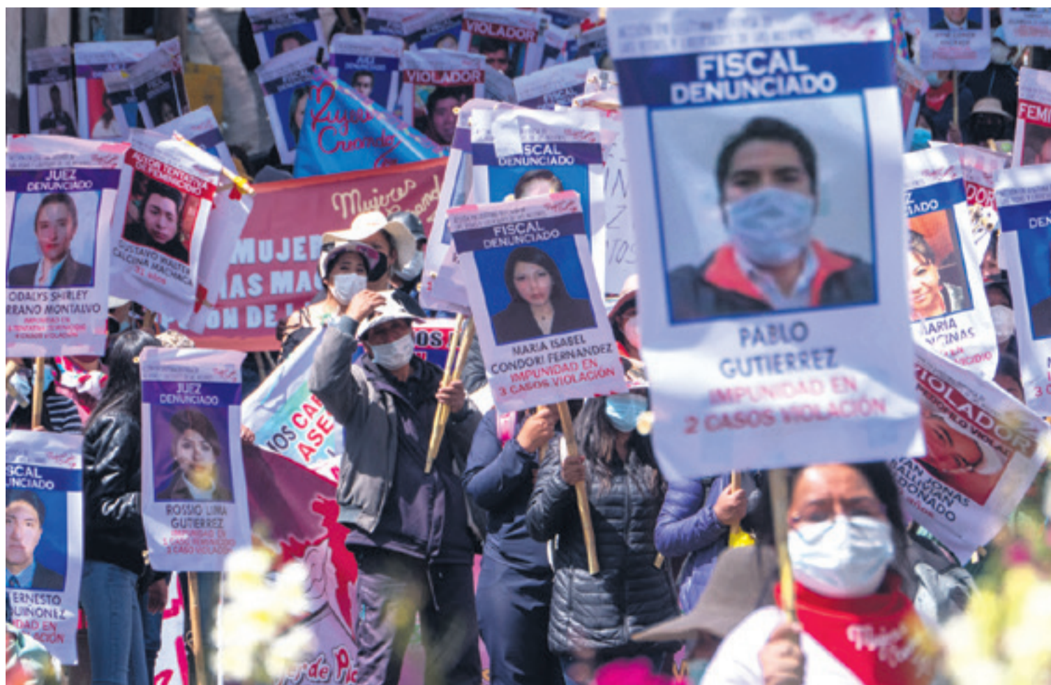
Los movimientos ciudadanos y colectivos exigen más atención del Estado para evitar casos de violación, feminicidios y violencia a la niñez.

de menores edad y 467 declaraciones de rebeldía.