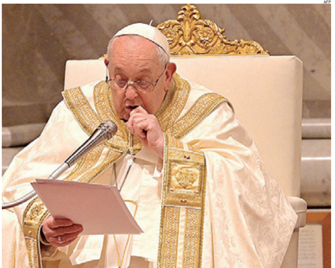
El sumo pontífice dirigió su mensaje de fin de año desde la ventana del Palacio Apostólico

El destino de más de 4.000 millones de personas se decidirán este año en votaciones en Rusia, el Reino Unido, la Unión Europea, India, México, Indonesia, Sudáfrica, Venezuela y Estados Unidos