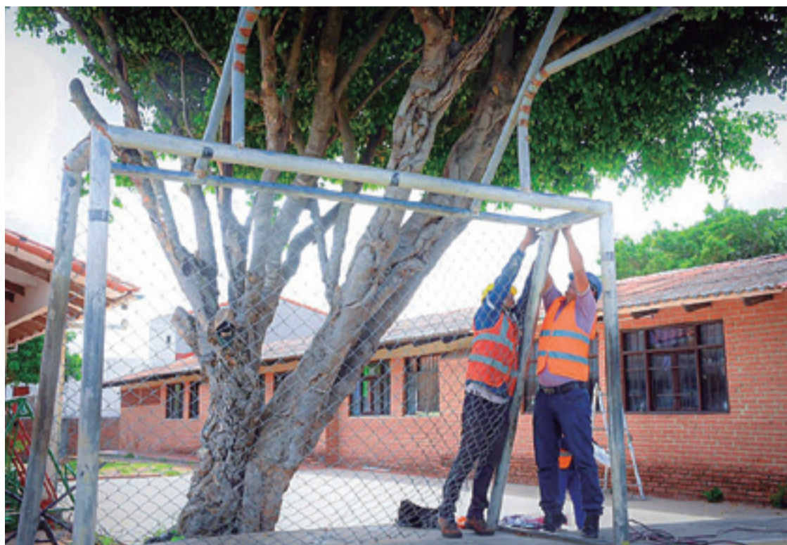
También ponen en buen estado los campos deportivos que son muy utilizados por los escolares

Un obrero trabaja en la refacción de un centro educativo de la capital cruceña para preparar el retorno de los estudiantes