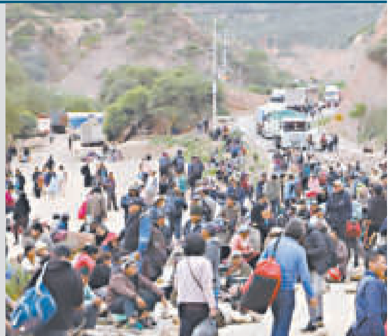
Los bloqueos atentan contra el desarrollo del país.

“En términos de factibilidad económica, vemos que la actividad económica es menor. Empezar el año con esta ralentización de la economía no es