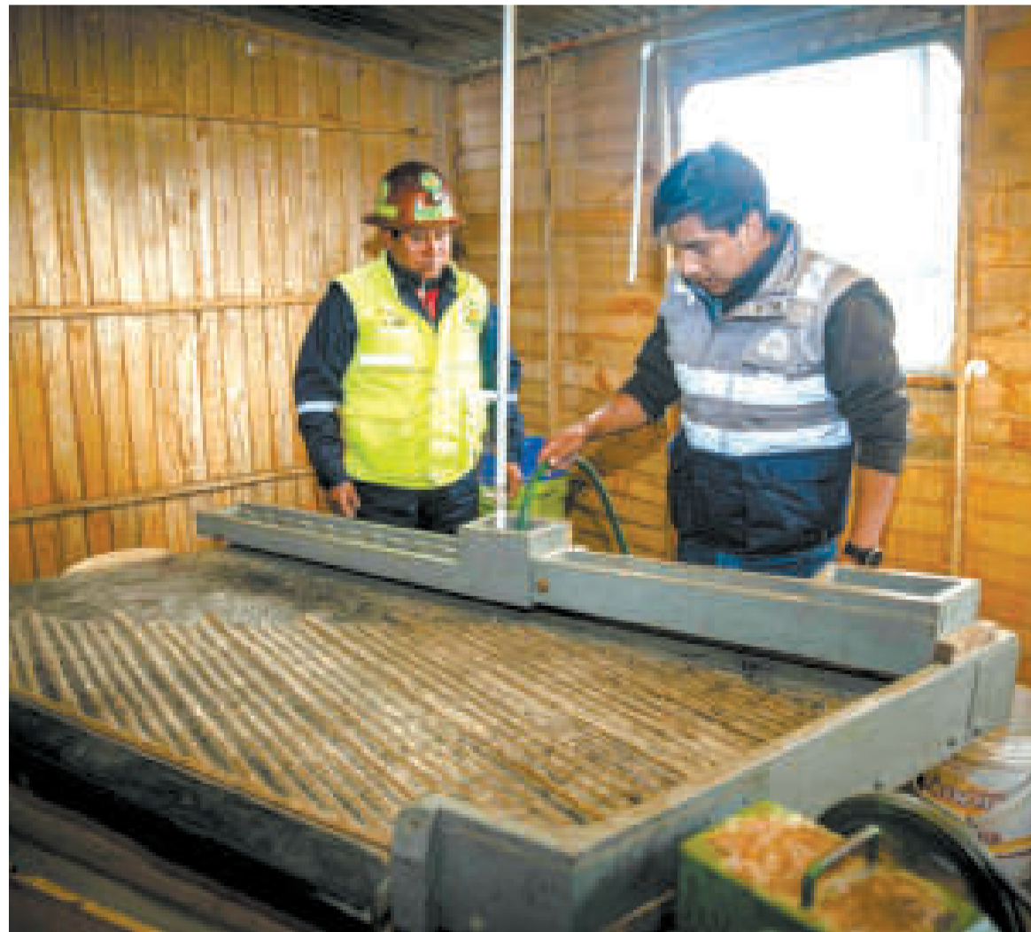
En la cuenca alta del río Suches, en el interior del área protegida Área Natural de Manejo Integrado Nacional (Anmin) Apolobamba, las cooperativas experimentaron en 2022 tecnologías limpias con la instalación y puesta en marcha de equipos de concentración gravimétrica de oro.