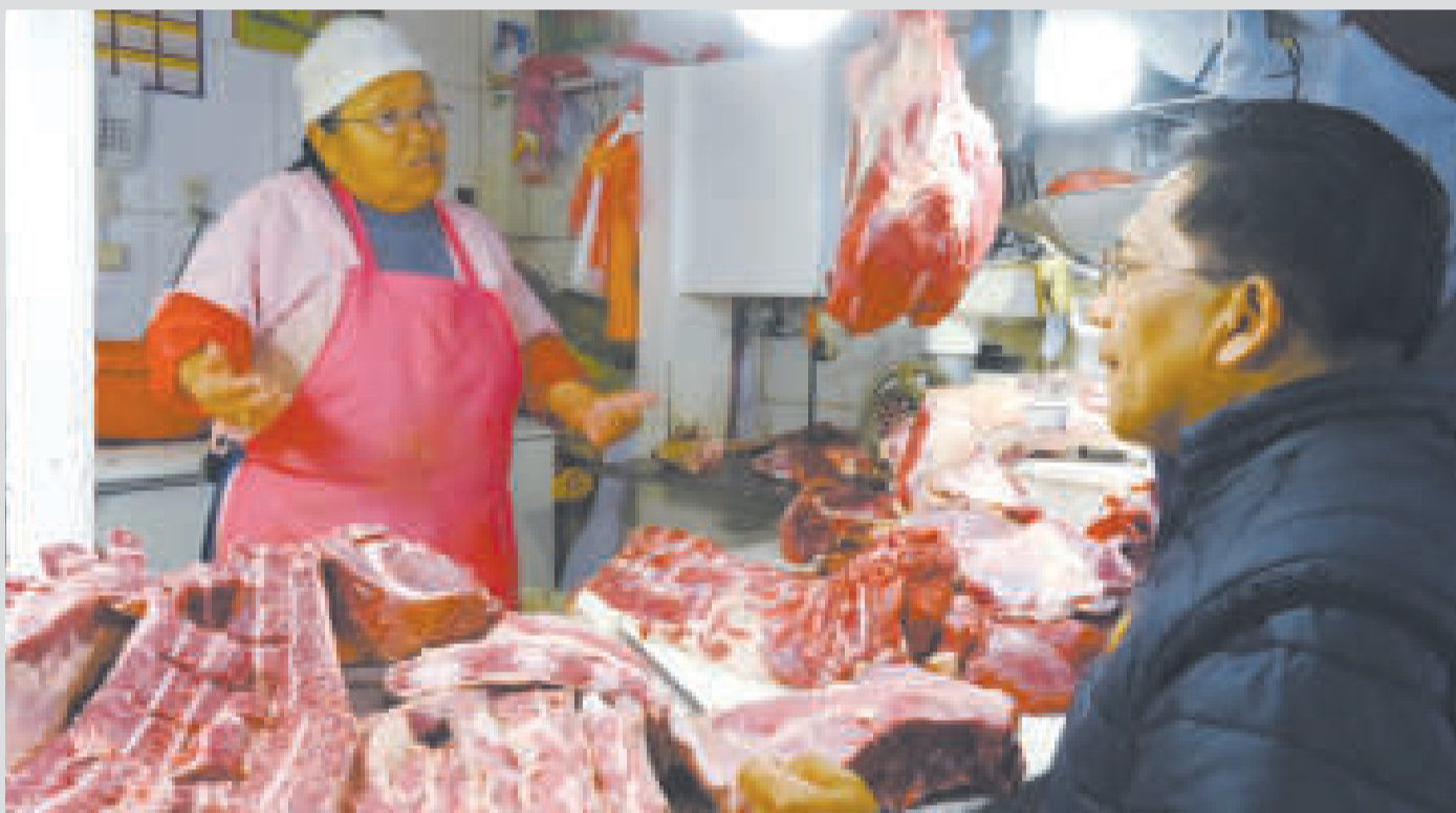
El viceministro Silva durante un operativo de control en un mercado de La Paz.

garantizar el abastecimiento de todos los productos en los mercados del país.