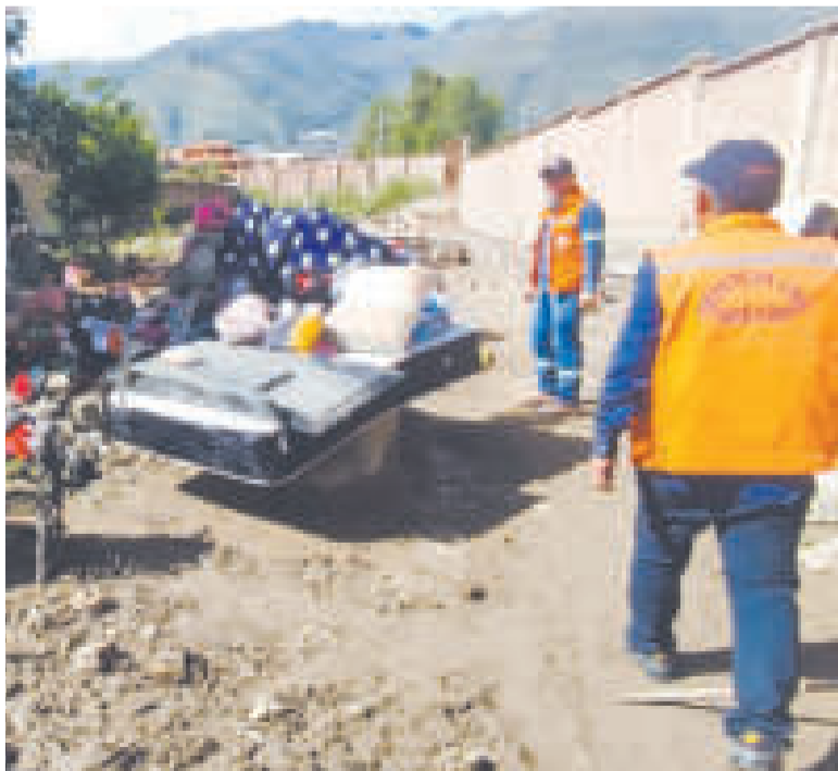
Trabajos en Tiquipaya.