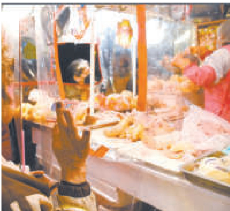
El viceministro Lacoa afirmó que el pollo no debe sobrepasar los Bs 16 el kilo.