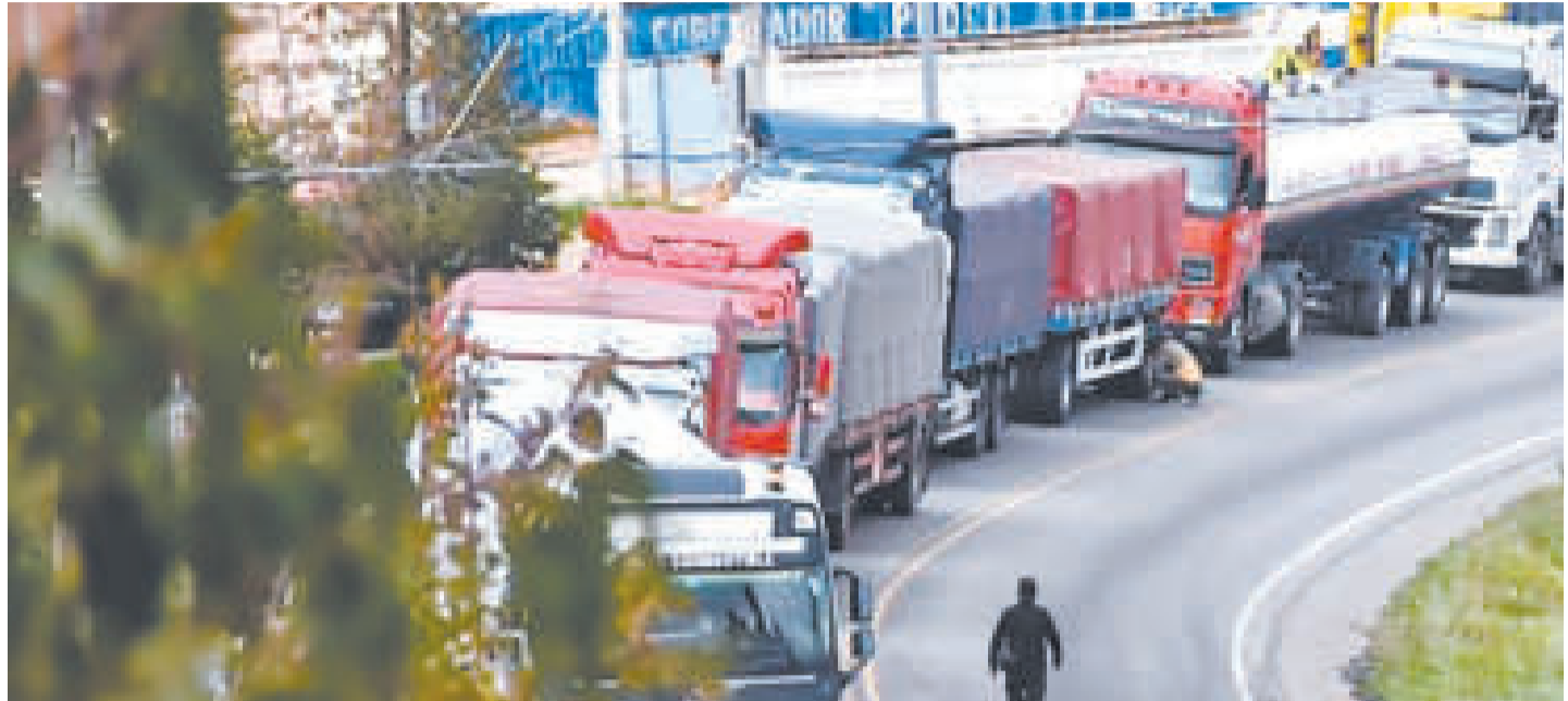
El bloqueo de caminos perjudica al transporte.

Organizaciones de Pando y la Federación Sindical de Comunidades Interculturales de Productores Agropecuarios Yapacaní emitieron una resolución en la que conminan a los diputados y senadores a asistir a la reunión convocada por el presidente nato de la Asamblea, David Choquehuanca, y encaminar las elecciones judiciales. Además advierten de que en estas localidades no permitirán bloqueos de los grupos ligados a Evo Morales.