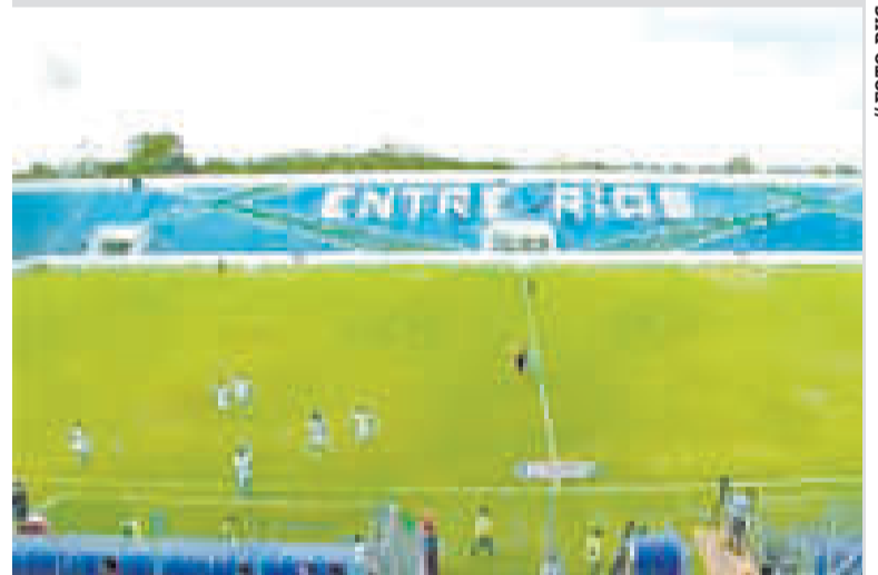
El estadio Carlos Villegas de Entre Ríos recibirá partidos del fútbol profesional.