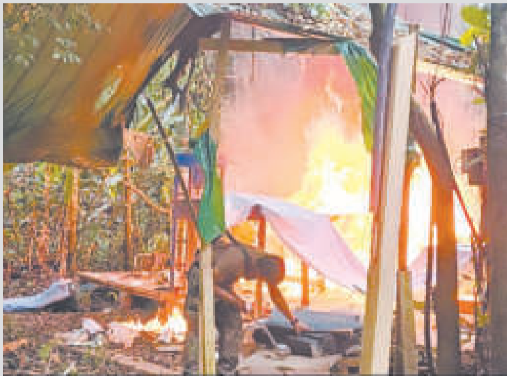
El laboratorio fue destruido por efectivos de la Fuerza Especial de Lucha Contra el Narcotráfico.

10 MILÍMETROS DE LLUVIA afectaron al municipio Cochabambino la noche del jueves 25 de enero.