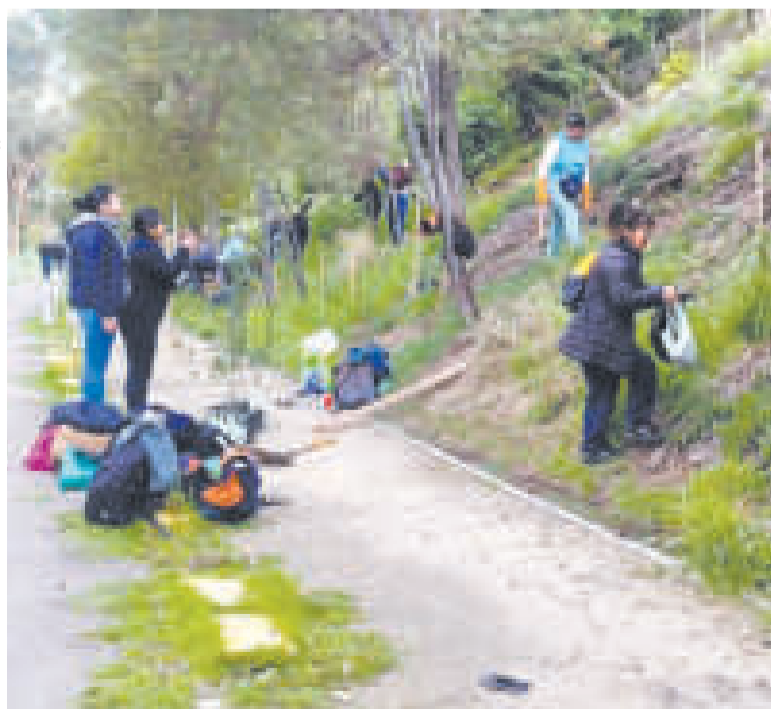
Trabajo de reforestación en el Parque Urbano Central de La Paz.