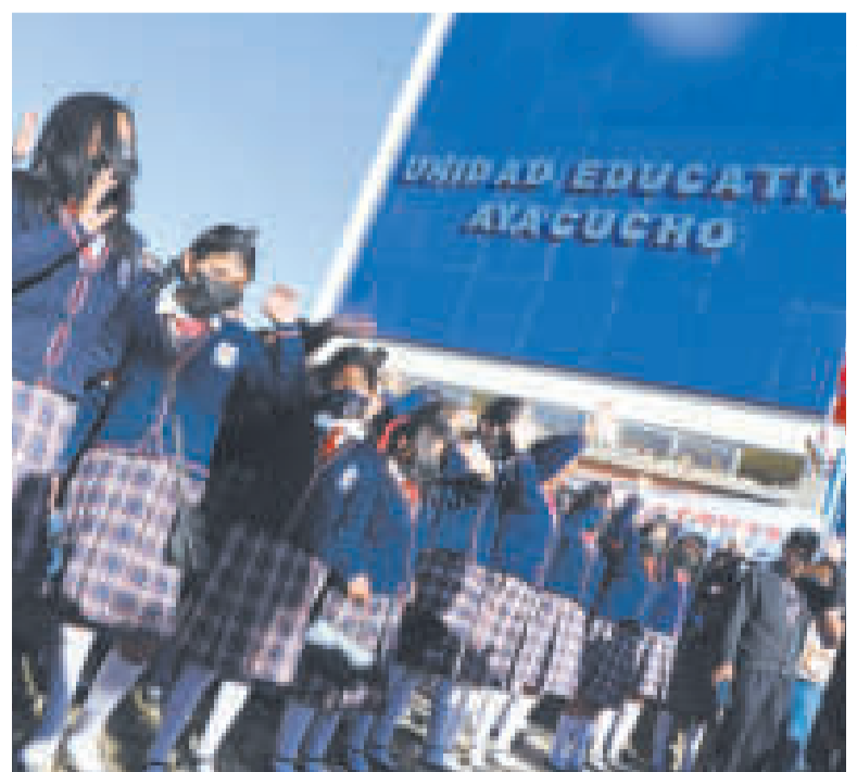
La unidad educativa Ayacucho lista para recibir en febrero a los estudiantes.

MILLONES DE BOLIVIANOS se invirtieron para las infraestructuras educativas y el enlosetado.