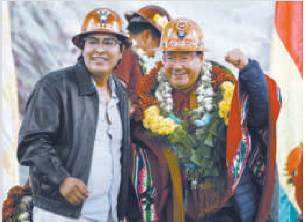
El presidente Luis Arce en el acto organizado para celebrar un año más de la EMV.