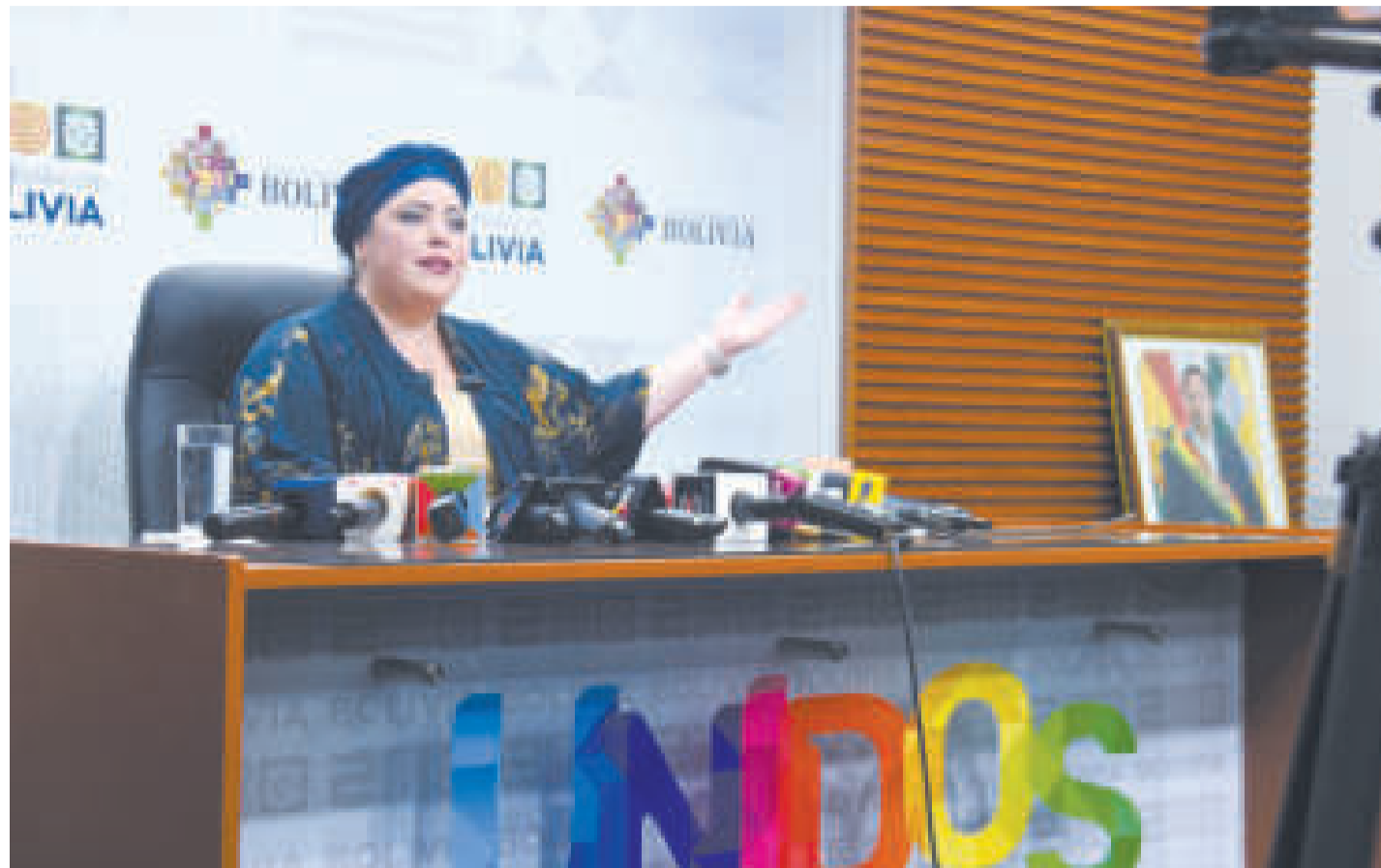
María Nela Prada, ministra de la Presidencia.

Prada lamentó que a pesar de lo que pasó en 2019 ahora