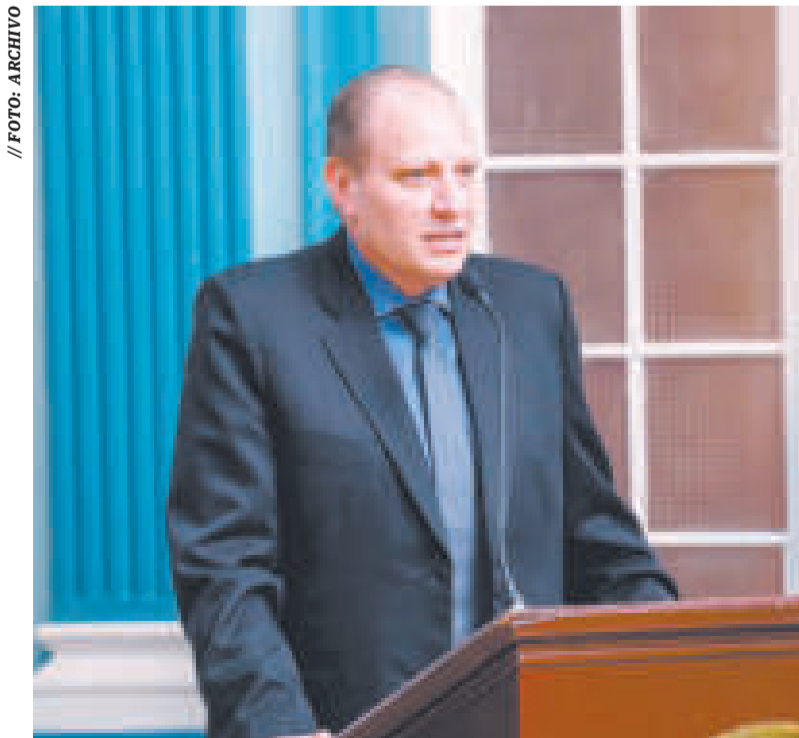
Benjamín Blanco, viceministro de Comercio Exterior.

Entre los temas centrales que se abordan en este mecanismo está la facilitación del comercio y el acceso a mercados, transporte, cooperación educativa y cooperación científica.