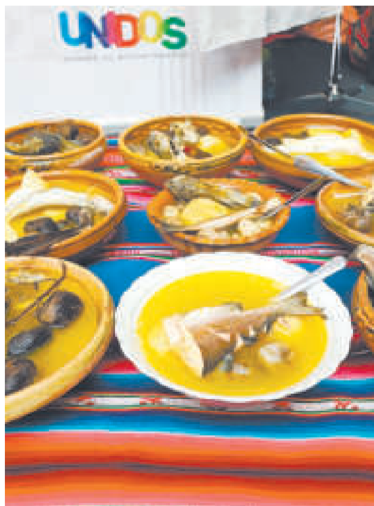
La variedad gastronómica es un atractivo de Tiquina.