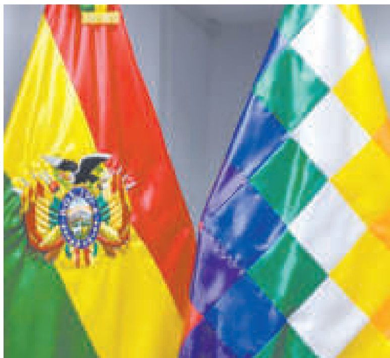
El 22 de enero, Bolivia conmemora la fundación del Estado Plurinacional.

Esta transformación permitió que Bolivia se constituya en un Estado libre, independiente, soberano, democrático, intercultural, descentralizado y con autonomías.