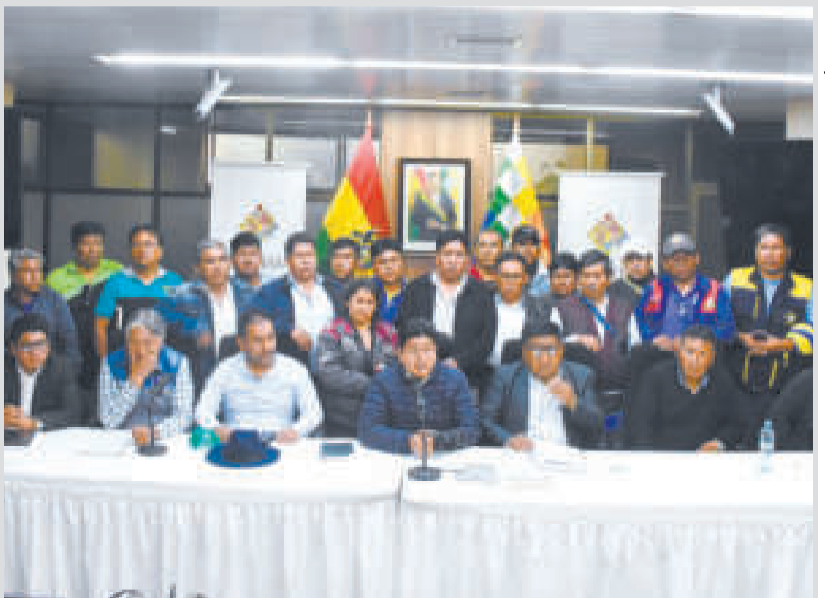
La conferencia de prensa luego de la reunión entre el Gobierno y el transporte de los Yungas, ayer.

También se abordó el tema de los trabajos de enlosetado en el tramo Santa Bárbara-Caranavi; el estado de la ruta Ramiro Castillo, que nace en la ciudad de La Paz, y que cuenta con un proyecto del municipio de Palca para su rehabilitación. La ABC recibió el proyecto y luego de corregir las observaciones procederá a buscar financiamiento para la obra, se informó.