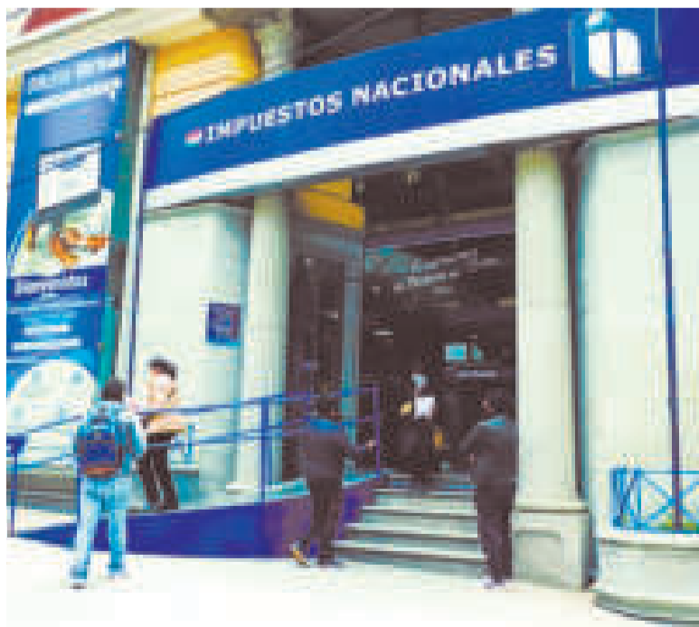
Impuestos Nacionales devolverá el IVA hasta la siguiente semana.