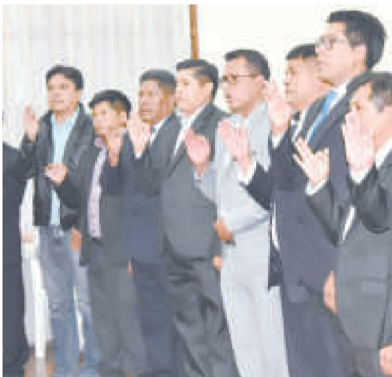
Directores departamentales posesionados recientemente.

Pary recordó que las inscripciones en unidades educativas de todo el país comienzan el 15 de enero y el inicio de clases es el 5 de febrero. “Las inscripciones iniciamos el 15 de enero, pero solo para estudiantes nuevos, para las niñas y niños de Educación Inicial, y para los estudiantes del primer curso de Educación Primaria y de Educación Secundaria. Por lo tanto, no debería haber filas de ninguna naturaleza”, recomendó la autoridad.