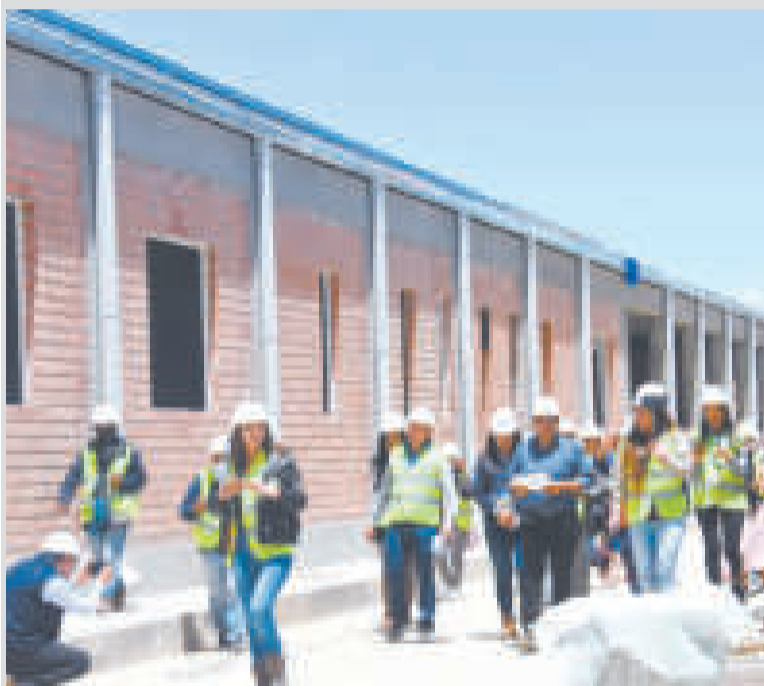
Los equipos de la nueva planta ya se encuentran listos para su implementación.