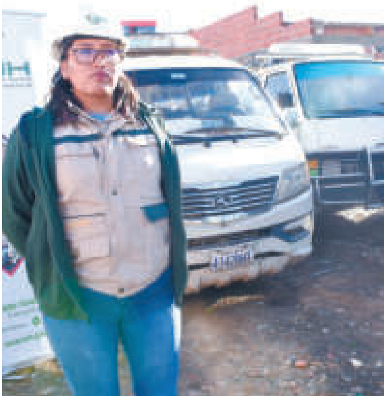
Los motorizados incautados por el carguío inusual de carburantes.