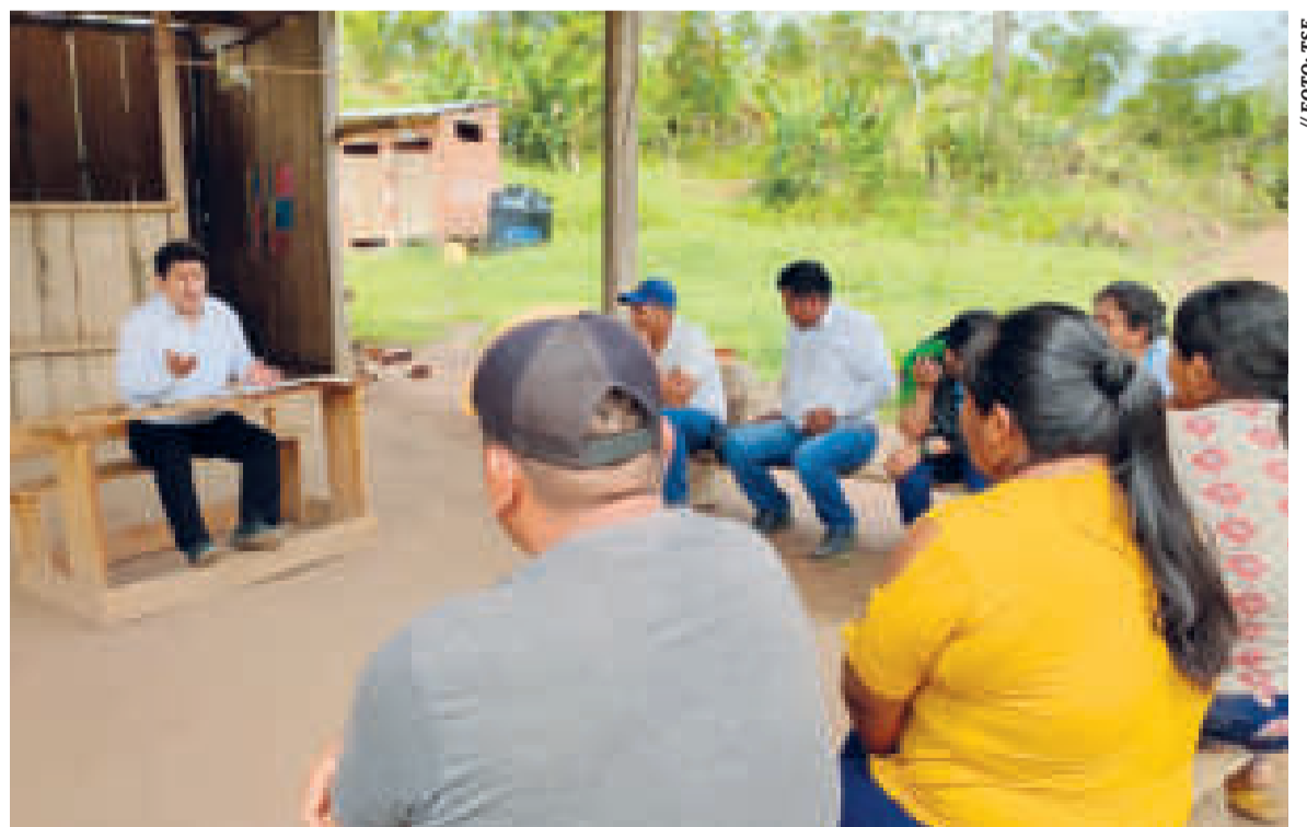
El TED La Paz explica los alcances de la creación de un asiento electoral.

En tanto, el recinto electoral es donde se instalan una o varias mesas para que los ciudadanos voten en elecciones; por ejemplo, pueden ser colegios, escuelas, sedes vecinales.