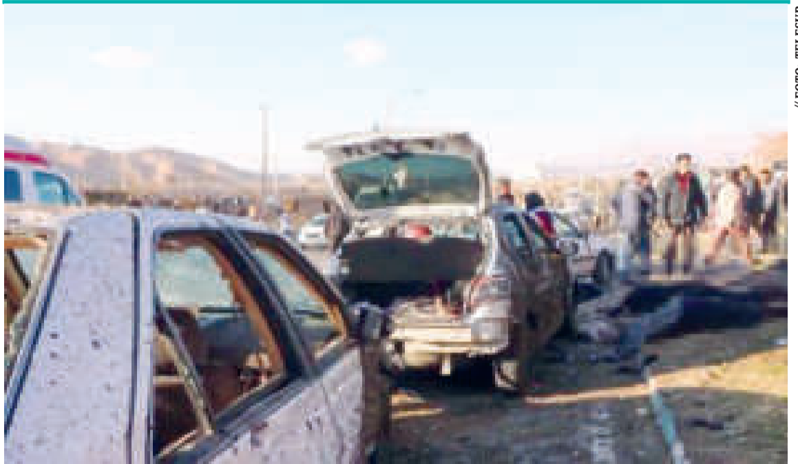
Arremetida terrorista en la ciudad de Kerman, hace tres días.