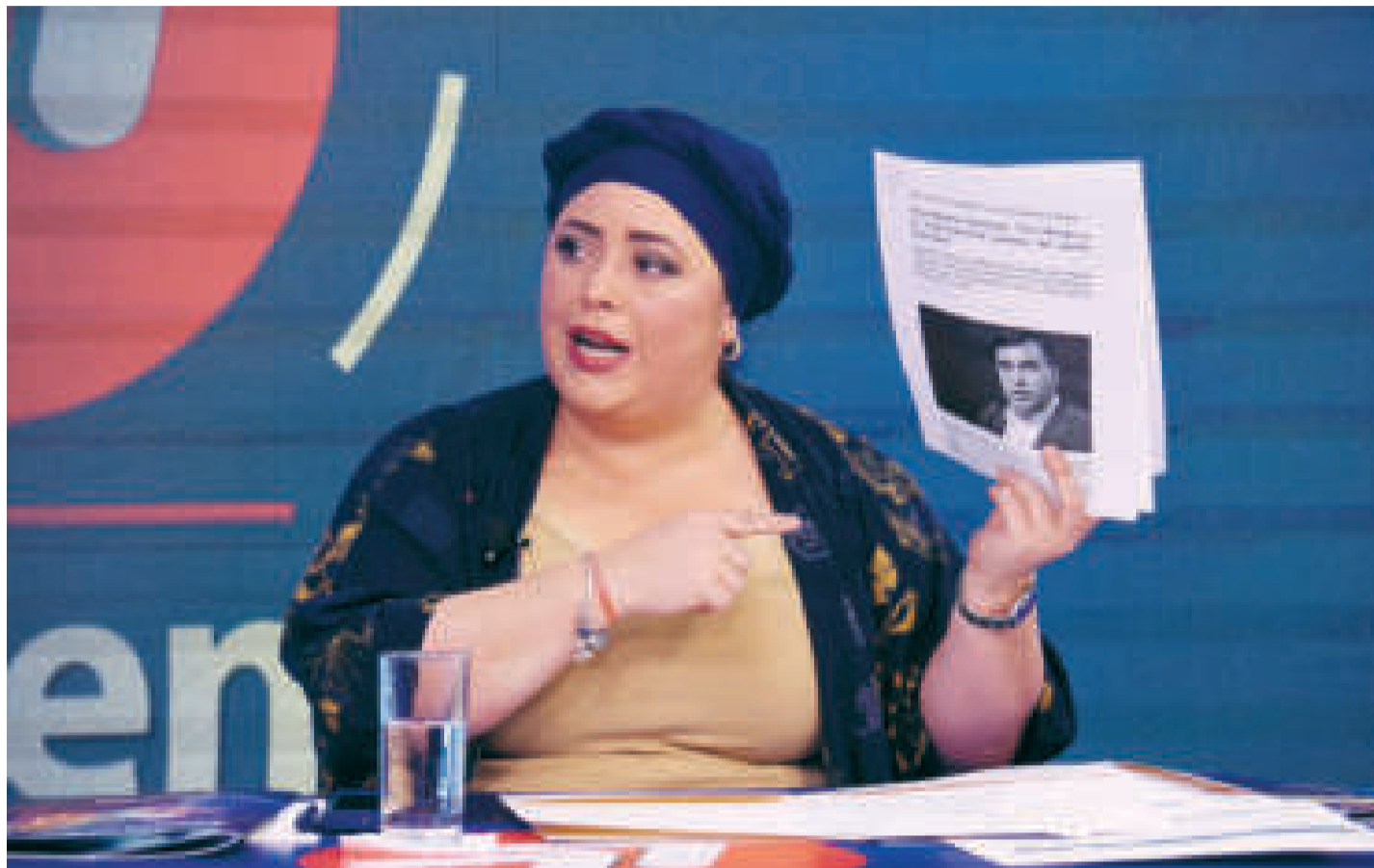
La titular de Presidencia en la estatal Bolivia TV.

La autoridad precisó que el Ejecutivo ha “soportado” los ataques sin fundamentos ni pruebas, como lo dijo el Primer Mandatario un día antes para cuidar la unidad del movimiento popular y garantizar la continuidad del Proceso de Cambio.