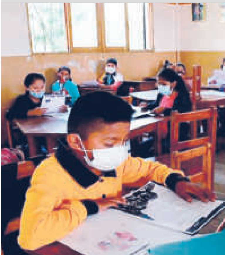
El 5 de febrero comenzarán las clases en todo el país.