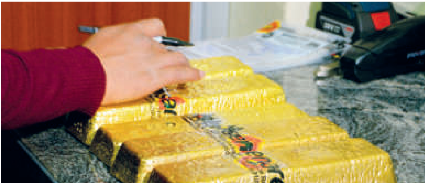
Lingotes de oro.