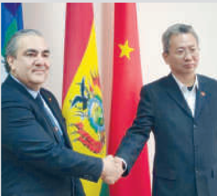
El embajador Hugo Siles con un diplomático chino.