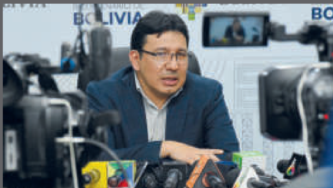
El ministro de Hidrocarburos y Energía, Franklin Molina.

“La biotecnología que se produzca tiene que ser soberana, con patente propia”.