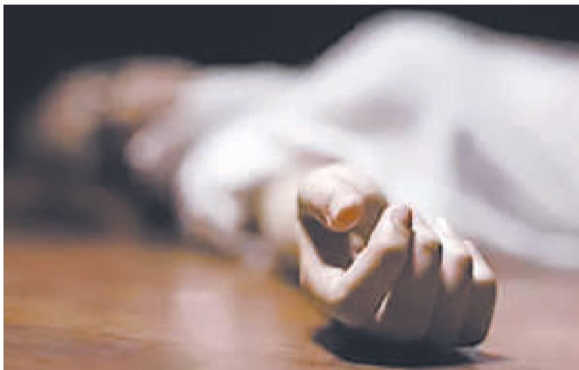
El feminicidio es el asesinato de una mujer, cometido por una persona que se siente superior a ella.

El artículo 252 bis del Código Penal de Bolivia señala, en relación al tema del feminicidio, que se sancionará con la pena de 30 años de presidio sin derecho a indulto a quien mate a una mujer siendo cónyuge o conviviente, sea pareja y otros.