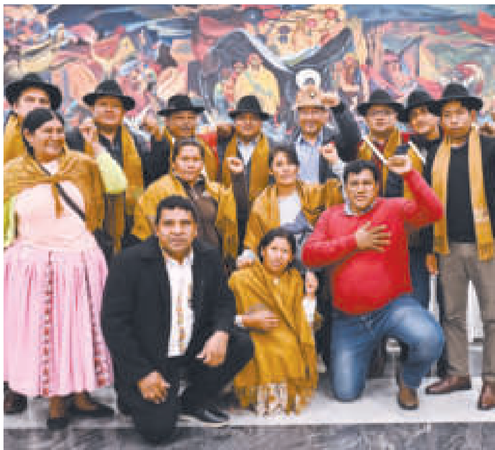
Apoyo de la Confederación de Interculturales de Bolivia.