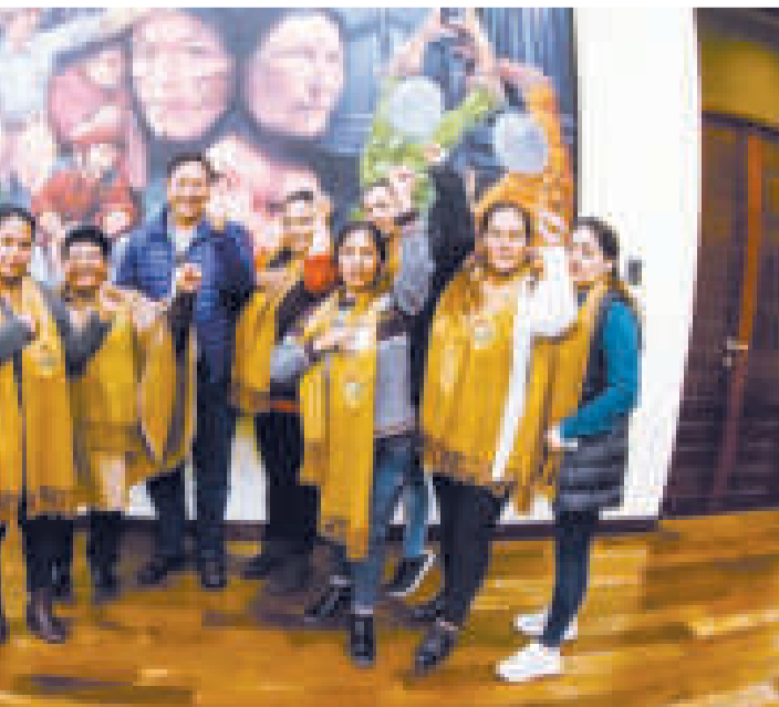
El respaldo de mujeres al presidente Luis Arce.

El presidente Luis Arce, a través de sus redes sociales, agradeció el apoyo constante que recibe de las organizaciones sociales del país, a quienes comprometió “seguir trabajando para fortalecer el desarrollo social, productivo de Bolivia”, además de mejorar la economía de “todos los bolivianos”.