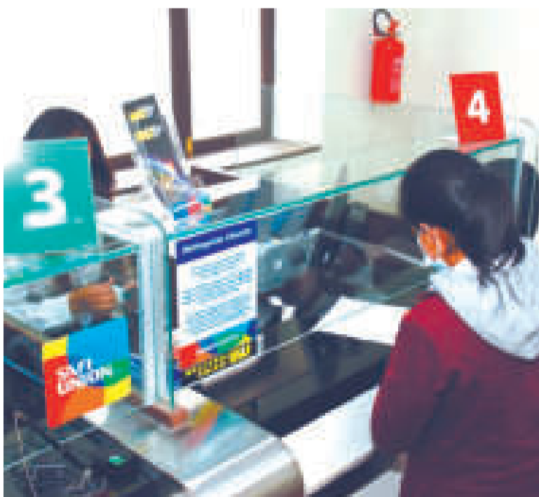
Se registró un importante incremento en la cantidad de establecimientos financieros.