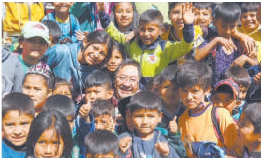
El presidente Arce rodeado de varios niños.

muestra de cariño de nuestra población encontramos la fortaleza para continuar trabajando por esa Bolivia industrializada que vamos a dejar a nuestras hijas e hijos, nietas y nietos”, dijo.