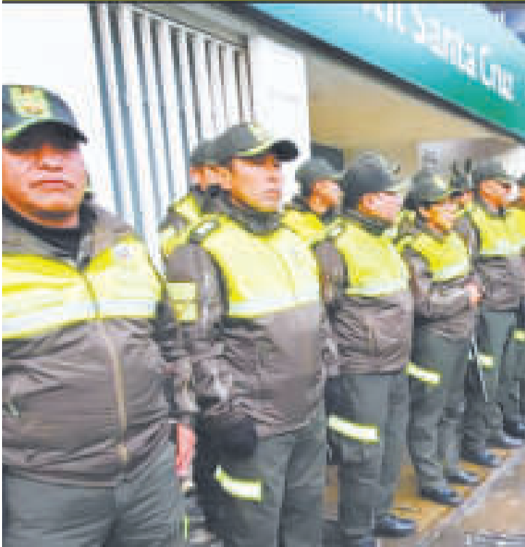
El 1 de enero, la Policía activó operativos de control.