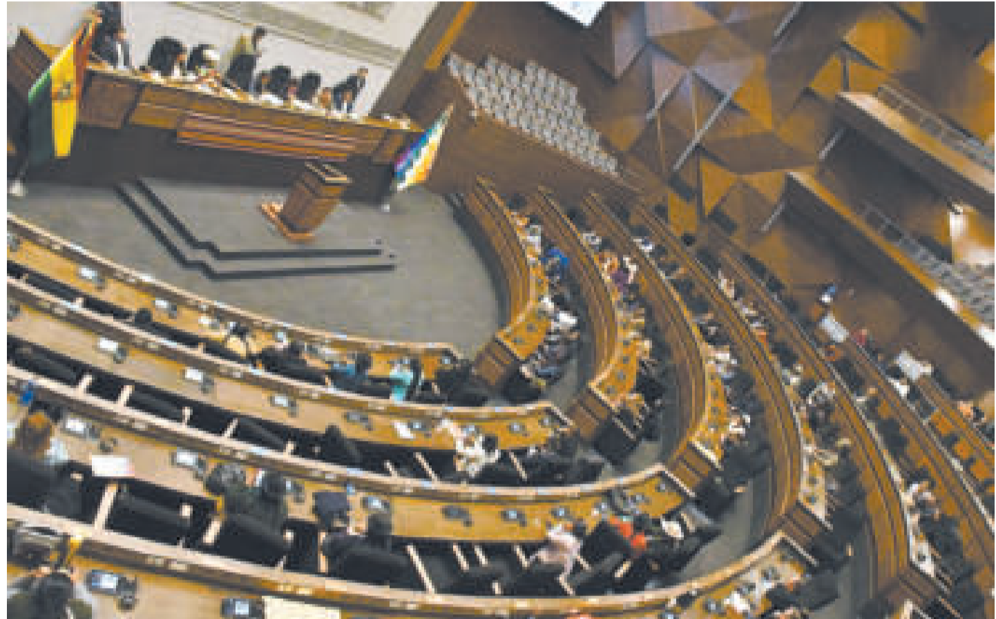
El tratamiento y aprobación de la ley no concluyó en el Legislativo.

En la ley vigente se aclara: “Por cuanto, habiendo transcurrido el término de 60 días sin haber sido aprobada por la Asamblea (...) la Ley del Presupuesto General del Estado-Gestión 2024, en el marco del numeral 11 del parágrafo I del artículo 158 y del parágrafo II del artículo 164 de la Constitución, entra en vigencia a partir