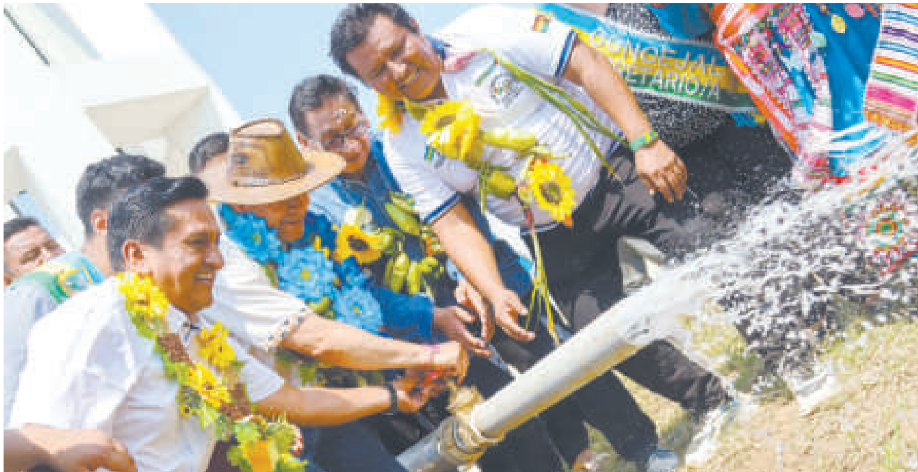
El Gobierno garantiza servicios básicos y agua para el agro.