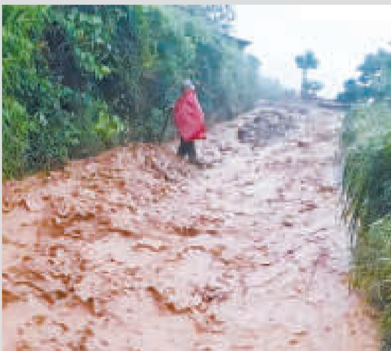
Una riada en el municipio de La Asunta, en el norte de La Paz.