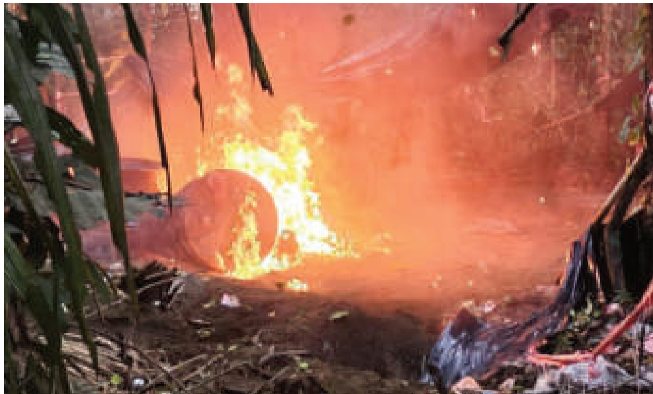
Un laboratorio de fabricación de pasta base de cocaína es destruido en el trópico cochabambino.