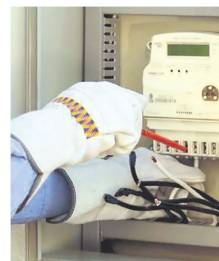
Límite a los incrementos

La apuesta del Gobierno es que la participación privada contribuya a fortalecer el abastecimiento interno. Sin embargo, el verdadero impacto de la medida dependerá de la rapidez con que se aprueben los reglamentos pendientes y de que existan operadores dispuestos a ingresar a un mercado que, por primera vez, combinará combustibles con precios regulados y de libre comercialización.