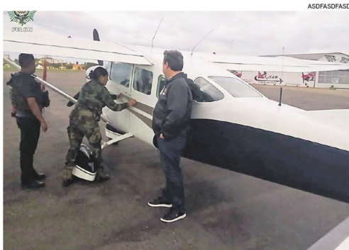
La avioneta que fue detectada con dólares en un control de la Felcn

Según el informe oficial de la Felcn, en la revisión del equipaje del piloto los agentes encontraron un bolsón negro que contenía una cantidad de dinero distribui-