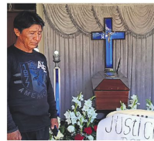
El padre clama por justicia

La Onudc prevé entregar en agosto, antes de lo previsto, el próximo informe de cocales.