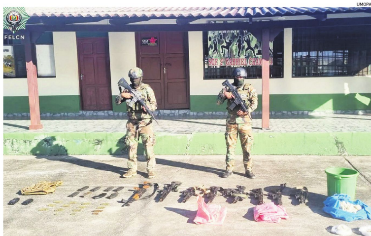
En los operativos de Umopar se hallaron ocho armas, municiones y equipos de radiocomunicación

De acuerdo con las estimaciones de la Felcn, el laboratorio destruido tenía capacidad para producir hasta 150 kilos de cocaína por día y