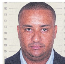
Alias Chiquito malo

En su último balance, el Ejecutivo venezolano indicó que 6.461 personas han sido rescatadas y al menos 2.295 han fallecido, mientras que 11.267 resultaron heridas.