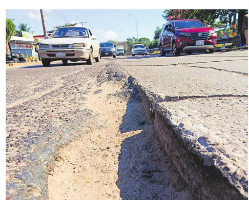
Este hueco afecta a quienes que transitan por av. Mutualista

La norma también dispone que el municipio adapte los requisitos para la obtención de licencias de funcionamiento y para la regulación de las actividades económicas, para minimizar la burocracia en los trámites municipales.