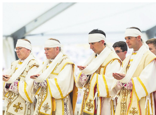
Los nuevos obispos de la Fraternidad Sacerdotal San Pío X

Esta congregación fundada en 1970 por el arzobispo francés Marcel Lefebvre está en contra de algunos preceptos del Concilio Vaticano II. Juan Pablo II ya excomulgó a su fundador y a los cuatro obispos que ordenó en 1988