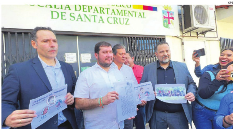
La directiva del ente cívico se constituyó como víctima y denunciante en el proceso

La acción establece cargos por alzamiento armado, terrorismo, asociación delictuosa, atentados contra servicios públicos y otros ilícitos. Solicitan la aprehensión inmediata de los tres por el riesgo de fuga y obstaculización