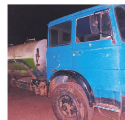
El camión que hizo la descarga

que el Ministerio Público lleve adelante las investigaciones para establecer las responsabilidades penales y aplicar las sanciones. Además, piden a la población a que denuncie cualquier hecho que represente un riesgo para el medioambiente y la salud de las personas.