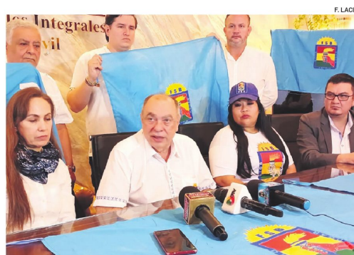
FSB anuncia su participación en futuros procesos electorales