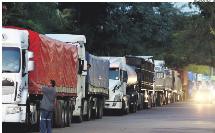
Doce días después de la dictación del estado de excepción, aún persiste la escasez de diésel

cide con un escenario de persistente escasez de diésel. En Santa Cruz persisten las filas de camiones de carga pesada, buses de transporte interdepartamental y maquinaria agrícola