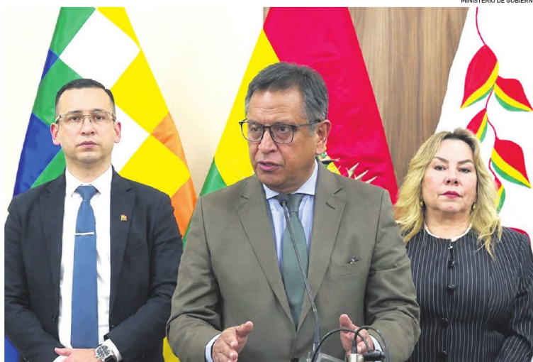
El ministro de Gobierno, Marco Antonio Oviedo, junto a las autoridades del Tribunal Supremo de Justicia

Tras la reunión de ayer, la tensión disminuyó y se abrió un canal de diálogo entre los magistrados y el Ejecutivo. El Gobierno comprometió la participación de los ministerios vinculados con el tema, principalmente el de Economía y