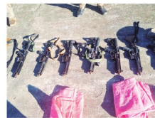
Armamento de grueso calibre

cortes de rutas y cerco a ciudades que causaron pérdidas de vidas y millonarios perjuicios económicos. A7