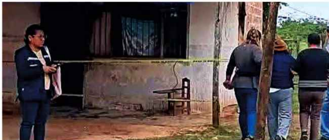
CRIMEN. Las autoridades, en el lugar del hecho. La víctima dejó en la orfandad a cuatro hijos. El sospechoso también es investigado por el delito de tentativa de infanticidio.

Entonces, y sin que nadie lo supiera, aprovechó las sombras de la noche del martes 30 de junio pa-