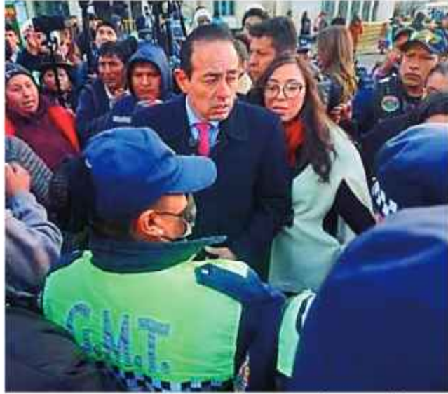
RECLAMOS. Los vecinos aprovecharon para hacer pedidos.