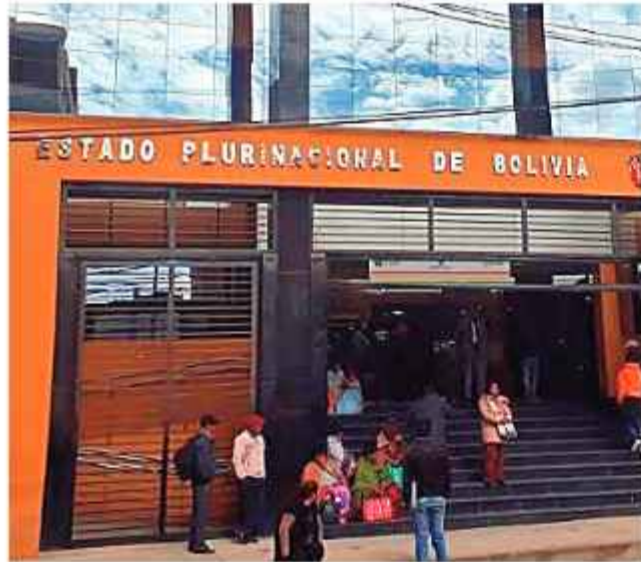
DATO. Las acefalías generan una "parálisis institucional".

La Asamblea Legislativa analiza la viabilidad de seis proyectos de ley orientados a aprobar un mecanismo excepcional de designación interina de magistrados. La propuesta legislativa apunta a cubrir en forma transitoria las vacantes críticas en el Tribunal Constitucional Plurinacional (TCP) y en el Tribunal Supremo de Justicia (TSJ).