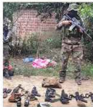
ARMAS. Las autoridades, con el decomiso.

Además, se hallaron ocho armas largas, varios cargadores, municiones, chalecos antibalas, radios de comunicación y droga. El hecho se encuentra todavía bajo investigación.