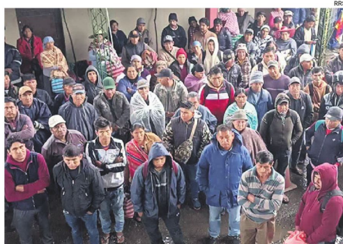
Cocaleros reunidos en el retén de Villa Tunari