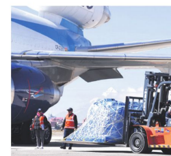
Finalizó el puente aéreo solidario

cuperación no será inmediata. Explicó que los bloqueos redujeron la producción mensual de aproximadamente 19 millones de pollos a menos de 13 millones, por lo que la menor oferta seguirá reflejándose en los mercados durante las próximas semanas.