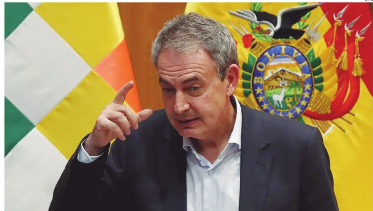
El expresidente del Gobierno español que es investigado en su país, durante una visita a Bolivia.

El Centro Nacional de Alerta de Tsunamis de Estados Unidos explicó que ambos temblores conformaron un “doblete sísmico”, un fenómeno en el que dos terremotos de gran magnitud ocurren con pocos segundos de diferencia en la misma zona.