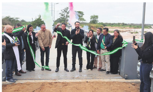
Inversores y autoridades durante el corte de cinta