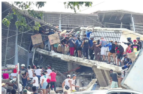
Comercios fueron saqueados tras los dos terremotos.

nima, así como en las localidades de Catia La Mar y el Caribe, según constató EFE, la desesperación se ha apoderado de habitantes de edificaciones afectadas y que desconocen el paradero de sus seres queridos.