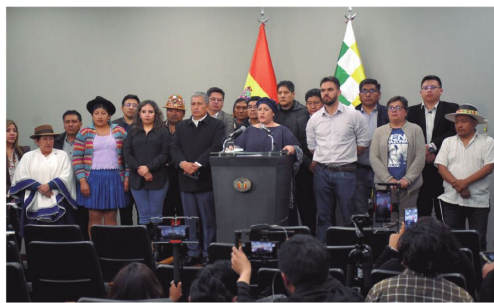
Conferencia de los ministros de Luis Arce, el 26 de junio de 2024