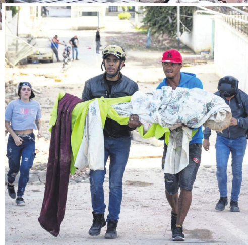
Rescatistas trasladan los restos de una persona en La Guaira.