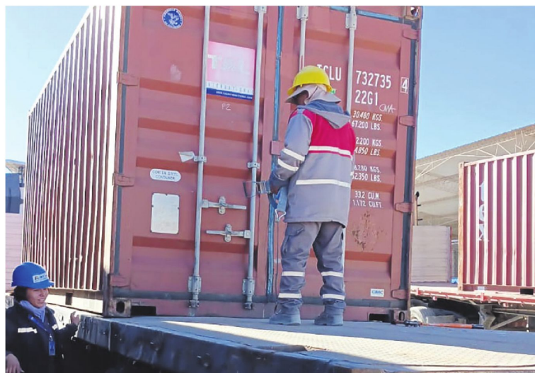
Los contenedores llegaron a los recintos de aduaneros tras más de 50 días de bloqueos de carreteras

El sector explicó que el problema se originó porque los contenedores no pudieron ser retirados y devueltos dentro del plazo establecido a las navieras, debido a los bloqueos que afectaron las rutas nacionales.