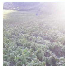
Los daños en la producción