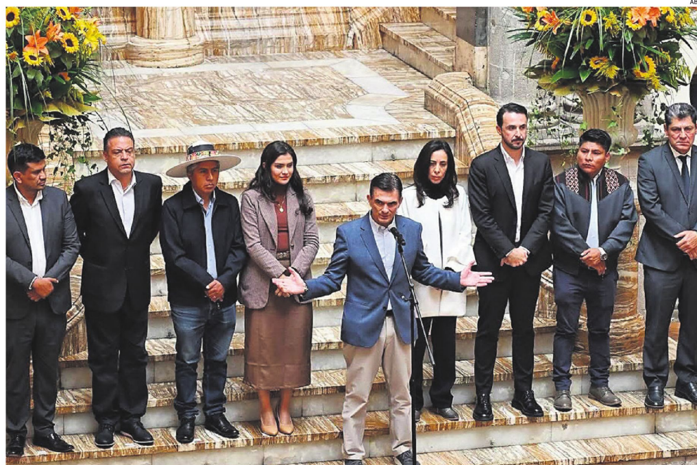
El 24 de abril, en La Paz, el presidente y los nueve gobernadores acordaron la distribución del 50-50 de los recursos en sus departamentos

Tras la etapa de conflictividad en el país, la Gobernación cruceña busca una oportunidad para instalar reformas económicas, fortalecer las autonomías y reabrir el debate sobre un reparto equitativo de los fondos públicos bajo la figura del 50/50