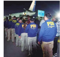
Bolivianos expulsados de Chile

Marset afronta el riesgo de recibir una pena de hasta 20 años de cárcel, en caso de comprobarse su participación en el lavado de dinero proveniente del narcotráfico en bancos de Estados Unidos y Europa.