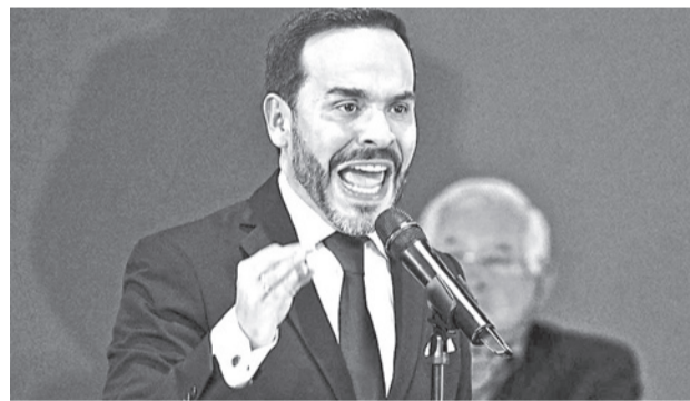
El presidente electo de Colombia, Abelardo Espriella.

En caso de confirmarse su triunfo, Fujimori, que con este ha sumado cuatro intentos, se convertiría en la primera presidenta de Perú electa a través de las urnas.