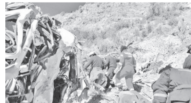
Labores de rescate del camión. EL RELATO

medio en las movilizaciones y bloqueos, luego de acusar al líder de la COB Mario Argollo de romper el bloque de resistencia. Además, en declaraciones posteriores, el exmandatario negó que sus protestas hubieran tenido la finalidad de lograr la renuncia del presidente del Estado, Rodrigo Paz.