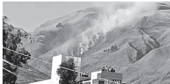
El incendio que afectó el Parque Tunari, ayer. TUNARI SIN FUEGO

Dato. La Unidad de Gestión de Riesgos destacó que hasta el 25 de junio de 2026 se contabilizaron 18 incendios forestales en el departamento