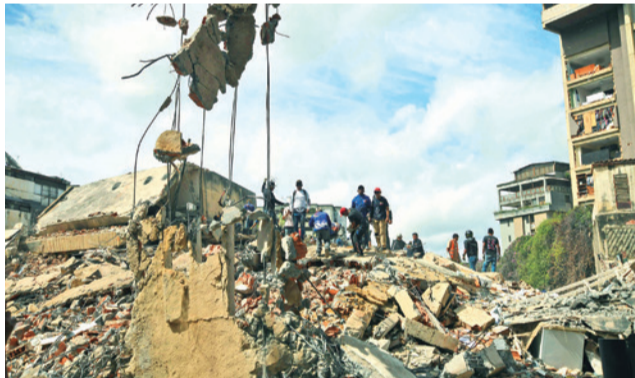
La labor de rescate es intensa.