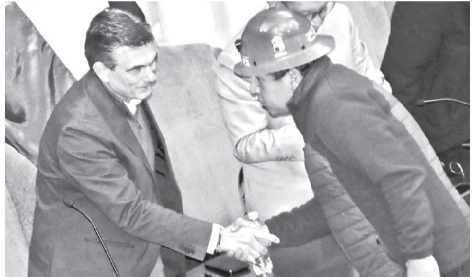
El presidente Rodrigo Paz, y el ejecutivo de la COB, Mario Argollo, la semana pasada. M.R.

Estas declaraciones fueron realizadas en el foro “Bolivia: protegiendo la democracia representativa del desorden violento”, desarrollado en el marco del 56 periodo ordinario de sesiones de la Asamblea General de la Organización de Estados Americanos (OEA).