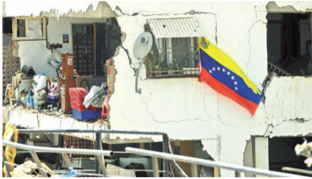
Uno de los edificios afectados por los terremotos.