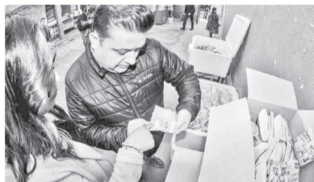
El partido entra la U de Vinto y Oriente. GAMC

Camacho también reportó daños por heladas en Mizque y Aiquile. En Mizque fueron afectadas unas 320 hectáreas de cultivos y 520 familias de 36 comunidades, mientras que en Aiquile se registraron daños en 50 hectáreas de papa y tomate, con al menos 12 familias damnificadas.