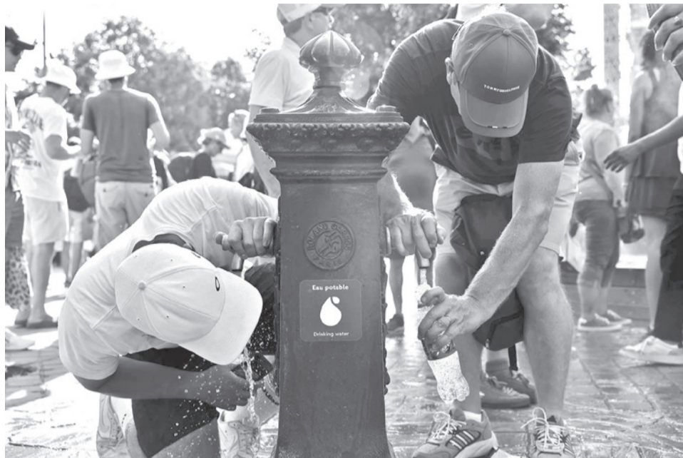
Europa afectada por una ola de calor que cobra varias vidas.