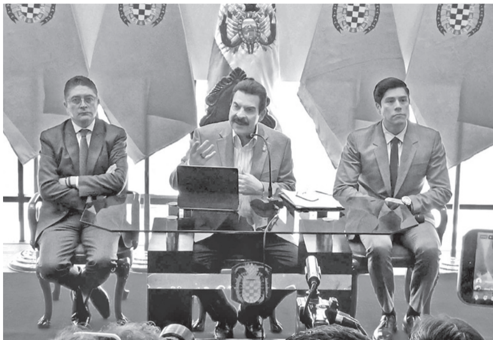
El alcalde Manfred Reyes en la presentación de “Cocha se reactiva”. DANIEL JAMES

Entre las medidas anunciadas se encuentra la ampliación de descuentos tributarios para bienes inmuebles, vehículos y patentes municipales, además de la extensión de la vigencia de programas