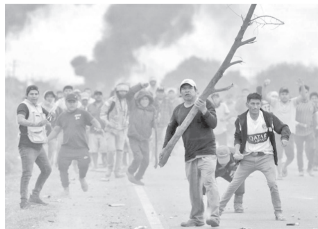
Enfrentamientos durante los bloqueos.

La comisión tendrá un plazo de cinco meses para llevar adelante las indagaciones y, a su conclusión, presentará un informe.