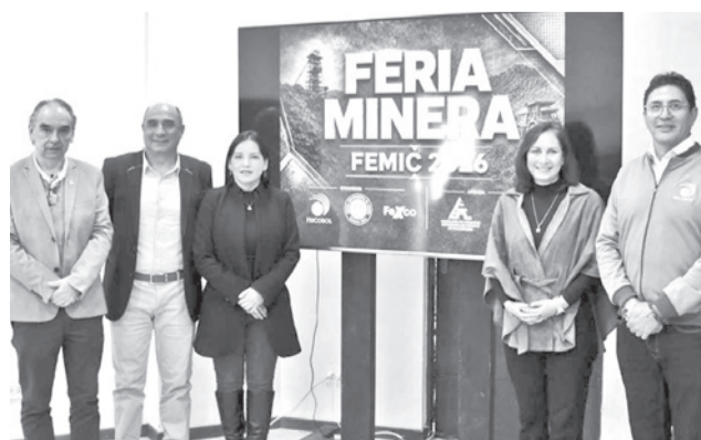
El lanzamiento de la Feria Minera. FEPC

“Queremos posicionar al departamento de Cochabamba en el circuito minero. En los últimos años se ha abierto una oportunidad importante para mostrar que