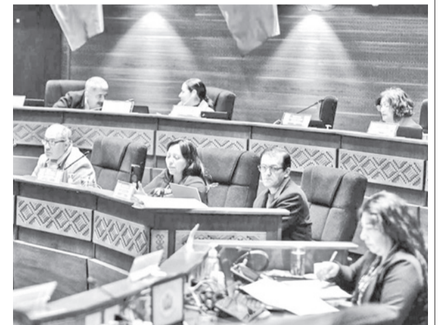
La aprobación del crédito en el Senado.

El proyecto contempla tres componentes: fortalecimiento institucional y desarrollo de capacidades técnicas; inversiones para mejorar puentes y carreteras.