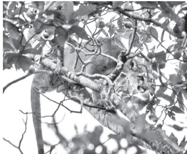
El puma rescatado de la copa de un árbol en San José de Chiquitos.