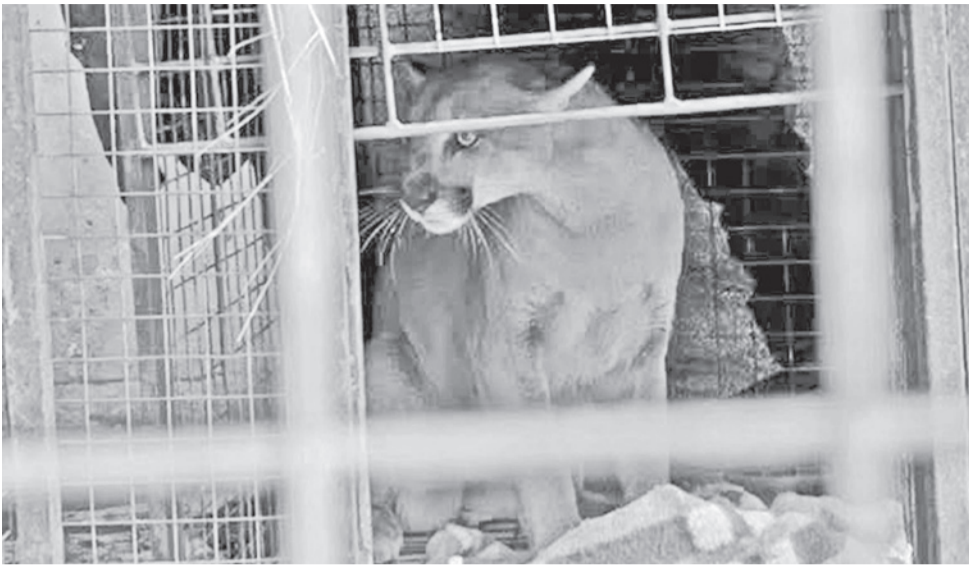
El felino fue trasladado a un centro de custodia.