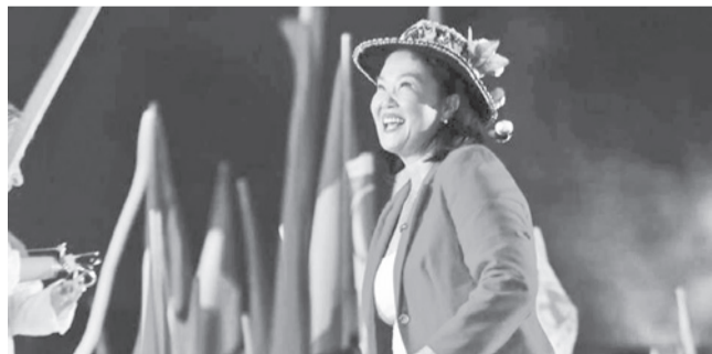
La candidata Keiko Fujimori.

Histórico. De confirmarse el resultado en el informe oficial, Keiko Fujimori se convertirá en la primera presidenta electa del Perú