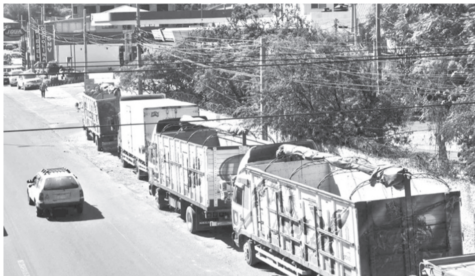
Las filas para abastecerse de combustible persisten. HERNAN ANDIA

Jiménez confirmó que han iniciado los procesos legales contra los responsables de los bloqueos de 52 días que asfixiaron al país. Sin embargo,