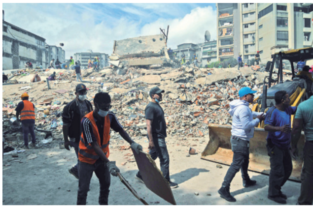
Socorristas en plena labor de rescate.