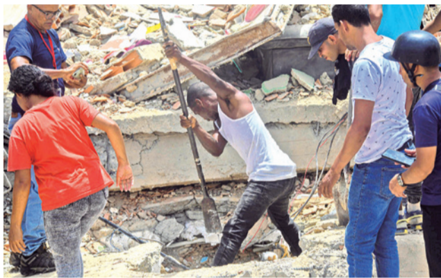
Un hombre trabaja en busca de víctimas.