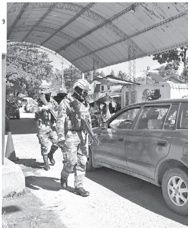
Cocaleros del trópico en la toma del retén de Umopar. LR

El puesto de control de El Castillo es uno de los