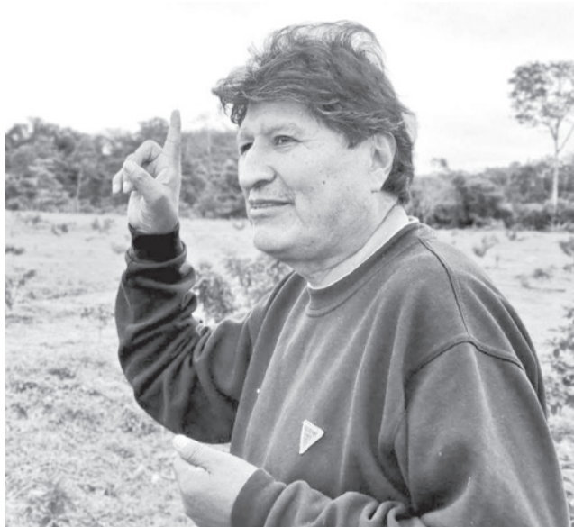
El expresidente Evo Morales en Lauca Ñ. RR55

El ministro de Defensa, Ernesto Justiniano, destacó los alcances de la reunión que sostuvo con el encargado de Negocios y jefe de misión de la Embajada de Estados Unidos en Bolivia, Erik Martini, encuentro en el que abordaron temas vinculados a la seguridad, la defensa y la lucha contra el crimen organizado. La autoridad señaló que el diálogo permitió intercambiar criterios sobre los desafíos que enfrenta el país y la necesidad de fortalecer los mecanismos de cooperación internacional para proteger a la población.