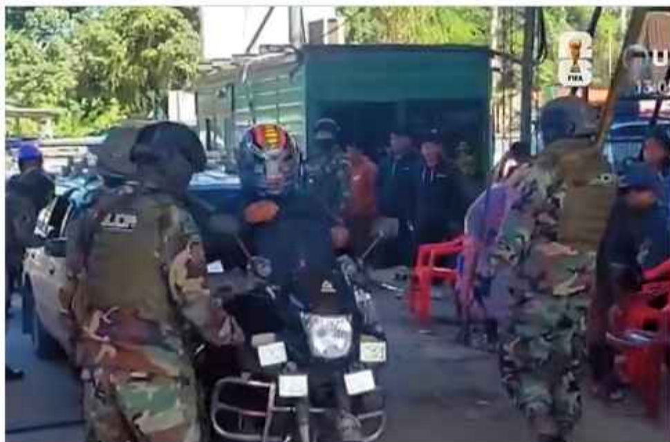
SEGURIDAD. Efectivos del verde olivo en su corta labor fiscalizadora cotidiana de ayer.

El despliegue operativo incluyó el ingreso coordinado de camionetas y de personal de la Fuerza Especial de Lucha Contra el Narcotráfico (FELCN). Al llegar al retén, los uniformados procedieron a instalar los conos de seguridad y a re-