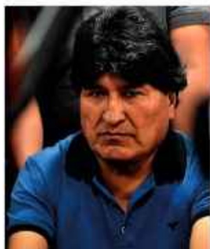
EXPRESIDENTE. Evo Morales.

El expresidente Evo Morales calificó como una "exageración" la demanda de renuncia dirigida contra el mandatario Rodrigo Paz, una de las principales consignas que sostuvieron los sectores movilizados durante los 52 días de bloqueos en carreteras del eje troncal en el país.