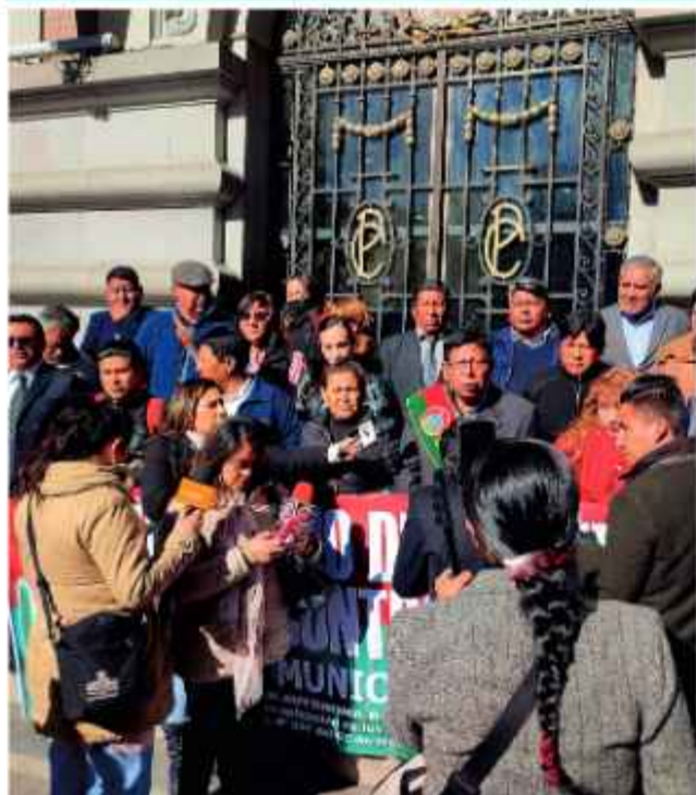
DATO: Mayta y su grupo visitaron el Palacio Consistorial.

EMPRENEN LA FISCALIZACIÓN DE LOS RECURSOS