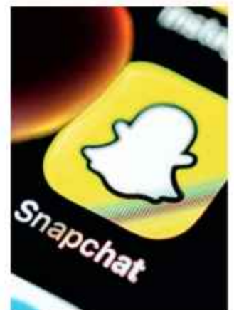
VIOLENCIA. Este es el logotipo de Snapchat.

A través de un comunicado de prensa, los padres de la víctima expresaron que su objetivo es evitar que otras familias pasen por la misma tragedia. Los demandantes también solicitan una compensación económica significativa por daños y perjuicios. RUSSIA TODAY y AGENCIAS.