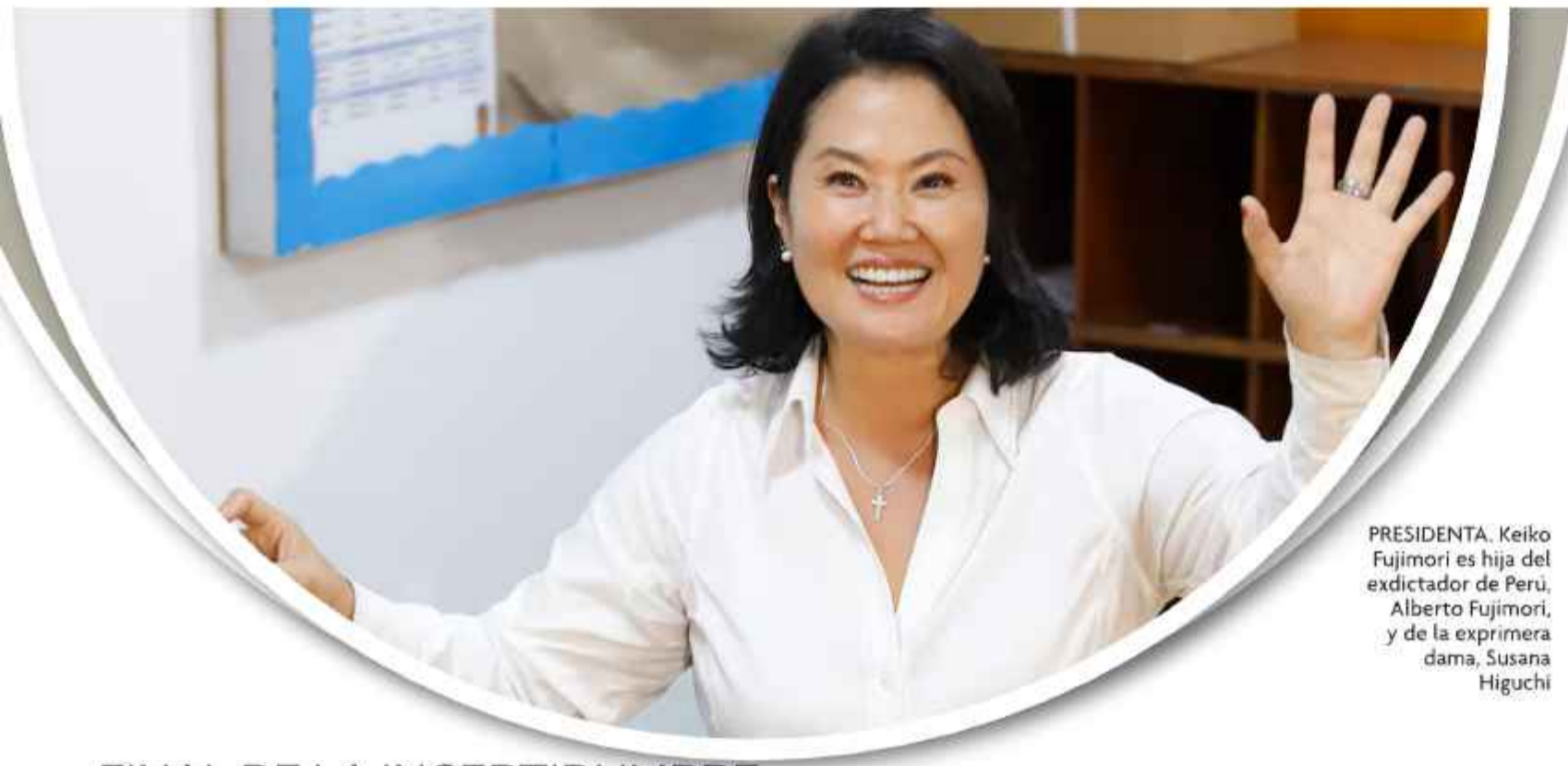
PRESIDENTA. Keiko Fujimori es hija del exdictador de Perú, Alberto Fujimori, y de la exprimera dama, Susana Higuchi