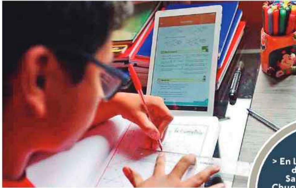
EDUCACIÓN. Un estudiante pasa clases virtuales en La Paz.

El cierre de rutas que afectó al país por 52 días provocó retrasos en los planes de estudio del sistema de educación regular. Las zonas con más perjuicios por las protestas y la escasez de transporte son La Paz, Cochabamba y Oruro. Después del fin de las medidas