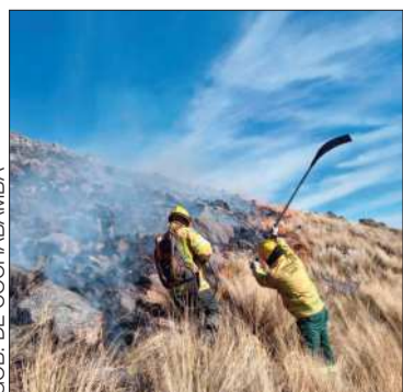
GOB. DE COCHABAMBA