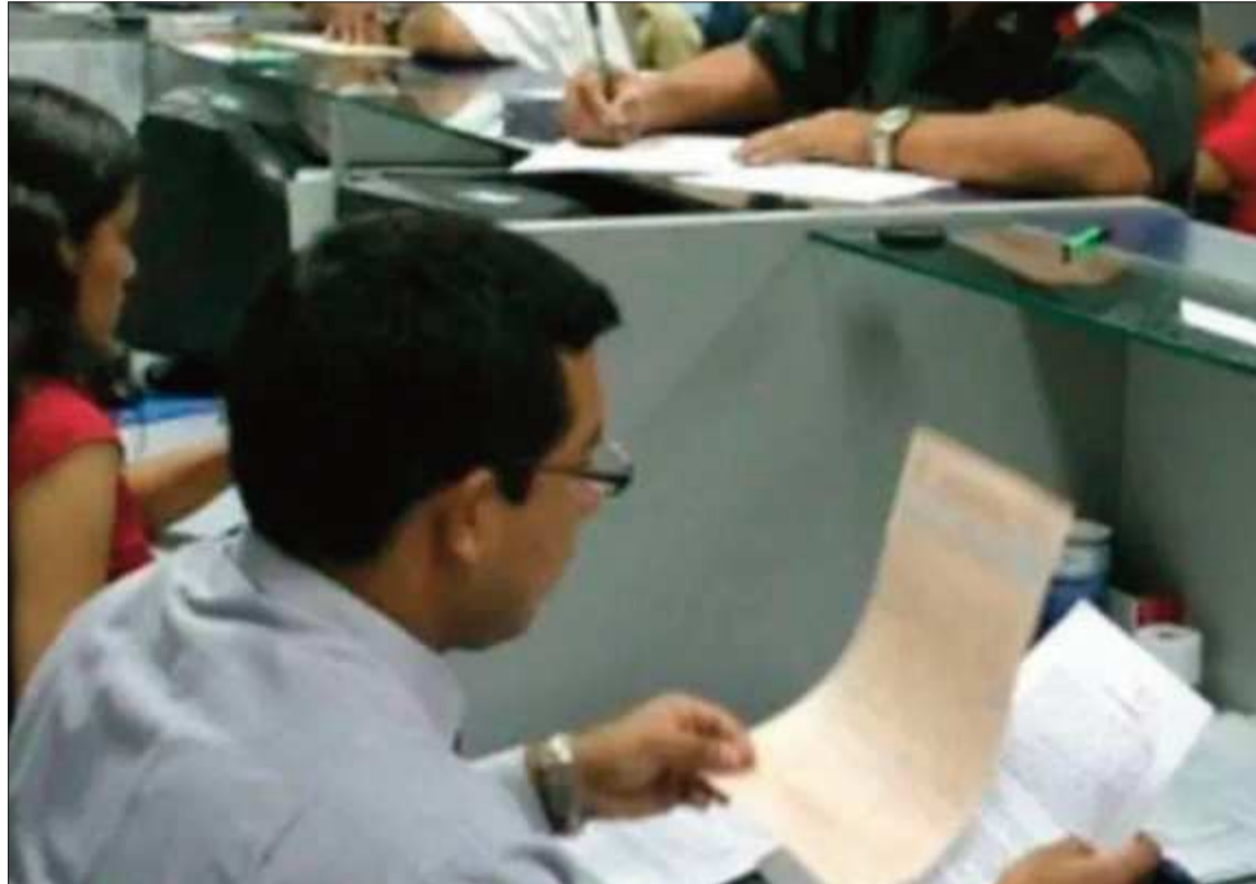
DISPOSICIÓN. Los trabajadores del sector público tendrán tolerancia en el ingreso a sus fuentes laborales.

“Las entidades públicas y privadas deberán adoptar las medi-