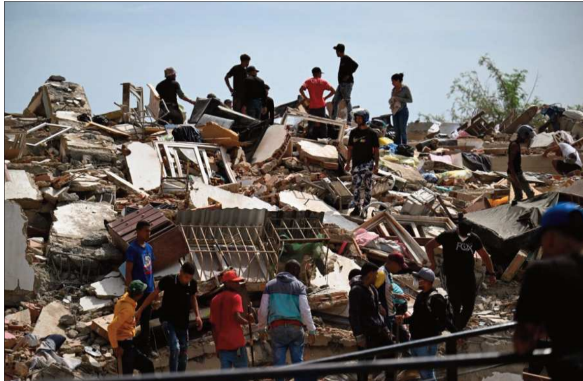
DESESPERACIÓN. Los rescatistas con apoyo de vecinos buscan sobrevivientes entre los escombros.

Los rescates avanzan lentamente, y hay cuerpos aún visibles bajo los escombros 24 horas tras los terremotos. Los residentes escucharon por horas a tres personas bajo los escombros. “Están con vida, le decimos que no fuer-