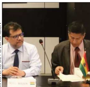
La representación boliviana.

El consejo realizó su primera sesión en la ciudad de Brasilia