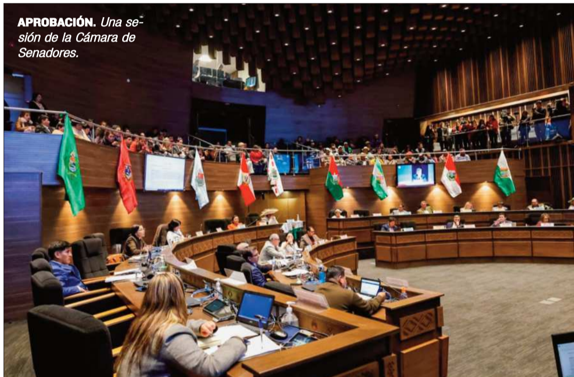
CÁMARA DE SENADORES

APROBACIÓN. Una sesión de la Cámara de Senadores.