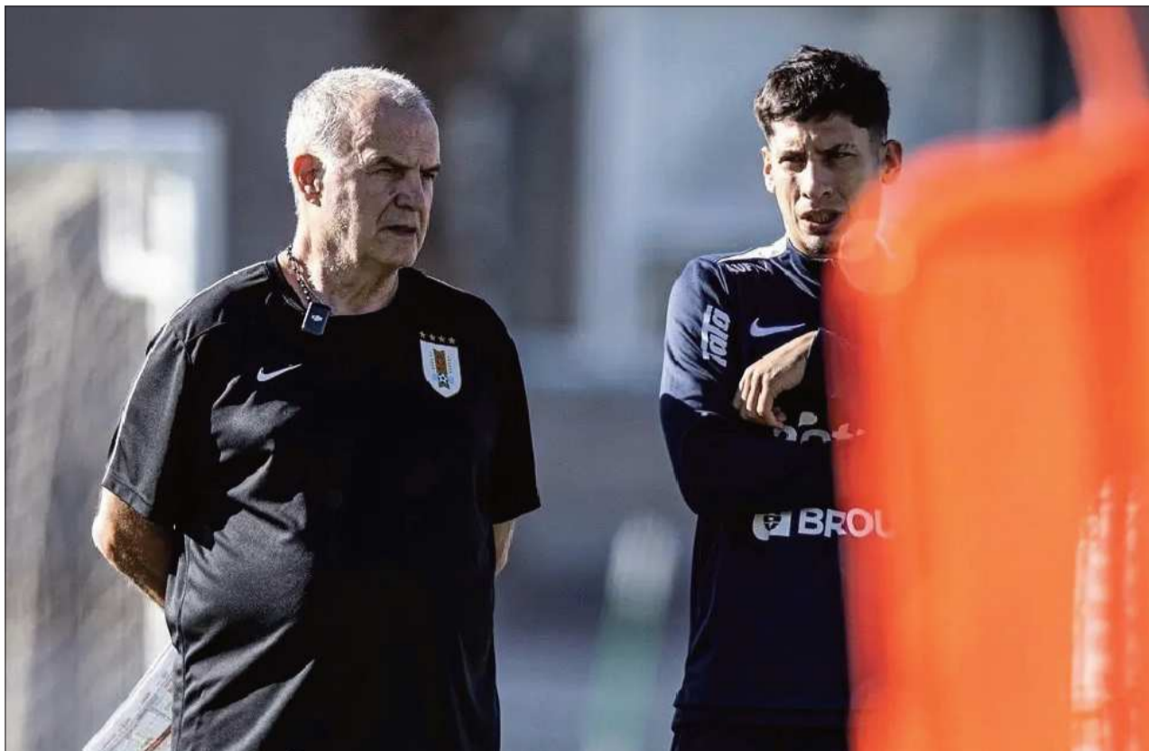
ENTRENAMIENTO . Bielsa conversa con una de sus ayudantes de campo durante la práctica.