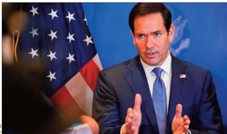
PREOCUPACIÓN. Marco Rubio analizó el acercamiento con Irán.

Rubio expresó su preocupación si Teherán cobra un peaje en Ormuz.