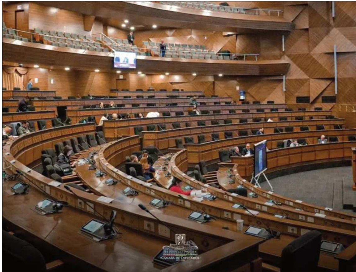
PEDIDO. Sesión de la Cámara de Diputados donde se aprueba la minuta de comunicación.

Medios internacionales informaron sobre una investigación