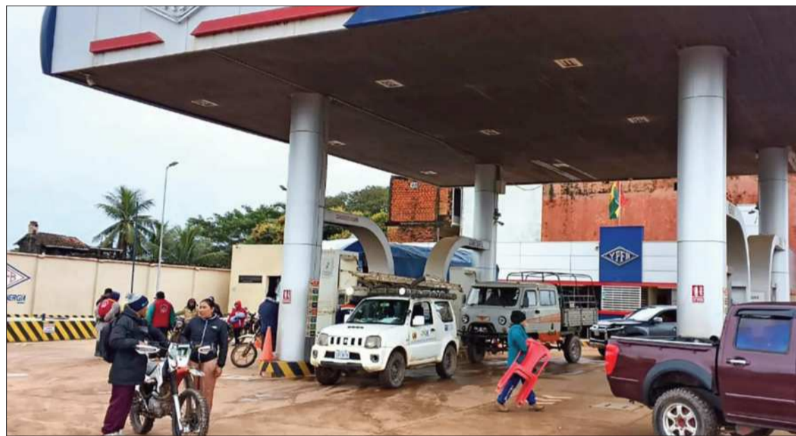
CARBURANTES. Venta de combustibles en una estación de servicio en territorio nacional.

El año pasado, el Gobierno nacional retiró la subvención a los combustibles y fijó nuevos precios. Además, se determinó que