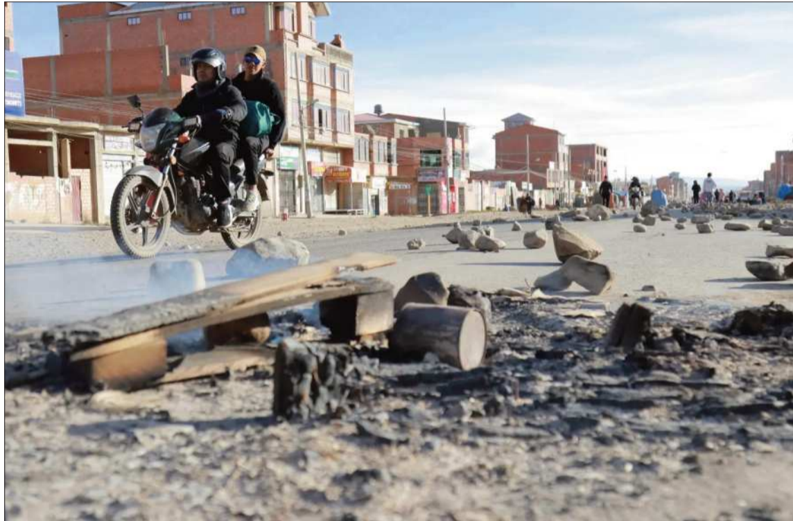
DEMANDAS. El país fue afectado por los bloqueos y las manifestaciones sociales.

Barriga, por su parte, describió el impacto de los bloqueos como una afectación de carácter estructural sobre el sistema logístico y productivo. Señaló que actualmente existe una sobredemanda de transporte, contenedores y uso de puertos, lo que retrasa la nor-