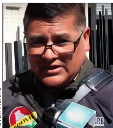
El presidente de Conamype.

Señalaron que el sector requiere estabilidad para volver a generar empleo