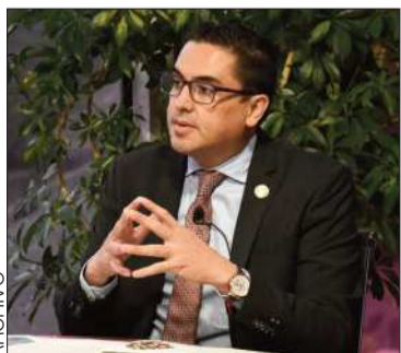
El viceministro Justavo Jáuregui.

El viceministro planteó un plan de dos ejes para la reactivación