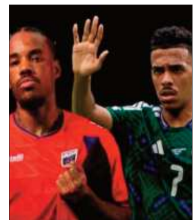
Será un partido muy disputado.

Cabo Verde, que participa por primera vez en una Copa del Mundo, se convirtió en la gran sorpresa de la zona tras empatar 0 a 0 ante España y 2 a 2 contra Uruguay.