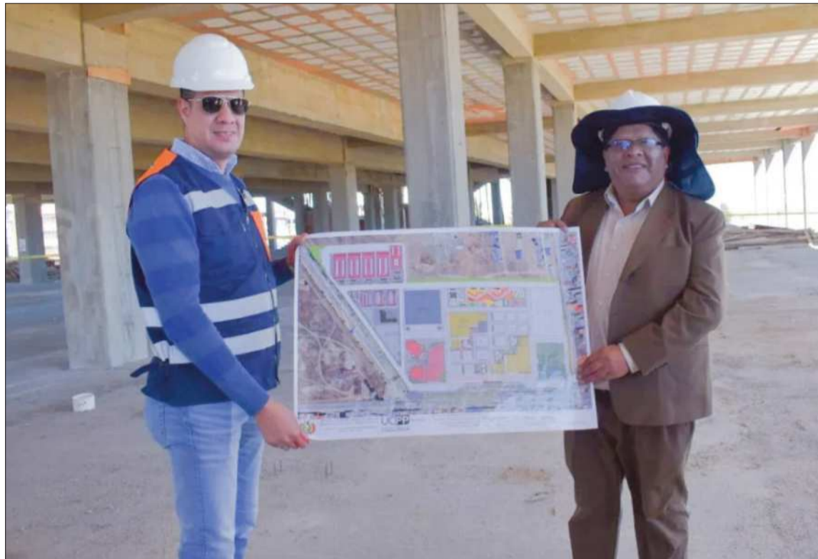
PROYECTO. Se tiene el diseño final de la megaobra en la urbe alteña.

“Hemos coordinado, hemos visto cómo se va a construir, cuáles son las tareas que va a realizar como Ministerio de Economía y en qué tenemos que coadyuvar nosotros. Desde el municipio aportaremos con el forestado del sector a través de las ‘venas ver-