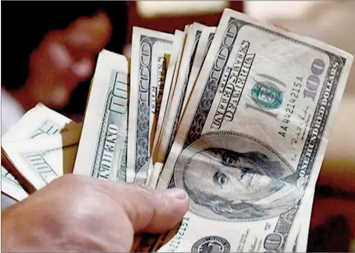
FOTO REFERENCIAL OPERACIÓN. Una transacción en moneda estadounidense en un mercado del país.