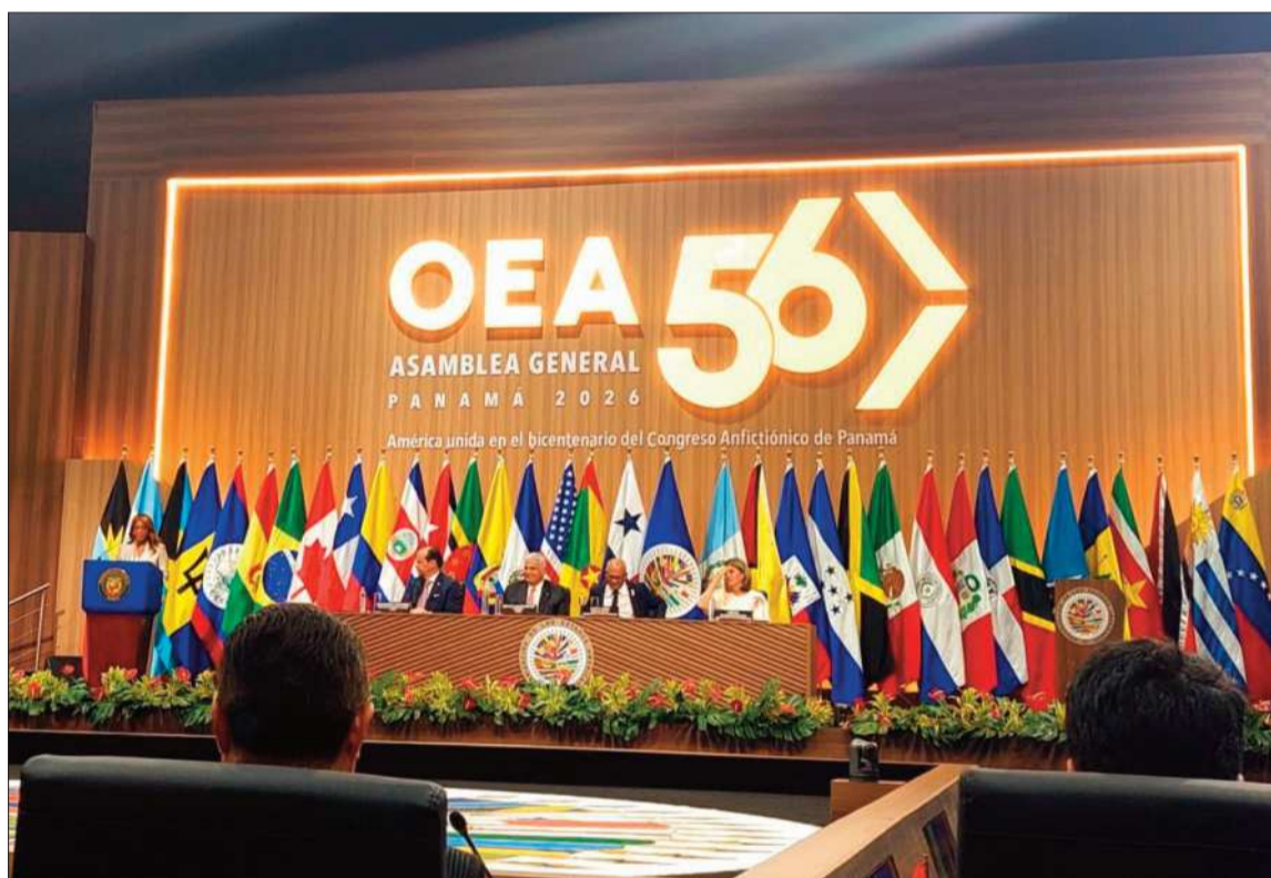
PANAMÁ. Sesión de la 56ª Asamblea General de la Organización de los Estados Americanos (OEA).

El organismo llamó a las partes a priorizar el diálogo, reducir las tensiones y respetar los derechos humanos, el Estado de derecho y el derecho a la protesta pacífica.