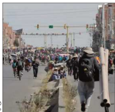
Un punto de bloqueo en El Alto.

El organismo expresó su rechazo a la violencia registrada en el país