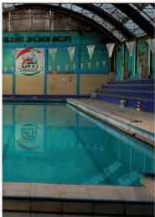
DETERIORO. El lugar no recibió mantenimiento.

Por esta razón, la intervención de este espacio deportivo posee un carácter de urgencia, en especial, ante la proximidad de los Juegos Deportivos Bolivarianos. La Alcaldía paceña busca garantizar instalaciones dignas y seguras para los niños, jóvenes y atletas de alta competencia que representarán al país en la justa internacional.