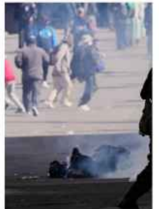
DATO. La ciudad sufrió el impacto de las protestas.

Frente a este panorama, el Alcalde convocó a la Asamblea de la Paceañidad para esta jornada. En este encuentro presentará una estrategia de reactivación económica que reúne más de 40 medidas específicas. El plan establece acciones concretas para tres fases temporales: el corto plazo (90 días), el mediano plazo (un año) y el largo plazo (cinco años). La meta de la propuesta busca recuperar los empleos perdidos y atraer inversiones privadas.