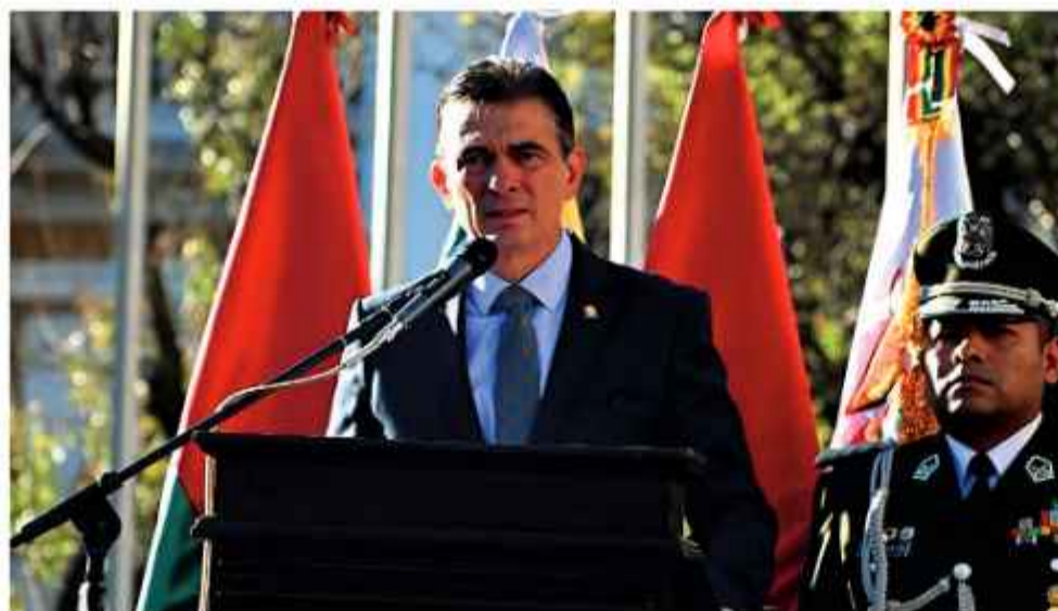
ACTO. El presidente Rodrigo Paz ofrece un discurso durante los actos oficiales por el Bicentenario de la Policía, ayer, en la plaza Murillo.

El presidente Rodrigo Paz y el comandante general de la Policía, Mirko Sokol, anunciaron ayer que recuperarán el control total del territorio nacional para sentar presencia estatal. El anuncio apunta al trópico de Cochabamba, región que ha permanecido bajo el dominio de los cocalleros, seguidores del expresidente Evo Morales.