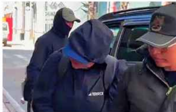
POLICÍA. Uno de los extranjeros aprehendidos el martes.

Los cuatro subditos extranjeros aprehendidos por el robo en una joyería en Oruro tienen antecedentes penales por atraco y robo en Estados Unidos y en Ecuador, informó ayer Róger Montaña Mariaca, fiscal general del Estado.