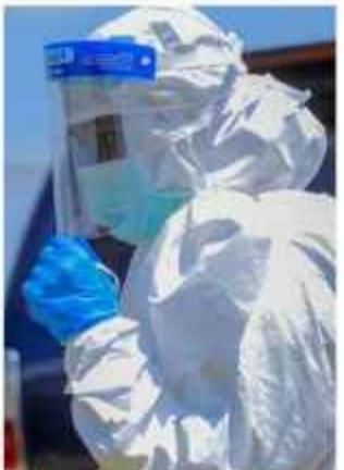
PATÓGENO. Francia activó su protocolo de emergencia.

Ante esta situación, el Gobierno francés activó un protocolo de emergencia. Autoridades también enfatizaron que disponen de unidades hospitalarias de alta bioseguridad preparadas para contener este tipo de patógenos. AGENCIAS