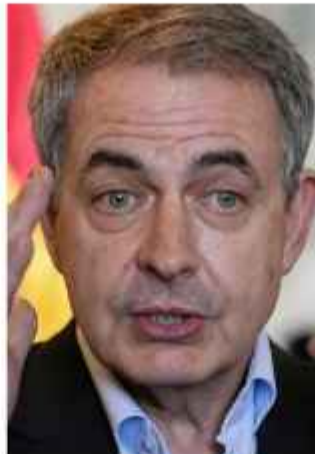
PERFIL. El socialdemócrata José Luis Rodríguez Zapatero.

Los documentos interceptados demuestran llamadas y presiones directas del socialdemócrata en las esferas de Bolivia, cuya justicia paralizó de manera temporal las medidas cautelares que asfixiaban a la multinacional peruana.