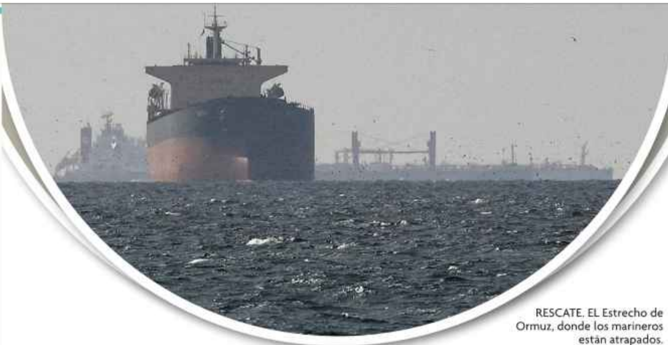
RESCATE. EL Estrecho de Ormuz, donde los marineros están atrapados.