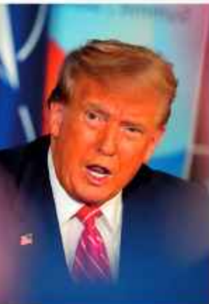
DECLARACIONES. Donald Trump, presidente de EE. UU.