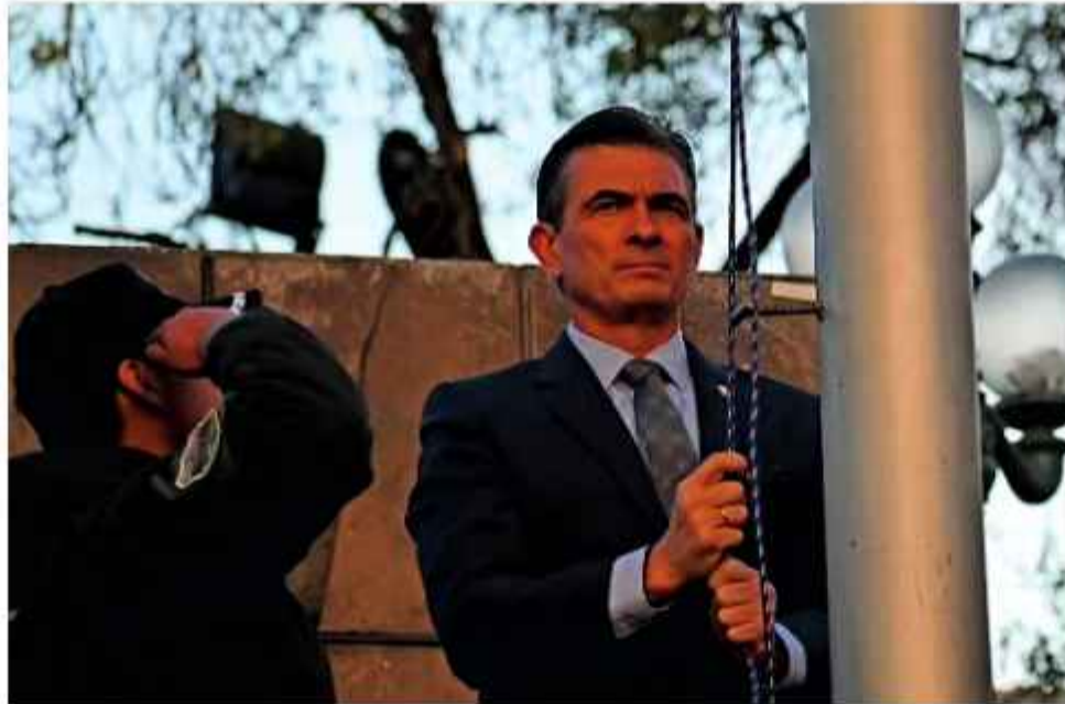
MENSAJE. El presidente conversó con los medios después de participar en un acto oficial.

Paz señaló la urgencia de aprobar nuevas leyes en las áreas de minería, hidrocarburos e inversiones, además de otras normas de or-