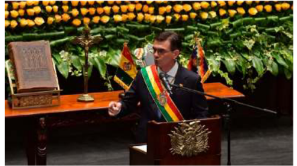
El Presidente de Bolivia, Rodrigo Paz

Los seguidores de Morales rechazan estas afirmaciones, ca-