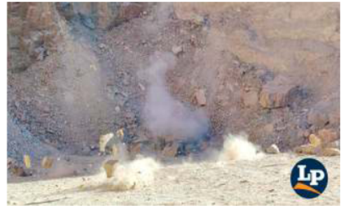
Momento en que la roca se fragmenta con el producto presentado