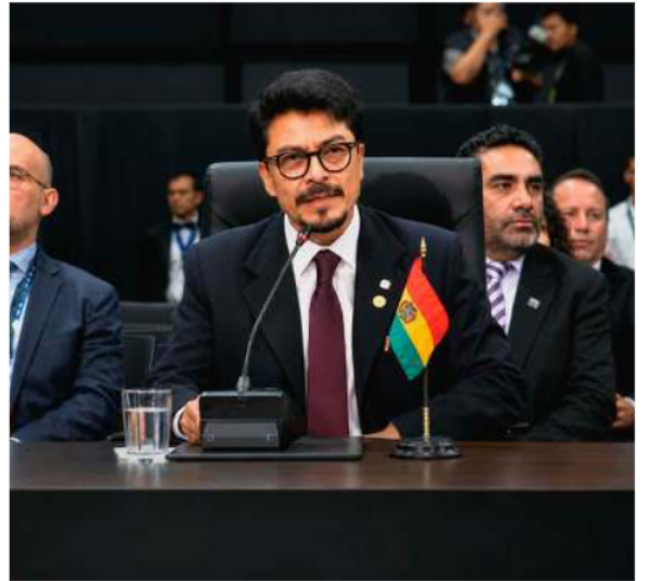
El canciller de Bolivia, Fernando Aramayo

La 56 Asamblea General de la OEA, que se desarrolla entre el lunes y este miércoles en la capital panameña, cuenta con la participación de diversas delegaciones del continente, quienes analizan los desafíos actuales que enfrentan las democracias frente a crisis internas de larga duración.