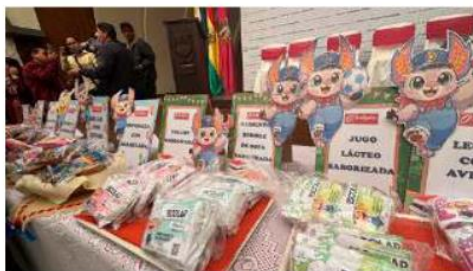
Alimento complementario vuelve a entregarse a los estudiantes