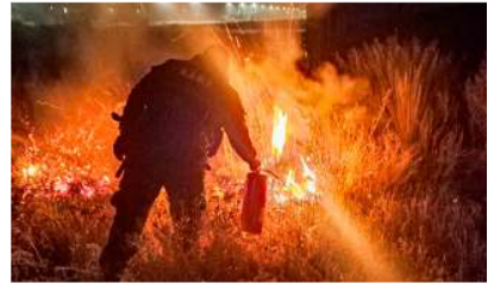
Personal de la Guardia Municipal y otras instancias recorrieron varios distritos de la ciudad

Por otra parte, la Unidad de Defensa al Con-