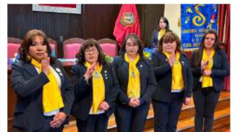
Soroptimist Oruro ratifica su compromiso con mujeres y niñas al renovar su directiva

Señaló que su gestión buscará mantener una organización cercana a las necesidades de la sociedad, promoviendo acciones orientadas a la educación, el acompañamiento y la generación de oportunidades. Durante el acto también participó la gobernadora de la Región América del Sur de Soroptimist Internacional, Lithzy Fernández. Ella destacó el cumplimiento de los programas desarrollados durante la gestión saliente y expresó su respaldo a la nueva directiva. Asimismo, exhortó a las nuevas autoridades a continuar trabajando de manera conjunta para impulsar el empoderamiento femenino y ampliar el alcance de los proyectos que desarrolla la organización en beneficio de mujeres y niñas.