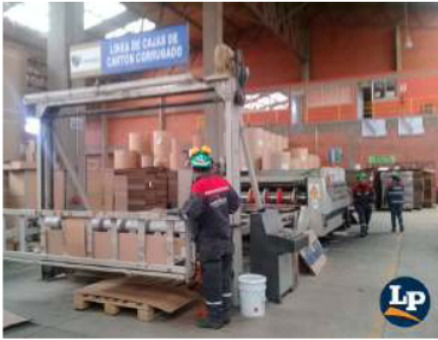
Cartonbol, imagen de archivo / LA PATRIA