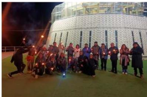
Recorrido nocturno del Movimiento Cultural Ulupika en Oruro

El Movimiento Cultural Ulupika expande su presencia en Oruro con la actividad denominada "Voces del Socavón". Este recorrido nocturno reunió a más de 20 participantes con el objetivo de rescatar la memoria minera, compartir relatos orales y recordar los 59 años de la Masacre de San Juan.