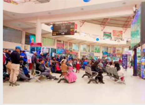
Desde este martes, los viajes en todos los destinos son normales

Sin embargo, a pesar de la reanudación de los viajes, los operadores del sector consideran que los