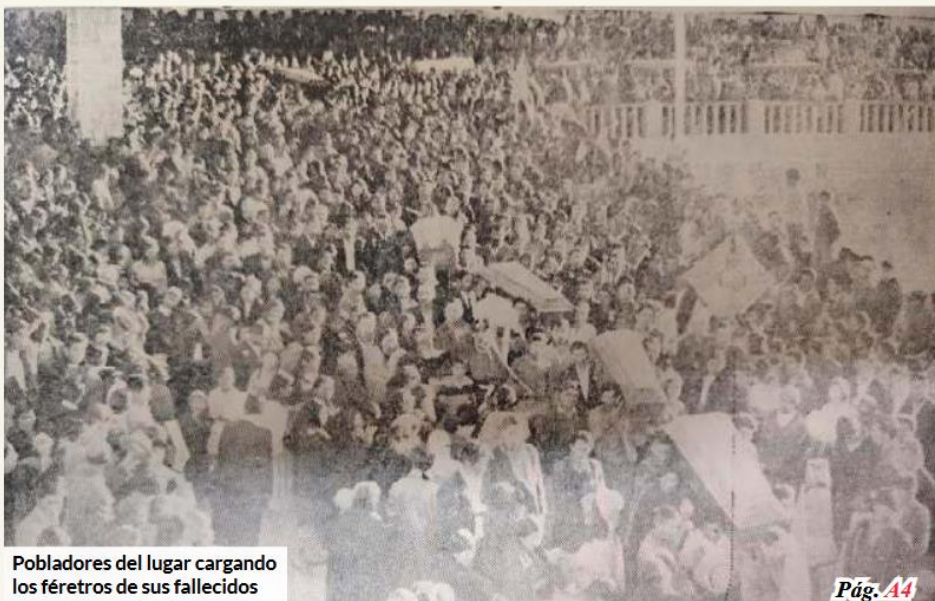
Pobladores del lugar cargando los féretros de sus fallecidos