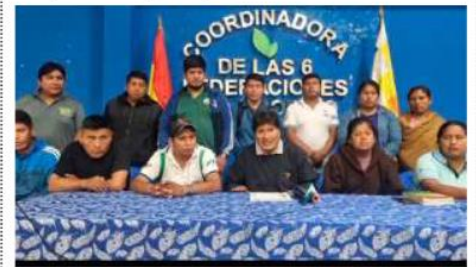
Evo Morales declaró cuarto intermedio en los bloqueos en medio del estado de excepción