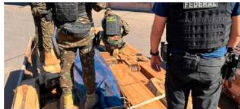
La madera permanece incautada por las autoridades de Brasil/RR.SS.

La Vicepresidencia de Bolivia calificó como un hecho de "extrema gravedad" la reciente incautación de un cargamento de cocaína en Brasil, oculta en un envío de madera procedente de territorio boliviano.