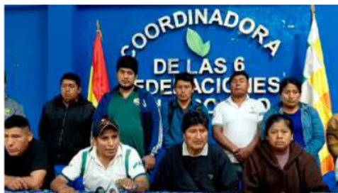
Los cocalleros del trópico sostuvieron una reunión en Lauca Ñ/RR.SS.

El anuncio se produce luego de 50 días de conflicto social, periodo durante el cual se registraron bloqueos en diversos departamentos que