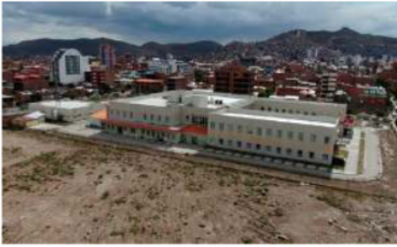
Avanza la fase previa para licitar la ampliación del Hospital Oruro-Corea/GADOR