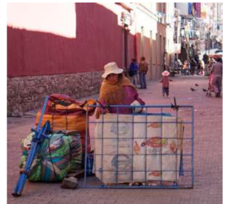
Varios negocios tuvieron que cerrar sus puertas durante los días de bloqueo

Finalmente, el diputado Ricardo Rada recordó que existen diversas cifras sobre las pérdidas económicas. Sin embargo, independientemente del número, enfatizó que las secuelas se seguirán viendo incluso el próximo año. "Es una necesidad imperativa de todos los bolivianos reactivar el aparato económico, pero sobre todo entender que lo que hemos vivido estos días no se puede revertir de la noche a la mañana", concluyó el legislador.