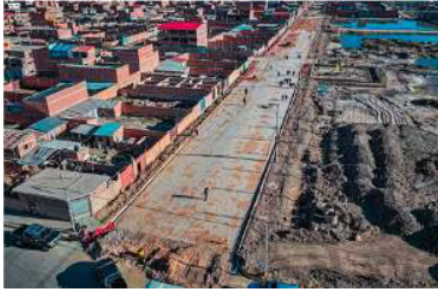
Alcaldía gestiona 12 proyectos con financiamiento del FNDR/GAMO