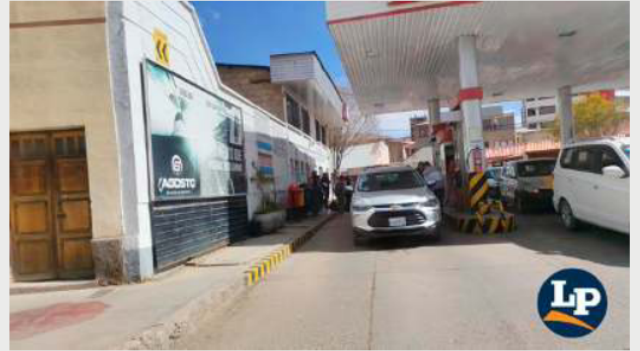
Filas en surtidores de Oruro generan preocupación

La preocupación del sector transporte persiste, ya que el combustible es fundamental para ga-