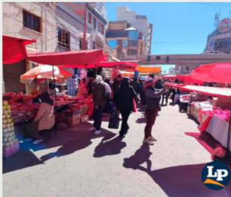
A pesar de todo, los feriantes intentaron tener la mayor variedad de productos

Las salchichas llegaron un 60% más caras y, en algunos casos, la variación alcanza hasta el 75%. A pesar de esto, los