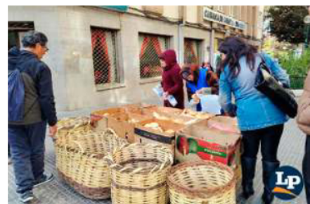
Uno de los puntos de pan instalados en el Pasaje Guachalla