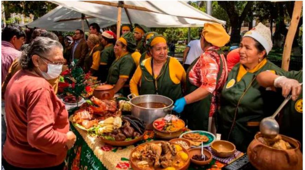
Actividades gastronómicas, culturales y de esparcimiento están permitidas