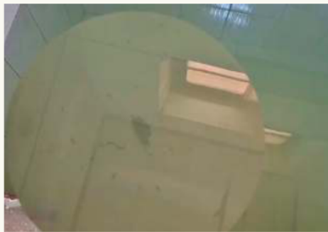
Falta de aseo se puso en evidencia /CMD