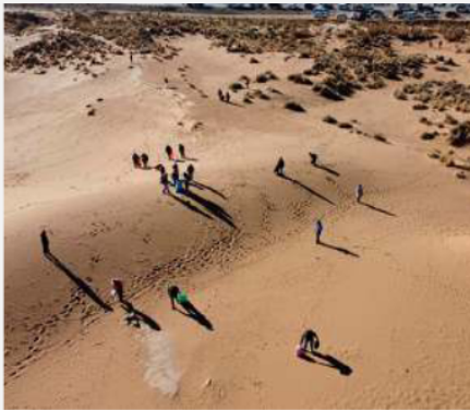
Las personas recorrieron las lomas de arena para limpiar

El gobernador enfatizó: "El cuidado del medioambiente no debe ser solo una política estatal, sino una política de la ciudadanía, de los orureños, de la gente que transita todos los días en las ciudades y en los lugares más importantes. Creo que debe ser una política concienzuda de la gente". Anunció además programas para promover el buen uso del agua y el manejo adecuado de residuos sólidos.