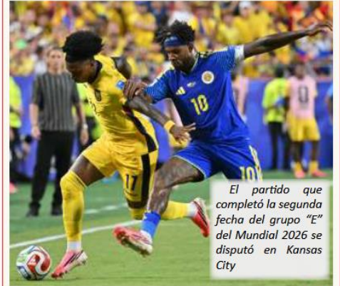
El partido que completó la segunda fecha del grupo "E" del Mundial 2026 se disputó en Kansas City