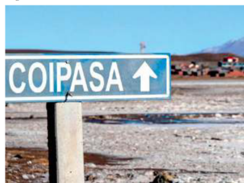
El municipio de Coipasa posee un importante salar