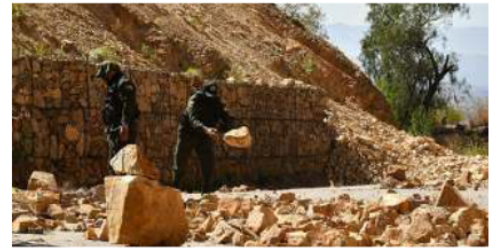
Integrantes del "verde olivo" remueven rocas del suelo durante un operativo de desbloqueo del Ejército y la Policía en Cochabamba

Paz decretó este sábado el estado de excepción para levantar los bloqueos de carreteras, una disposición que no supone la suspensión de derechos, pero sí prohíbe los bloqueos de vías y el uso de armas, explosivos y "ele-