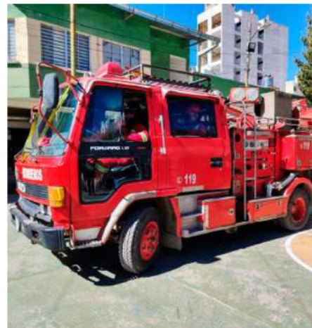
Bomberos realizarán operativos en la víspera de San Juan