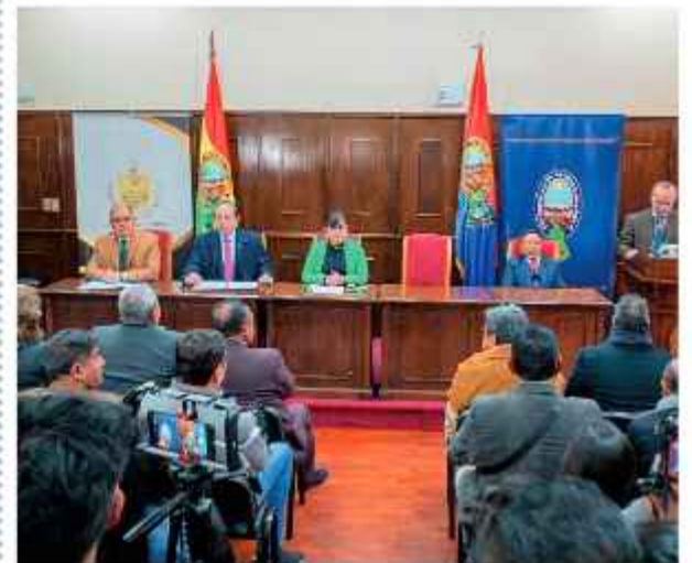
DATO. Autoridades de la UMSA y la Alcaldía se unen.

La Universidad Mayor de San Andrés y la Alcaldía de La Paz ayer sellaron una alianza estratégica histórica con el fin de transformar el conocimiento en soluciones concretas para la gestión edil, la ciudad y la ciudadanía en general.