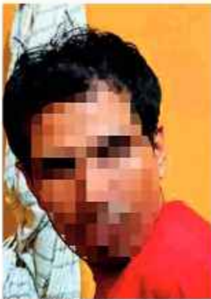
REO. El fugitivo recapturado en Santa Cruz.

El reo cumplía detención preventiva desde febrero de este año, fue imputado del delito de violencia familiar. Volverá nuevamente al penal cruceño de Palmasola.