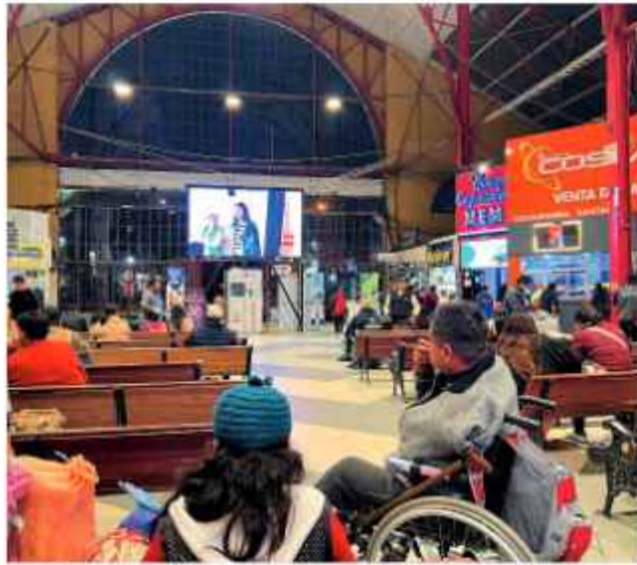
DATO. Fue uno de los sectores más afectados por bloqueos.

El movimiento vehicular y comercial retorna a las instalaciones de la Terminal de Buses de La Paz. La administración central del recinto autorizó la reanudación oficial de los viajes hacia todos los departamentos del territorio nacional, un hecho que pone fin a una inactividad forzada de casi 50 días a causa de los conflictos sociales registrados el país.