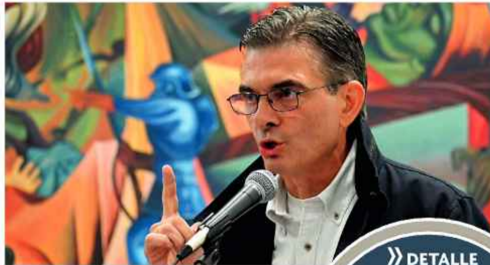
AUTORIDAD. Paz, en la Casa Grande del Pueblo.

El Mandatario emitió estas declaraciones luego de que los sectores movillizados despejaron las rutas después de más de 50 días de mantener las medidas de presión. Pese al levantamiento de los bloqueos, hay sectores que aún lanzan advertencias de una posible reorganización radical si no se cumplieran