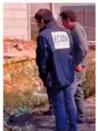
CRIMEN. Autoridades, en el lugar del hecho

Las autoridades chilenas ejecutan operativos de rastreo y recolección de evidencia testimonial para identificar y capturar al autor del crimen.