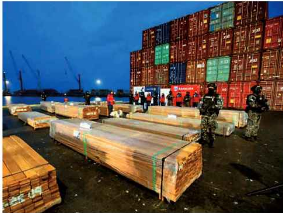
NARCOTRÁFICO. Autoridades de Chile en la incautación de la madera boliviana.