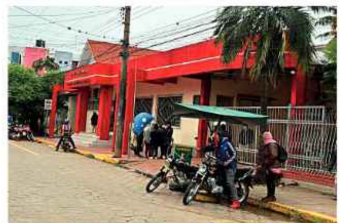
VIOLENCIA. La víctima se recupera en el Hospital de Montero.

Este intento de femicidio ocurre en un contexto de violencia de género en el país. La Fiscalía General del Estado reportó que, en lo que va del año, 43 mujeres fueron asesinadas en el país. El departamento de La Paz lidera la lista de fatalidades, seguido por Santa Cruz.