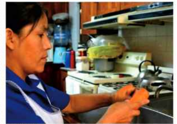
COCINA. Una trabajadora prepara alimentos.

La OIT enfatizó que el futuro del sector estará determinado por el envejecimiento poblacional, lo que elevará la necesidad urgente de formalizar este empleo vital.