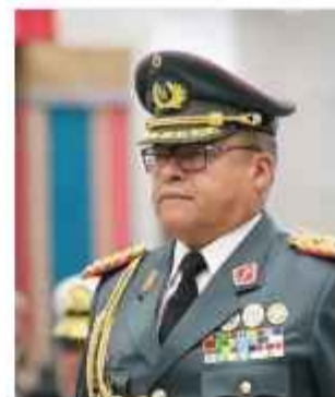
PERFIL. El exgeneral Zúñiga.

Los fiscales del caso adelantaron que la primera jornada servirá para la lectura formal de la acusación.