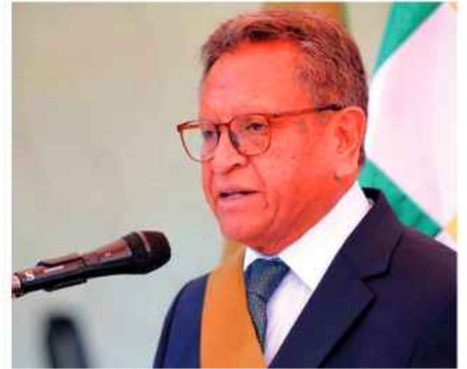
CONFERENCIA: Oviedo, en un contacto con los medios.

Además la interpelación es esta instancia a la ministra de Salud, Marcela Flores Zambrana, fue suspendida y reprogramada para el 3 de julio de 2026 a las 10:00.