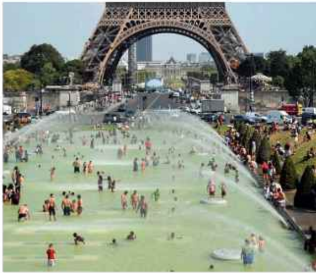
EXTREMO. Franceses sufren más calor que en 1947.