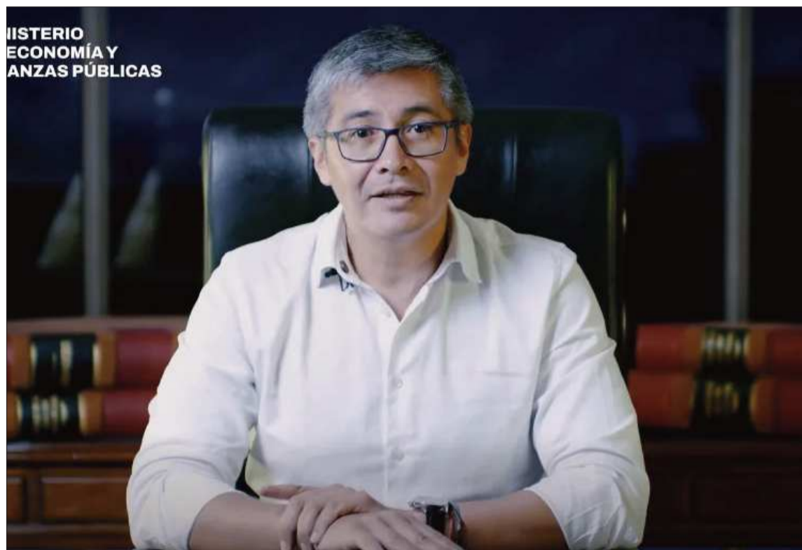
APERTURA. José Gabriel Espinoza, ministro de Economía, en una transmisión en sus redes sociales.

La autoridad señaló que uno de los principales objetivos es recuperar la capacidad de producción de alimentos, con el fin de evitar presiones futuras sobre los precios y prevenir nuevos incrementos de la inflación. “Queremos reconstruir el sector de producción de alimentos porque no queremos que