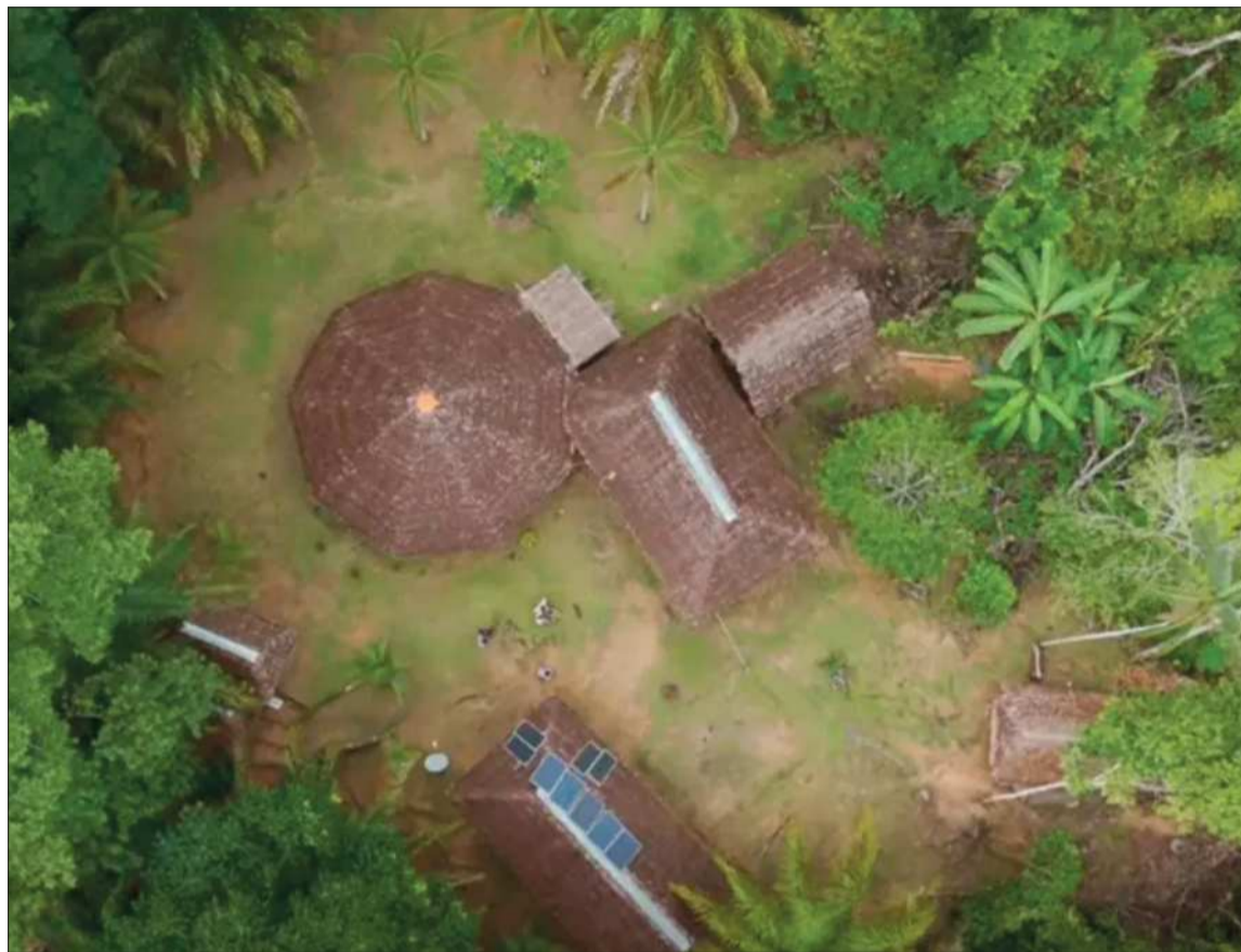
ECONOMÍA. La iniciativa Emprende Verde Bolivia en la region del oriente del país.

El proyecto trabaja con emprendedores, empresas e instituciones comprometidas con la sostenibilidad. Promoviendo prácticas responsables que permitan aprovechar de manera eficiente los recursos, reducir impactos