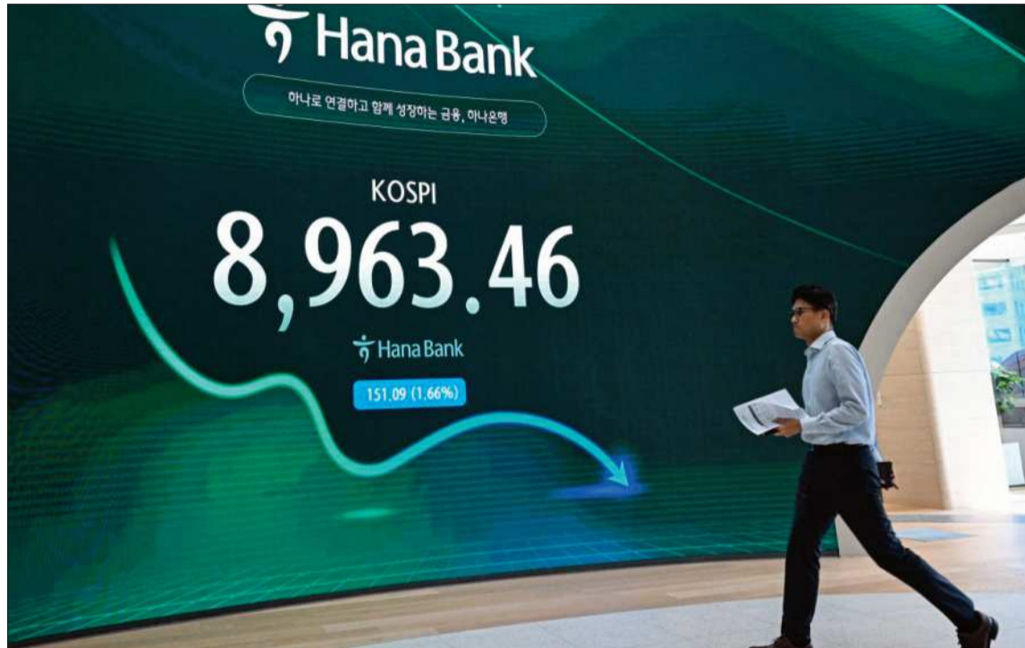
ECONOMÍA. En Asia las principales plazas cerraron con marcadas caídas.

En las primeras operaciones, Wall Street abrió con pérdidas marcadas pero hacia las 15.30 GMT fue recuperándose y el Dow