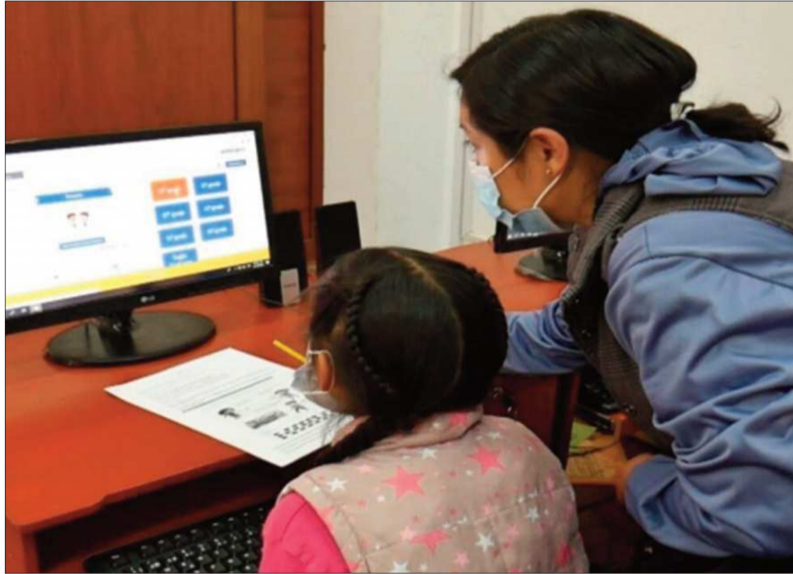
CLASES. Varios estudiantes pasaron clases a distancia debido a los conflictos sociales.

En criterio de Pimentel la dificultad radica, principalmente, en que muchas familias no tienen los medios suficientes para que sus hijos pasen las clases virtuales y el costo del internet resulta elevado.