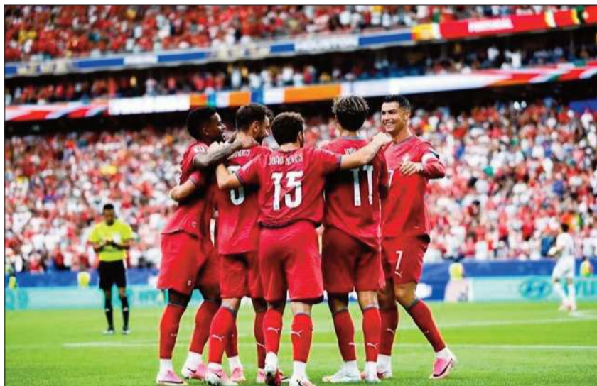
FAMILIA. CR7 es felicitado por sus compañeros.

Portugal salió con ganas de demoler. Así lo hizo saber el propio CR7