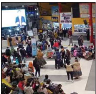
La Terminal de Buses de La Paz.

Los viajes entre oriente y occidente están totalmente habilitados