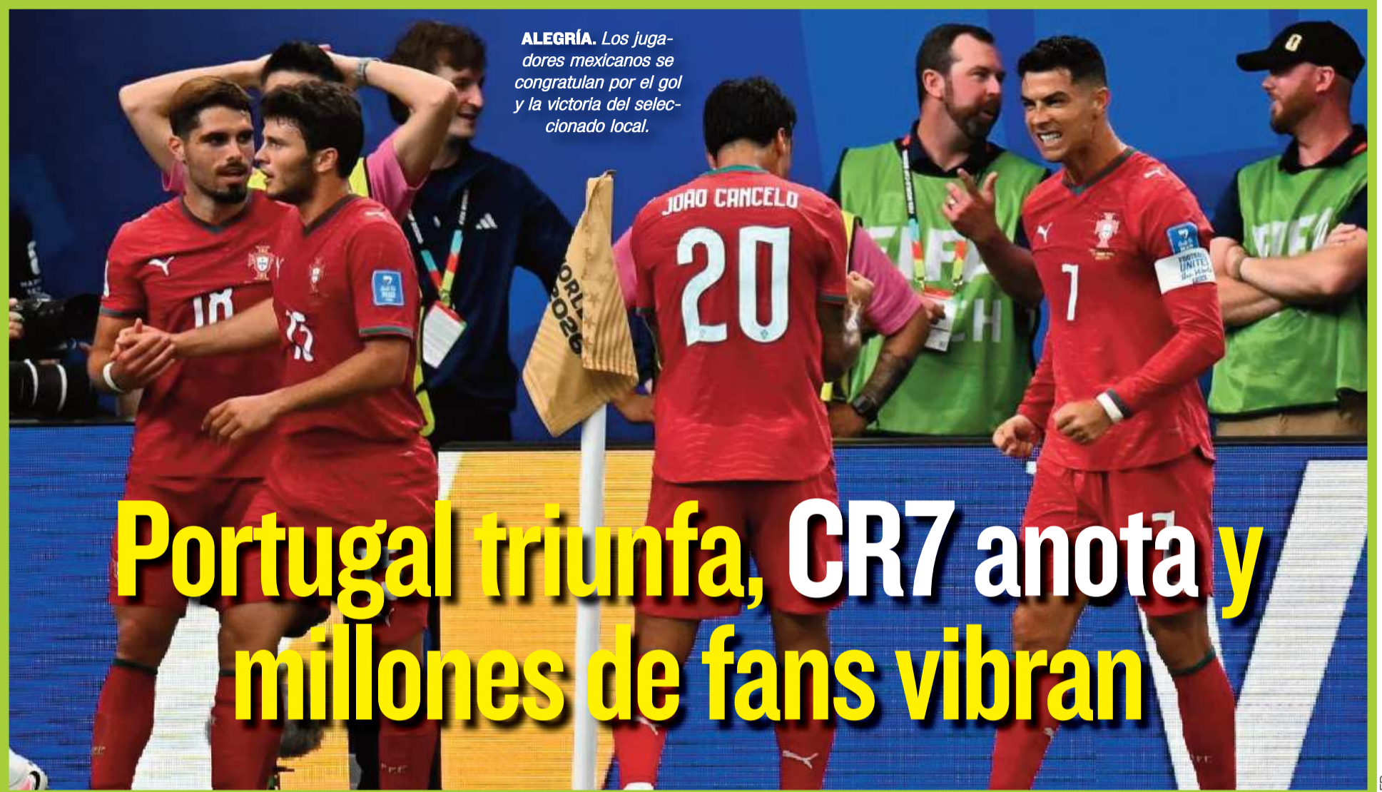
ALEGRÍA. Los jugadores mexicanos se congratulan por el gol y la victoria del seleccionado local.