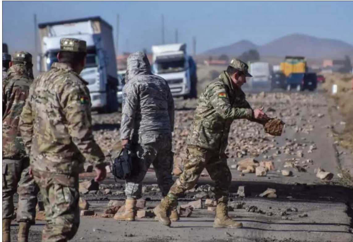
OPERATIVO. Militares y policías con ayuda de maquinaria realizan las labores de limpieza.

Además, resaltó el fin de los bloqueos en el país y dijo que es