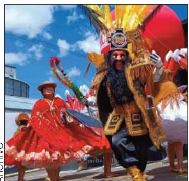
El baile de la morenada.

Se definió la nueva fecha de la festividad tras evaluar la pacificación del país