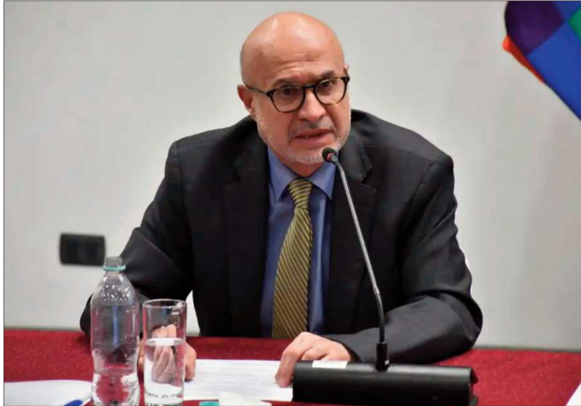
AUTORIDAD. El ministro de la Presidencia José Luis Lupo en conferencia de prensa.

En tanto, el ministro de la Presidencia, José Luis Lupo, afirmó que el país atraviesa un momento de transición después de más de 50 días de conflictos y destacó que el Estado de excepción per-