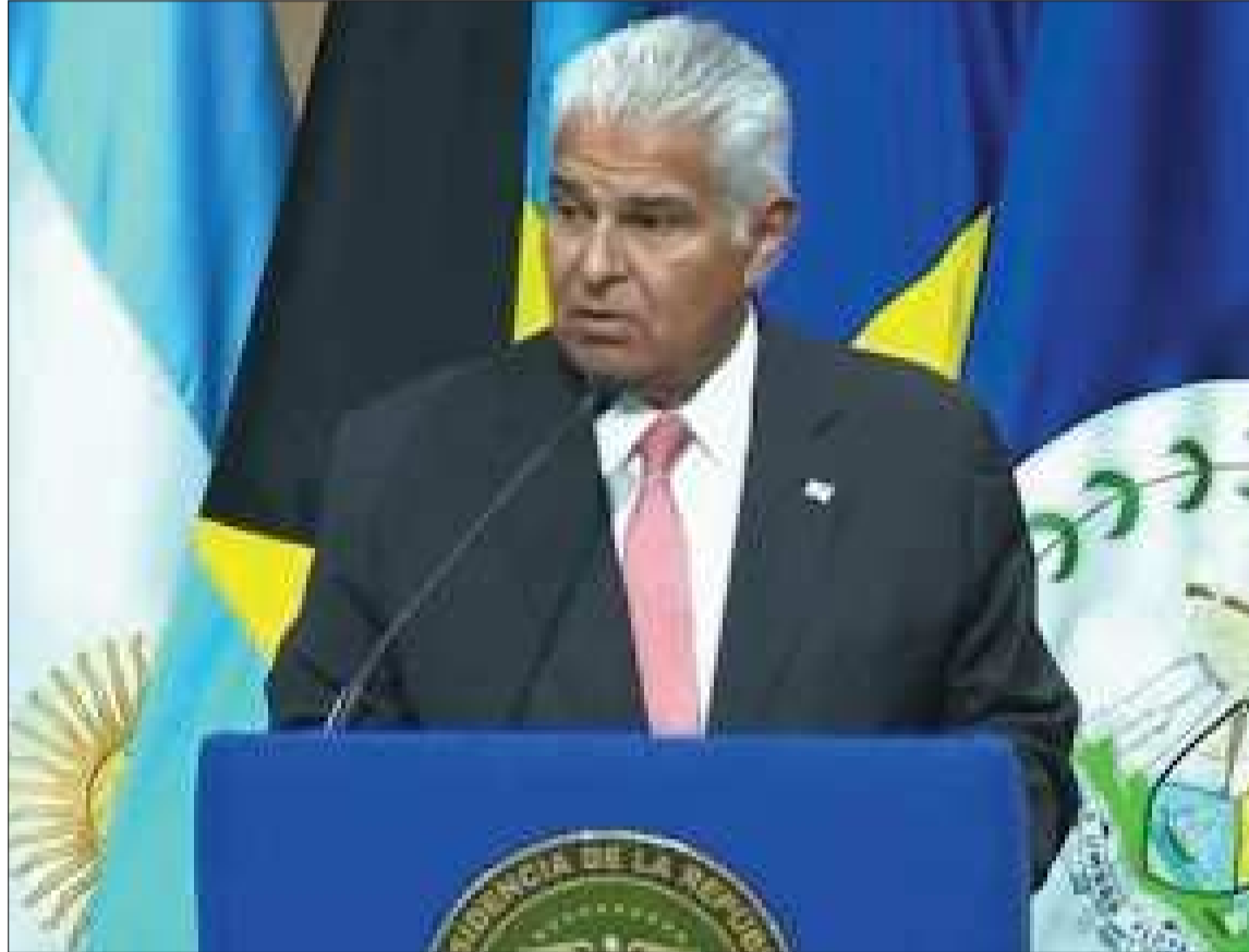
PARTICIPACIÓN. El presidente de Panamá, José Raúl Mulino Quintero, durante su intervención en la OEA.

Asimismo, anunció el impulso de una resolución de apoyo a Bolivia ante la Asamblea General, reafirmando el compromiso de los países del hemisferio con la defensa de la democracia y el rechazo a cualquier intento de alteración del orden constitucional.