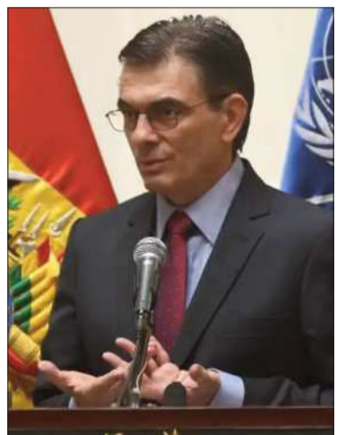
El presidente Rodrigo Paz.

Paz señaló que la prioridad es que llegue en buenas condiciones