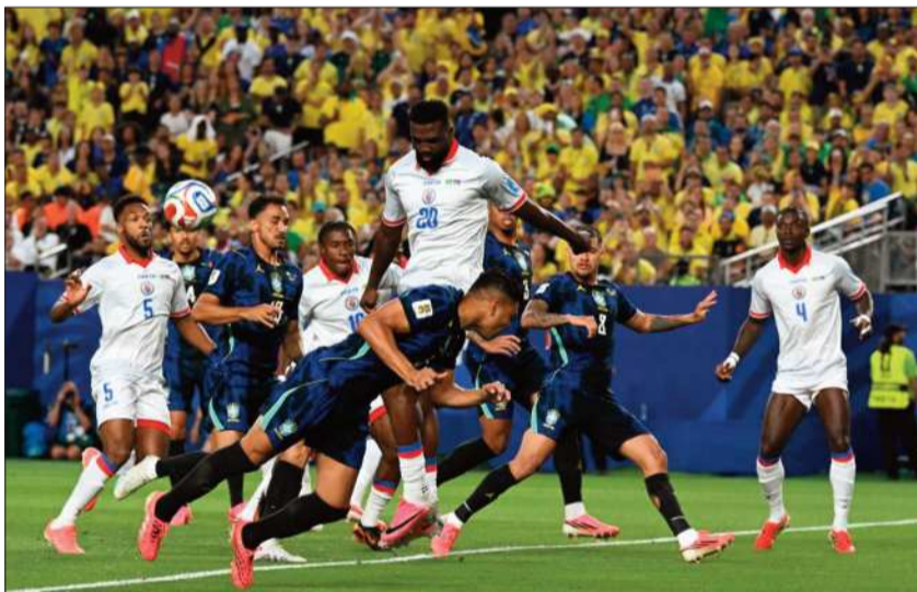
INCIDENCIA. Una acción del partido que brasileños y haitianos disputaron.

¿Encontró goleador? El atacante del Manchester United marcó sus dos primeros goles (23', 36') en la mayor pasarela del fútbol y, sobre todo, dio color a un ataque que frente a los marroquíes fue muy gris.