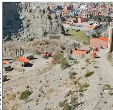
Hay construcciones ilegales

A finales de abril de 2019, cerca de 70 viviendas se desplomaron en el lugar.