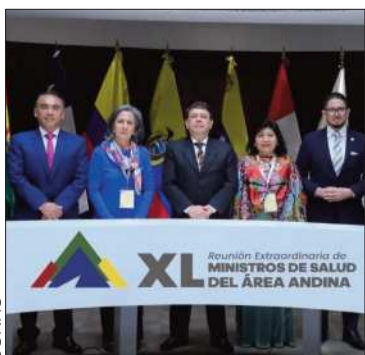
Representantes de ORAS.

Bolivia, Chile, Colombia, Ecuador, Perú y Venezuela aprobaron acuerdos