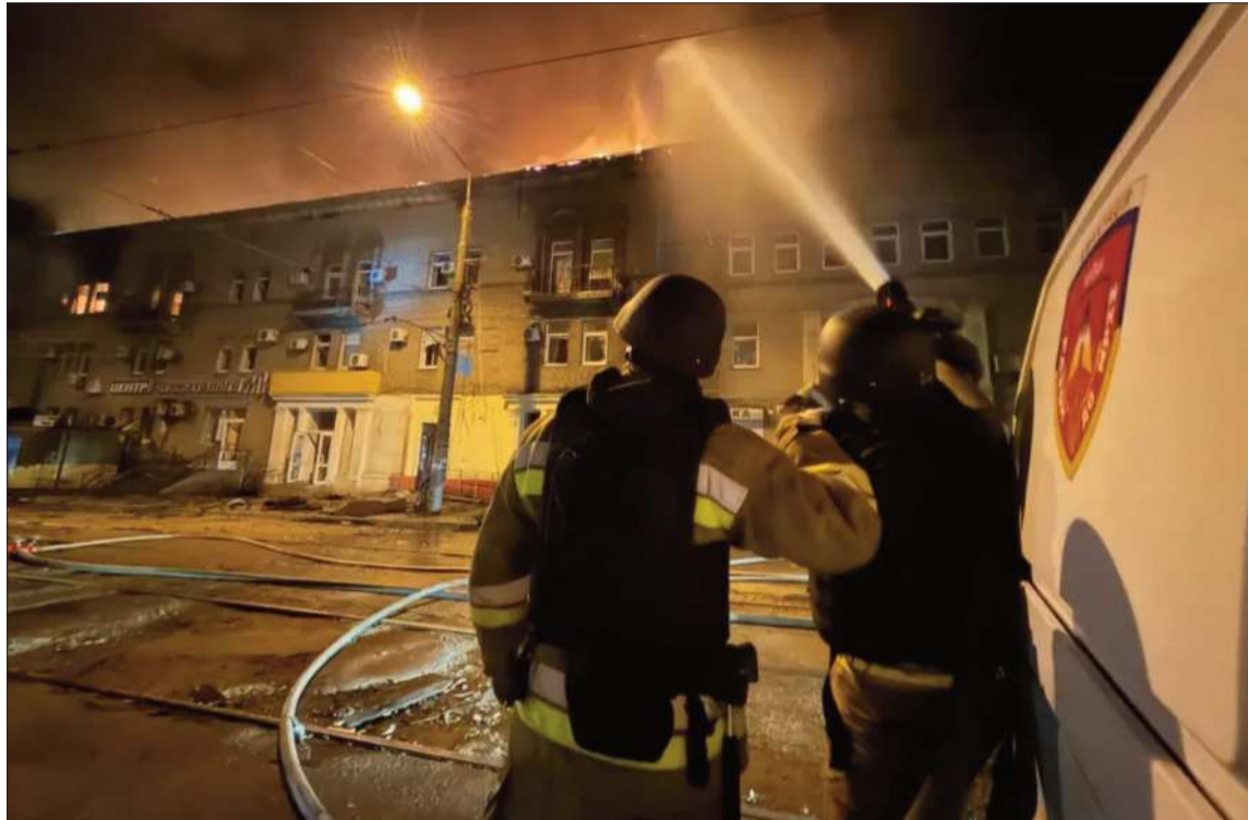
GUERRA. Los bombardeos alcanzaron a varias ciudades de Ucrania, después de una ofensiva ucraniana.

El jueves, drones rusos también atacaron dos barcos civiles en el mar Negro el jueves por la noche, y causaron un muerto y