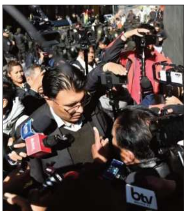
El senador Nilton Condori.

La denuncia se basa en las acciones del senador para promover bloqueos