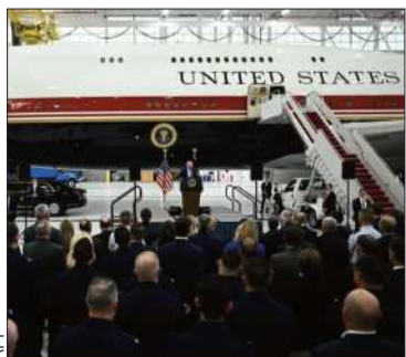
El nuevo avión, el Air Force One.

El fuselaje lleva la inscripción ‘Estados Unidos de América’.