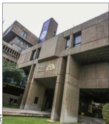
Sede del CEEA, en Lima, Perú.

El organismo reafirmó su confianza en la capacidad para alcanzar los acuerdos