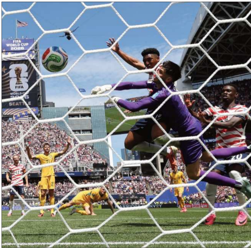
GOL. Una de las anotaciones del seleccionado de los Estados Unidos.

Australia se jugará el pase a dieciseisavos en su último duelo en el Grupo D, ante Paraguay, en una tercera fecha donde Estados Unidos buscará frente a Turquía amarrar el liderato y confirmarse como una de las sensaciones de este arranque de su Mundial y ganador de grupo.