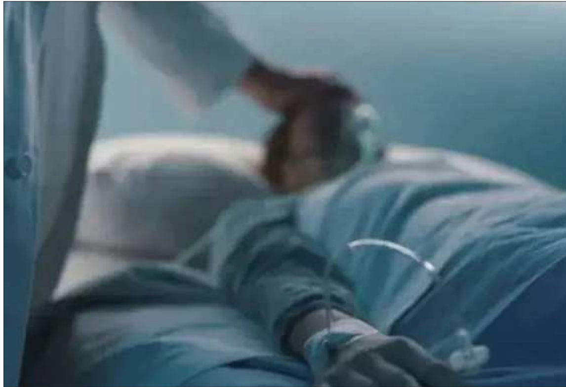
DENUNCIA. Cinco pacientes con cáncer fallecieron debido a que los bloqueos en las carreteras.

“Hay muchos pacientes para cuidados paliativos que no son atendidos a tiempo. Necesitamos hacer mucho trabajo en prevención para que los pacientes lleguen a tiempo. Tenemos dos ambulancias que conseguimos de la anterior gestión, pero ahora no hay ni gasolina, ni diésel. Más los bloqueos y la falta de medicamentos, los médicos no han podido llegar a atender a los domicilios”, relató.