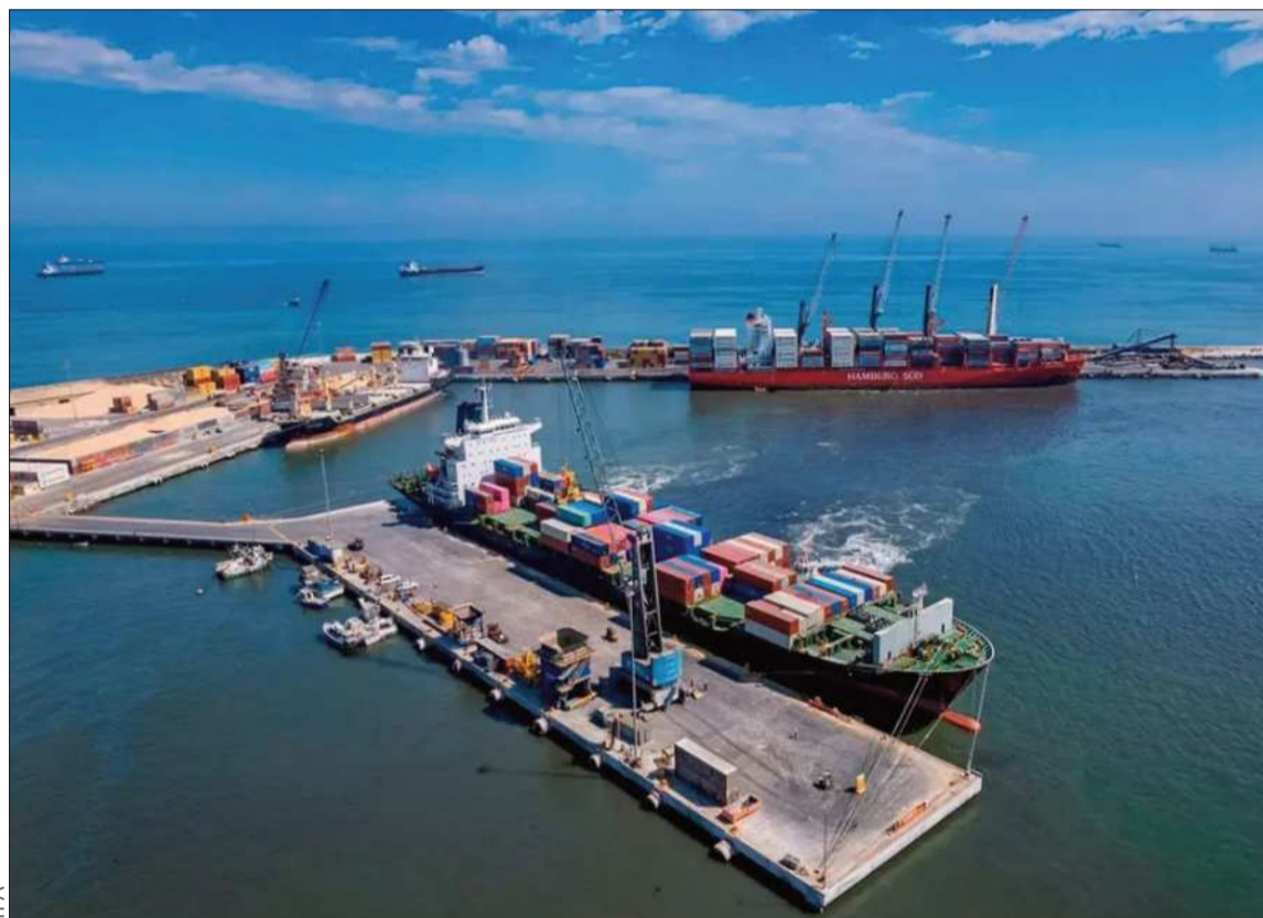
MOVIMIENTO. Una vista aérea de la terminal del Puerto de Arica, Chile.