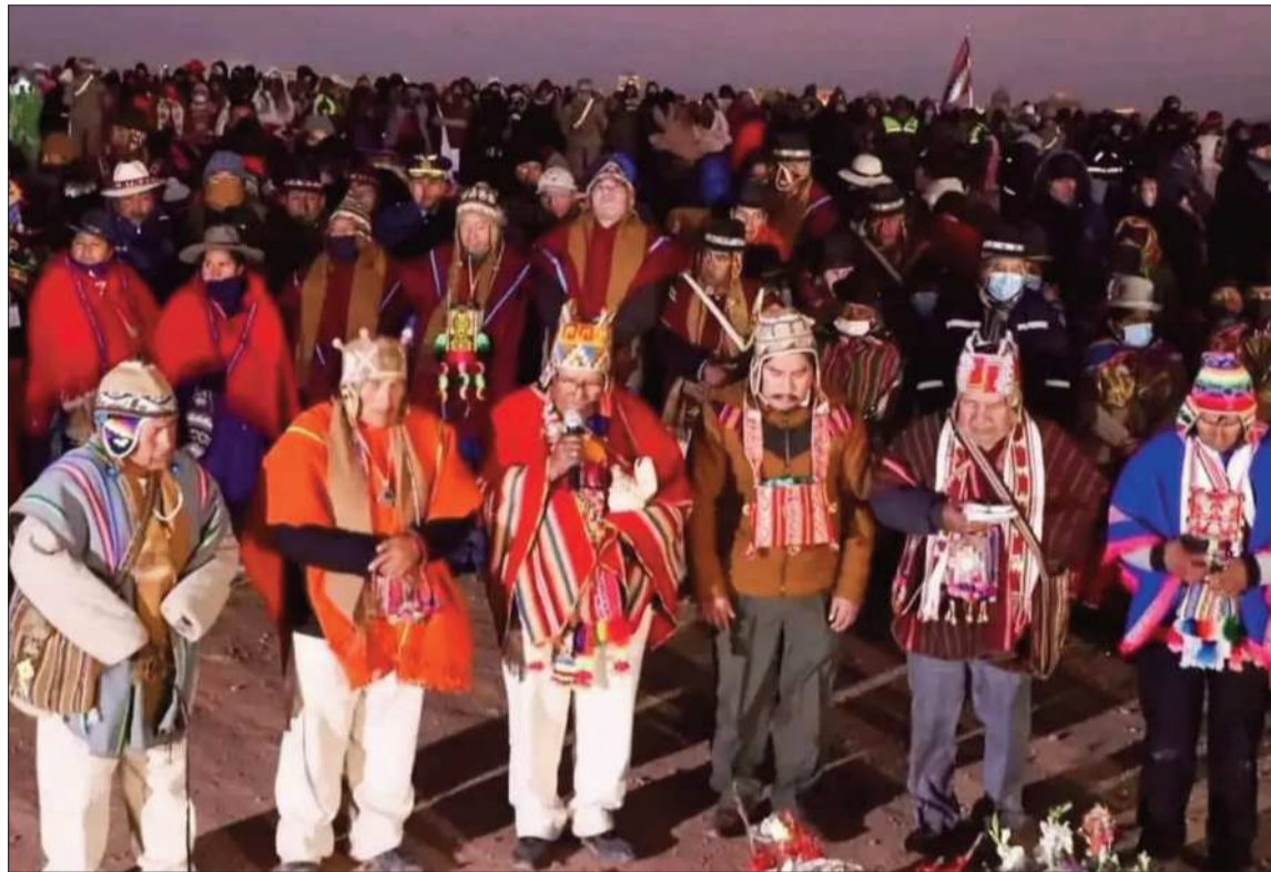
MEDIDA. Tiwanaku recibió una masiva afluencia de personas durante la pasada gestión.

Decenas de familias aprovechaban la asistencia de los visitantes para ofertar sus productos. Chura explicó que la suspensión de las actividades abiertas al público afectará significativamente