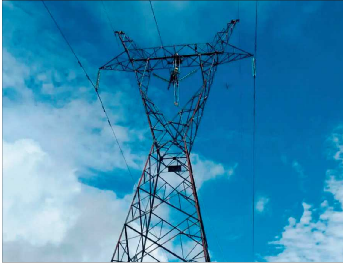
ENERGÍA. Una torre de transmisión sostiene las líneas eléctricas del Sistema Interconectado Nacional.

Por otra parte, el departamento de Tarija concentra gran parte de las exportaciones de energía eléctrica del país. Tanto en 2025 como en el primer cuatrimestre de 2026, los envíos tuvieron origen en esta región, que se consolida