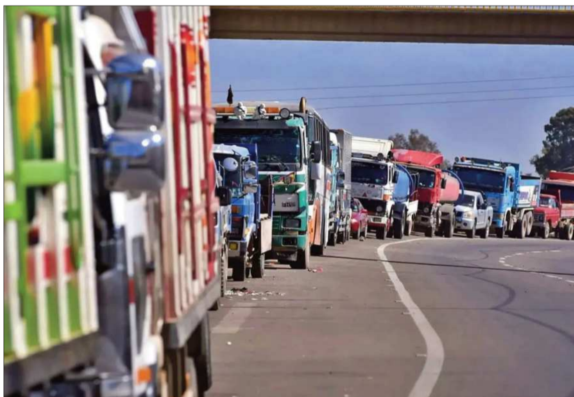
PERJUICIOS. Camiones varados en medio de la carretera durante los días de bloqueo.

La entidad señaló que las dificultades para el transporte de materias primas, insumos y productos terminados afectan