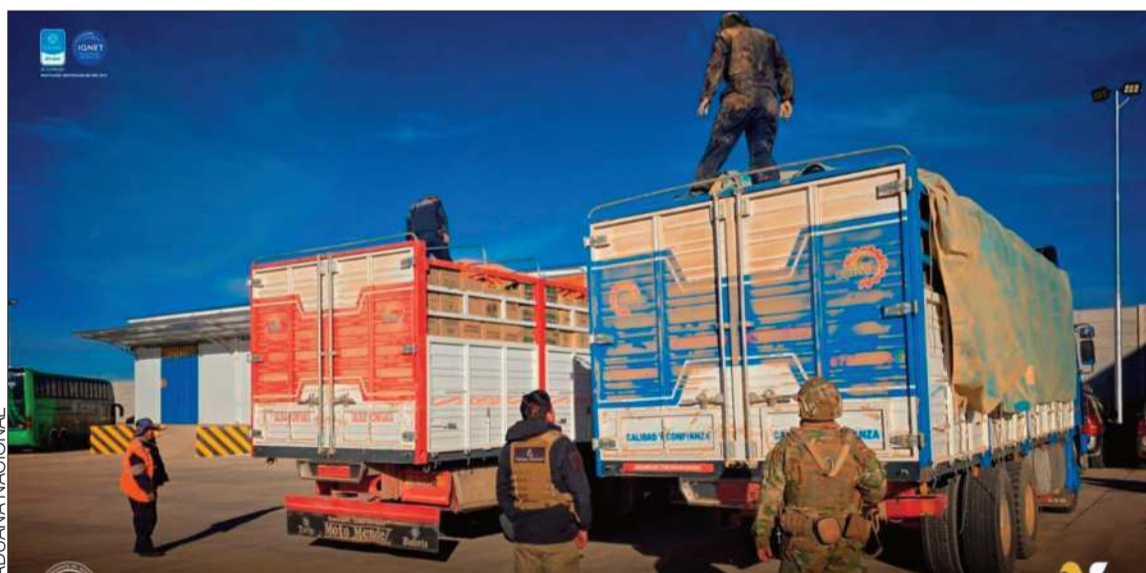
CONTROL. Pese a las dificultades se continúan con los controles para evitar actividades ilegales.