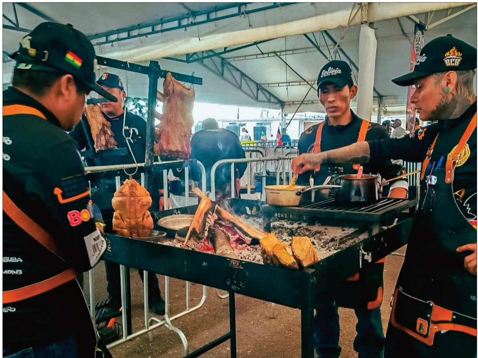
COCINA. Hombres, uniformados con mandiles de cuero y gorras, atienden una gran parrilla sobre la que se asan diversos cortes de carne.

La propuesta contempla la exención temporal del Impuesto al Valor Agregado (IVA), el Impuesto a las Transacciones (IT) y el Impuesto sobre las Utilidades de las Empresas (IUE) durante el