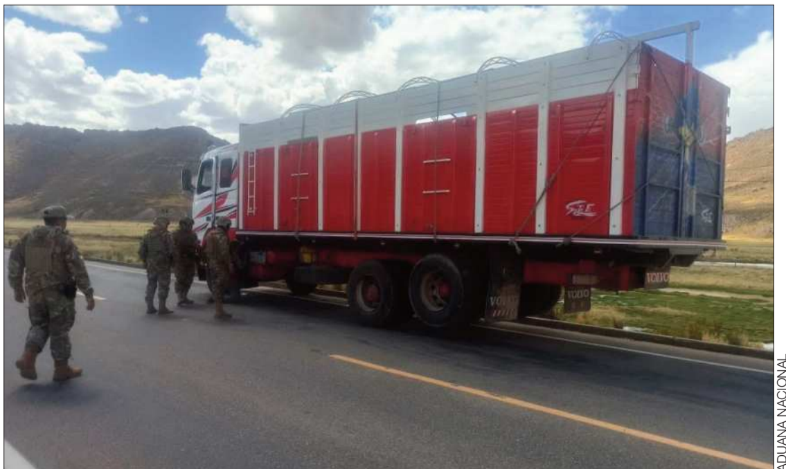
OPERATIVOS. Algunos grupos operativos continúan trabajando en algunos puntos.

En donde hubo una reducción fue en lugares frecuentes como Guaqui, ahí no hubo mucho contrabando, por la disminución del tráfico vehicular y de personas. El viceministro aseguró que, si bien los resultados no son los mismos, por el efecto de los bloqueos, el trabajo de control e interdicción al contrabando no se detuvo y continuó a pesar de las dificultades originadas por los conflictos sociales.