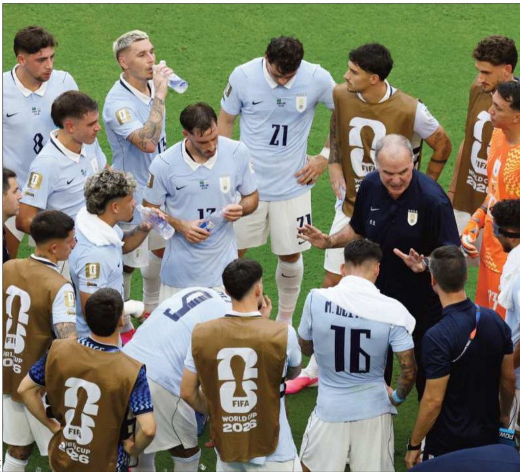
INSTRUCCIONES. El entrenador argentino Marcelo Bielsa da pautas a sus dirigidos en la Celeste.

2 títulos mundiales tiene Uruguay: 1930 y 1950.