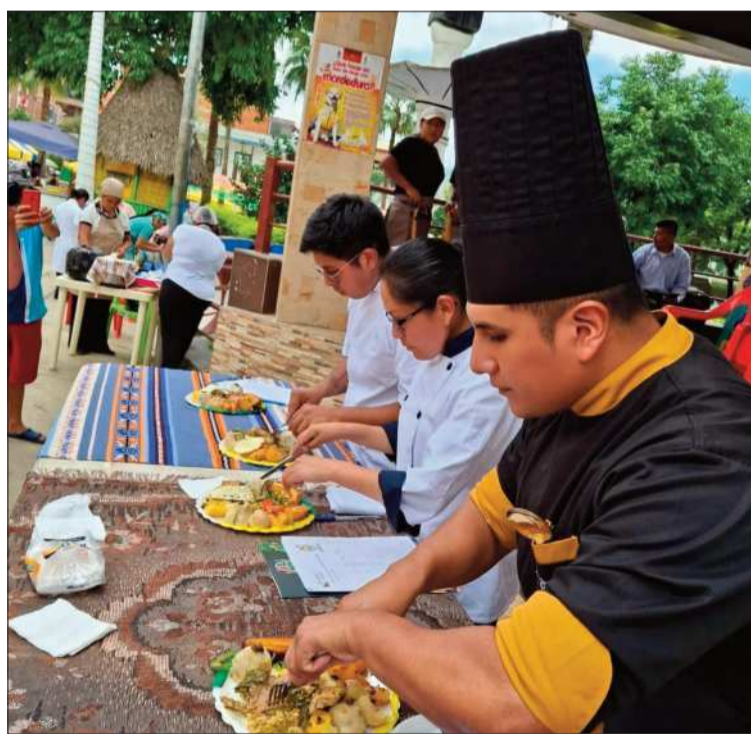
CONTROL. Un experto evalúan la presentación y el sabor de platos.

Por otro lado, ASERAC solicitó ajustes normativos en materia laboral que respondan a las particularidades de la actividad gastronómica. "No es lo mismo aplicar la Ley General del Trabajo a la minería que a la gastronomía. Buscamos adecuaciones en las jornadas laborales, facilidades para la importación de insumos y la posibilidad de elaborar reglamentos específicos dentro de nuestras instituciones gastronómicas", explicó Dalence.