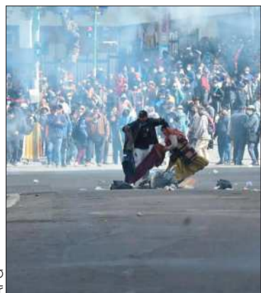
Una protesta en La Paz.

Hay grupos que buscan influir en movilizaciones con fines políticos