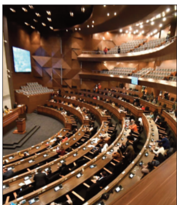
Sesión de Asamblea Legislativa.

La mayoría de diputados y senadores dieron luz verde a la normativa