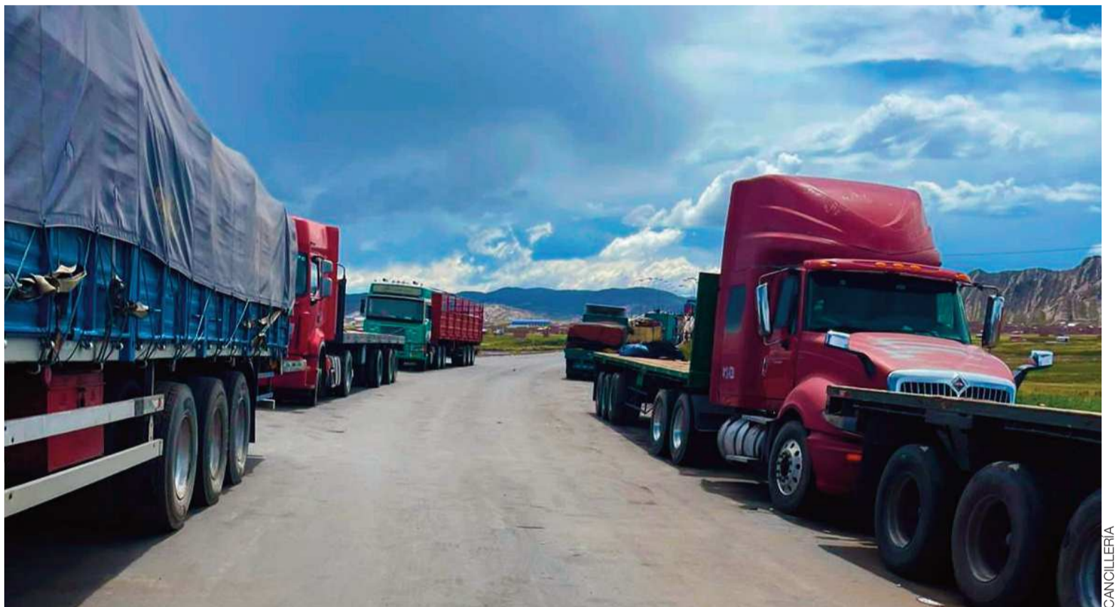
PERJUICIO. Cientos de camiones permanecen varados en diferentes carreteras muchos con carga internacional.

En cuanto a los trámites de exportación, la afectación alcanza el