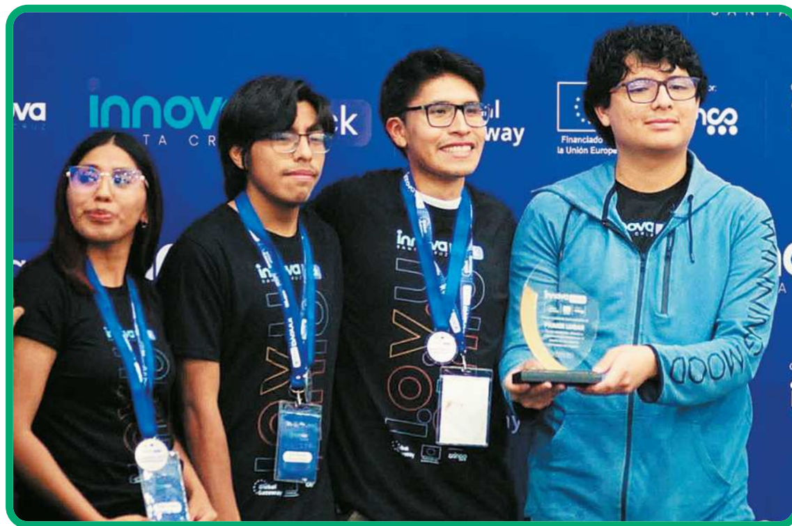
SANTA CRUZ INNOVA

NexoLab llegó a Santa Cruz con seis integrantes: cuatro de