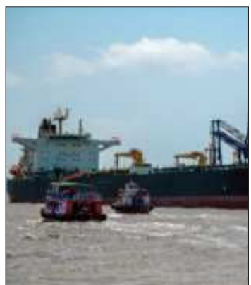
Los buques volvieron a navegar.

Ataque. En el sur de Líbano, las tropas israelíes se enfrentaron a Hezbolá