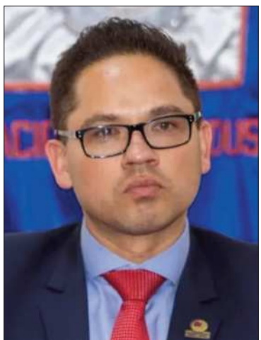
El presidente de la CNI.

El sector pidió seguridad jurídica a inversiones nacionales y extranjeras