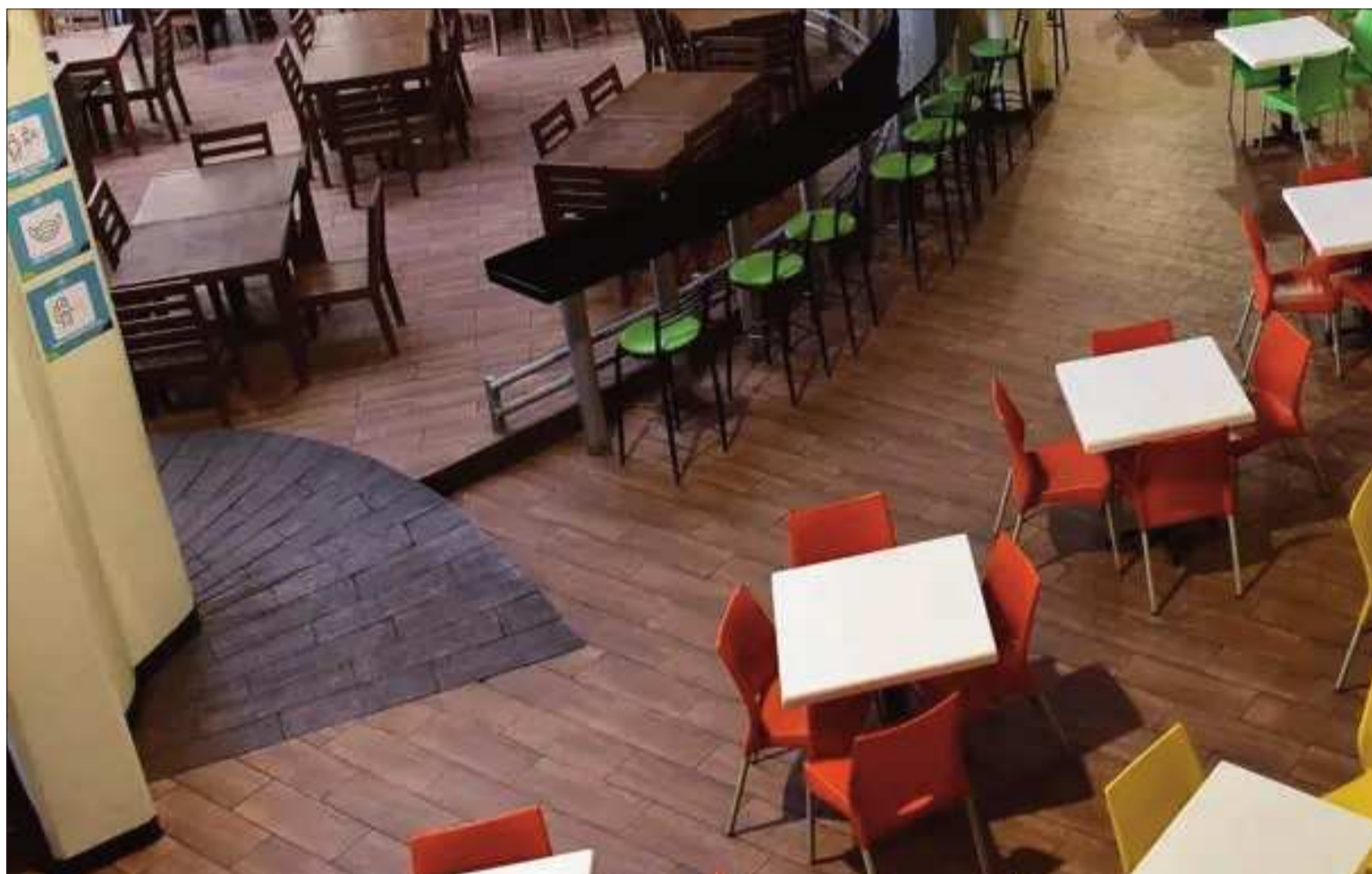
COMERCIO. Imagen referencial de un patio de comidas que generalmente está abierto para la atención de sus clientes.

Progreso Económico Empresarial (IPEE), la economía naranja genera alrededor de Bs 870 millones al año en Cochabamba, de los cuales el 49% corresponde al sector gastronómico.