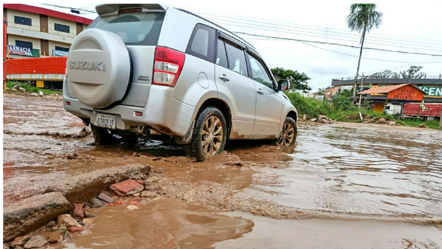
Los motorizados caen en los pozos llenos de barro y lodo, en el noveno anillo de la radial 17 y medio

En la avenida Prefectural, zona del noveno anillo del Plan Tres Mil, un tramo de diez metros quedó sin pavimentar y a los conductores les resulta imposible esquivar los charcos que se forman.