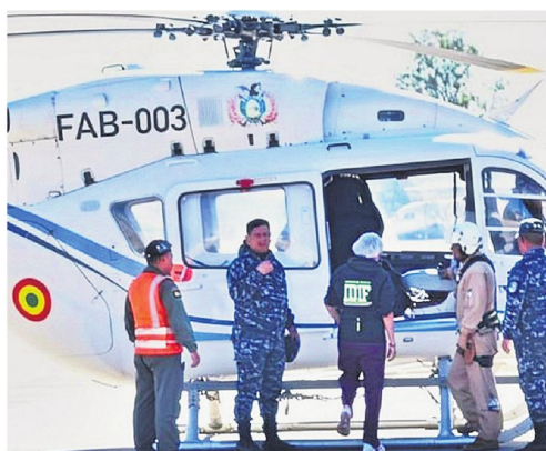
Personal de la Fiscalía durante la recuperación de los cuerpos.

La Fuerza Aérea informó que la aeronave despegó de El Alto y mantuvo inicialmente comunicación con los servicios de tránsito