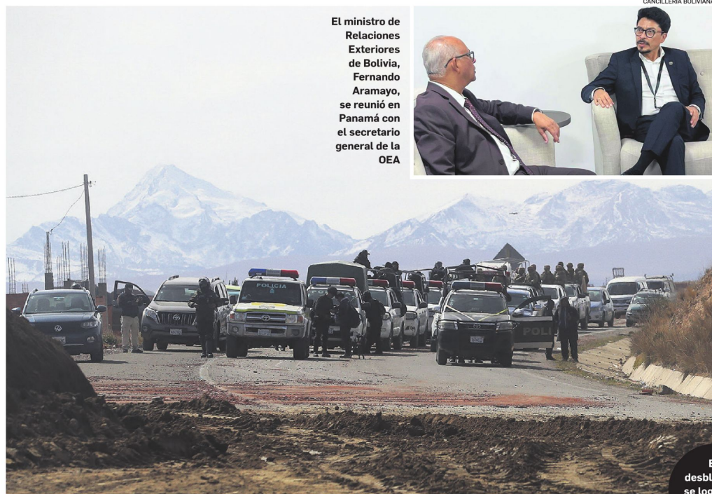
El ministro de Relaciones Exteriores de Bolivia, Fernando Aramayo, se reunió en Panamá con el secretario general de la OEA