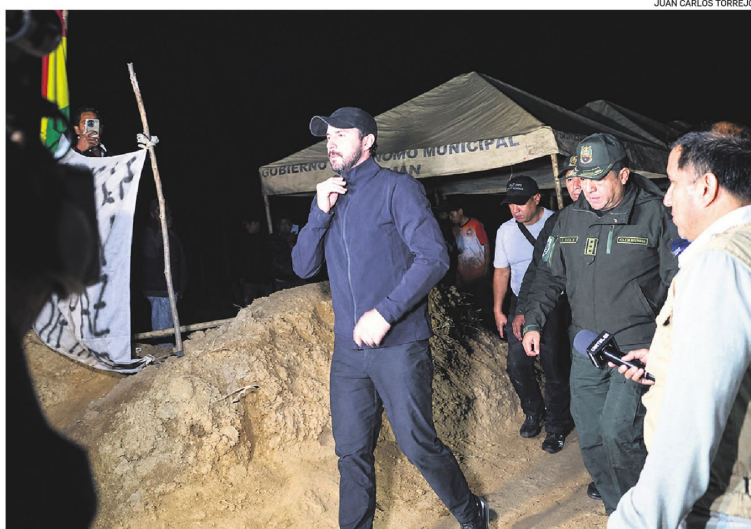
El gobernador de Santa Cruz sale de San Julián tras la negociación y los acuerdos alcanzados.

El acuerdo incluye demandas relacionadas con infraestructura vial, servicios básicos, tierras y seguridad. Uno de los principales compromisos es la construcción de la carretera de 60 kilómetros hacia la primera Brecha Casarabe. La Gobernación anunció que financiará una primera etapa de 10 kilómetros, cuyo inicio está previsto hasta octubre de 2026 y cuya conclusión se proyecta para 2027.