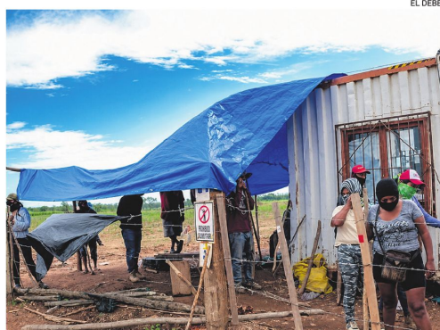
Un grupo de comunarios interculturales en una tierra tomada.

El jurista calculó que entre ocho y diez propiedades, con más de 21.000 hectáreas, están afectadas. Denunció además que en Santa Rita hay trabajadores restringidos dentro del campamento y grupos