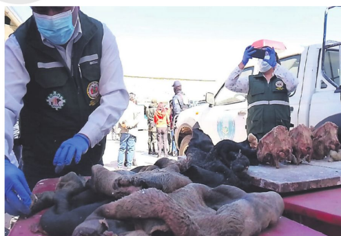
Cueros y partes de mascotas halladas en los basureros en El Alto.

Uno de los problemas de El Alto es la falta de control de perros callejeros