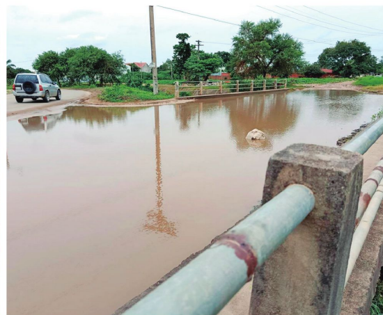
En el séptimo anillo de la avenida Pedro Vélez hay un tramo que quedó a medias y no se ha podido habilitar. A pocos metros, hay un puente que está inutilizado y permanece anegado

lor de cabeza. Vive en el barrio Las Gramas, donde hasta hace seis meses, cuando llovía, cerraba las puertas de su casa y evitaba salir para no mojarse. Sin embargo, ahora cuando cae el aguacero tiene que abrir la puerta para sacar el lodo que entra hasta el fondo de su vivienda. "Cuando la calle era de tierra nada de esto pasaba", relata.