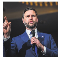
Vance encabeza misión en Suiza

Además en una entrevista con Fox News Trump advirtió a Teherán sobre el cierre del estrecho de Ormuz afirmando que si eso ocurre "ya no tendrían país e incluso ni siquiera podrían regresar al suyo" en una aparente referencia al equipo negociador iraní. (EFE)