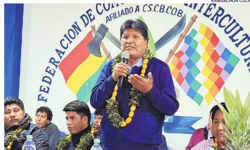
Evo Morales, líder de los campesinos del Trópico de Cochabamba

Campesinos del Chapare resisten el estado de excepción y desafían al Gobierno de Rodrigo Paz