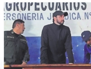
SAN JULIÁN: El gobernador Velasco y los movilizados dialogan para liberar la ruta hacia el Beni

OPERATIVO Militares avanzan en Parotani en una vía despejada. Se reactiva la normalidad