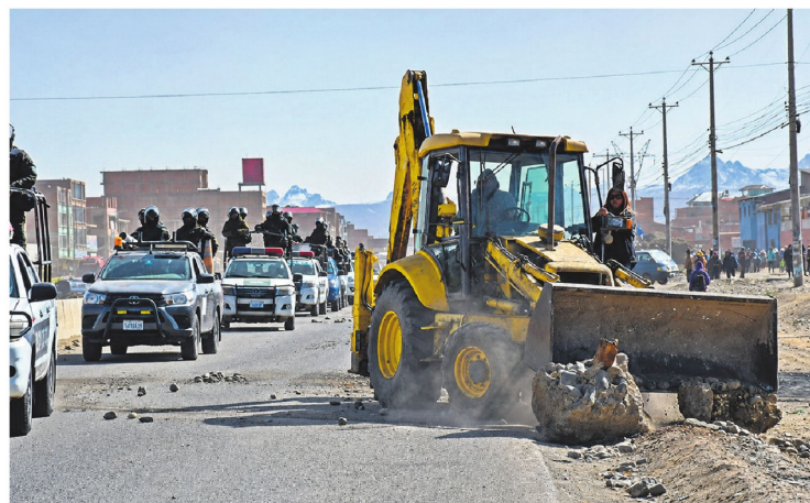
Equipo pesado resguardado por agentes de la Policía ayer durante el operativo de desbloqueo en El Alto

Las operaciones combinadas no enfrentaron resistencia. Hay respaldo político con críticas a la demora presidencial