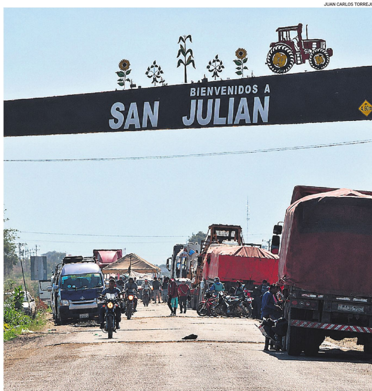
Así lucía ayer la carretera que pasa por San Julián. Hay expectativa por la firma de un acuerdo.

La Gobernación informó que dispone de Bs 22 millones para iniciar en unas tres semanas los