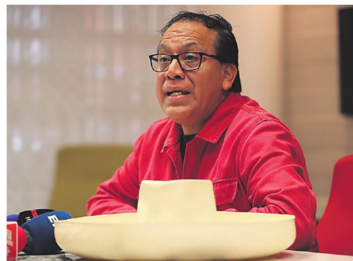
El izquierdista Sánchez no se resigna a perder en el balotaje

Con el escrutinio al 99,64 %, Fujimori tiene el 50,11 % de los votos válidos frente al 49,88 % de Sánchez, con una diferencia entre ambos de 41.633 votos, pero los