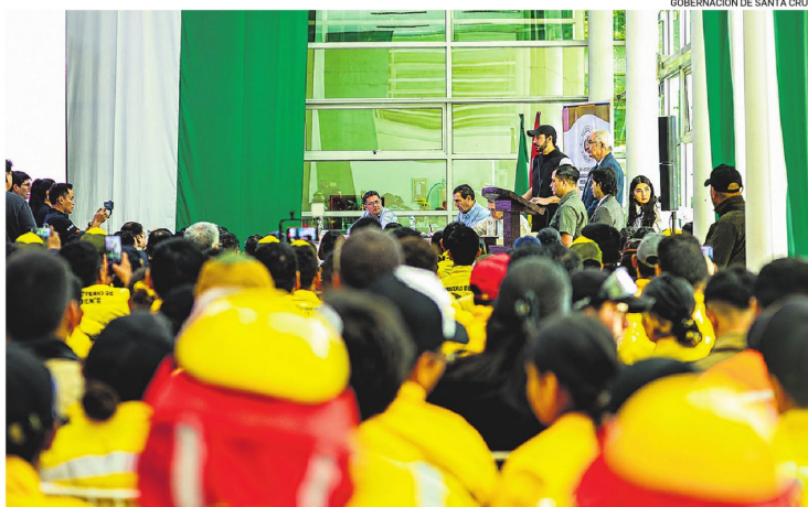
Los bomberos tuvieron un encuentro nacional, con el tema de prevención de incendios forestales

El gobernador Juan Pablo Velasco recibió ayer equipamiento y participó de un encuentro nacional de bomberos voluntarios