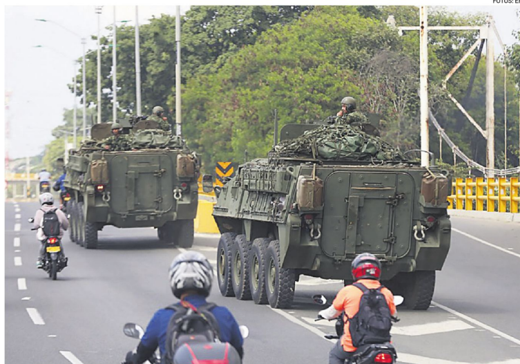
Vehículos blindados del Ejército colombiano patrullando en una avenida de la ciudad de Cali

Todas las encuestas para la segunda vuelta dan como favorito a De la Espriella, llamado 'el Tigre' por sus seguidores, con una intención de voto que varía entre el 48,6 % del Centro Nacional de Consultoría y el 50,9 % de AtlasIntel, en tanto que Cepeda se mueve entre el 43,1 y el 44,7 %.