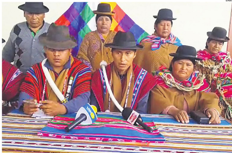
Dirigentes de las federaciones de campesinos de La Paz, Túpac Katari y Bartolina Sisa

Tras el acuerdo entre el Gobierno y la COB que instruyó levantar todos los bloqueos y la posterior declaratoria de estado de excepción, los campesinos paceños se