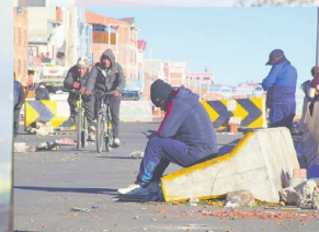
AISLADO: El Chapare permanece cercado. El flujo de carga y pasajeros se liberó por los valles