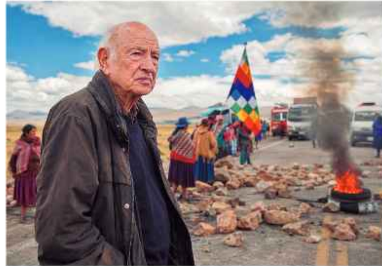
Homenaje del autor al filósofo francés Edgar Morin, fallecido en pasado 29 de mayo. Imagen hecha con inteligencia artificial.

El Decreto Supremo 5516, promulgado el 20 de enero, ilustra con precisión clínica esa advertencia. El gabinete económico bus-