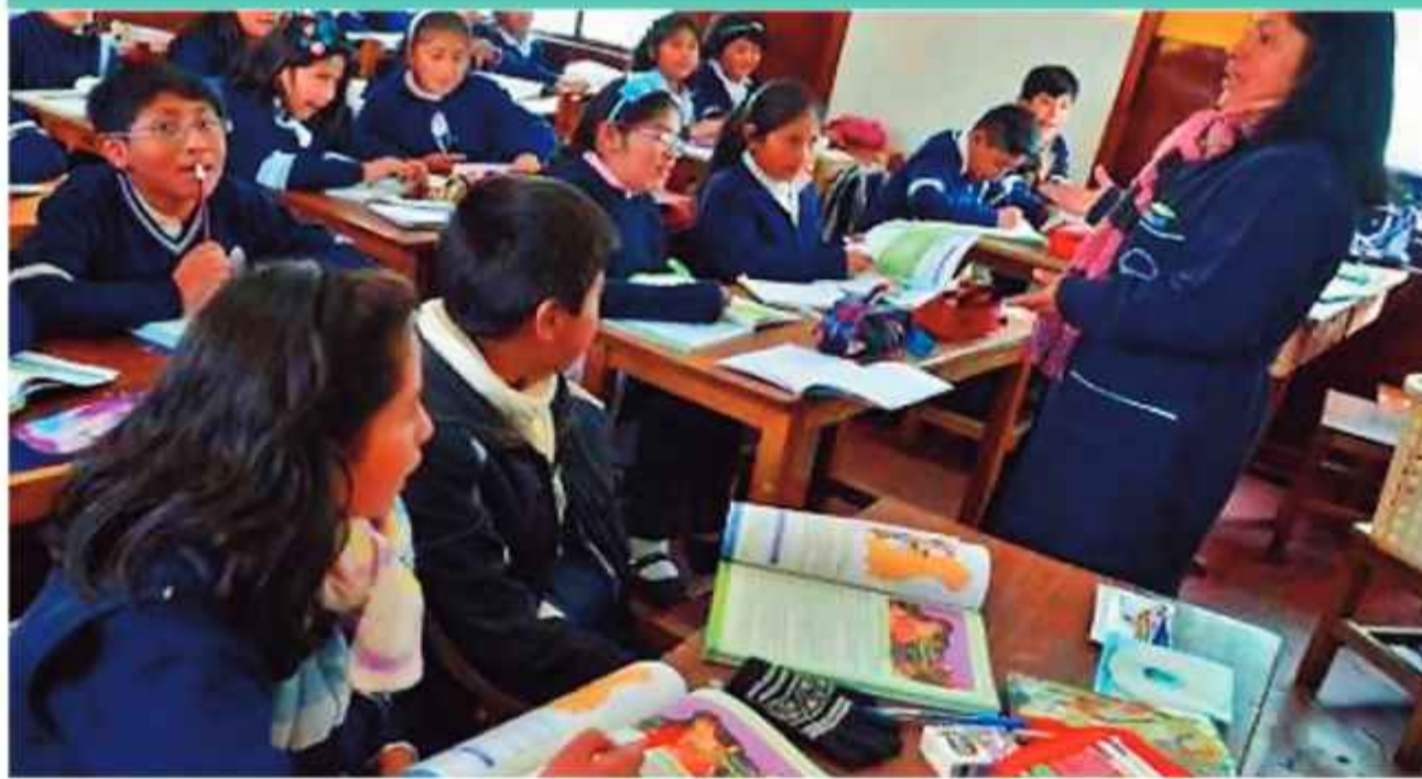
PRESENCIAL. La imagen de archivo muestra a niños pasando clases dentro del aula.