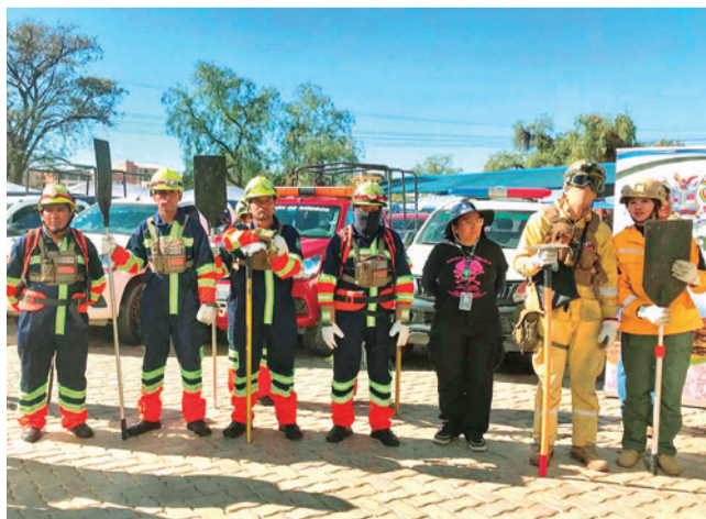
Brigadas de emergencia contra incendios. DANIEL JAMES

Dato. Las autoridades señalan que en comparación con gestiones pasadas los índices registrados durante esta época muestran una reducción y además anuncian operativos ambientales y sanitarios