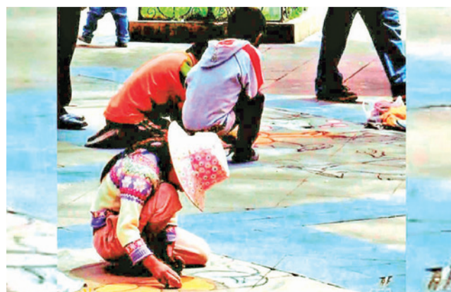
Niños trabajadores (imagen ilustrativa).

En el marco del Día Mundial contra el Trabajo Infantil, la entidad municipal informó que durante los primeros cinco meses de la gestión 2026 se identificó a 67 niñas, niños