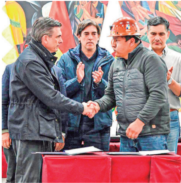
La firma del acuerdo, la noche del viernes en La Paz.

Además, ambas partes coincidieron en la necesidad