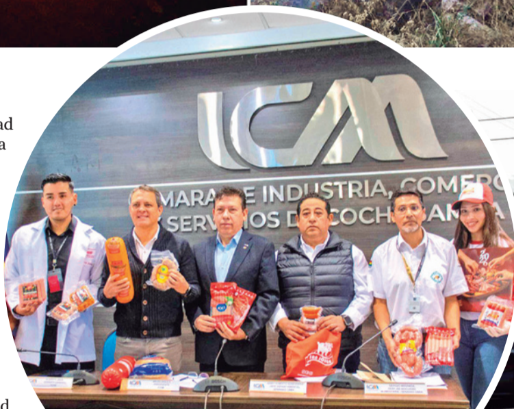
Presentan la lista de embutidos autorizados. ICAM

Según los registros, la zona sur del municipio suele presentar los mayores índices de