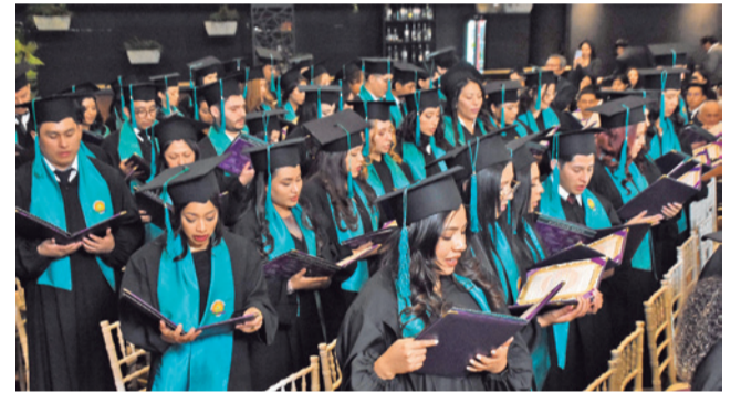
Ceremonia. Juramento Hipocrático de los titulados de la UNITEPC.

Felicidades flamantes titulados, ¡Éxito en esta nueva etapa de sus vidas!