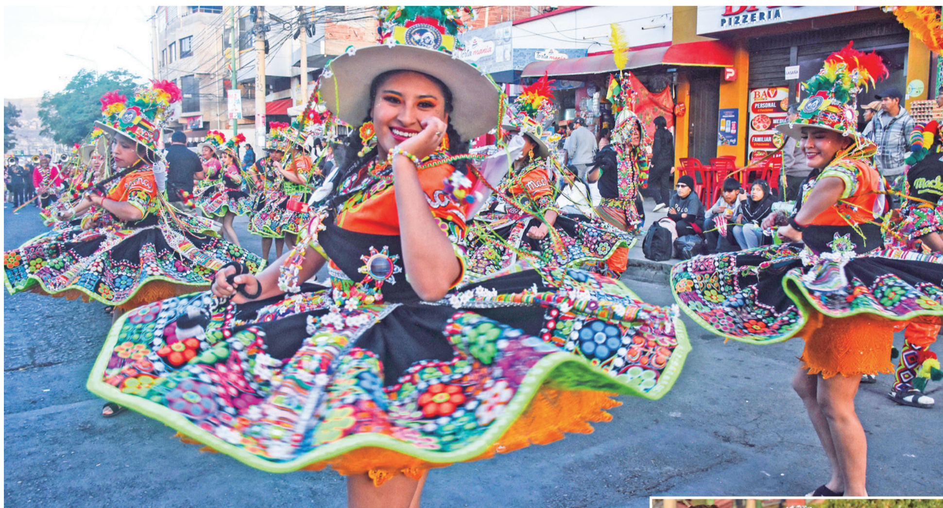
La alegría de las jóvenes danzarinas del tinku, en la entrada folklórica de Huayra K'assa.