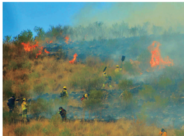
Incendios elevan la contaminación del aire. CARLOS LÓPEZ

contaminación durante San Juan debido a la mayor cantidad de fogatas en el lugar.