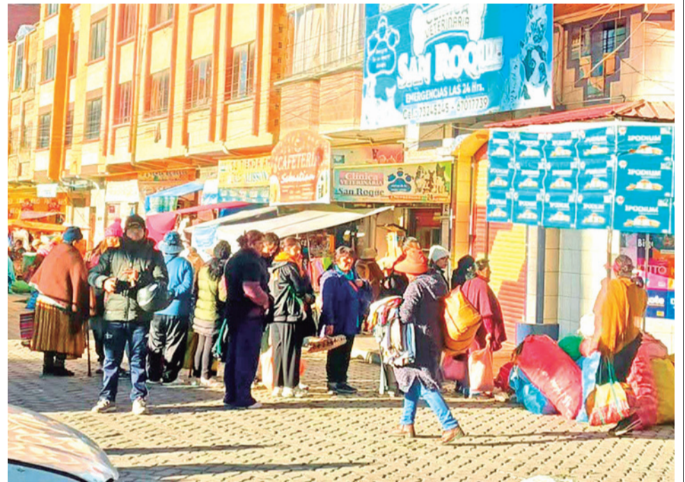
Las filas para la compra de alimentos en la ciudad de La Paz.

“No va a llegar nada, cómo en estos momentos pueden hacer esto, que gente tan malvada”, protestó otra mujer mientras se alejaba de la fila.