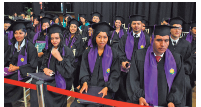
Contentos. Un grupo de estudiantes titulados de la UNITEPC.