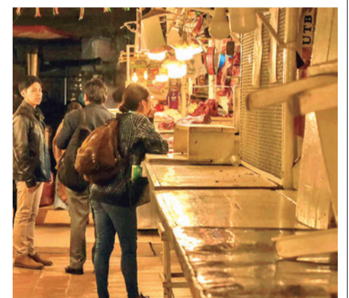
Los mercados vacíos por el cerco de más de 50 días en La Paz. MARKA REGISTRADA