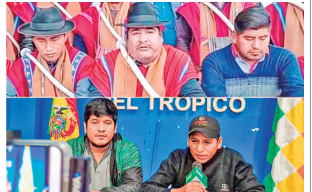
Dirigentes de las organizaciones movilizadas. RKC RR55

compromisos serán ejecutados y evaluados mediante una agenda de trabajo conjunta, con plazos definidos y mecanismos de seguimiento.