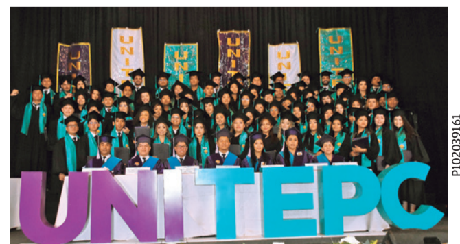
Profesionales. Estudiantes egresados tras la colación de grado.