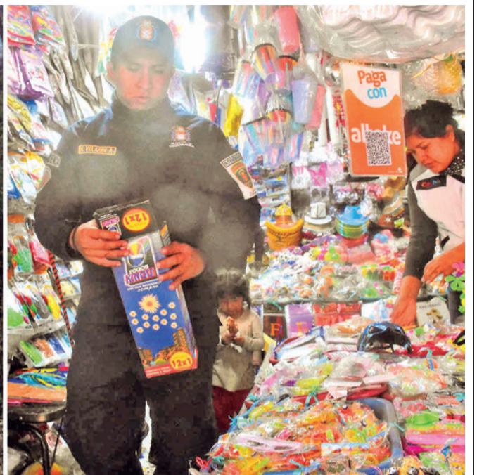
Fogatas, incendios forestales y juegos pirotécnicos en San Juan, en 2025.