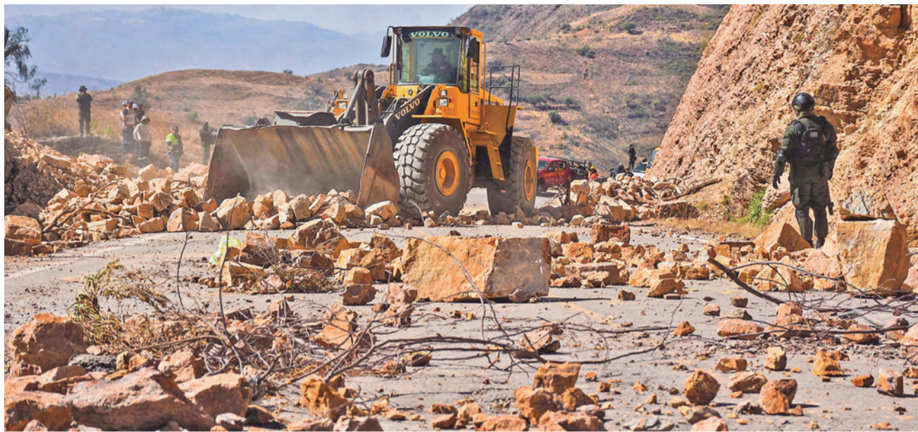
Maquinaria pesada trabaja despejando la carretera Cochabamba-Oruro, la mañana de ayer, sábado. JOSÉ ROCHA

La madrugada del sábado, el Ejecutivo dispuso mediante el Decreto Supremo 5636 la declaratoria de estado de excepción a nivel nacional por un periodo de 90 días, con el objetivo de restablecer la normalidad en el país tras 50 días de bloqueos de carreteras que provocaron una crisis econó-