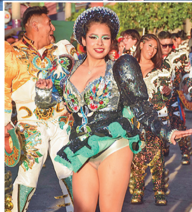
Las infaltables caporales bailan para san Juan de Dios.

De acuerdo con los organizadores, la Entrada de San Juan Bautista no solo preserva la tradición religiosa, sino que también fortalece la identidad cultural de la zona sur, donde cada año la fe se expresa a través de la danza, la música y la participación comunitaria.