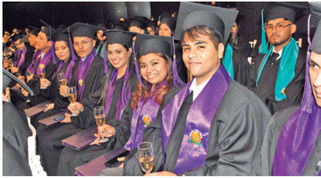
Felices. Un grupo de estudiantes egresados brindan por el objetivo cumplido.