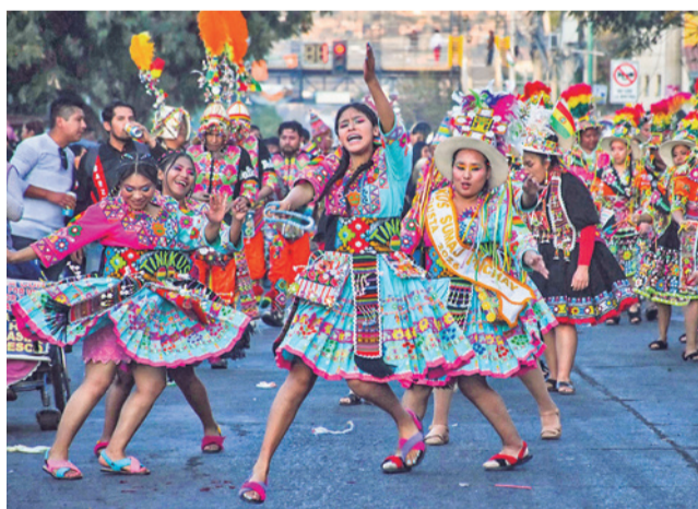
El vigor juvenil y los colores del folkllore nacional.

Entre 60 y 70 fraternidades participaron de la entrada,