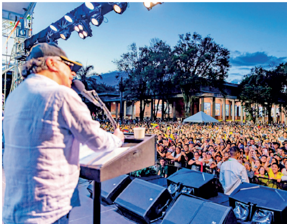
Gustavo Petro, en la despedida de su gestión presidencial, en Cali, Colombia.

Esta vez, sin embargo, Petro tuvo el tino de no hacer campaña por su candidato, Iván Cepeda, que brilló por su ausencia en los debates públicos y mediáticos y que fue acusado, hasta por sus propios correligionarios de no haber hecho lo que un candidato tiene que hacer para dar continuidad a la izquierda y ganar las elecciones en Colombia, la cuarta econo-