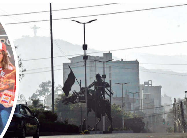
Una capa de humoniebla (smog) cubre Cochabamba. GADC