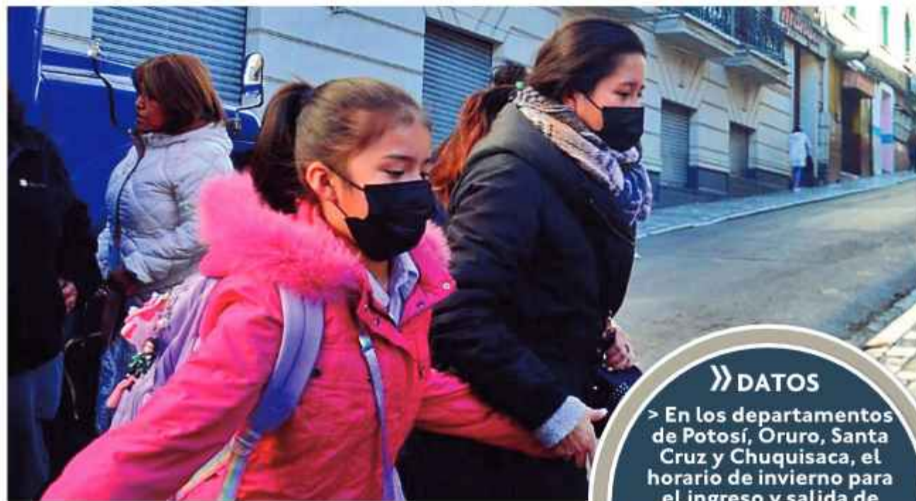
FRÍO. Una imagen de archivo muestra a una niña camino a clases.

Si bien en diversas regiones paceñas y algunas unidades educativas ya pa-