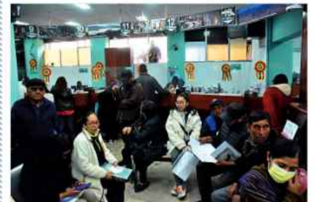
DETALLE. El plan no contempla elevar los impuestos.

El diagnóstico financiero detalló que los ingresos municipales permanecieron estancados entre 2020 y 2025 en un rango plano de Bs 1.757 millones a Bs 1.789 millones, un congelamiento perjudicial de recursos.