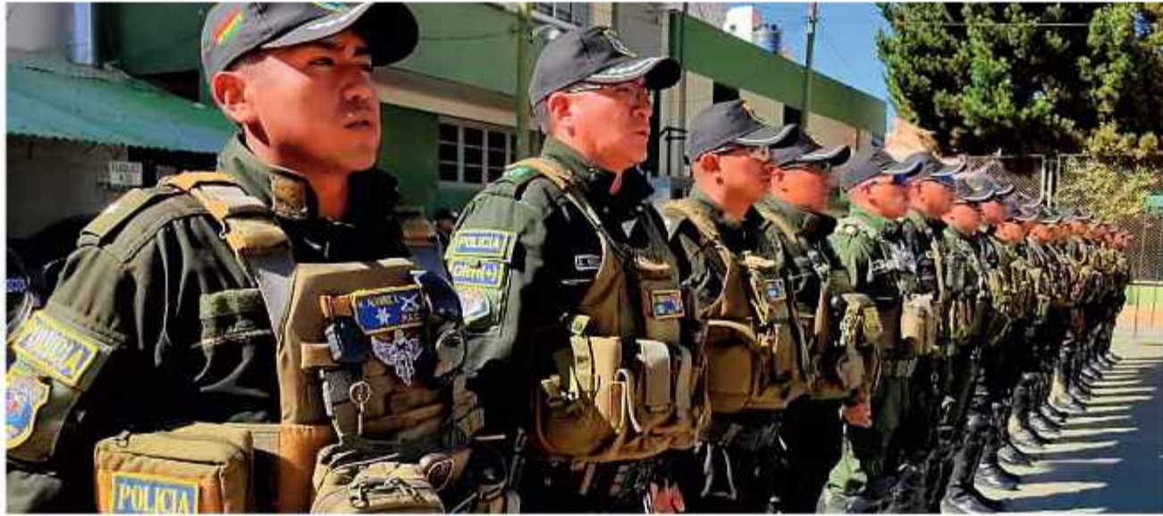
OPERATIVOS. La fotografía solo es un referente de la nota. Son policías de Oruro.

Anteriormente, el uso de agentes encubiertos estaba reservado en forma exclusiva para combatir el narcotráfico. Con la nueva ley, estas facultades especiales se extienden directamente a los delitos tipifica-