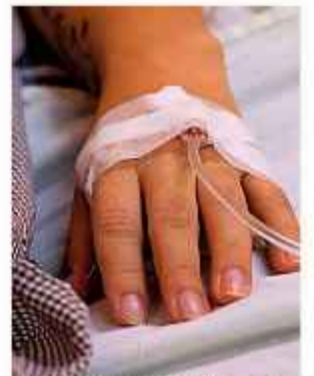
VIOLENCIA. La víctima se recupera de sus heridas.

El hombre estaba prófugo pues es sospechoso de haberla apuñalado tres veces en una discusión el martes 16. El caso se investiga como tentativa de feminicidio y se sumará el delito de portación ilícita de arma.