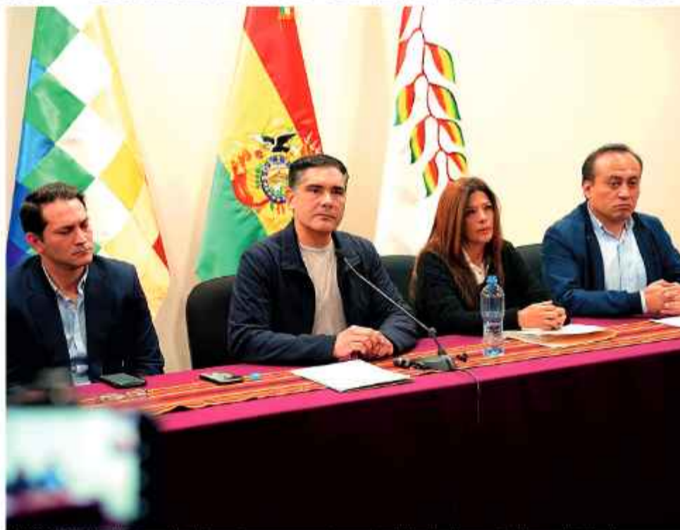
INFORME. El ministro Justiniano junto con otras autoridades denuncia irregularidades.

Ante las amenazas del sector avícola de tomar aeropuertos en caso de que el