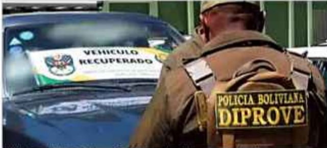
UNIFORMADO. Los efectivos de Diprove están ilesos.

Los uniformados realizaban el seguimiento a un vehículo sospechoso, y que estaba en una fila para cargar combustible. El ocupante del motorizado es presunto integrante de una organización dedicada al robo de autopartes que operaba en distintos puntos de la ciudad. Precisamente, en este vehi-