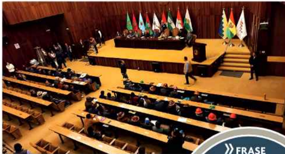
INCERTIDUMBRE. El acercamiento está en cuarto intermedio.

La autoridad aclaró que Paz ganó una elección democrática, por lo cual tiene la total responsabilidad de