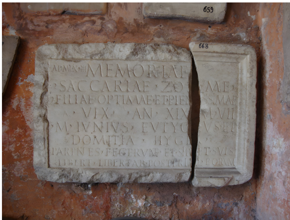
Figura 21.3. Inscripción dedicada a Zosima.

Sin embargo, sí que existía un pequeño grupo de oficios situados en áreas portuarias, es decir, los relacionados directamente con el mantenimiento de equipamientos y barcos, las labores de artesanado vinculadas a la venta y el comercio y las tareas de vigilancia y control.