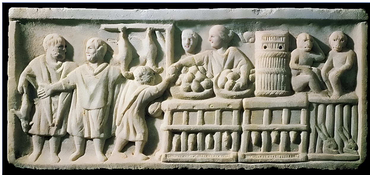
Figura 21.1. Relieve que muestra vendedora en una tienda de animales y verduras procedente de Ostia.

Esta línea está poco definida dadas las múltiples causalidades y distintos escenarios que envuelven a los oficios portuarios. Por un lado, las evidencias epigráficas conservadas sobre estos oficios son muy escasas, ya excepción de Ostia, Roma y Portus , las referencias a trabajos relacionados con puertos son más bien dispersas y se encuentran localizadas en varios enclaves portuarios o fluviales. Por otro lado, importantes ciudades portuarias, como por ejemplo Tarraco , no poseen todavía ninguna referencia a un oficio portuario, y no por ello debería considerarse que no existen 5 .