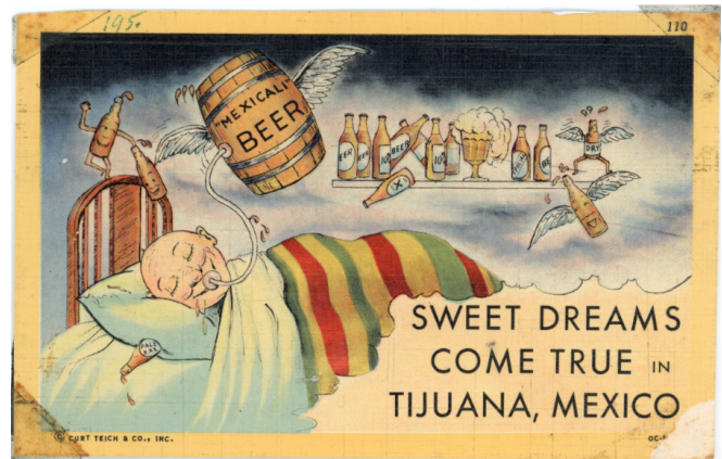
Fig. 9 Postal de lino. Publicidad de la cervecería Mexicali. CF-150-0437, Archivo Histórico de Tijuana, SECUTI. Foto reproducida con el permiso del Archivo Histórico de Tijuana. Foto reproducida con el permiso del Archivo Histórico de Tijuana.