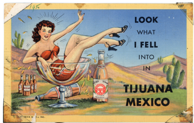
Fig. 7 Postal de lino promocionando la cervecería Mexicali (1950). CF-150-0432, Archivo Histórico de Tijuana, SECUTI. Foto reproducida con el permiso del Archivo Histórico de Tijuana. Foto reproducida con el permiso del Archivo Histórico de Tijuana.