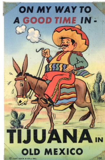
Fig. 6 Postal de lino promocionando Tijuana (1950). CF-150-0433, Archivo Histórico de Tijuana, SECUTI. Foto reproducida con el permiso del Archivo Histórico de Tijuana. Foto reproducida con el permiso del Archivo Histórico de Tijuana.

Cada una de las postales aquí elegidas despliega un repertorio visual de afectos que articulan la frontera como espacio de exceso y deseo. Si bien la primera no es de la cervecería Mexicali, si corresponde con el tipo de publicidad popular en la época en la que un hombre extranjero con sombrero y sarape montado sobre un burro representa una imagen caricaturizada del mexicano: alegre, ocioso y vinculado al placer corporal (ver fig. 6). La frase “On my way to a good time in Tijuana in Old Mexico” asocia la travesía fronteriza con una promesa de diversión, donde el placer anticipado se materializa en la sonrisa del personaje y en el tono festivo del diseño. Aquí, el afecto circula en forma de expectativa de goce, dirigida al turista estadounidense que busca en “Old Mexico” una experiencia exótica y desinhibida. La segunda postal intensifica esa circulación afectiva a través del cuerpo femenino erotizado: