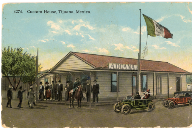
Fig. 2 Aduana Fronteriza de Tijuana. CF-150-0294, Archivo Histórico de Tijuana, SECUTI. Foto reproducida con el permiso del Archivo Histórico de Tijuana. Foto reproducida con el permiso del Archivo Histórico de Tijuana.

Precisamente, una de las primeras postales en circular fue de las imágenes de la aduana, edificio que continuó representándose a lo largo del siglo XX. A través de estas postales, se observa cómo la idea de frontera cambia tanto material como simbólicamente (ver fig. 2 y 3). Por ejemplo, una postal fechada posiblemente de manera errónea en 1911—puesto que la primera aduana fue abandonada en 1891 tras una inundación y la segunda no se construyó hasta 1921—muestra el edificio como la única marca de la línea divisoria entre México y Estados Unidos (Arreola 82).