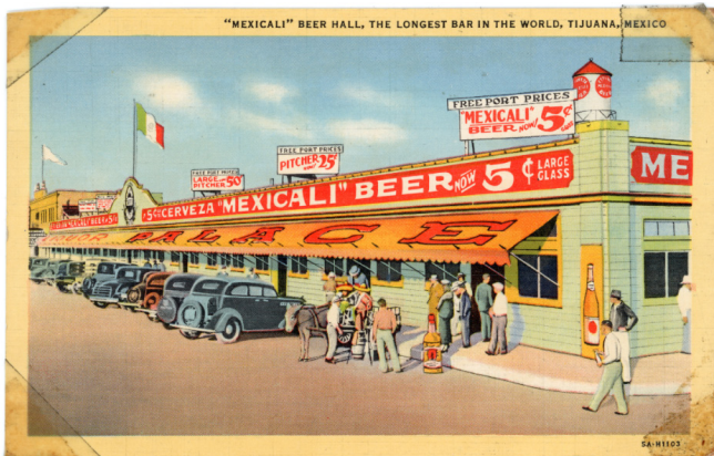
Fig. 5 Postal publicitaria de 1935 de Mexicali Beer Hall, el bar más largo del mundo. CF-150-0338, Archivo Histórico de Tijuana, SECUTI. Foto reproducida con el permiso del Archivo Histórico de Tijuana. Foto reproducida con el permiso del Archivo Histórico de Tijuana.

Estas postales revelan cómo la frontera comenzaba a imaginarse como un espacio transnacional lucrativo, construido a partir de una puesta en escena performativa que enfatizaba la división entre ambas naciones. No es casual que el monumento fronterizo se convirtiera en una de las principales atracciones turísticas: ofrecía una prueba geográfica y visual de haber “cruzado al otro lado” que, sumado al imaginario de relajación promovido por las postales, producía la sensación de diferencia. Ese otro lado, sin embargo, se representaba como un territorio premoderno, un espacio de exceso y posibilidad donde todo podía suceder justo en la época de la ley seca de Estados Unidos (1920-1933) que, a su vez, se conoce en Tijuana como la época dorada del turismo.