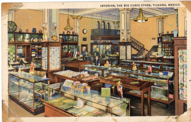
Fig. 4 Interior de The Big Curio Store. Nótese los almanques que contienen las postales de la época. CF-150-0408, Archivo Histórico de Tijuana, SECUTI. Foto reproducida con el permiso del Archivo Histórico de Tijuana. Foto reproducida con el permiso del Archivo Histórico de Tijuana.

se sumaban ilustraciones del monumento fronterizo mexicano, así como representaciones de tiendas de curiosidades y bares emblemáticos como el Mexicali Beer Hall —popularmente conocido como “La Ballena”— fundado en 1935 (ver fig. 4 y 5).