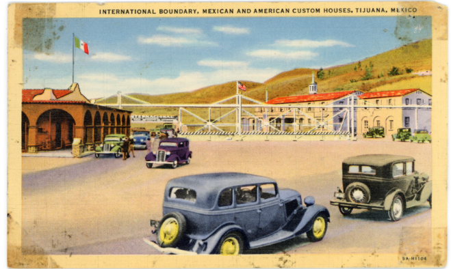
Fig. 3 Aduana Fronteriza de Tijuana en 1935. CF-150-0239, Archivo Histórico de Tijuana, SECUTI. Foto reproducida con el permiso del Archivo Histórico de Tijuana. Foto reproducida con el permiso del Archivo Histórico de Tijuana.

Una postal de 1935, en contraste, incluye una reja, la aduana estadounidense y las banderas de ambos países. Daniel D. Arreola, en su libro Postcards from the Baja California Border: Portraying Townscape and Place, 1900s-1950s , analiza precisamente la representación del espacio fronterizo a lo largo de las primeras décadas del siglo XX. En lugar de continuar esta línea de investigación centrada en la representación del espacio, mi interés se dirige a explorar la relación entre turismo y afectos, considerando cómo las postales no solo documentan un lugar, sino que también transmiten experiencias y emociones vinculadas a la consolidación de la frontera.