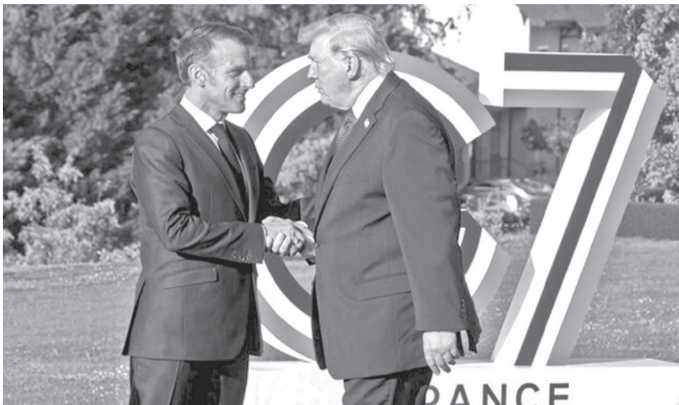
El presidente francés, Emmanuel Macron (izq.), estrecha la mano del mandatario de EEUU, Donald Trump, en la Cumbre G-7 en Evian, este de Francia.