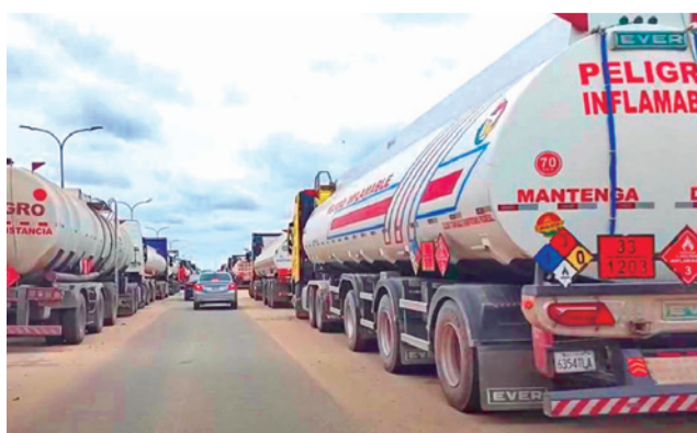
Las filas de las cisternas en Palmasola. RRSS

Las filas parecen interminables desde el séptimo anillo de la zona sur. No es un detalle menor: vehículos particulares, mototaxis y líneas de transporte urbano avanzan con extrema precaución para evitar accidentes ante la escasa visibilidad que generan las cisternas en la vía.