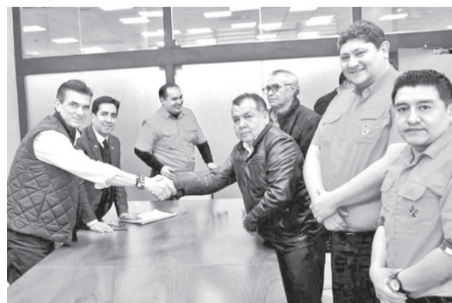
El presidente Rodrigo Paz con dirigentes obreros cruceños, ayer.

Días atrás, la COD de Santa Cruz pidió en un comunica-