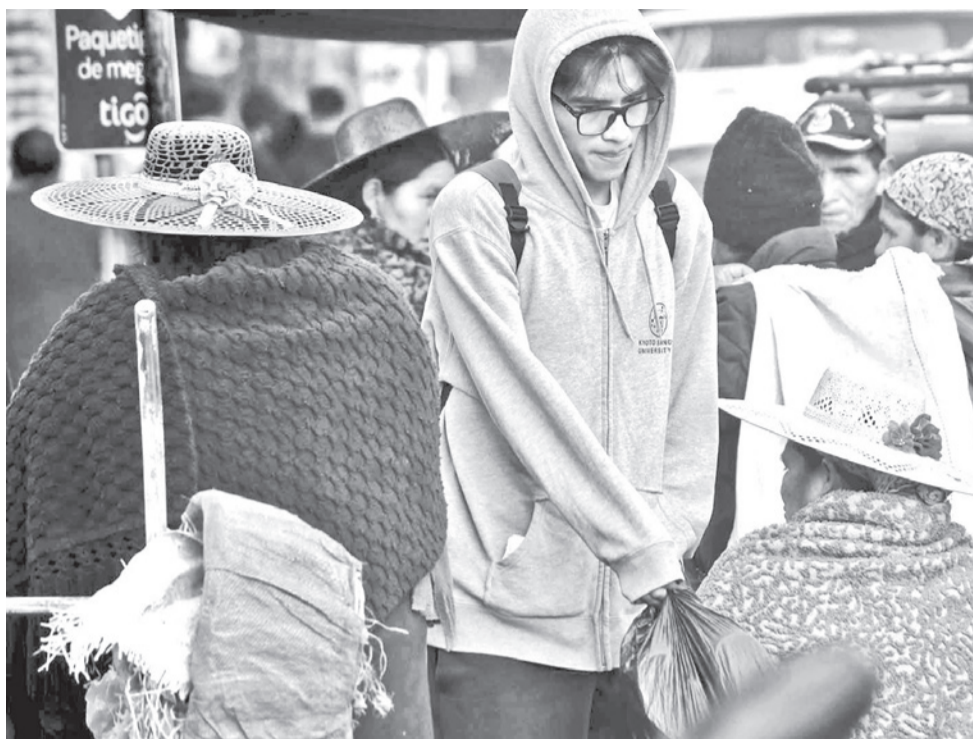
El descenso de temperaturas incide en el aumento de infecciones respiratorias. C. LÓPEZ