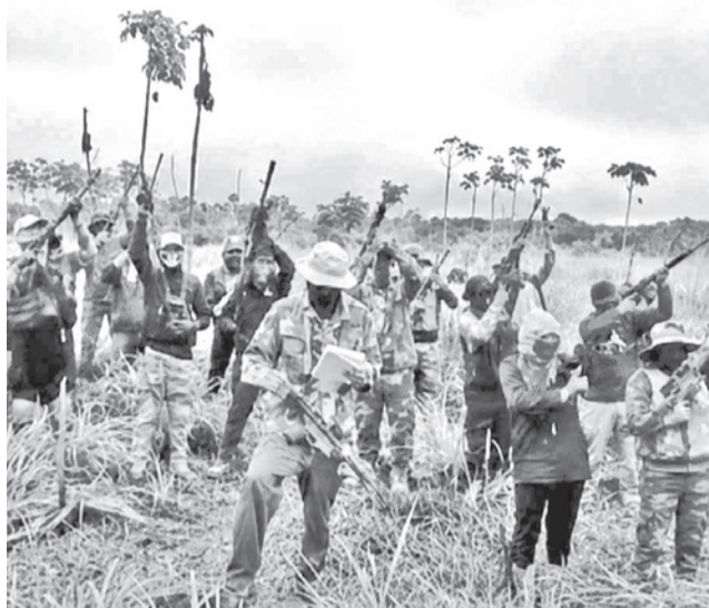
Imagen congelada del video que circula en redes.