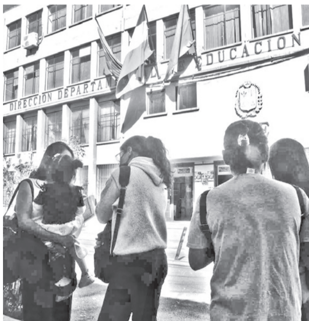
La protesta de los padres de familia de Colomi.

Asimismo, aclaró que se instruyó esta modalidad debido a que, en varias regiones, no todos los alumnos cuentan con