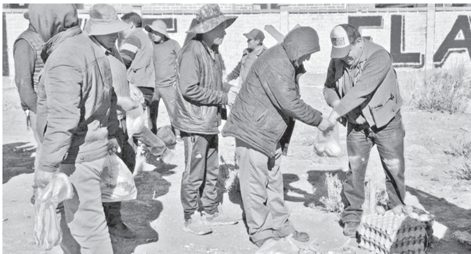
Un grupo de transportistas varados en una carretera cerrada por bloqueos.

Una situación de carencia extrema de insumos de primera necesidad es la denunciada por el presidente de la Cámara de Transporte Pesado de Oruro, Jorge Gutiérrez, quien aseguró que el sector ya registra tres conductores fallecidos, varios hospitalizados y otros evacuados por rutas alternas a causa de los bloqueos que se tienen desde hace más de 48 días en el país. El dirigente acusó al Gobierno de una “completa inacción”, que los ha dejado en estado de indefensión. Además, señaló a la dirigencia de la Central Obrera Boliviana (COB) y a Evo Morales de mantenerlos como “rehenes” en las carreteras.