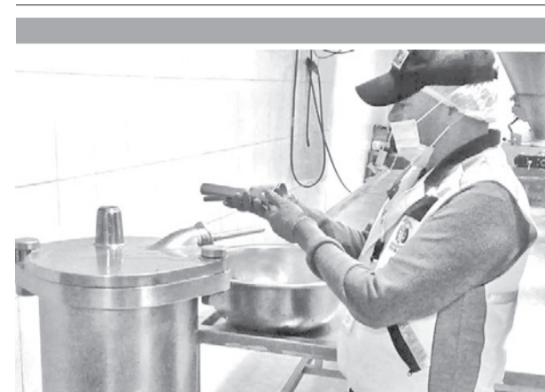
El control de embutidoras que realiza la Alcaldía. I.M.

muchos casos el equipo tecnológico, peor todavía en muchos casos no llega ni la señal (de internet)”, manifestó el responsable de Educación.