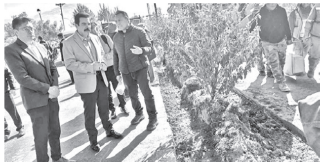
Los trabajos en las jardineras y maceteros, ayer.

Área verde. Más de 25 trabajadores de Emavra realizan zanjas, colocan protectores y pintan jardines de la avenida Juana Azurduy