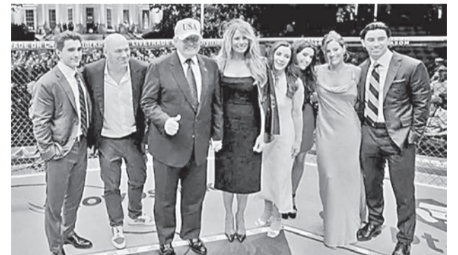
El presidente de EEUU, Donald Trump (con gorra) en el evento de la UFC en la Casa Blanca.

El director del FBI, Kash Patel, informó en X que el 10 de junio la agencia y sus socios tuvieron conocimiento de una posible amenaza contra el evento en Wash-