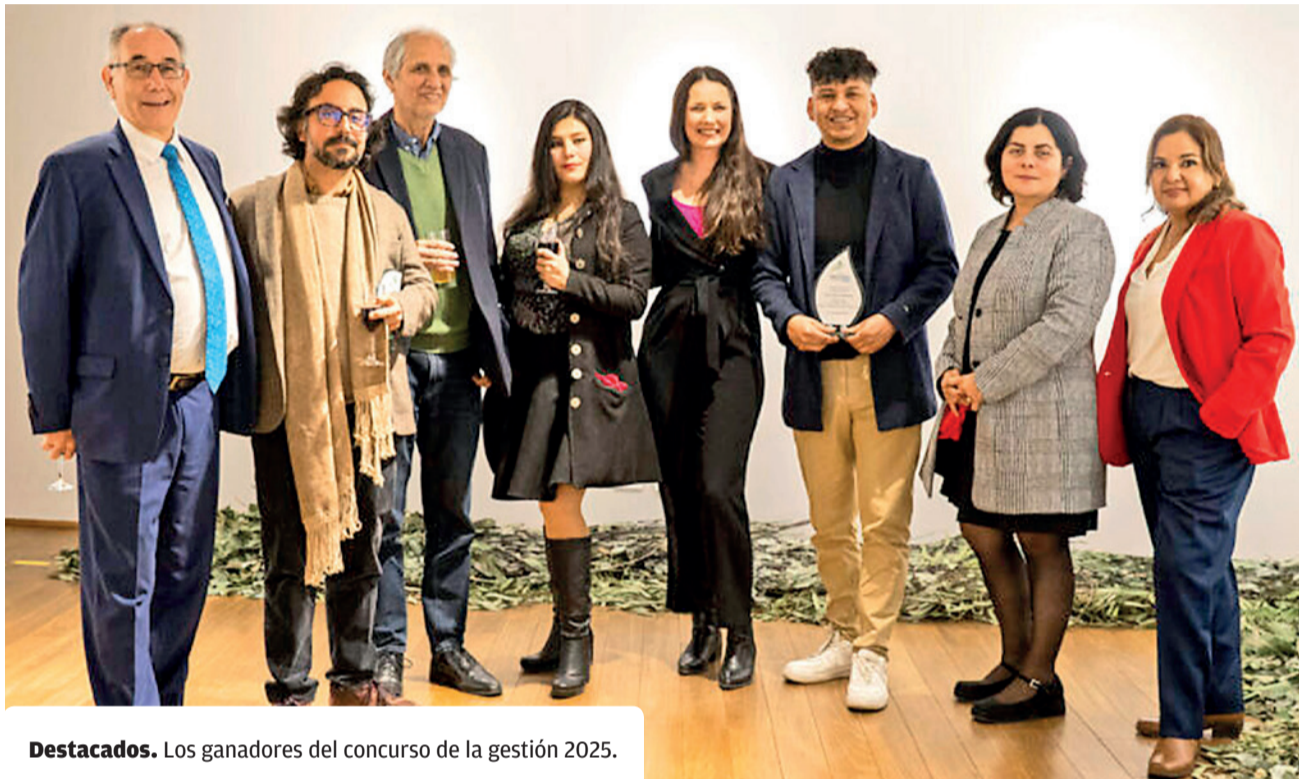
Destacados. Los ganadores del concurso de la gestión 2025.

Iniciativa. Para esta edición, el premio busca reportajes rigurosos y de profundidad que exploren la relación entre las personas y la naturaleza