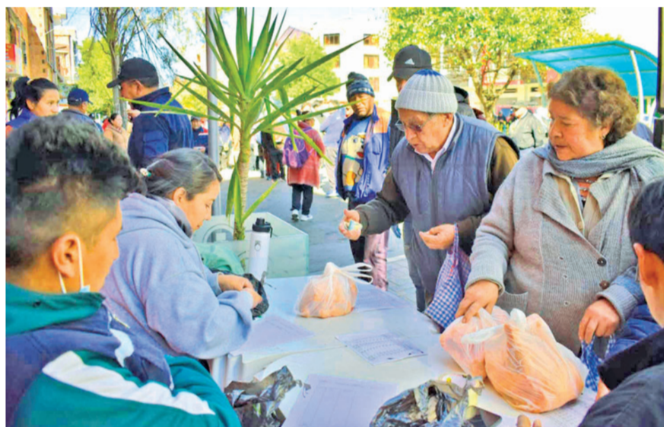
La fila para intentar comprar pollo en Emapa, ayer, en La Paz.

Emapa informó que el nuevo precio es "gracias a las gestiones y coordinaciones del Gobierno realizadas con la Embajada de los Estados Unidos, que contribuye a cubrir gastos operativos del puente