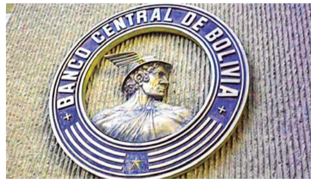
El logo del Banco Central de Bolivia.

Además, la autoridad indicó que el Banco Central podría intervenir en el nuevo sistema de tipo de cambio flotante si las condiciones del mercado así lo requirieran, según el reporte.