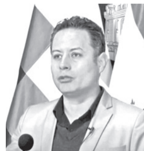
El vicepresidente Edmand Lara. VPEPB

El Escudo de las Américas es una iniciativa regional de cooperación en seguridad impulsada por Estados Unidos, contemplando