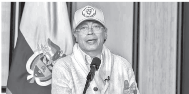
El presidente de Colombia, Gustavo Petro.

Colombia. La medida es provisional mientras el juzgado decide de fondo sobre la acción de tutela interpuesta en contra del mandatario