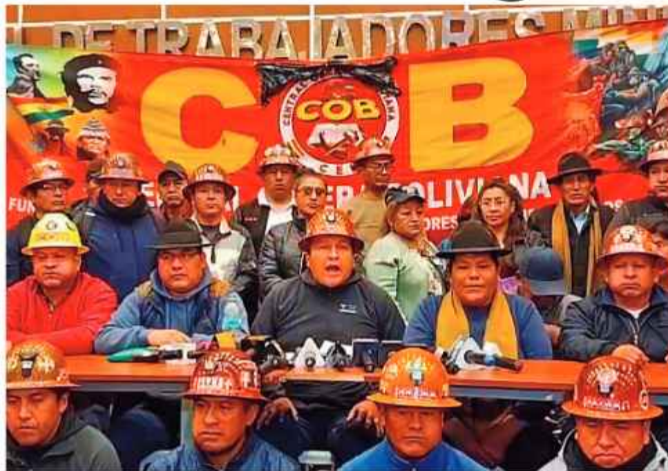
ACTORES. Los sectores sociales movilizados elaboran un pliego nuevo de peticiones.