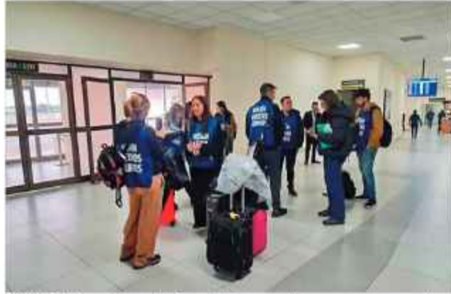
GRUPO. Migración y la Cancillería cuestionaron su presencia.

El vicepresidente Edmand Lara condenó de forma enérgica la retención y posterior expulsión de la comitiva de políticos y activistas de izquierda argentina el lunes en el aeropuerto internacional de El Alto.