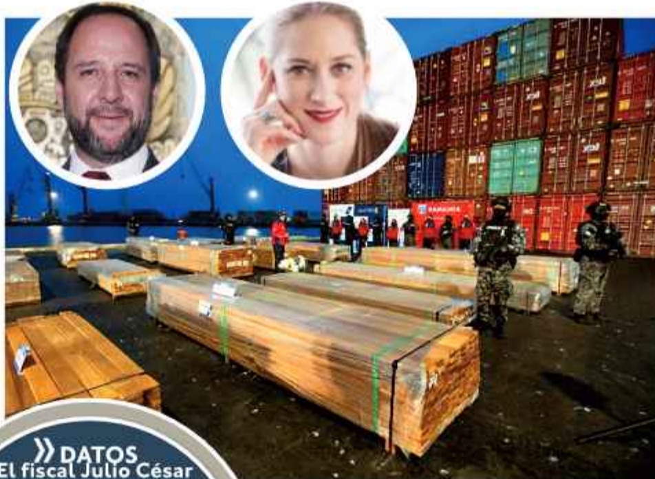
DROGAS. Los tablones incautados en Chile y el Viceministro y su esposa.

Los operativos se concentraron principalmente