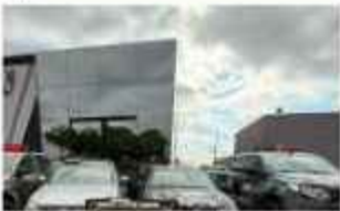
ILEGAL. Los bloques de ladrillo con la cocaína.

La droga estaba distribuida en 240 paquetes prensados, tipo ladrillo. Además, cuatro personas fueron capturadas en flagrancia, tres hombres y una mujer, quienes serán puestos a disposición de la justicia del vecino país.