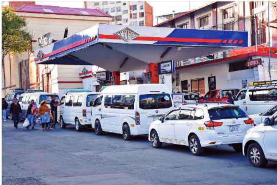
GASOLINERAS. Los puntos de distribución permanecen cerrados para los usuarios.

Las calles de zonas céntricas y periféricas como San Pedro, Obrajes y la avenida Montes registran kilóme-