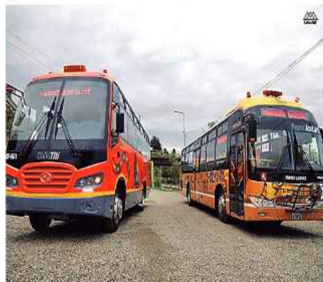
EMBLEMA. El servicio La Paz BUS tiene demanda ciudadana.

El alcalde de La Paz, César Dockweiler, anunció ayer el reinicio oficial de las operaciones de los buses PumaKatari y ChikiTiti.