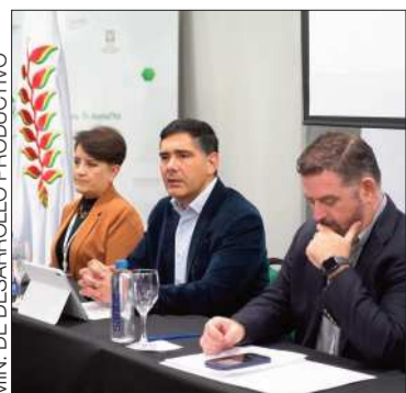
El ministro Mario Justiniano.

El ministro Justiniano se reunió con el BDP y los representantes de la CAO