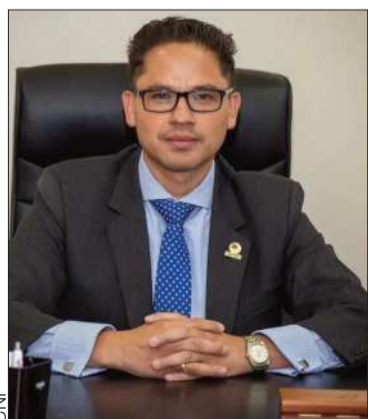
Gonzalo Morales, presidente CNI.

El presidente de la CNI dijo que la imagen del país está deteriorada