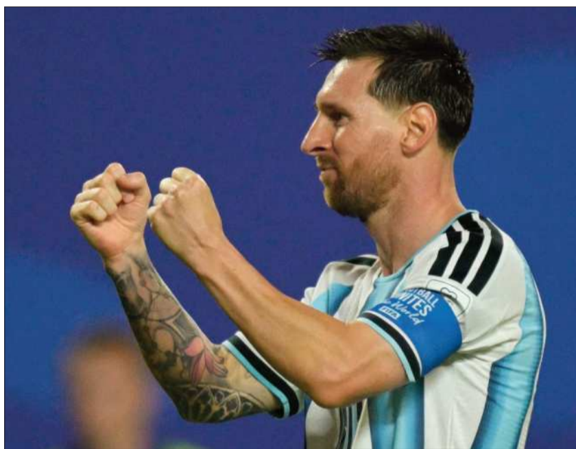
DESTACADO. El argentino Lionel Messi celebra uno de sus goles.

En una noche llena de emotividad, al propio Messi le brotaron las lágrimas al anotar en el minuto 17 su primer gol, con el que abrió su último tango en una Copa del Mundo, al fin liberado de presiones y traumas.