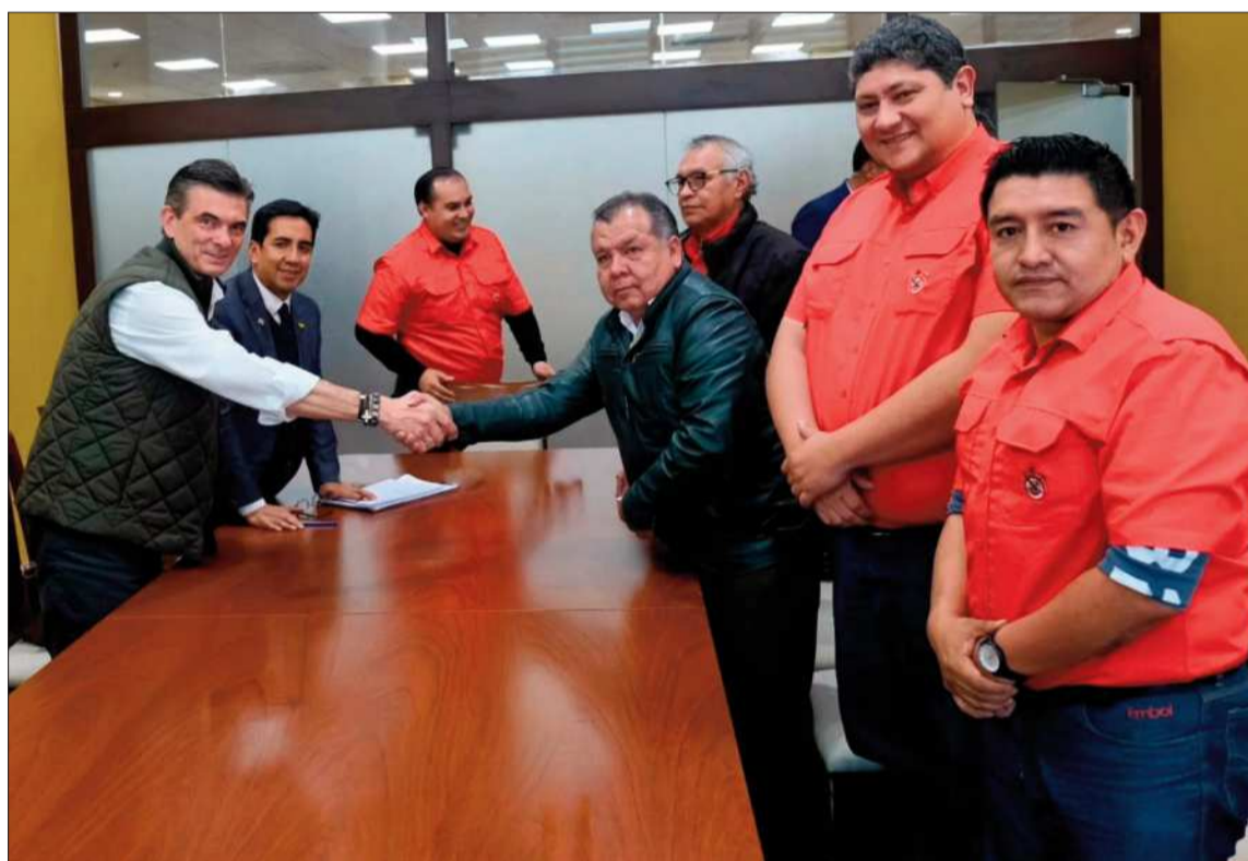
ENCUENTRO. El presidente Rodrigo Paz se reunió con dirigente de la COD de Santa Cruz

La preocupación central de la dirigencia sindical se concentra en el impacto que los bloqueos están teniendo sobre la producción y el empleo. Según Paniagua, varias industrias acumulan grandes volúmenes de productos sin posibilidad de comercialización debido a las restricciones en