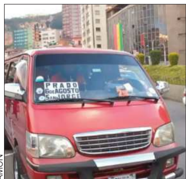
Un minibus en una calle de La Paz.

El sector transporte apunta a retomar la prestación del servicio con normalidad