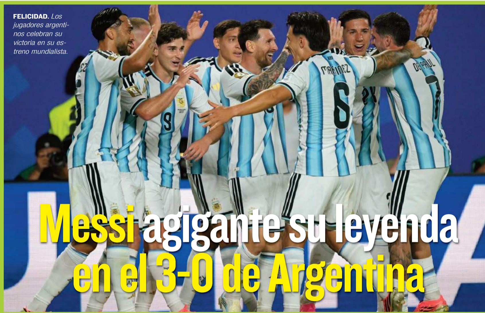
FELICIDAD. Los jugadores argentinos celebran su victoria en su estreno mundialista.