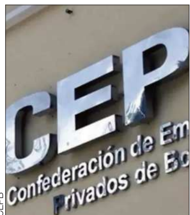
Emblema de la Confederación.

Los privados respaldaron a sectores que levantaron las medidas de presión