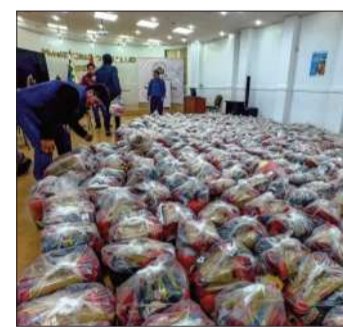
Paquetes de alimentos donados.

Con la recepción de este primer cargamento, el Ministerio de Salud garantizó la seguridad alimentaria de los pacientes de la red hospitalaria.