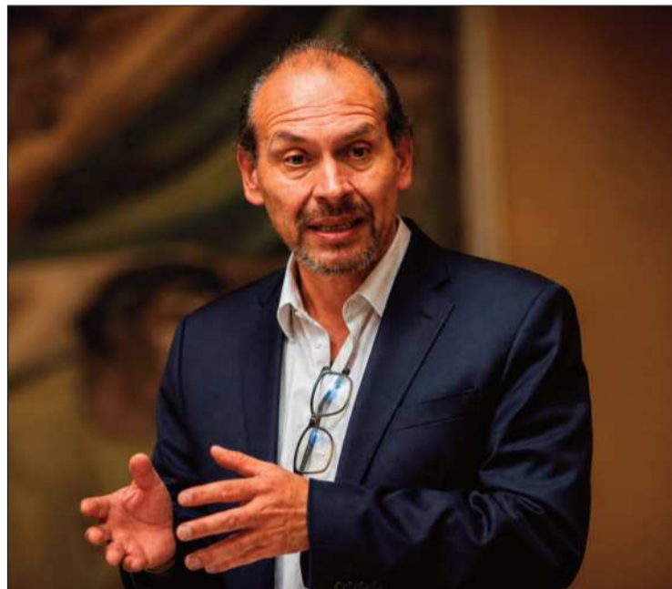
ENTREVISTA. Andrés Zaratti, viceministro de Culturas y Folklore.

Zaratti explicó que aún no existe una medición completa del daño, debido a la informalidad del sector y a la falta de instrumentos estatales para cuantificar su aporte. Sin embargo, citó un diagnóstico inicial con datos de gobiernos autónomos y actores culturales. Según esos datos, en mayo se suspendió o reprogramó el 60% de los eventos previstos en espacios escénicos muni-