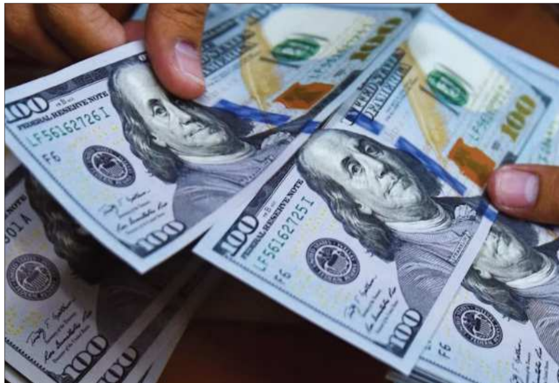
COTIZACIÓN. Una transacción de la divisa estadounidense en el mercado interno.

Espinoza explicó que el propósito de la medida es que exista una sola referencia cambiaria para toda la economía, lo que permitiría reducir la especulación y facilitar las operaciones de ciuda-