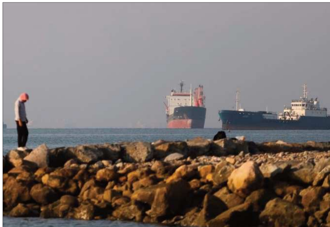
VIAJES. Los buques comenzaron a transitar por el estrecho de Ormuz.

El bloqueo iraní de esa ruta cortó la exportación de hidrocarburos desde el Golfo, lo que aceleró la inflación, y provocó problemas de suministros de fertilizantes y otros productos en Estados Unidos y otros países.