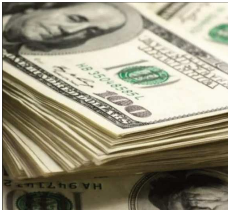
DEUDA. El Banco Central reportó que la deuda es sostenible.

ral, el principal acreedor es China, país al que se debe $us 1.068,4 millones (7,4%); seguido de Francia, con $us 680,1 millones (4,7%); y Alemania, con $us 93,5 millones (0,6%).