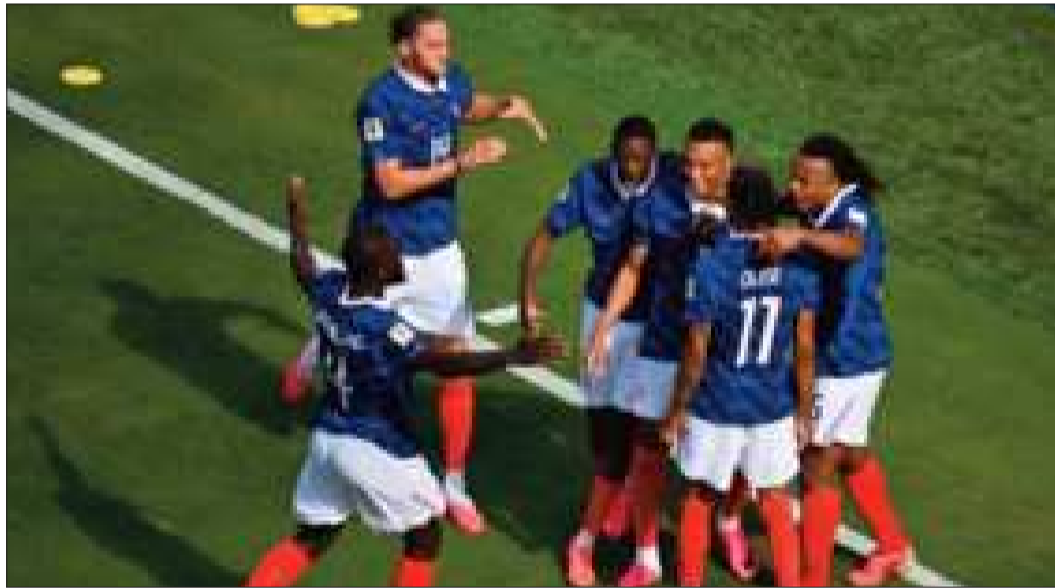
ALGARABÍA. Los jugadores franceses celebran uno de sus goles ante los senegaleses.

Los Bleus vencieron a Senegal con gran actuación de Kylian implacable e intratable en su estreno