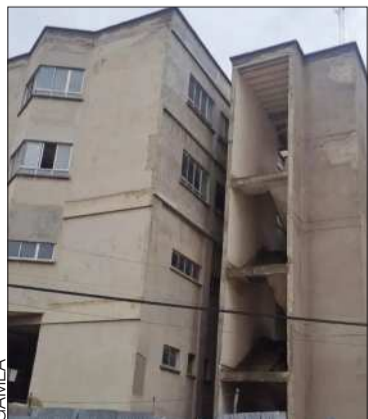
La construcción del hospital.

Se trata del proyecto del Hospital Materno Infantil que comenzó en 2002