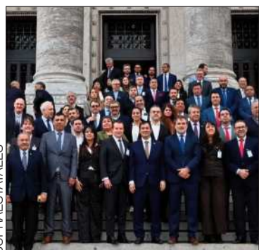
Miembros del Parlasur.