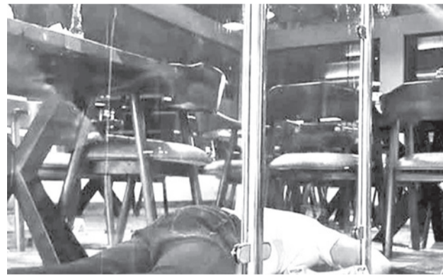
Lugar donde ocurrió el crimen en Santa Cruz. RRSS

La Fiscalía y la Fuerza Especial de Lucha Contra el Narcotráfico (Felcn) ejecutaron ayer varios allanamientos en inmuebles de la ciudad de Santa Cruz de la Sierra, en el marco de la investigación del