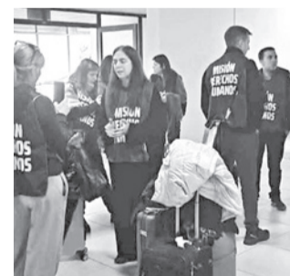
Los ciudadanos argentinos expulsados de Bolivia. RRS5

Misión. Los argentinos argumentaron que fueron invitados para elaborar un informe sobre el conflicto y derechos humanos.