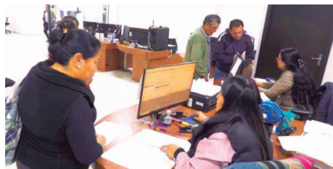
Trámites para amnistía para edificaciones. GAMC

Proceso. A diferencia de lo que ocurre en el pasado, los trámites se resuelven en hasta cinco días