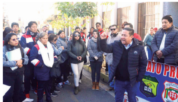
La protesta de profesores de Colomi. HERNAN ANDIA

Gracias a la digitalización de procesos, la sistematización de fichas y la reducción de requisitos, los usuarios pueden concluir sus trámites en un plazo de entre cinco y diez días, una mejora sustancial respecto a procedimientos que anteriormente demoraban varios meses.