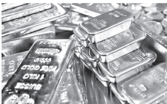
Lingotes y monedas de oro en una joyería de Munich.

Según un comunicado institucional, la operación inicial fue efectuada el 17 de junio de 2025 por la anterior adminis-