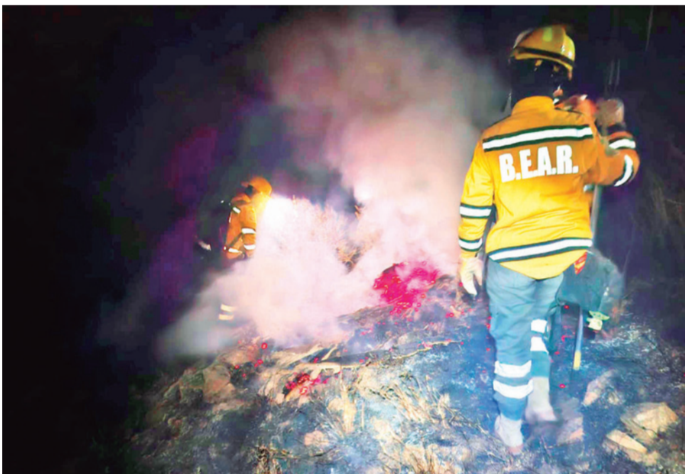
Control de fogatas en la pasada noche de San Juan. TUNARI SIN FUEGO

“No vamos a permitir que una noche de festejo se convierta en problema de salud pública”, indicó la autoridad.