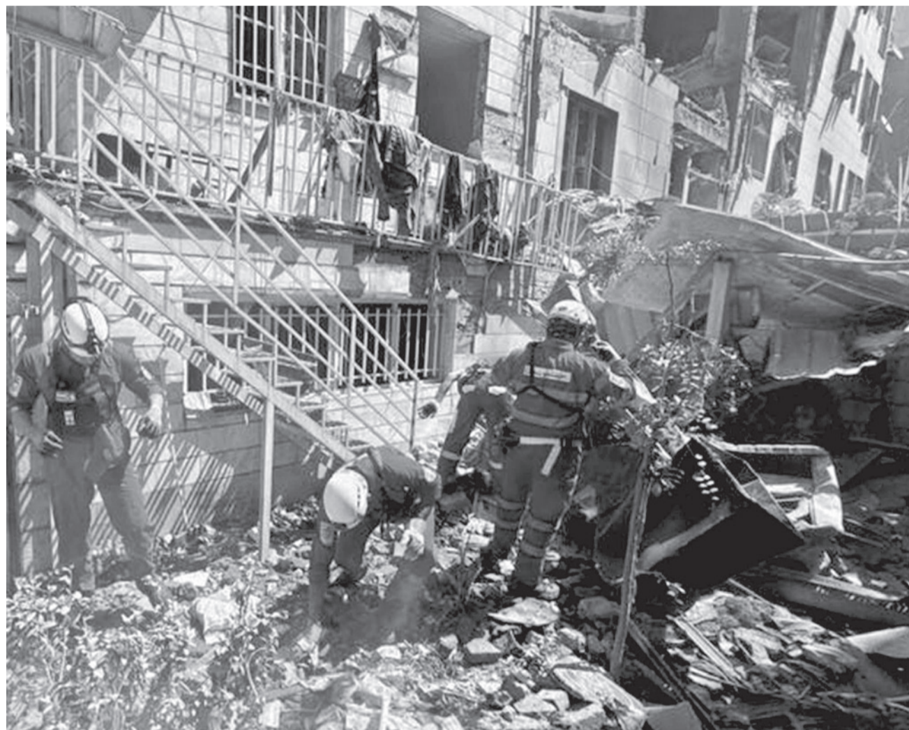
Los equipos de respuesta a emergencias de la Media Luna Roja Iraní buscan sobrevivientes entre los escombros.

Incertidumbre. Un alto cargo en Washington asegura que la retirada de Israel de Líbano no es una de las condiciones del acuerdo