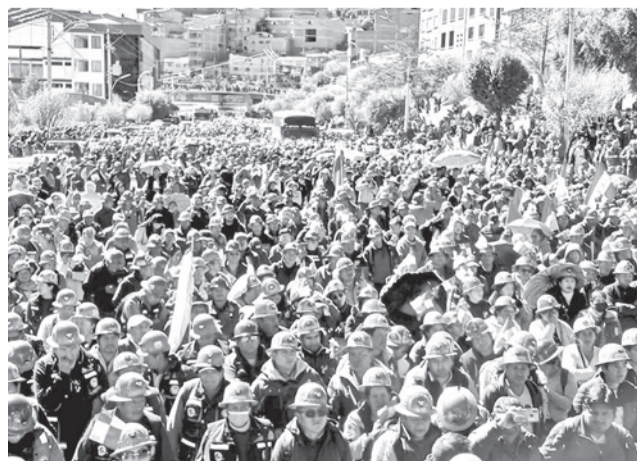
Marcha de los potosinos en la Villa imperial. FEDECOMIN

Entre las conclusiones del cabildo, se otorgó un plazo de 48 horas al Gobierno para “asumir medidas definitivas que pongan orden en el país, pacificación y desmovilización inmediata”. Asimismo, se exigió la aprehensión de Evo Morales y se anunció que serán declaradas enemigas de Poto-