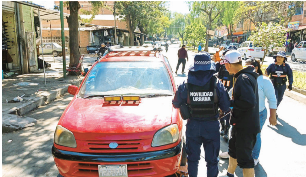
El SEM y Movilidad Urbana controlan parqueos en la Av. Siles.