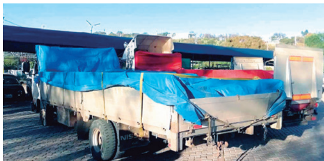
La llegada de camiones con medicamentos. HERNAN ANDIA

Salud. Los medicamentos serán para pacientes con enfermedades crónicas como cáncer e insuficiencia renal