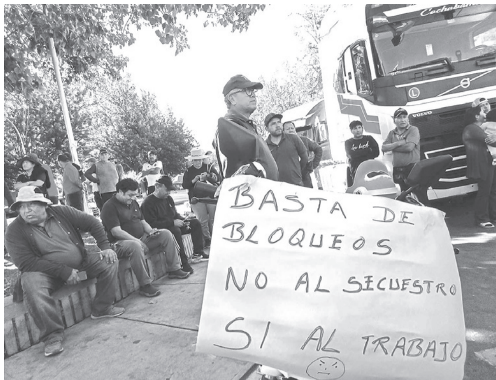
La caravana de protesta del transportes en Cochabamba, ayer. DANIEL JAMES