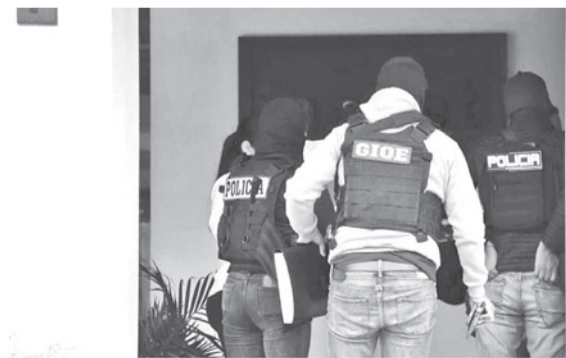
Los allanamientos en la ciudad de Santa Cruz.

Los operativos se realizaron en distintas zonas de la capital cruceña, donde fiscales y efectivos antidroga sequestraron documentación y otros elementos que serán