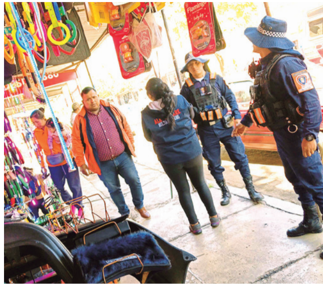
Guardias de Movilidad Urbana en la Av. Siles.