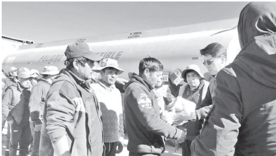
Parte de la Caravana Humanitaria que salió a las carreteras para ayudar a choferes.

Para la movilización se prevé apoyo de Yacimientos, que proporcionará combustible para los vehículos que transportarán la ayuda hacia los puntos afectados por los bloqueos.