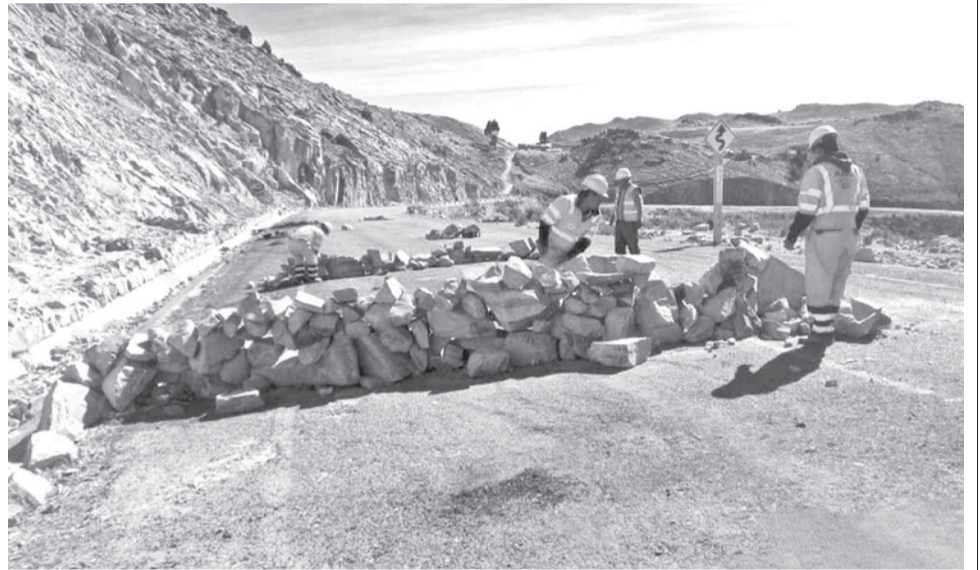
Maquinaria de la ABC realiza trabajos de limpieza en un punto de bloqueo. ABC

Con la habilitación de esta vía, que conecta a Sucre con Cochabamba y Santa Cruz, se permite restablecer el tránsito vehicular en esta región del país y con ello el suministro entre el occidente y el oriente de Bolivia.