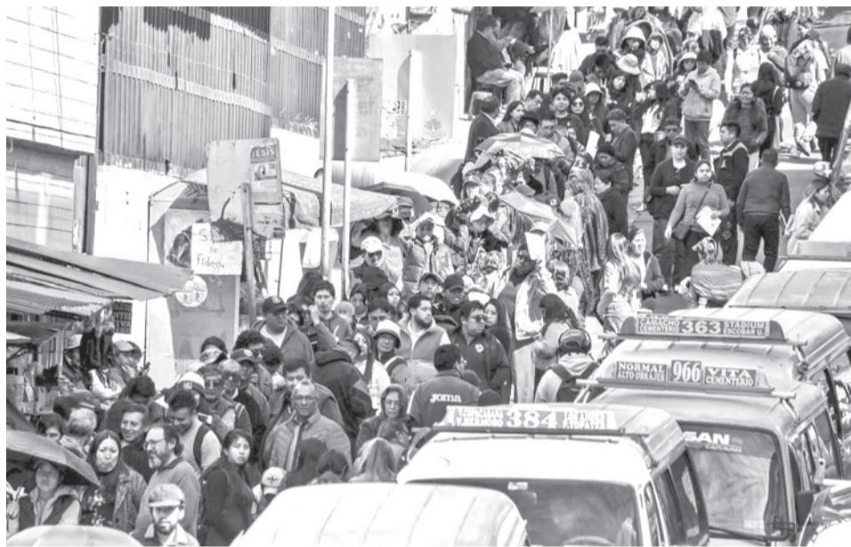
Las filas para la compra de carne de pollo en Emapa, en La Paz, ayer. MARKA REGISTRADA

Indicó que el precio disminuyó gracias al apoyo de los