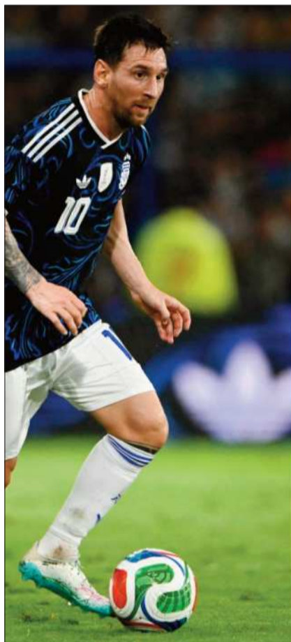
DEBUT. Messi inicia su pelea por conseguir nuevamente el campeonato.

Messi no quiso abandonar a sus compañeros en esta misión y será el primero de la fila en el estreno del martes en el estadio Kansas City a partir de las 20.00 locales (01.00 GMT del miércoles). Su estado físico es la gran incógnita, por mucho que tenga desde hace tres años la MLS a sus pies con un registro de 62 goles en 67 partidos. Messi encontró a Miami en el pozo de la clasificación y lo hizo campeón del pasado torneo aunque ya no