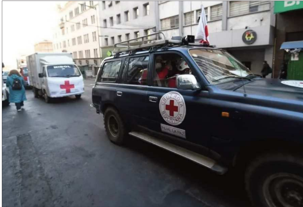
COMITIVA. La caravana partió ayer con seis vehículos y varias ambulancias con banderas blancas.