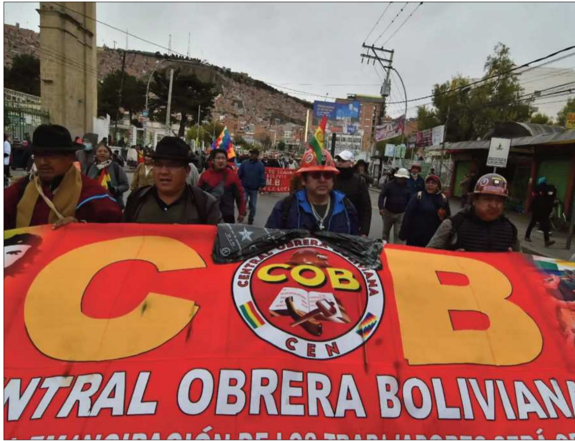
MOVILIZACIÓN. Una marcha de la Central Obrera Boliviana (COB) en la sede de gobierno.

La reunión fue postergada inicialmente para garantizar mayor