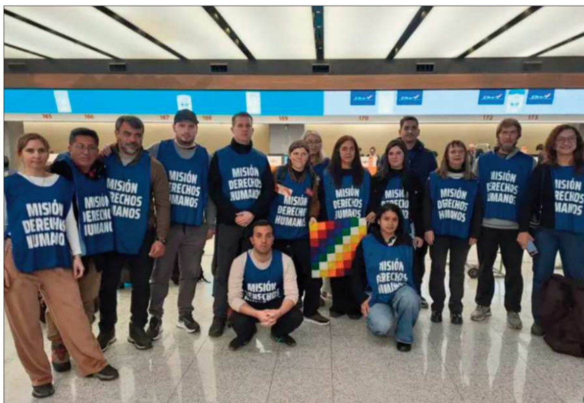
GRUPO. Los integrantes de la supuesta comisión argentina de Derechos Humanos.