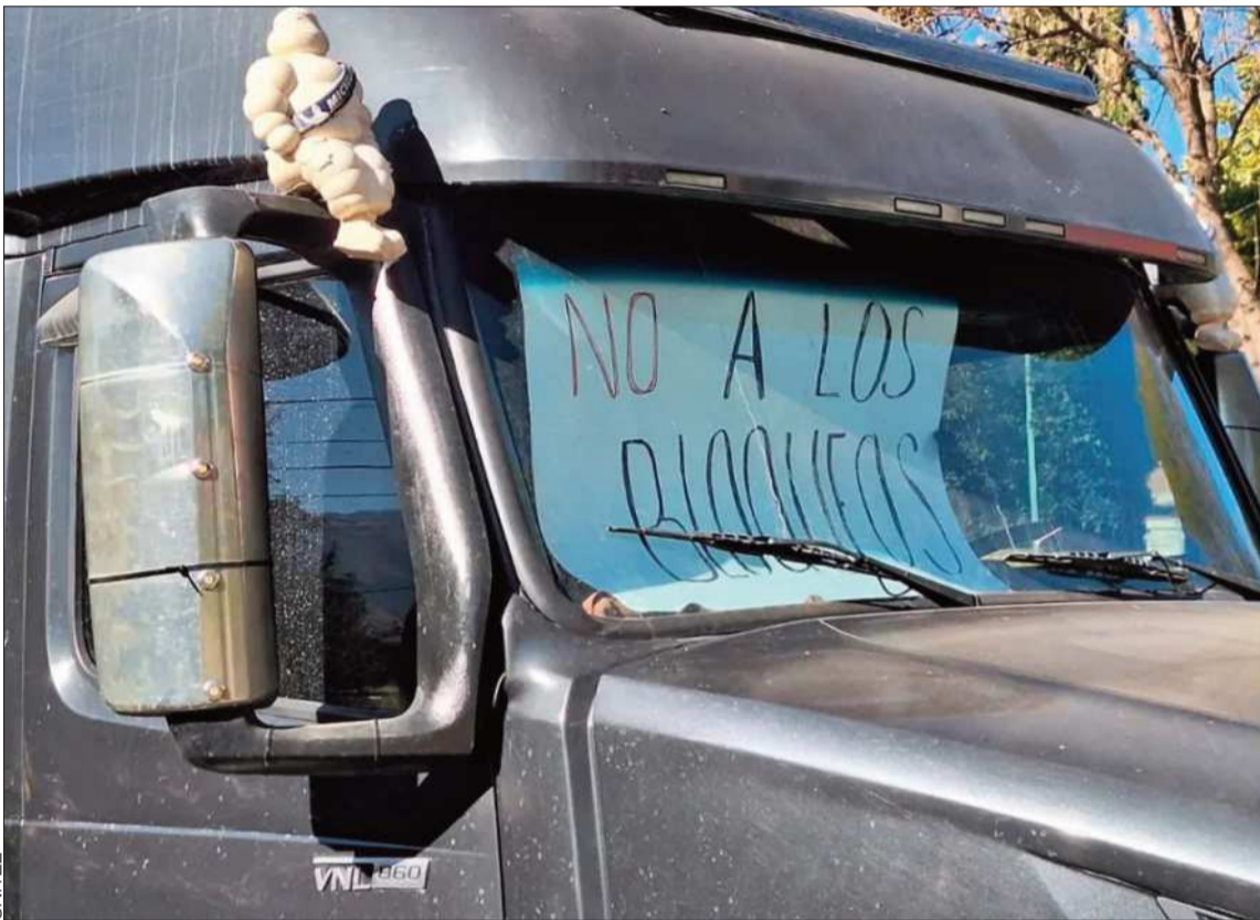
RECHAZO. Transportistas colocaron un letrero en un camión para expresar su rechazo a los bloqueos.

Afectación. Los conflictos impactan de forma directa a los sectores económicos