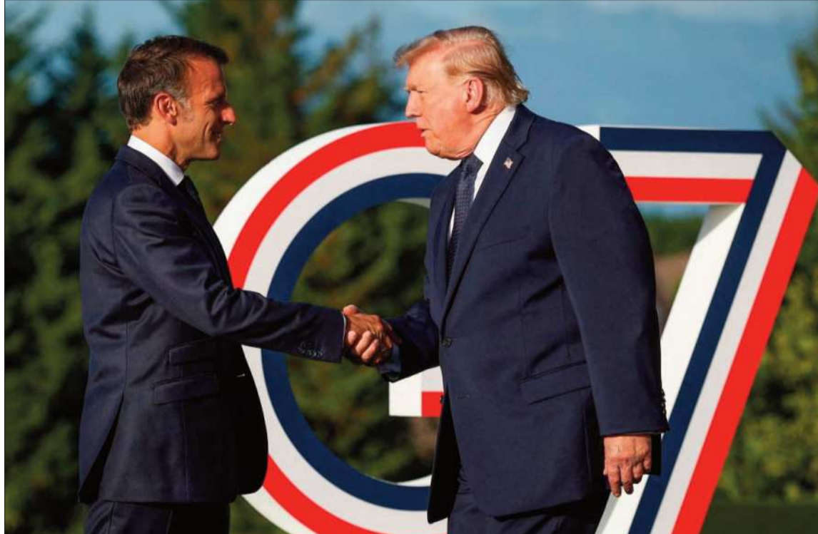
ENCUENTRO. El presidente de Francia Emmanuel Macron recibió a Donald Trump.

Sin embargo, las dudas planean sobre si los petroleros deberán pagar un peaje para atravesarlo. Aunque Washington dijo que no, la cancillería iraní aseguró ayer que deberán abonarse tasas por "servicios de navegación", entre otros. Aunque el texto del acuerdo todavía no es público, los dirigentes de los otros países del G7 (Francia, Alemania, Canadá, Italia, Japón y el Reino Unido) esperan que el inquilino de la Casa Blanca dé detalles desde la cena de aper-