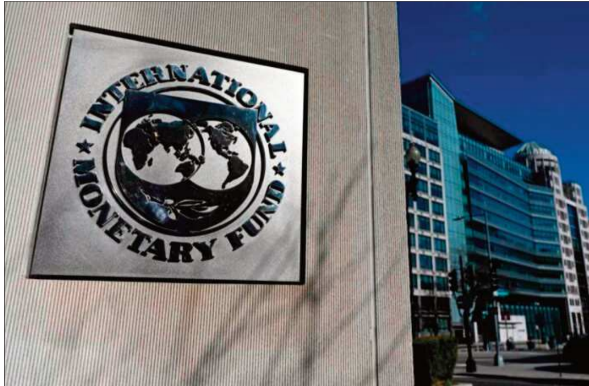
REFERENCIAL. Una imagen del emblema del Fondo Monetario Internacional (FMI).

La publicación sostiene que la reforma forma parte de un conjunto de medidas orientadas