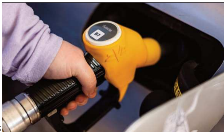
EFFECTO. Se espera que los precios de los carburantes bajen.

El precio del barril de Brent cayó un 4,76%, hasta 83,17 dólares