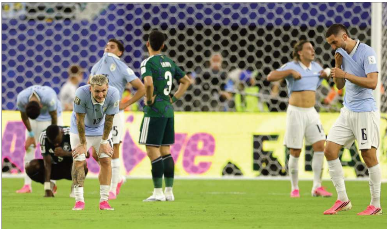
DESAZÓN. Los jugadores de Uruguay y de Arabia Saudita terminaron desilusionados.

Ancelotti, sin embargo, confía en que se incorporará a las prácticas esta semana con miras al segundo partido del Grupo C, en el que los pentacampeones mundiales se enfrentarán a Haití el viernes en Filadelfia.