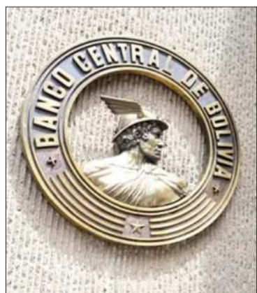
Banco Central de Bolivia.

El cierre de esta operación contribuye a la reducción de pasivos