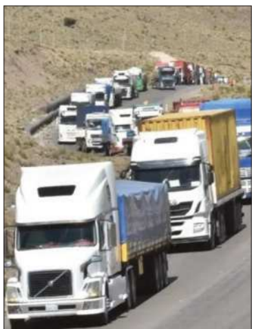
Transporte varado por bloqueos.

El conflicto golpeó al Gobierno, a los sectores movilizados y población