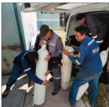
La UMSA entrega oxígeno.

La universidad abasteció a nosocomios de la ciudad de La Paz y El Alto