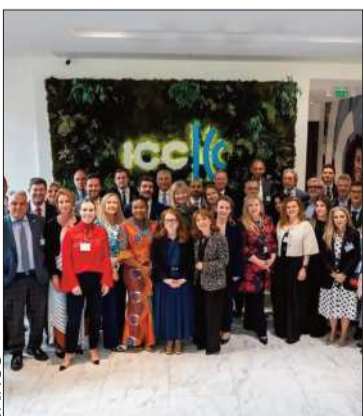
Reunión del Consejo Mundial.

Se definieron prioridades estratégicas que guiarán la agenda de la organización