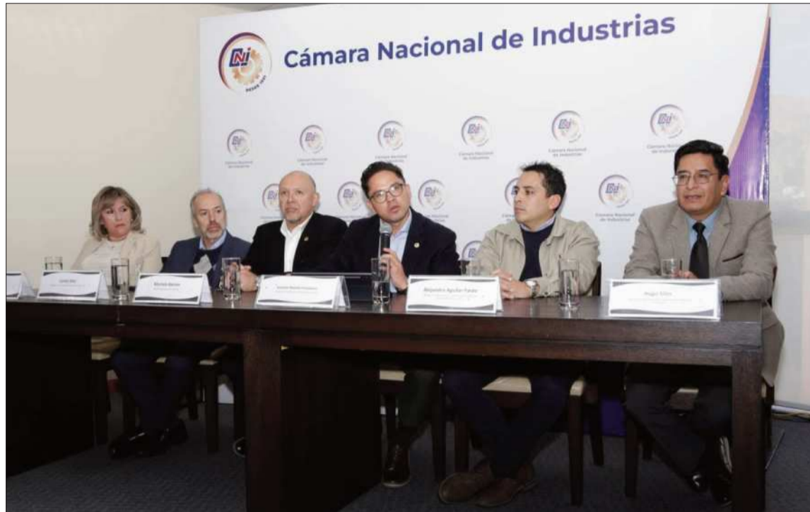
JUNTA. La dirigencia de los industriales durante una conferencia de prensa en su sede nacional.

La Cámara Nacional de Industrias alertó además sobre riesgos crecientes de iliquidez, quiebras y posibles despidos en el aparato