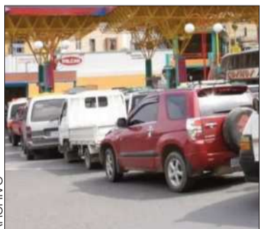
Las filas por el combustible.

YPFB dijo que el principal obstáculo se encuentra en carreteras bloqueadas