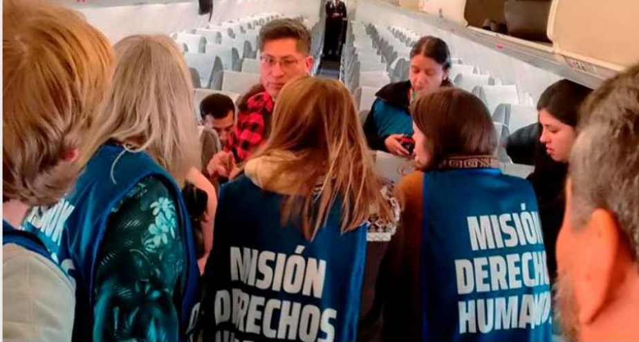
A la delegación argentina no se le permitió el acceso a territorio boliviano