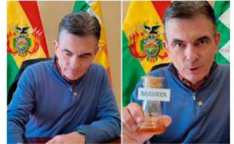
El presidente Rodrigo Paz durante la firma de la ley para la nueva planta solar en Viacha