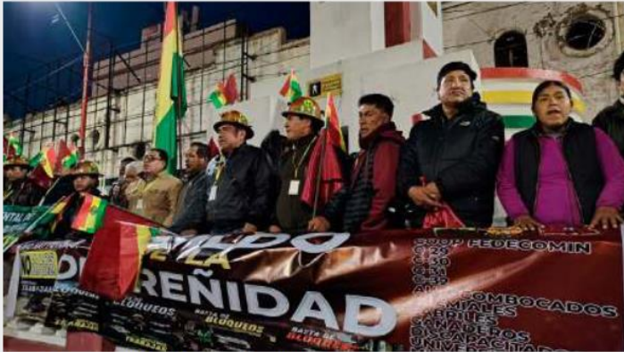
El cabildo se realizó en la Avenida Cívica

Aunque todos coincidieron en buscar soluciones al conflicto social y dar fin al bloqueo, surgieron discrepancias al mencionar a Evo Morales, al gobierno actual o a la COB. Esto demostró que no había consenso en