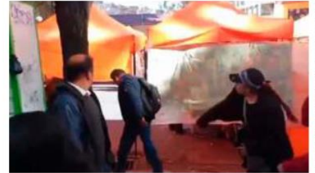
Al dirigente de la COB le lanzaron tomates y fue agredido por la gente /CAPTURA VIDEO