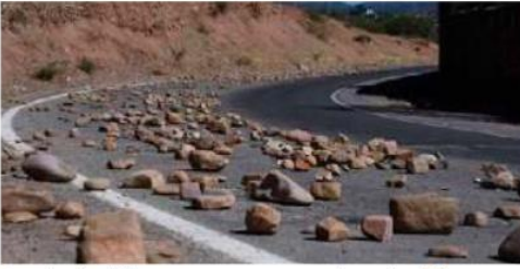
Desde el gobierno aseguraron que durante el fin de semana se desactivaron al menos 20 puntos de bloqueo