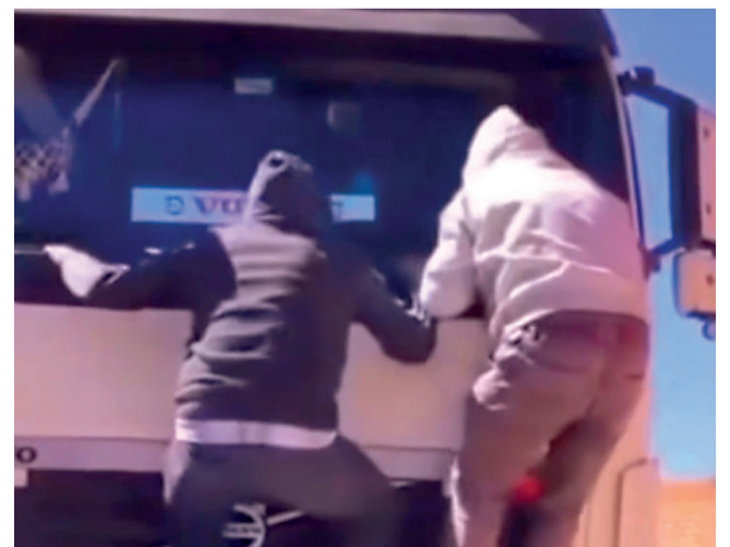
MUERTE. Dos transportistas intentan ayudar a su compañero.

Ante el desabastecimiento de recursos básicos en la zona donde están frenados, las choferes se vieron obligados a cavar pozos rudimentarios en la tierra en un intento por encontrar agua para su subsistencia y consumo.