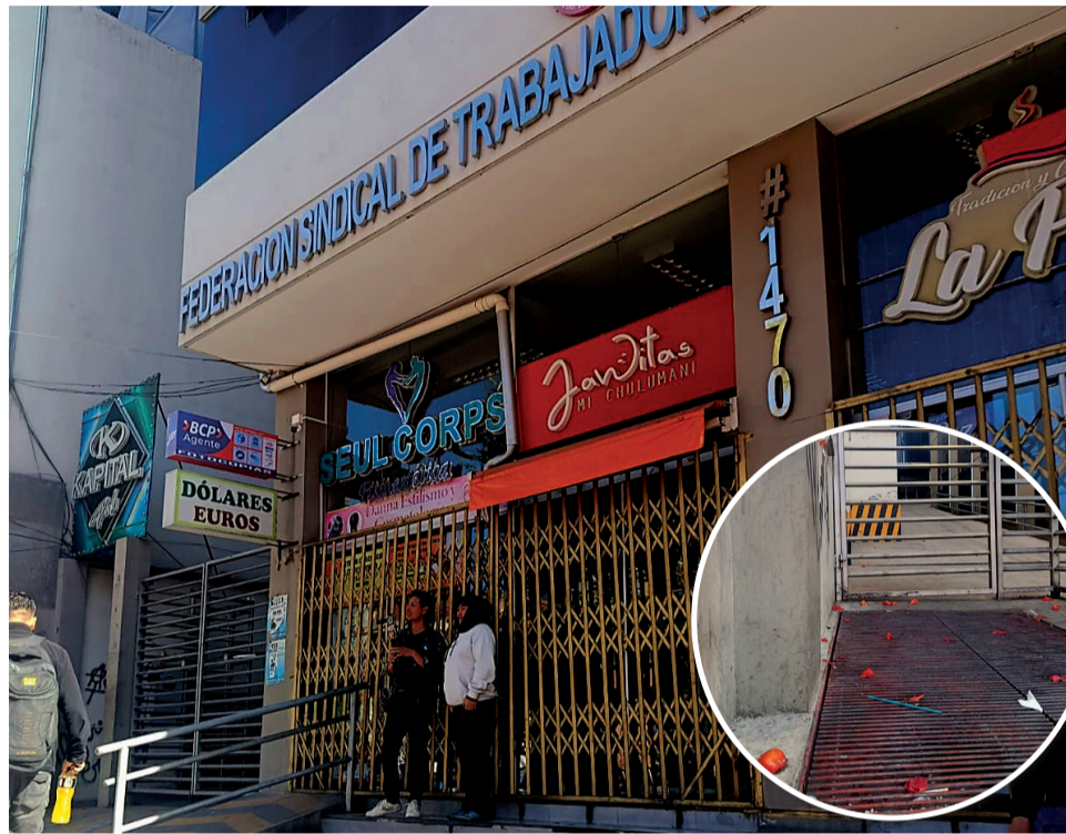
TOMATAZOS. El ampliado iba a realizarse en la FSTMB. Algunos tomates lanzados.

El evento, que debió llevarse a cabo en las instalaciones de la Federación Sindical de Trabajadores Mineros de Bolivia (FSTMB), en El Prado, de La Paz, tenía