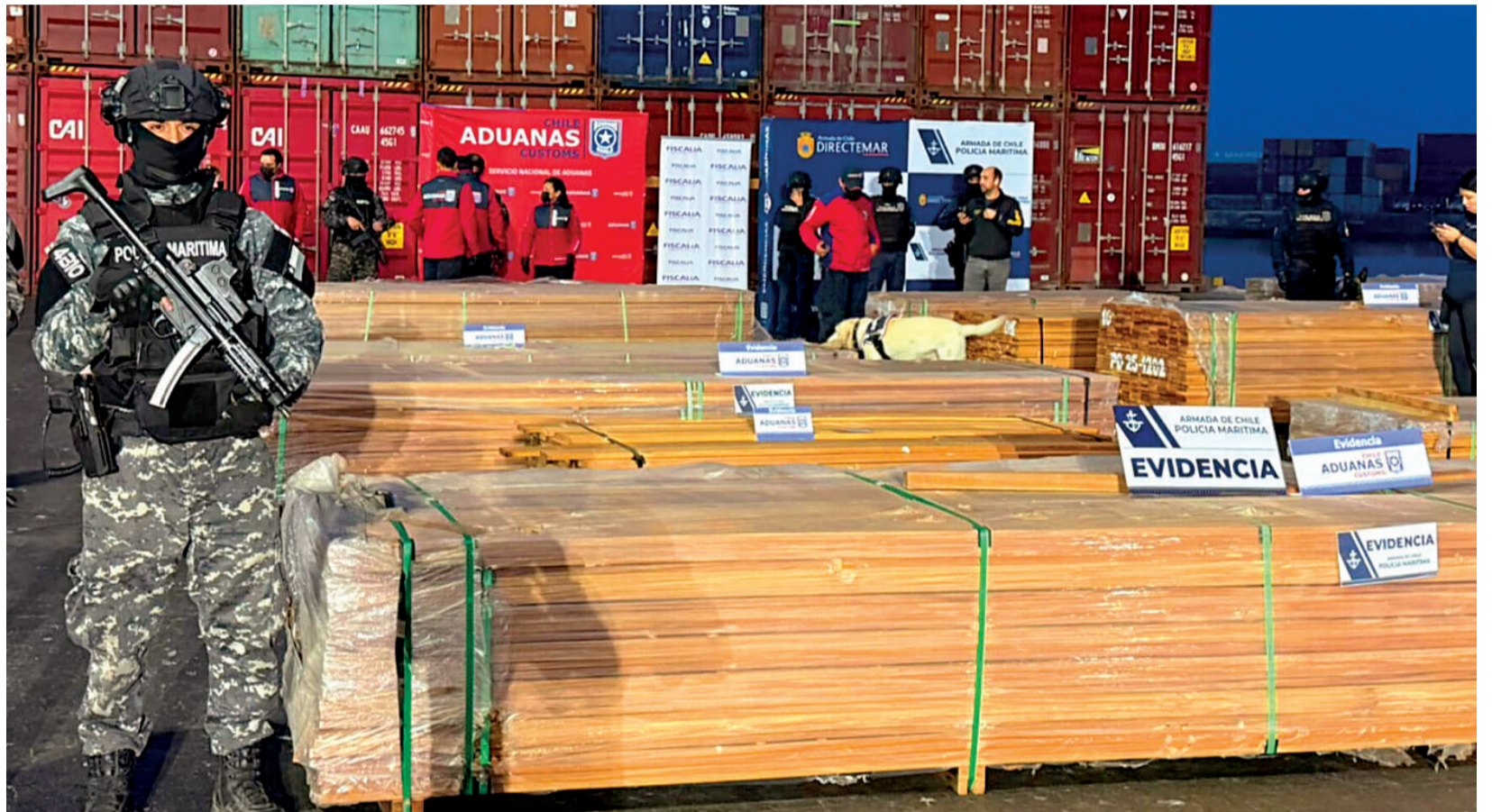
GOLPE. Esta mercancía era parte de los tablonces de madera que fueron decomisados en Chile, pues contenían sustancias ilícitas.

"Las cargas, correspondientes a madera y productos de caucho, contenían clorhidrato de