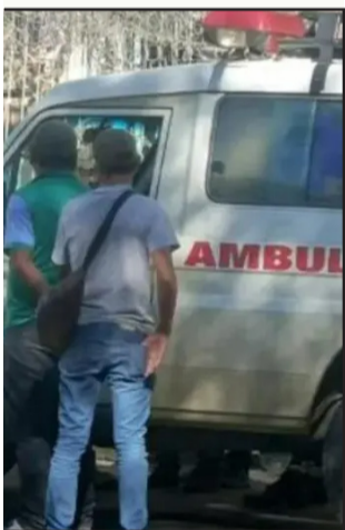
AMBULANCIA. El vehículo donde se encontró el dinero.

La ambulancia partió del municipio de Puerto Villarroel para trasladar a un paciente hacia la capital cochabambina. El operativo de intercepción y el hallazgo del dinero no ocurrieron en el trópico, sino en la ciudad, en la plaza Sucre. La Alcaldía de Puerto Villarroel comunicó que el dinero estaba registrado y presupuestado para pagar salarios para personal de salud de esa administración edil.