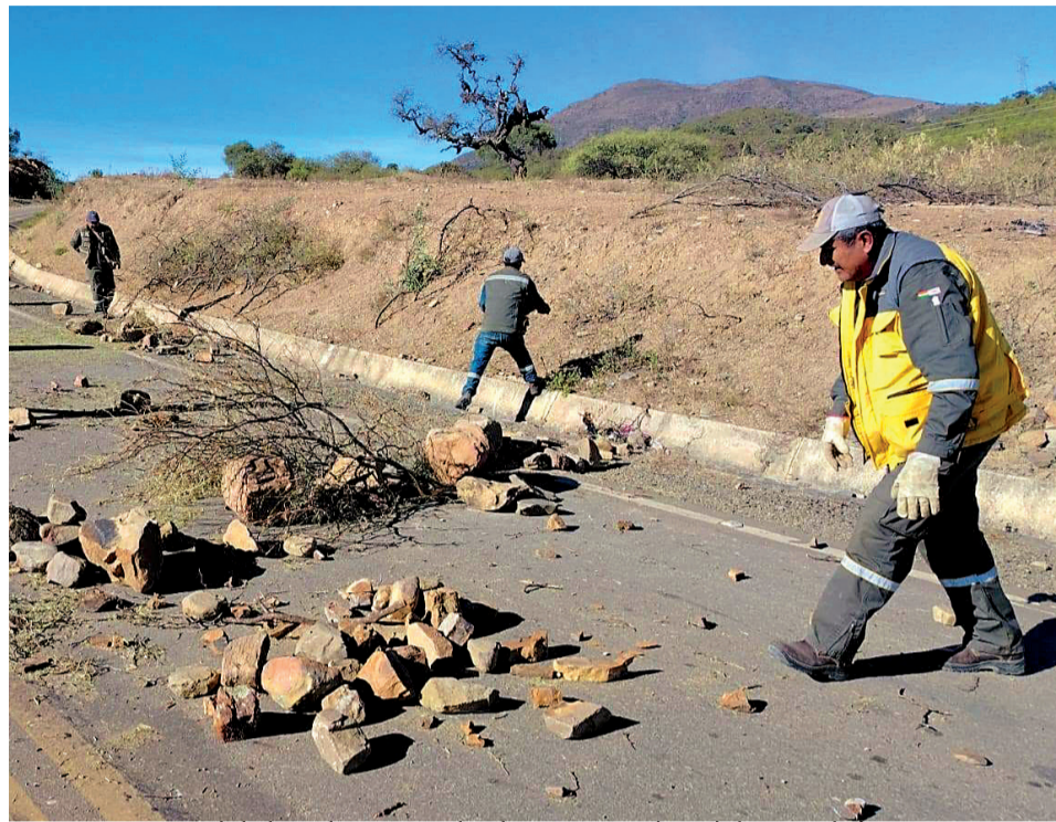
LIMPIEZA. Personal de la Gobernación de Chuquisaca realiza el despeje de las vías, ayer.+

En contraste, en el ampliado del sector cocaleiro, realizado ayer y bajo la conducción del expresidente Evo Morales —procesado por trata agravada y estupro—, se determinó