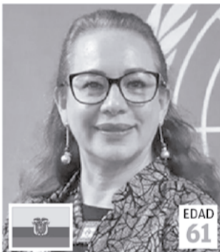
MARÍA FERNANDA ESPINOSA

Expresidente de Senegal (hasta 2024), único candidato que no proviene de América Latina.