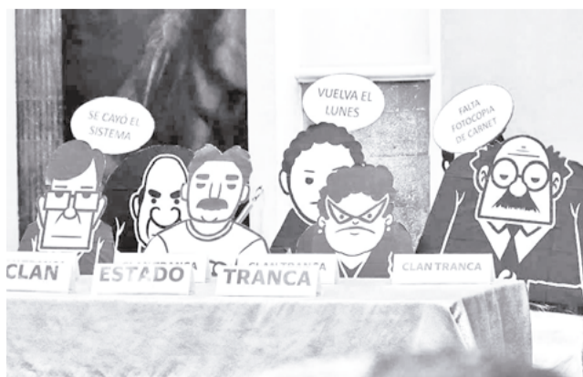
Ya no se solicitará la fotocopia para trámites.

"Ya no te deben pedir fotocopia de carnet de identidad ni de certificado de nacimiento para realizar tus trámites", recordó el Viceministerio de Coordinación y Modernización del Estado mediante una publicación en sus redes.