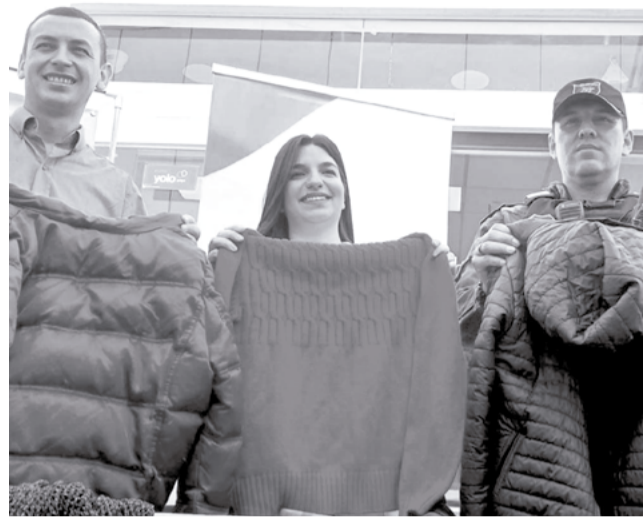
Arranca la campaña de invierno.