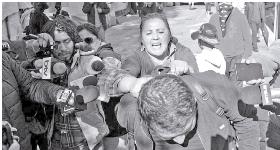
Incidentes entre dirigentes de la COB y ciudadanos ayer en la ciudad de La Paz.

El expresidente Evo Morales cuestionó el pedido de diálogo planteado por cinco centrales obreras departamentales e insistió en mantener el conflicto que se prolonga desde hace 42 días en el país. “Las COD que no movilizaron nada en su departamento, están pidiendo diálogo. ¿Con qué autoridad? Y quiero que compañeros movilizadores sepan, véanlo quiénes son ellos”, afirmó en Radio Kawsachun Coca. Morales indicó que: “Esta lucha es por Bolivia para evitar las privatizaciones, para que no se privatice los servicios básicos, ni salud y educación”.