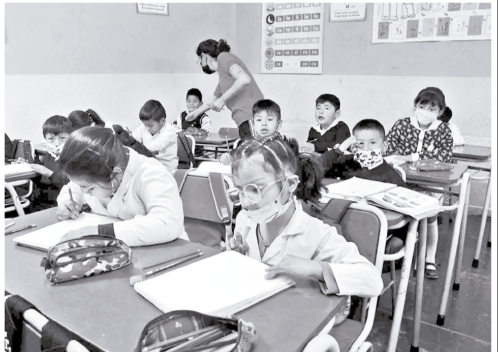
Estudiantes en aula durante una clase presencial. CARLOS LÓPEZ

El rezago es tan profundo que muchos estudiantes apenas en sexto de secundaria logran las habilidades matemáticas esperadas para sexto de primaria, mientras las tasas de aprobación escolar superan el 90%, las evaluaciones revelan que miles de estudiantes aprueban el curso sin dominar competencias esenciales.