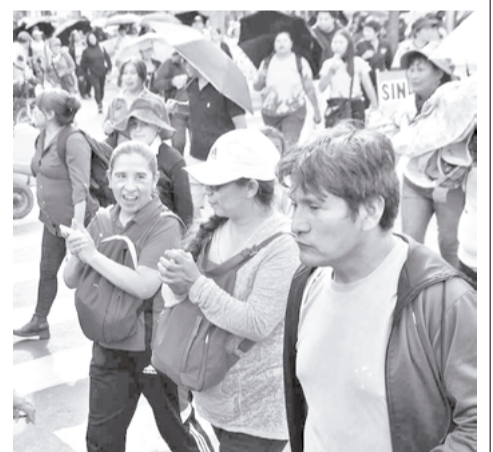
Una protesta del Magisterio. HERNAN ANDIA