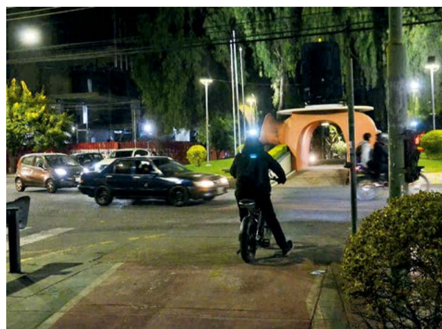
Ciclovia que transita por el Sombrero de Chola.