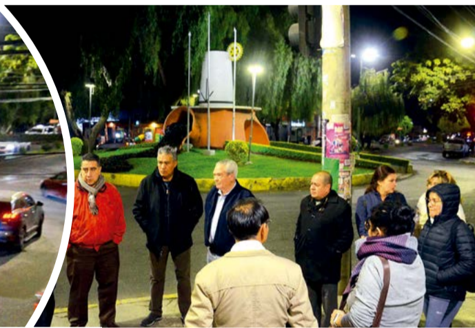
Vigilia de los vecinos de la Av. América.