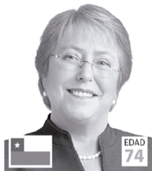
VERÓNICA MICHELLE BACHELET

Actual secretaria general de la Conferencia de las Naciones Unidas sobre Comercio y Desarrollo (UNCTAD) y vicepresidenta de Costa Rica.