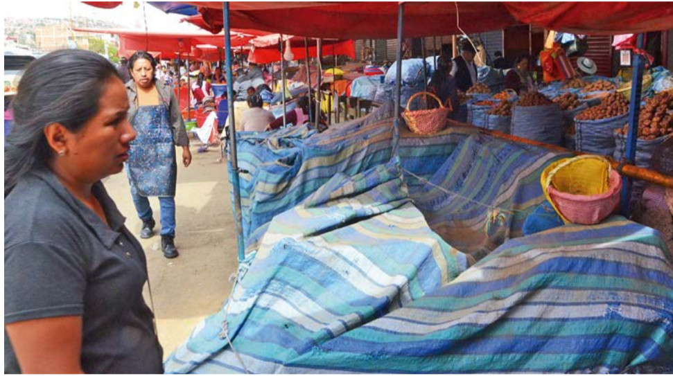
Productos agrícolas en un mercado de Cochabamba. HERNAN ANDIA

Según la Cámara Agropecuaria, hasta la fecha más de 15.000 productores agrícolas o de subsistencia perdieron más de 40 millones de bolivianos. Asimismo, se estima que 8.000 familias productoras de flores registran pérdidas por 16 millones de bolivianos, mientras que la cadena productiva del banano de exportación del Trópico, donde trabajan 22.000 familias, perdieron más de 7,5 millones de dólares y registra un promedio de 15.000 (TM) no exportadas. De las 400.000 familias que trabajan en el campo, más de 200.000 son afectadas.