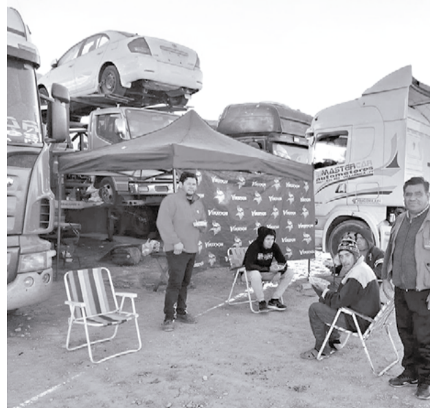
Filas de camiones inmovilizados por los bloqueos.

En tanto, el círculo de Mujeres Periodistas de Oruro, conformado por un grupo de profesionales de la comunicación, impulsó una campa-