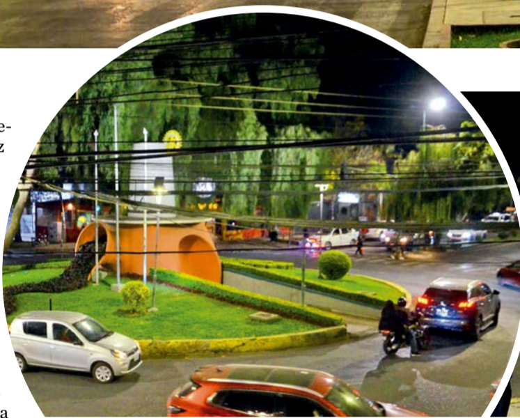
La rotonda del Sombrero de Chola.