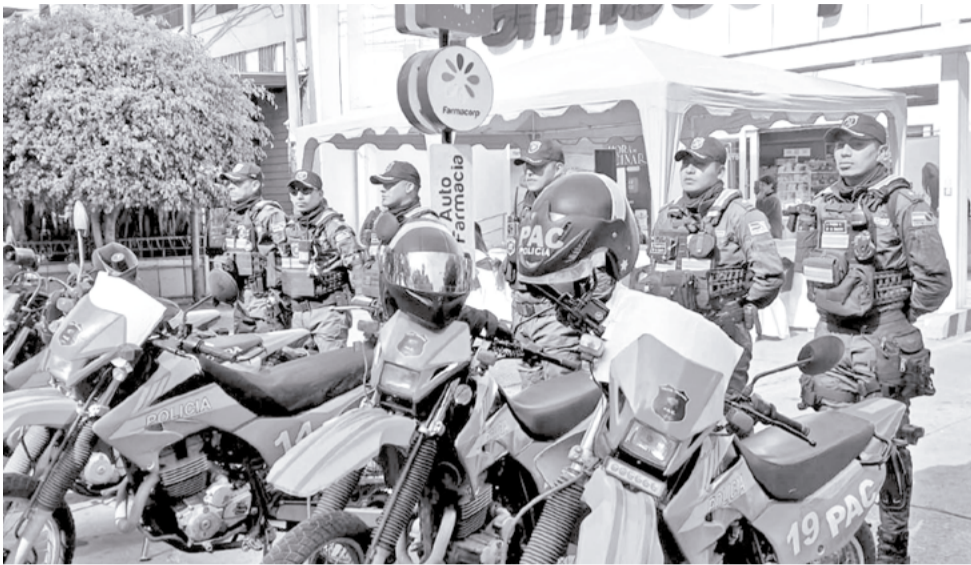
El lanzamiento de la campaña de invierno "Sí Quiero Abrigarte".