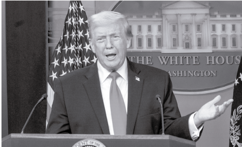
El presidente de Estados Unidos, Donald Trump.

Las cotizaciones bursátiles se dispararon en Asia tras el anuncio de un acuerdo para poner fin a la guerra con Irán y reabrir el estrecho de Ormuz. Los índices de referencia en Tokio y Seúl subieron más del 5%. Los precios del petróleo cayeron más de 3 dólares por barril. Los futuros del S&P 500 subieron 1% y los del Promedio Industrial Dow Jones ganaron 0,8%, lo que augura ganancias tempranas para Wall Street. La noticia fue un enorme alivio para los mercados que se han visto sacudidos desde que el conflicto comenzó en febrero.