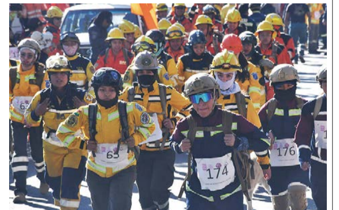
Bomberos en actividades de entrenamiento, ayer. D. JAMES