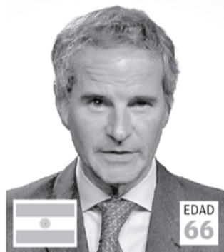
RAFAEL MARIANO GROSSI

Actual director general del Organismo Internacional de Energía Atómica (OIEA), diplomático de carrera.