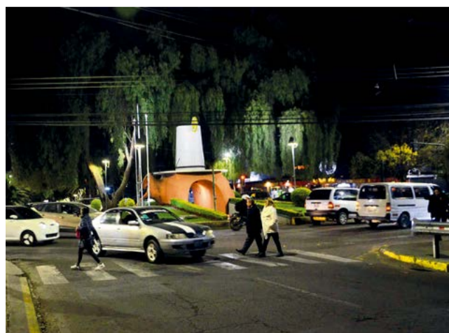
Circulación de personas y movilidad en el lugar.

Los vecinos señalaron que están pendientes y las autoridades aún analizan el proyecto para mostrar una postura oficial.