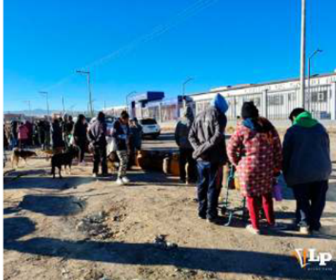
Los vecinos de Dios es Amor hicieron filas desde temprano /LA PATRIA

Uno de los puntos más críticos fue la urbanización Dios es Amor, en la zona Sudeste, donde decenas de familias aguardaron desde temprano para adquirir una garrafa tras enterarse, desde el día anterior, que un camión distribuidor llegaría al sector. La expectativa generó extensas filas de vecinos que buscaban abastecerse