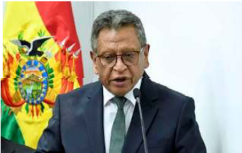
El ministro de Gobierno, Marco Antonio Oviedo, enfrenta una interpelación /REFERENCIAL

Finalmente, López pidió al presidente nato de la Asamblea Legislativa Plurinacional, Edmand Lara, que convoque inmediatamente al pleno del Parlamento para tratar esta interpelación. Sin embargo, precisó que, si el ministro Oviedo desea salir por la puerta grande y no por la ventana, debería renunciar.