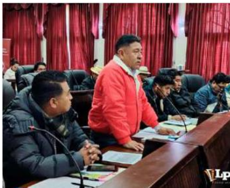
Varios asambleístas participaron del debate

Por otro lado, algunos asambleístas defendieron la iniciativa, considerando que las multas podrían ayudar a "disciplinarse" dentro de la entidad. Sin embargo, el presidente de la ALDO, Eugenio Huaricallo, aclaró: "Se acordó que podamos tener esas reuniones de coordinación al menos iniciando con los presidentes de cada comisión... apelo a