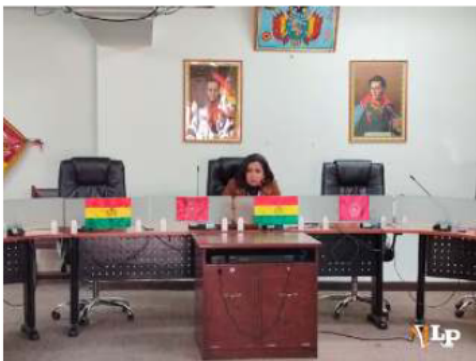
La diputada Ponce en conferencia de prensa

La diputada hizo un llamado al Ministerio de Trabajo para abrir su despacho y recibir toda la información necesaria para iniciar una investigación.