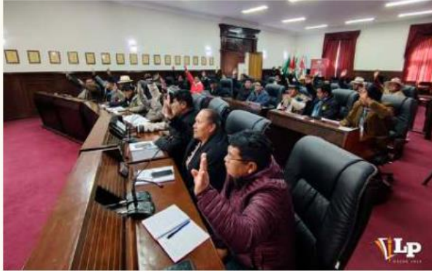
Los asambleístas votaron a favor de los cuatro puntos para la agenda legislativa

seguimiento y fiscalización. Esto garantizará un uso transparente, eficiente y responsable de los recursos públicos en proyectos y programas ejecutados en beneficio de la población.