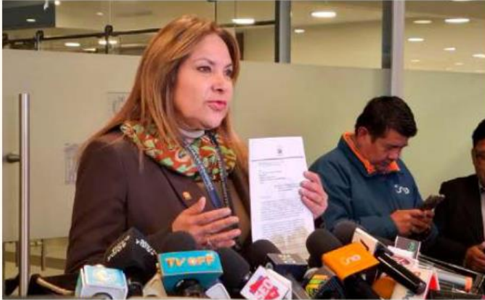
La senadora Khatia Quiroga pidió que la comisión se concrete lo antes posible