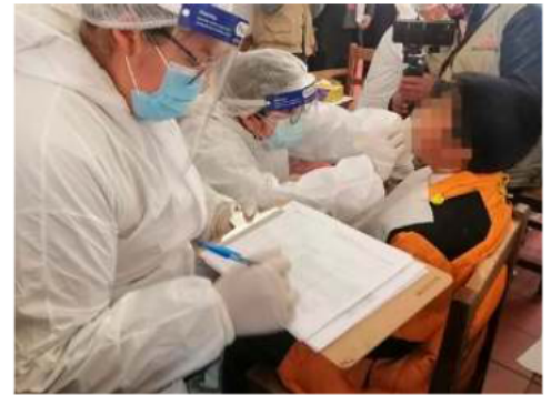
Casos del virus fueron reportados en una unidad educativa

El director aclaró que no existe un tratamiento específico para eliminar el virus. Por lo tanto, el