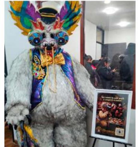
Exponen un traje del bloque Osos Ferrucos de la Diablada Ferroviaria en el Centro Lljatymanta