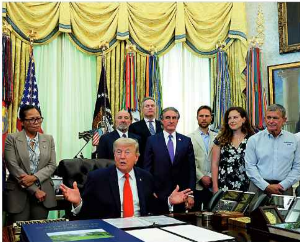
EE.UU. El presidente estadounidense, Donald Trump, y su equipo de trabajo.

Al ser preguntado si el líder supremo iraní, el ayatolá Mojtabá Jamenei, apor-