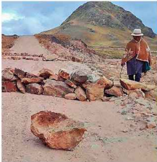
PERJUICIO. Los obstáculos impiden vivir en la normalidad.

Reportes oficiales confirman un saldo trágico de más de 13 personas fallecidas a causa de los bloqueos, además de un severo desabastecimiento de alimentos de primera necesidad y carburantes en los principales