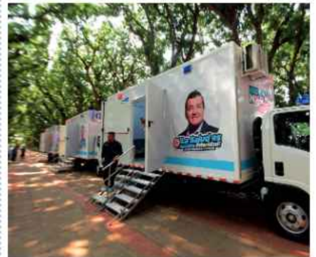
SERVICIO. Los motorizados fueron presentados en 2024.