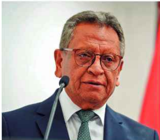
PERFIL. Oviedo durante una reciente conferencia de prensa.

La bancada de Libre solicitó ayer la interpelación al ministro de Gobierno, Marco Antonio Oviedo. La medida responde a una presunta "inacción" e "incapacidad" de la autoridad ante los persistentes bloqueos de carreteras que afectan el libre tránsito en el país desde hace 43 días.