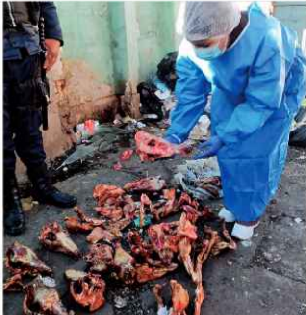
HALLAZGO. Los despojos animales despiertan sospechas.

El hallazgo de al menos 35 cráneos pelados y restos óseos, presuntamente caninos, el pasado martes dentro de contenedores de basura horrorizó a los vecinos de la zona Brasil, cerca de la Plaza del Dinosaurio en Río Seco, de El Alto. El hallazgo desató alarma y activó un estado de emergencia sanitaria en esa urbe y en la ciudad de La Paz, ante el temor de que este producto cárnico llegue a los mercados de abasto popular.