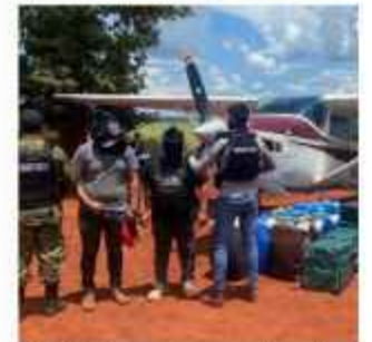
ILEGAL. La avioneta donde se trasladaba la droga.

Al momento de la inspección física de la cabina, los agentes contabilizaron un total de 260 paquetes rectangulares prensados que dieron positivo al análisis que confirmó que los paquetes eran droga.