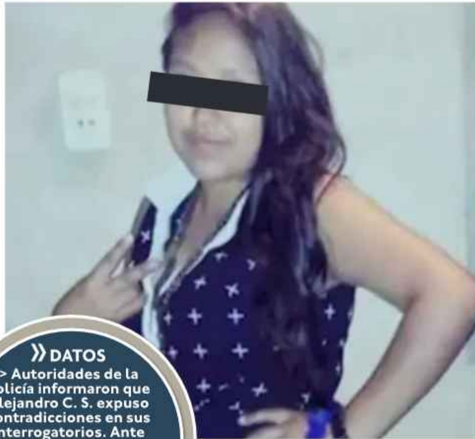
VIOLENCIA. La madre de familia tenía 26 años.

Tras cometer el crimen, el agresor envolvió el cuerpo inerte de la víctima en bolsas plásticas grandes y