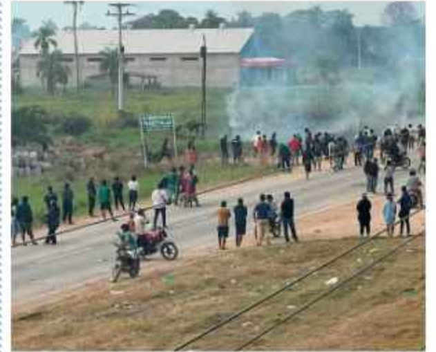
DATO. Integrantes de la UJC participaron en un operativo.

La Unión Juvenil Cruceña (UJC) formalizó ayer ante la Fiscalía Departamental una denuncia penal por los delitos de terrorismo, alzamiento armado e instigación pública a delinquir.