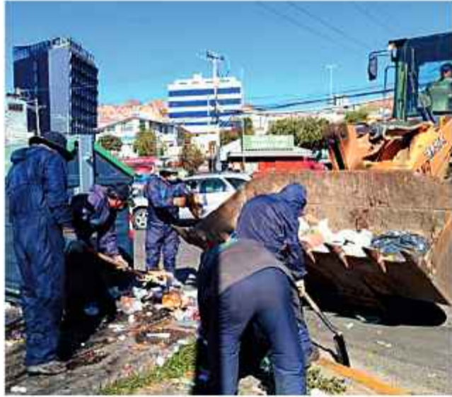
RECOJO. Funcionarios ediles se ponen manos a la obra.

El Gobierno Autónomo Municipal de La Paz activó un operativo de contingencia con más de 100 operarios públicos y maquinaria pesada para recolectar los residuos acumulados en las calles de sede del gobierno.