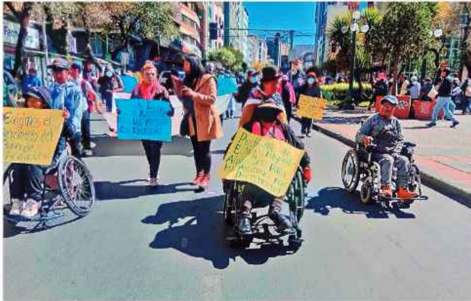
PROTESTA. El sector realizó ayer otra marcha hasta el Ministerio de Salud, nadie los atendió.

Ante la falta de respuestas del Ejecutivo, las personas con discapacidad del país iniciarán una marcha desde el municipio de Patacamaya la próxima semana. La movilización busca profundizar la protesta social frente al silencio de las autoridades del sector.