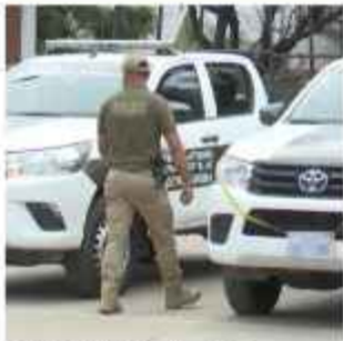
TERRIBLE. La bebé fue abandonada ayer.

Efectivos policiales rescataron a la recién nacida, quien se encontraba cerca de unas plantas. Ellos procuran identificar y localizar a la mujer. La Defensoría de la Niñez busca además al entorno familiar.