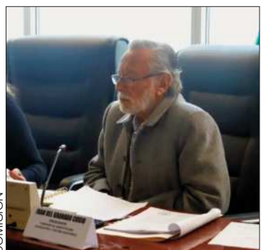
El diputado Juan del Granado.

La reunión abordó aspectos técnicos y legales de la nueva convocatoria