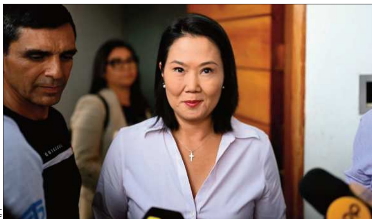
ANUNCIO. La candidata derechista agradeció el apoyo recibido.