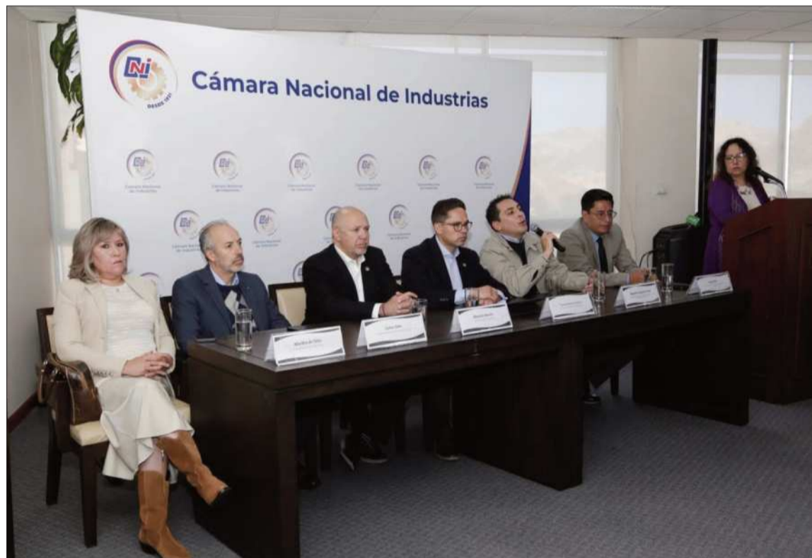
LA PAZ. Presentación del Plan Nacional de Reactivación Económica y Empleo en rueda de prensa.

A corto plazo, la propuesta del sector contempla un programa de alivio económico con seis pilares estratégicos vinculados a los ámbitos tributario, crediticio, de compras estatales mediante el programa Compro Boliviano, así como medidas relacionadas con electricidad, telecomunicaciones