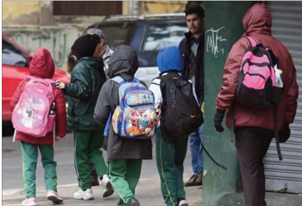
DESCANSO. No se descarta adelantar las vacaciones de invierno en el departamento de La Paz.

Esta disposición está inscrita en la Resolución Ministerial 001/2026. El artículo 9 de la norma establece que el descanso pe-