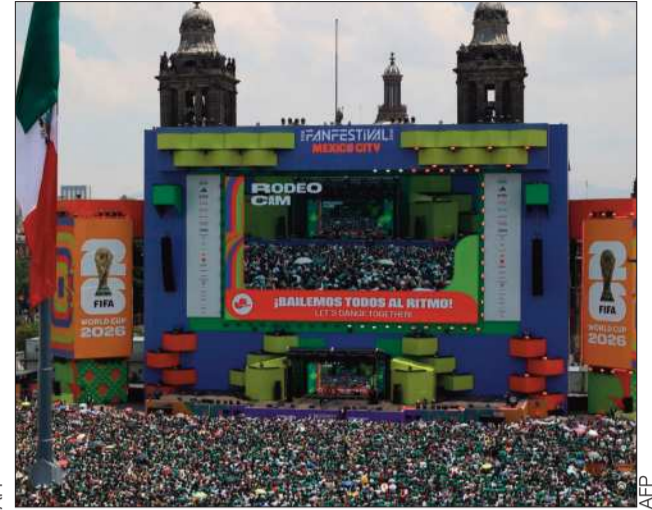
ZÓCALO. Miles de personas en el fan fest en México DC.