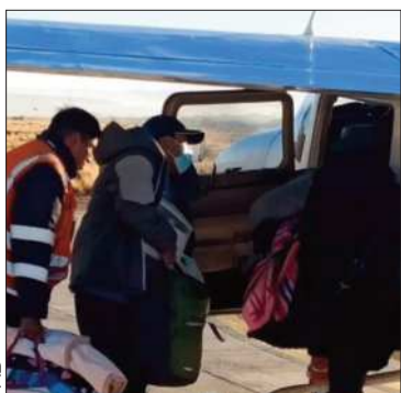
La niña junto a su madre.

La menor de edad no podía ser trasladada vía terrestre por los bloqueos