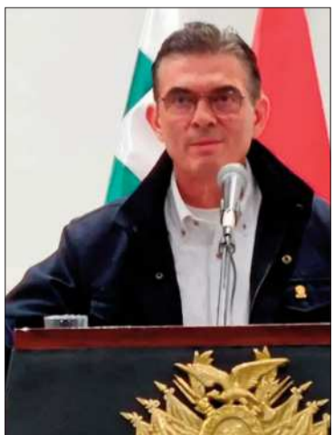
El presidente Rodrigo Paz.

Machado advirtió de desestabilización por los conflictos en el país