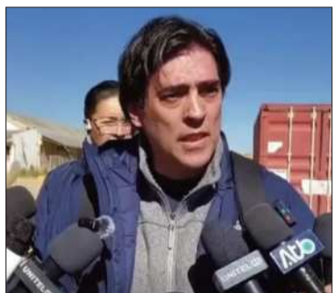
El ministro Mauricio Zamora.

Se busca reforzar el transporte aéreo de productos esenciales