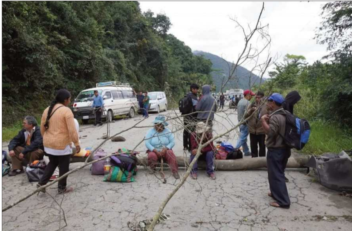
MEDIDA. Un bloqueo en el norte de La Paz impide el tránsito vehicular.

"Desde ayer ha empezado a ingresar combustible a nuestras ciudades, es imprescindible que esta situación se normalice este fin de semana, con o sin diálogo, va a ocurrir", sostuvo.