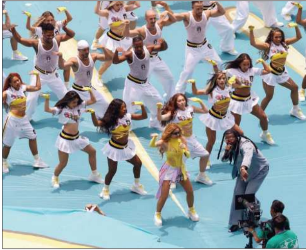
SHAKIRA. La colombiana fue una de las figuras.