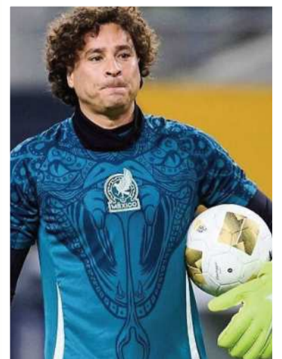
El arquero Guillermo Ochoa.

"Salí a la cancha para agradecer lo que he vivido en este día que marca la historia", dijo el guardameta que juega para México con el número 13 en el dorsal.