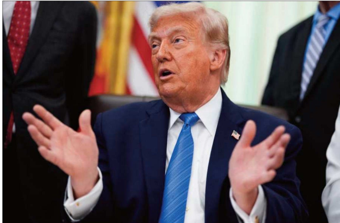
OPTIMISMO. El mandatario tiene la certeza que el acuerdo se firmará muy pronto y quizá en Europa.

"En algún momento en un futuro no muy lejano, tomaremos la isla de Jark y otros puntos de in-