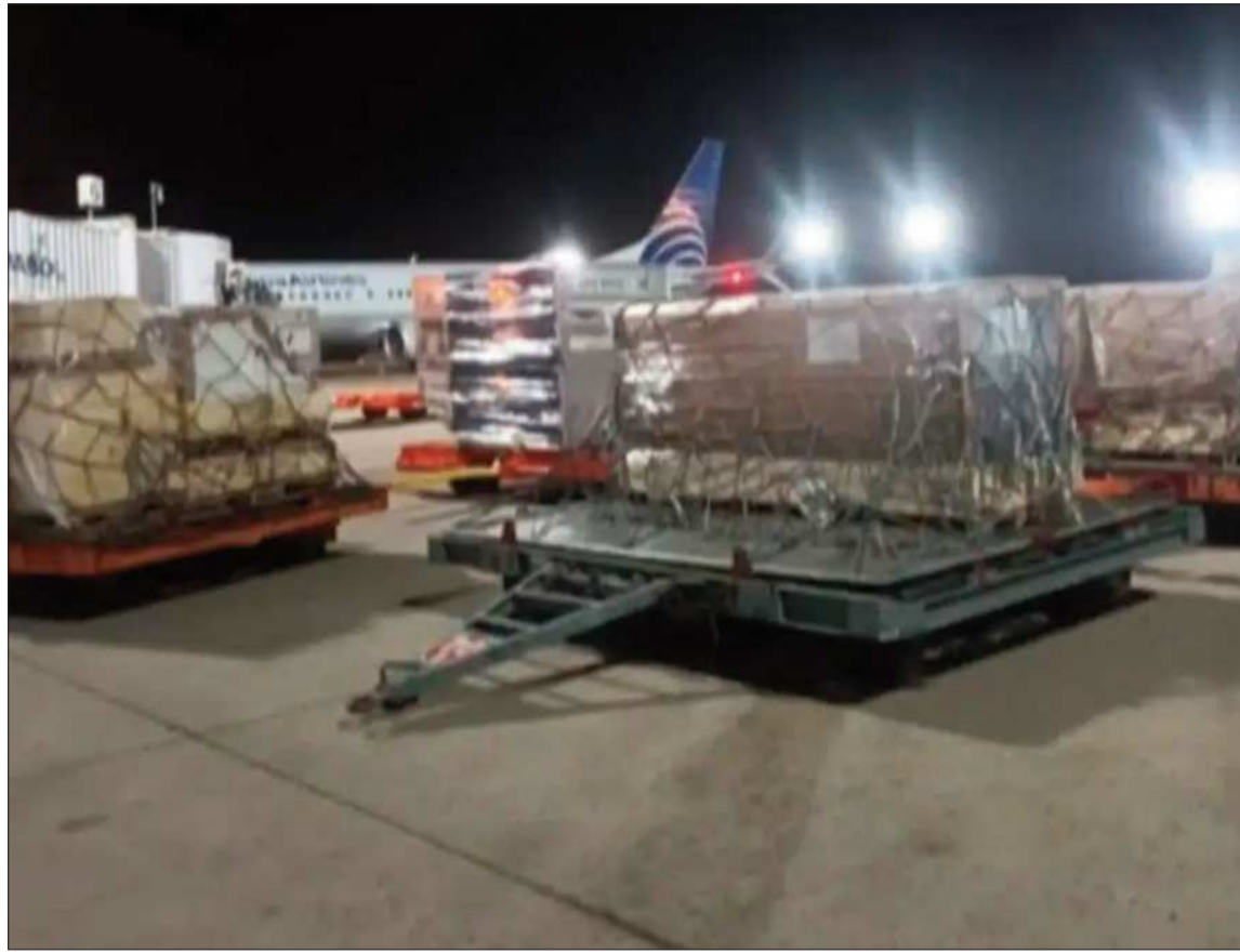
AEROPUERTO. La mercancía intervenida en la terminal aérea de Santa Cruz de la Sierra.

La alerta se activó cuando los canes detectores de la unidad canina antidroga reaccionaron positivamente ante los pallets de roble y los marcaron como sospechosos. Ante esta señal, AVSEC bloqueó el procedimiento de carga, contradiciendo la postura de los agentes de la FELCN que, de