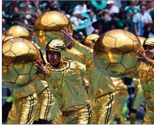
COLORIDO. Decenas de bailarines con traje de trofeos.