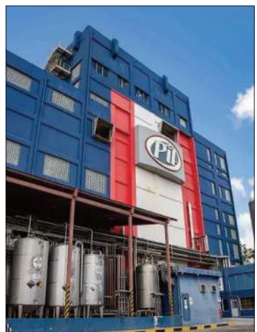
La planta de PIL en La Paz.

La planta tuvo que paralizar debido a la falta de materia prima