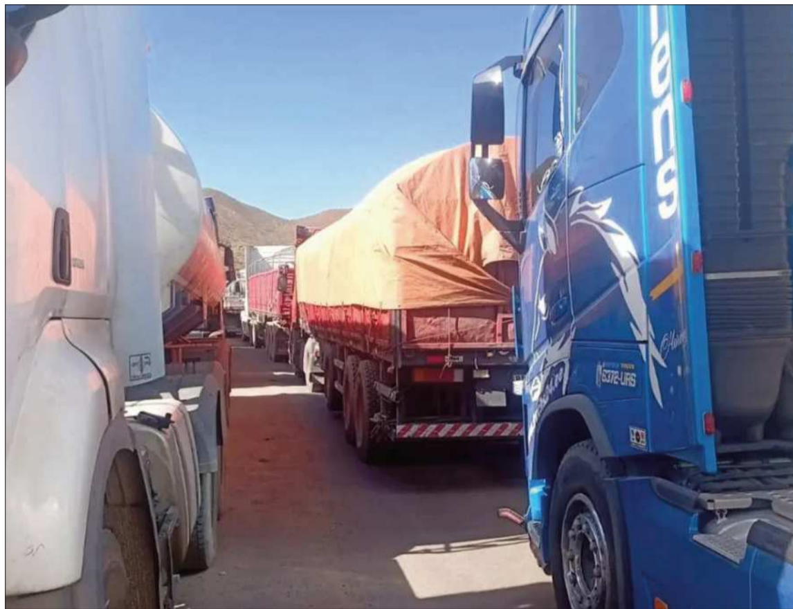
BLOQUEO. Una gran cantidad de camiones quedaron varados por los bloqueos a escala nacional.

El dirigente advirtió que la situación del sector es insostenible, ya que los transportistas internacionales llevan más de seis semanas sin poder trabajar, lo que afec-