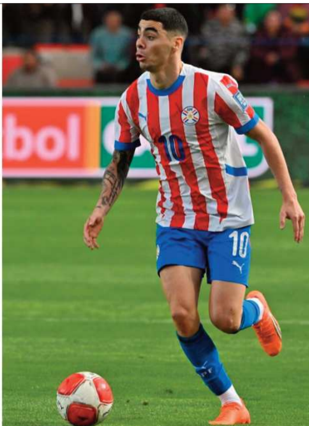
INICIO. Estados Unidos y Paraguay se enfrentarán en el Estadio de Los Ángeles.