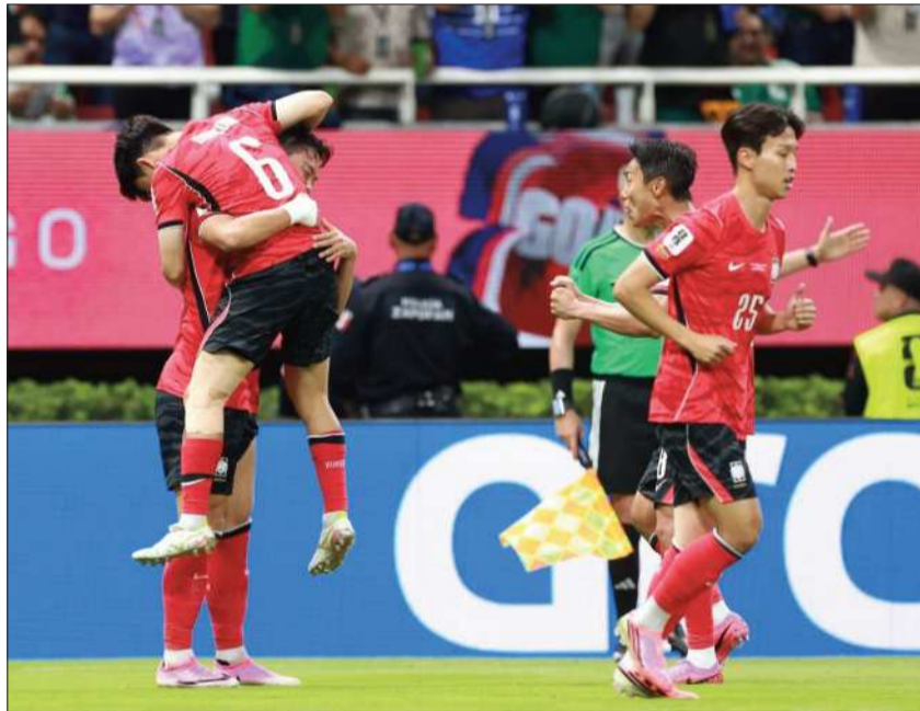
CELEBRACIÓN. Corea del Sur se impuso por 2-1 a República Checa.

La próxima maldición a superar es la de los cuartos de final, instancia que la selección mexicana nunca ha rebasado en su historia mundialista.