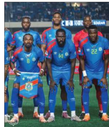
El equipo listo para el Mundial.

La delegación de los Leopardos, a quien las autoridades de Estados Unidos impuso un aislamiento en "burbuja sanitaria" de 21 días en Bélgica antes de este torneo, ate-