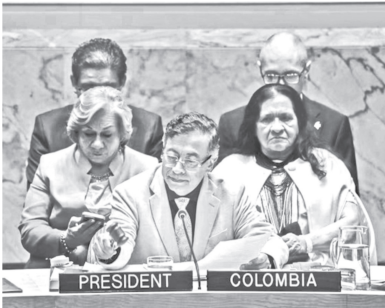
Gustavo Petro, presidente de Colombia, en la sesión de la ONU, ayer.