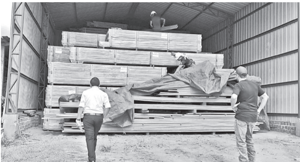
Allanamiento en un aserradero en el departamento de Pando.

Ayer se realizaron al menos dos allanamientos en el departamento de Pando, en el marco de la investigación por la incautación en Chile de al menos 108 toneladas de droga impregnada en madera. El primer allanamiento fue realizado en un aserradero en la ciudad de Cobija y el segundo en Porvenir. De acuerdo con los primeros informes, los operativos tienen como objetivo recolectar elementos de prueba sobre la presunta vinculación de estas empresas de madera bolivianas con el envío de cargamentos de madera hacia Arica, Chile.