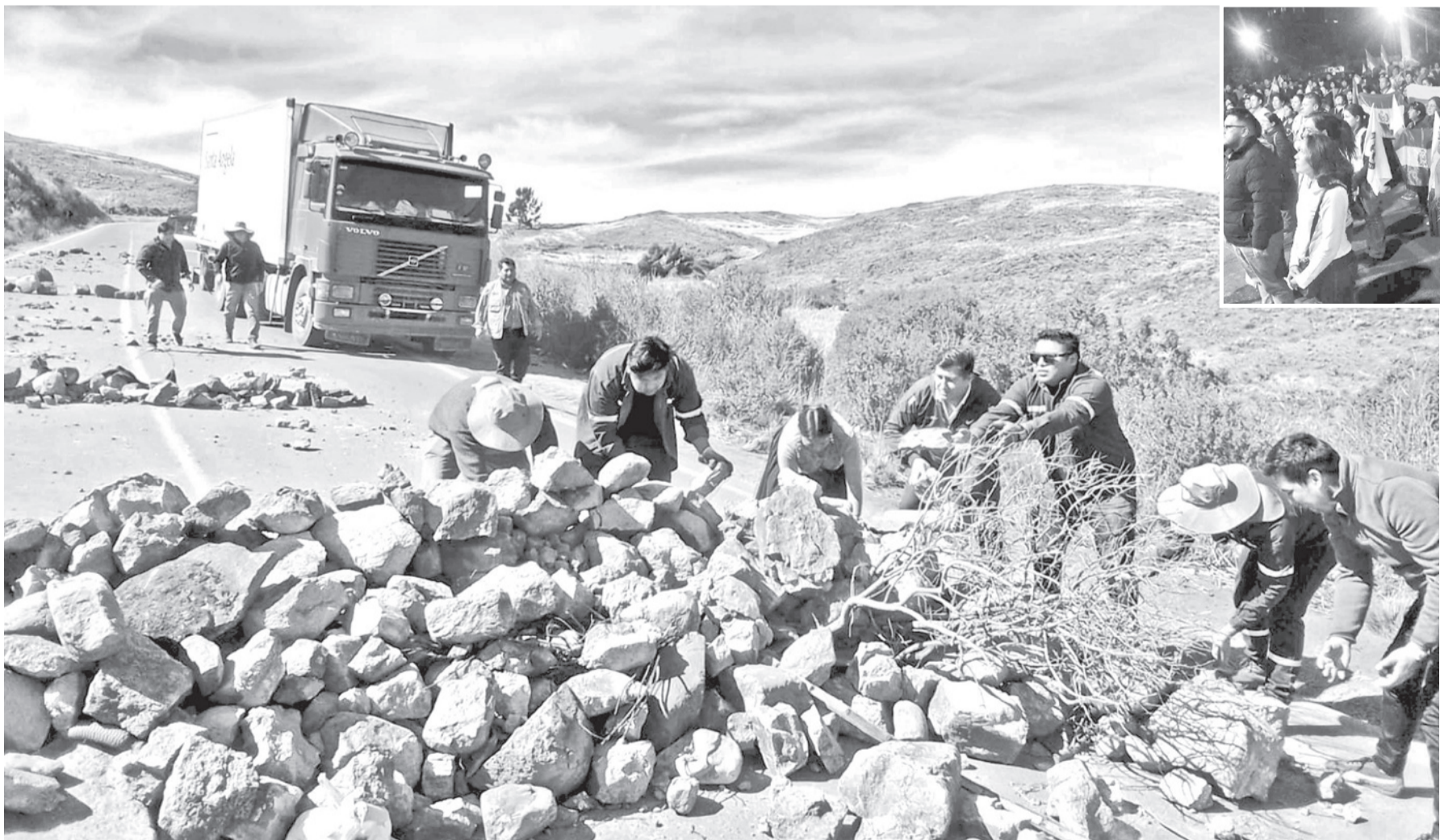
El camión con medicamentos para pacientes renales superó el bloqueo en Aguirre, ayer.