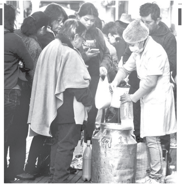
Venta de leche en la plaza principal.

La Justicia envió ayer a 11 personas de los grupos de choque que bloquearon Vinto a la cárcel de San Pablo de Quillacollo.