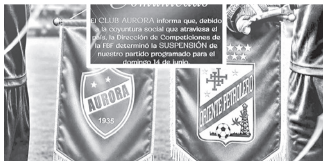
Clubes que anuncian pausa por conflictos. CLUB AURORA

Decisión. La Federación de Fútbol se pronunciará en las próximas horas sobre el futuro de los partidos que están programados