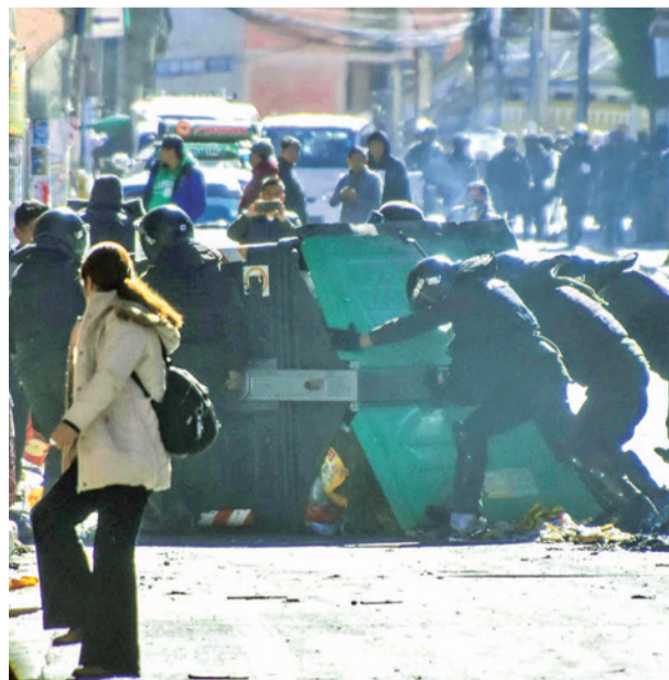
Policías detrás de un contenedor de basura.