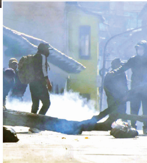
Manifestantes se reorganizan tras la gasificación.

Luego de las aprehensiones y del despliegue policial en el centro paceño, las movilizaciones terminaron.