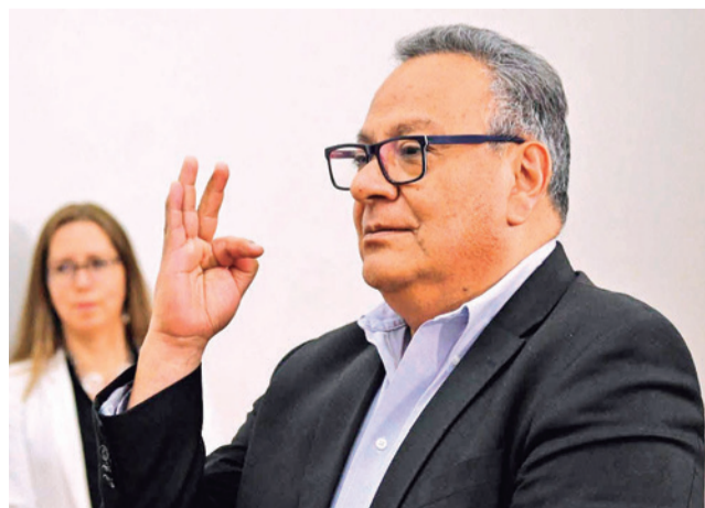
El nuevo ministro de Educación, Erick Sanjinés.

Por su parte, Paz destacó la experiencia de Sanjinés en el área educativa y señaló que el país enfrenta importantes desafíos en este ámbito.