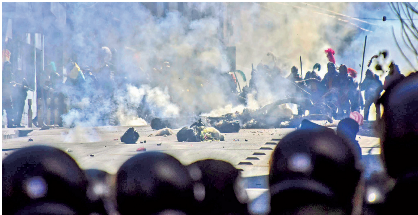
Duros enfrentamientos entre grupos de choque de la marcha contra el Gobierno y la Policía en el centro paceño, ayer.