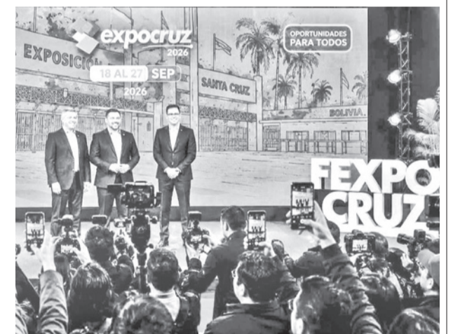
El lanzamiento de Expocruz 2026. VIBRAS TV BOL

Además, se espera la presencia de países del exterior que en 2025 estuvieron presentes con stand en los que buscaban alianzas estratégicas para el desarrollo de la economía boliviana pese a los conflictos.