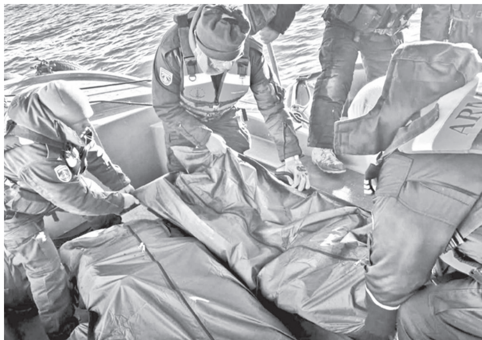
El rescate de los marinos y civiles fallecidos en el lago Titicaca. ARMADA BOLIVIANA

La institución informó que dispuso el inicio de investigaciones administrativas y ope-