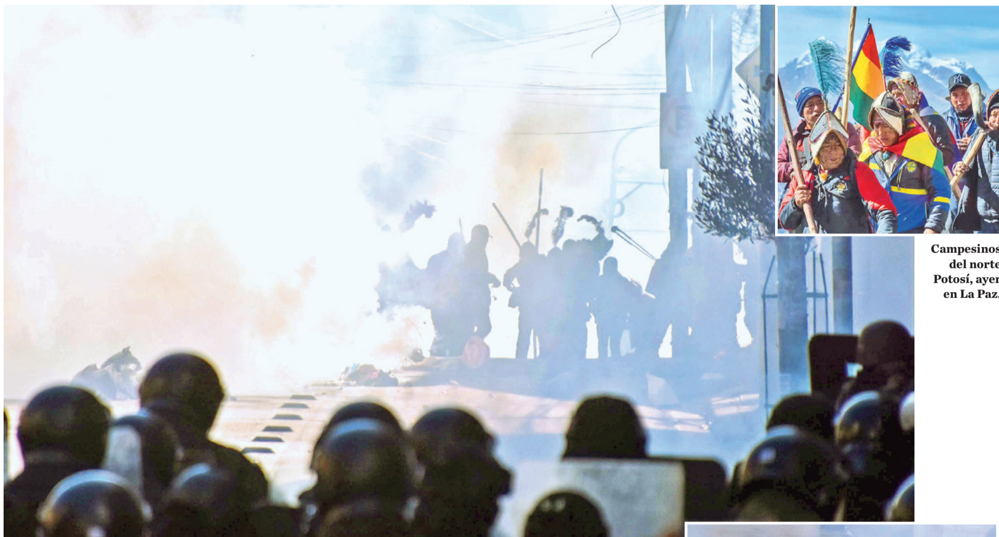
Campesinos del norte Potosí, ayer en La Paz.

Enfrentamientos entre policías y manifestantes, ayer en la ciudad de La Paz.