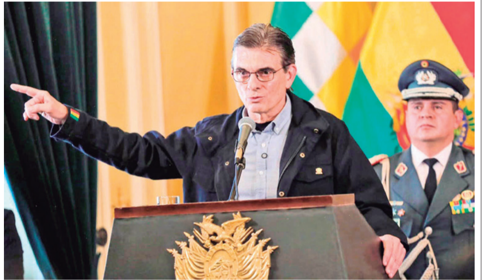
El presidente del Estado, Rodrigo Paz, ayer en El Alto. OPRP

También en el acto de la ciudad de El Alto, Paz dijo que “cuando se es presidente, se debe cumplir con lo que la Constitución exige para preservar la democracia. (...) Lo que no permitiré es el narcoterrorismo. Ya lo dije en el momento oportuno: sus días están contados”, aseguró.