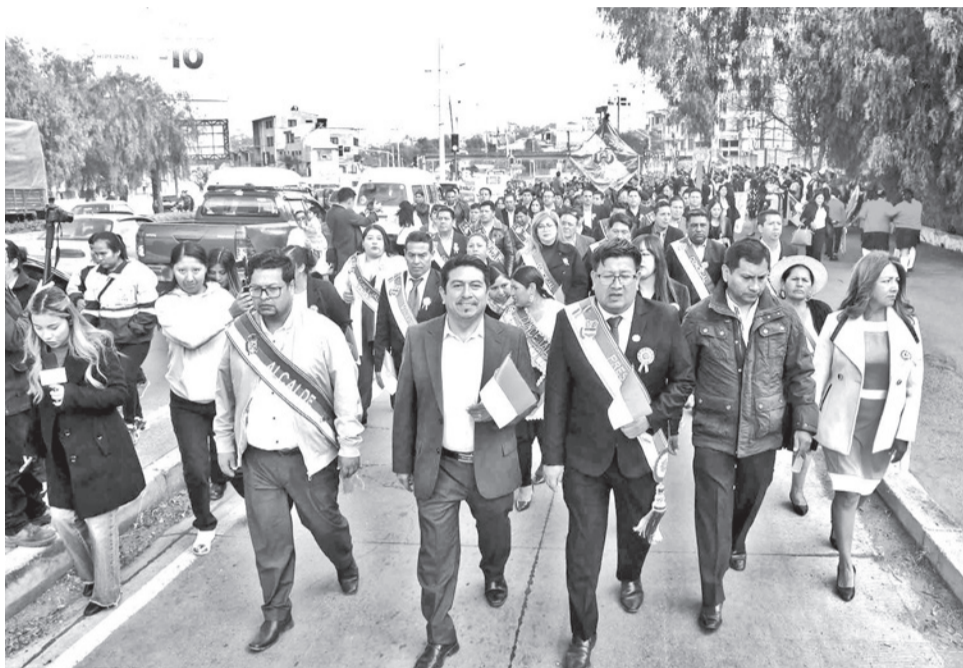
El acto por el aniversario de la provincia Chapare, ayer.

bién estuvo marcada por momentos de tensión. Se registró un altercado entre funcionarios de las alcaldías de Cochabamba y Sacaba debido a la