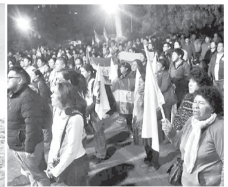
El cabildo del Comité Multisectorial.