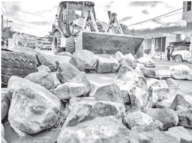
Maquinaria municipal desbloquea ruta a Santiváñez.

El cargamento partió el lunes de Ichilo y llegó ayer por la tarde al Sedes para distribuir los medicamentos a los hos-