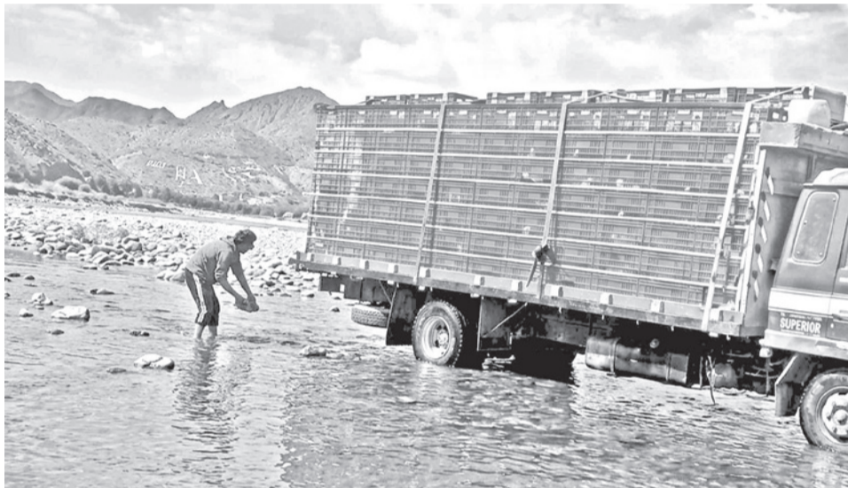
Camioneros recogen agua de los charcos para hidratar a los pollos.

En los puntos de bloqueo, los pollos permanecen dentro de las jaulas que fueron ex-