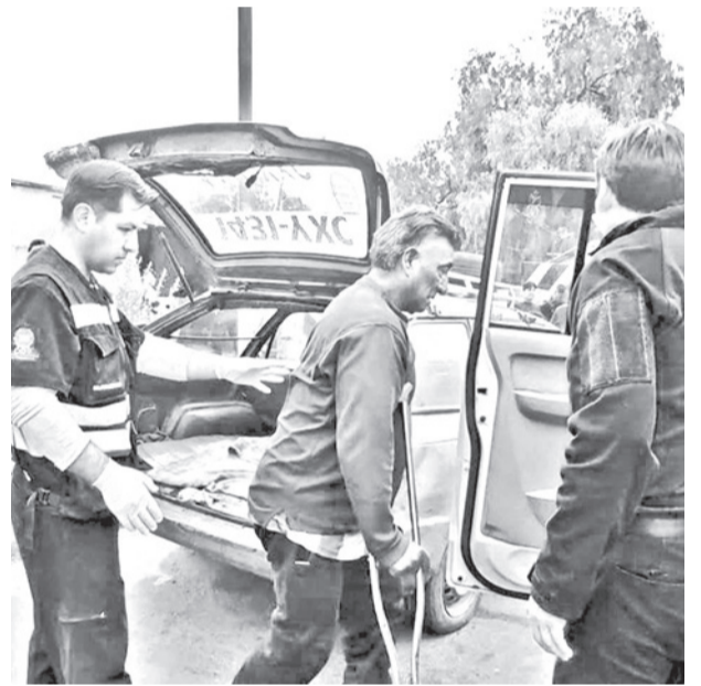
La ayuda a los choferes varados en la terminal.