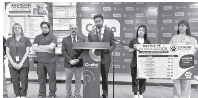
Salud y Zoonosis presentan el SUM, ayer.

Bienestar. Las atenciones tendrán un costo social y los ingresos se destinarán al sostenimiento de los animales rescatados