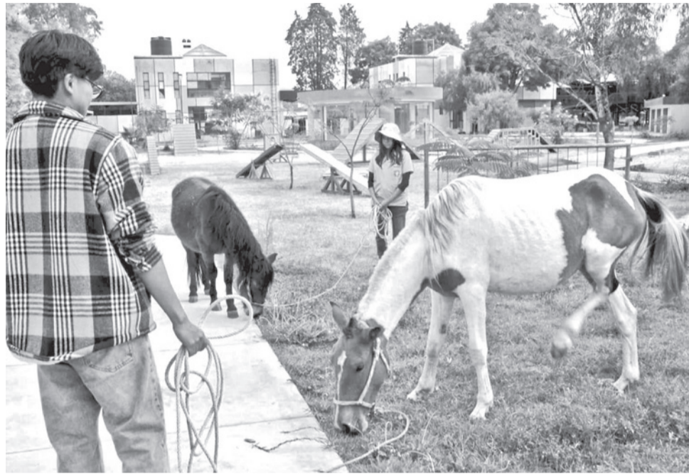
Los caballos rescatados que se halla en el centro de Zoonosis, ayer. HERNAN ANDIA

Respecto al futuro de los equinos, Zoonosis convocó a los propietarios y a representantes de la Sociedad Protectora de Animales a una reunión para definir quién se hará cargo de los ejemplares.