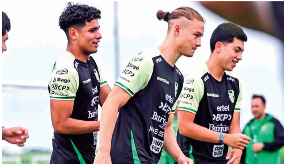
El entrenamiento de la Selección Nacional en EEUU.

Este partido se jugará en medio de la incertidumbre, especialmente para la Federación Boliviana de Fútbol (FBF), pues hasta ayer los funcionarios no conocían en qué campo deportivo se disputaría el cotejo, además de su horario. En un inicio se dijo que se disputaría desde las 16:00, después se dijo que sería a partir de las 13:00 final-