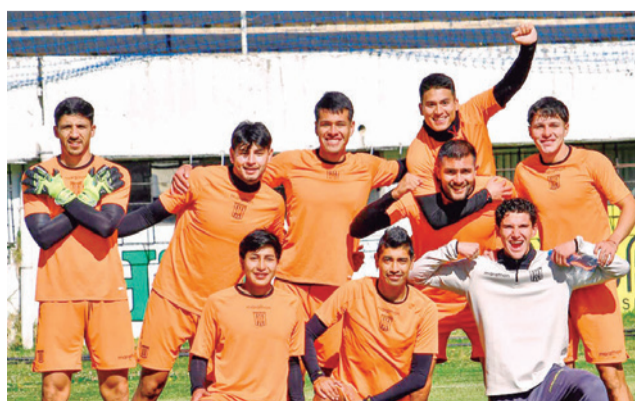
Los jugadores de The Strongest.

Además, los dirigentes consideran dar una “vacación” obligada a los jugadores, pues al no haber cotejos tampoco hay recaudaciones, lo que complica el pago de planillas de sueldos a los fut-