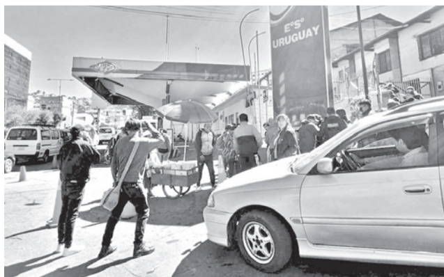
Las filas por combustible en La Paz.