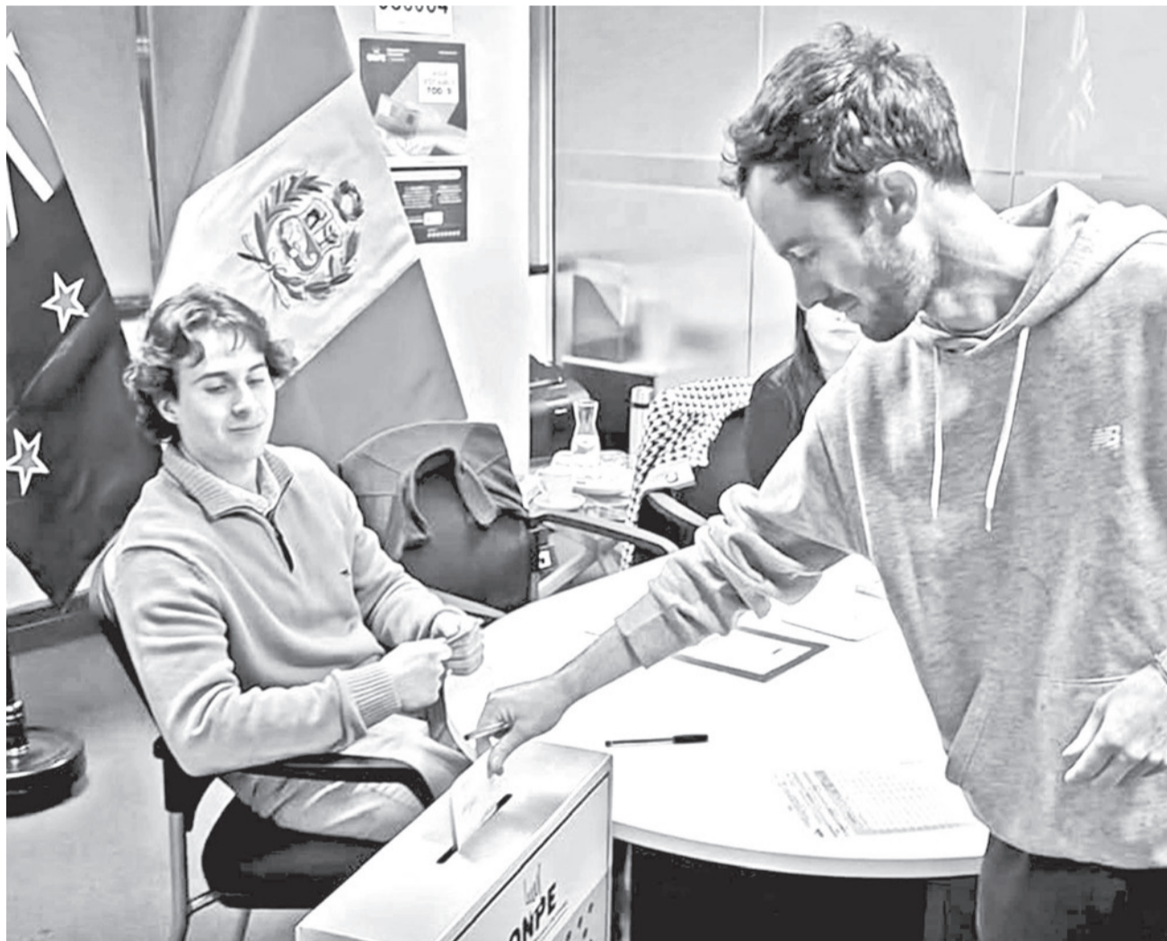
Un residente peruano emite su voto en Nueva Zelanda, el domingo pasado.

Pugna. El candidato izquierdista mantiene una ínfima ventaja; la aspirante de derecha parece encaminada a ganar en el exterior