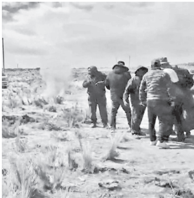
Los conductores bloqueados en Desaguadero. CDTC

Los conductores solicitaron el envío de refuerzos policiales y ayuda inmediata para res-