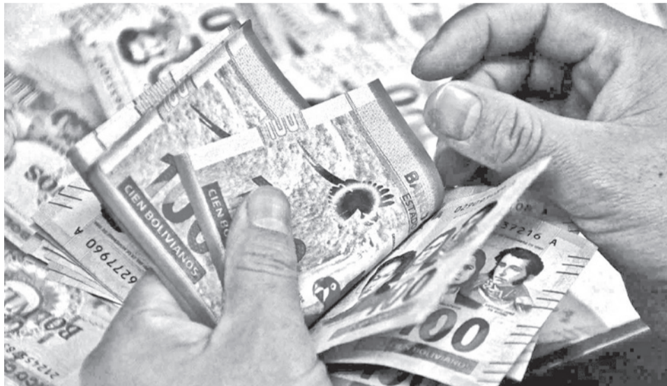
La moneda en bolivianos para el pago de los créditos. CARLOS LÓPEZ

El decreto crea una libreta específica denominada