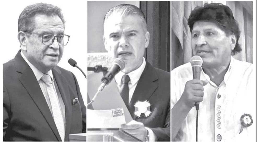
Los ministros de Gobierno, Marco Oviedo, y de Defensa, Ernesto Justiniano. El expresidente del Estado, Evo Morales.

“Sobre la Ley del Estado de Excepción, quiero decirles para dejar de lado varias especulaciones que han estado circulando, que esta es una atribución del gabinete de ministros a la cabeza del Presidente”, explicó el Ministro.