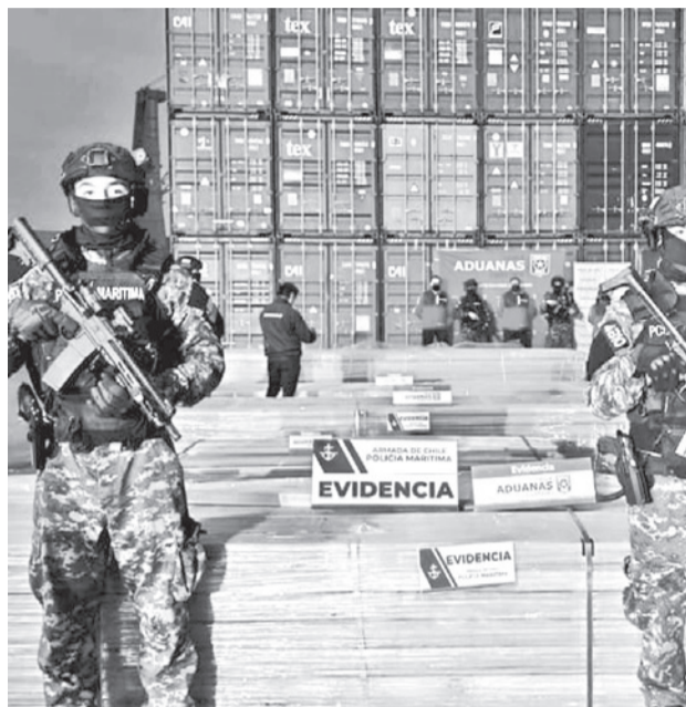
El cargamento con droga hallado en Chile.