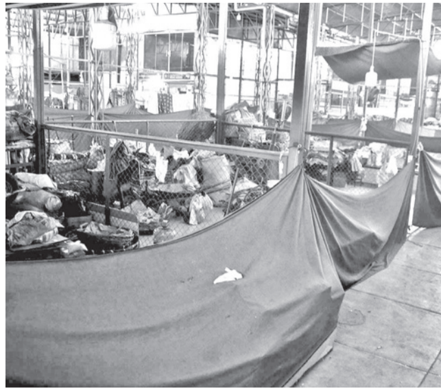
Los mercados sin alimentos para la venta.