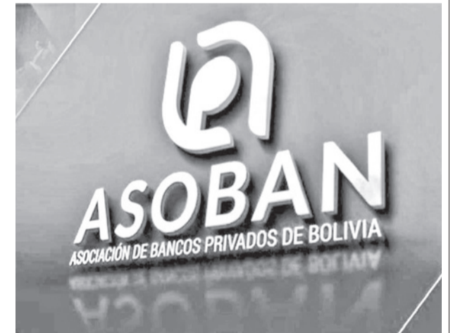
El logo de Asoban.

“El sector bancario, consciente de la importancia de acompañar a sus clientes en coyunturas adversas, ha venido aplicando, desde antes de la pandemia y con especial énfasis durante los últimos años, mecanismos de apoyo como reprogramaciones, refinanciamientos y períodos de gracia, siempre en el marco de la normativa vigente y bajo una evaluación responsable, considerando la situación particular de cada cliente financiero”, subrayó.