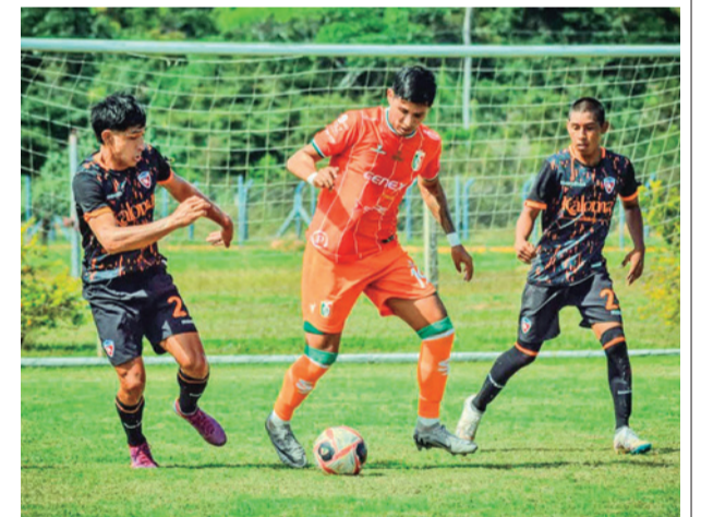
Un partido de FC Santa Cruz. RRS5

En Chuquisaca pasaron a la ronda de llaves Universitario, Atlético Junior, Atlético Sucre y Fancesa; y se eliminaron Nacional Sucre, FC Flamengo, Club Impacto Deportivo y Tomina Lions.