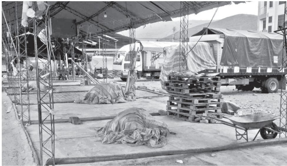
Los puestos del mercado de frutas en el sur cerrados sin nada que ofrecer.