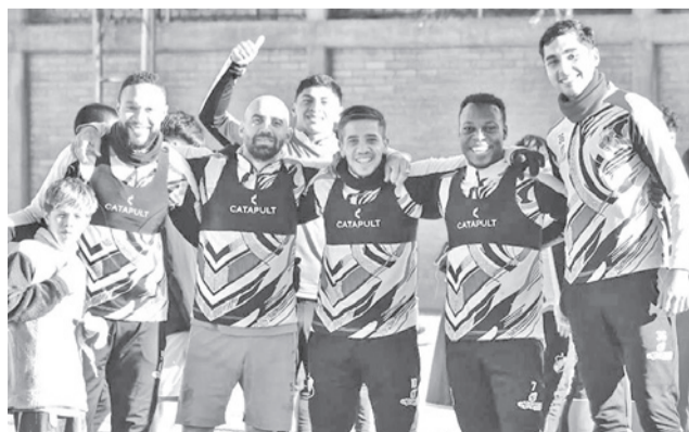
Jugadores de Nacional Potosí. CANP

El compromiso forma parte de la novena fecha del campeonato nacional, que fue reprogramado por la Federación Boliviana de Fútbol (FBF) para este fin de sema-