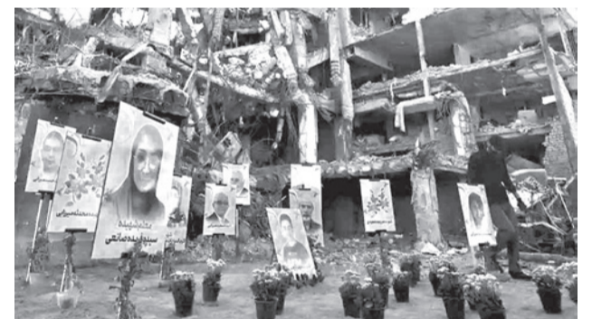
Rostros de víctimas civiles iraníes, junto a edificios destruidos.