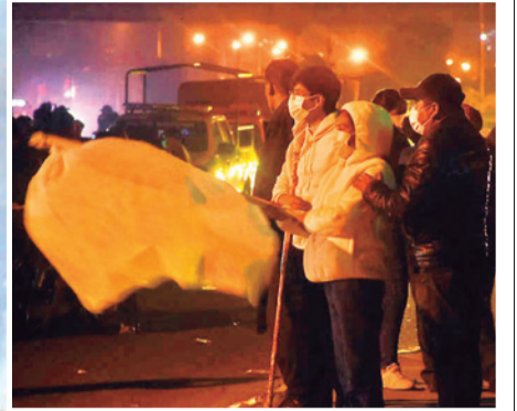
Vinteños salen con banderas blancas contra los bloqueos.