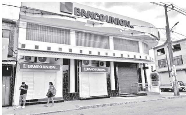
El Banco Unión cerrado en el trópico. SACABA COCHA DIGITAL

Además, explica que esta medida se adopta con el