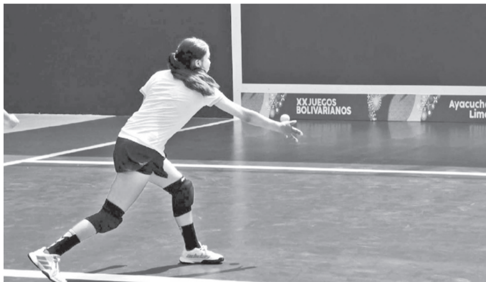
Una demostración de juego de pelota vas. COB

“Oficialmente este deporte ingresará dentro del programa de los Olímpicos, pero en una primera instancia como invitado”, explicó el dirigente, quien agregó que, con ese afán, uno de los objetivos de la Federación es que los depor-