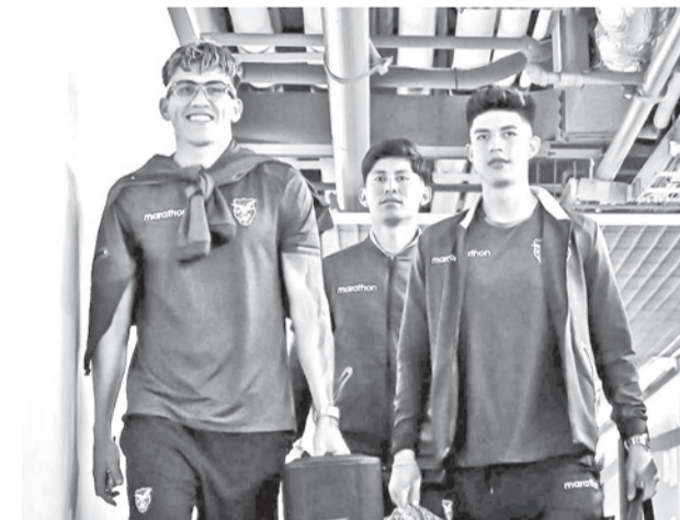
Jugadores de la Selección Nacional. FBF

Se espera que Bolivia logre mejores resultados en las siguientes eliminatorias camino a la máxima cita mundialista en 2030.