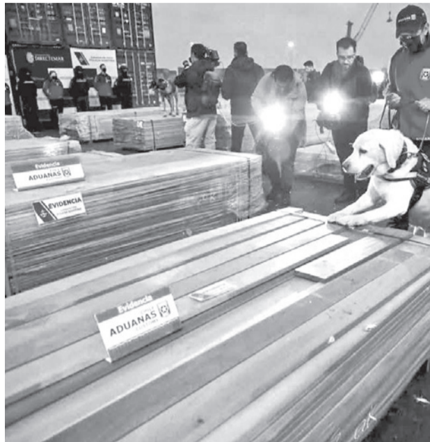
Inspección de la madera con droga en Chile.

La investigación se desarrolló durante seis meses, lo