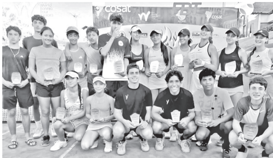
Los ganadores del Jenecherú Junior Open, en Santa Cruz. ADTSCZ

Las canchas del Club de Tenis Santa Cruz albergó el campeonato en el que se lograron seis títulos.