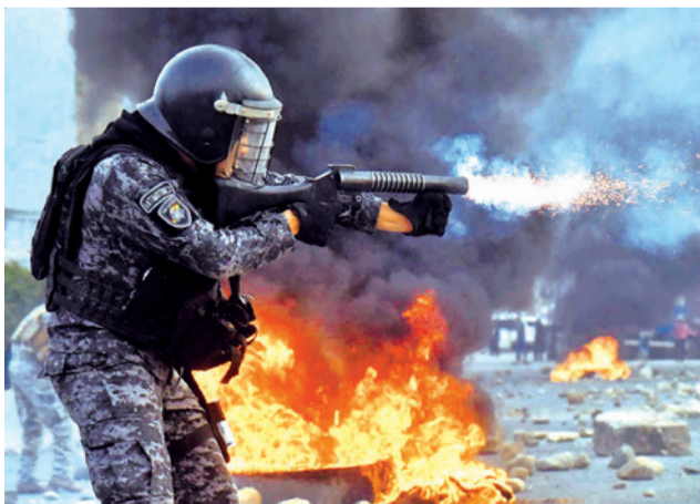
El desbloqueo de la vía en el río Khora II.

La Policía reforzada por los militares logró despejar la vía y dispersar a las personas