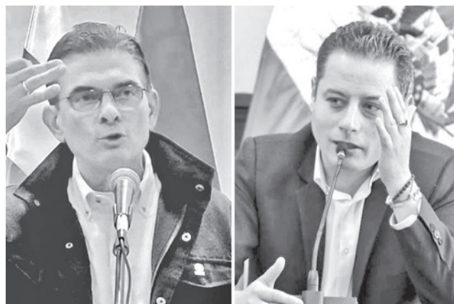
El presidente Rodrigo Paz y el vicepresidente Edmand Lara.

tó preocupación por la forma en que será administrado el nuevo fondo y planteó una serie de interrogantes sobre su funcionamiento.