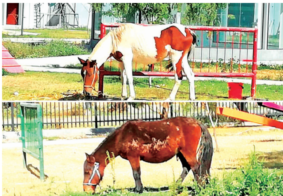
Los caballos rescatados se encuentran en instalaciones de Zoonosis.