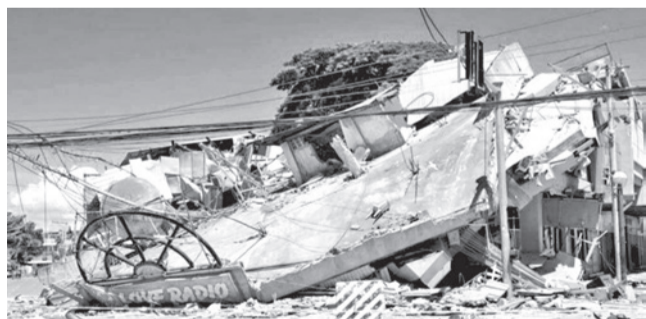
Un edificio destruido en la ciudad de General Santos.

Tragedia. Los equipos de rescate acceden a zonas que permanecían incomunicadas por el corte de luz y la destrucción de infraestructuras