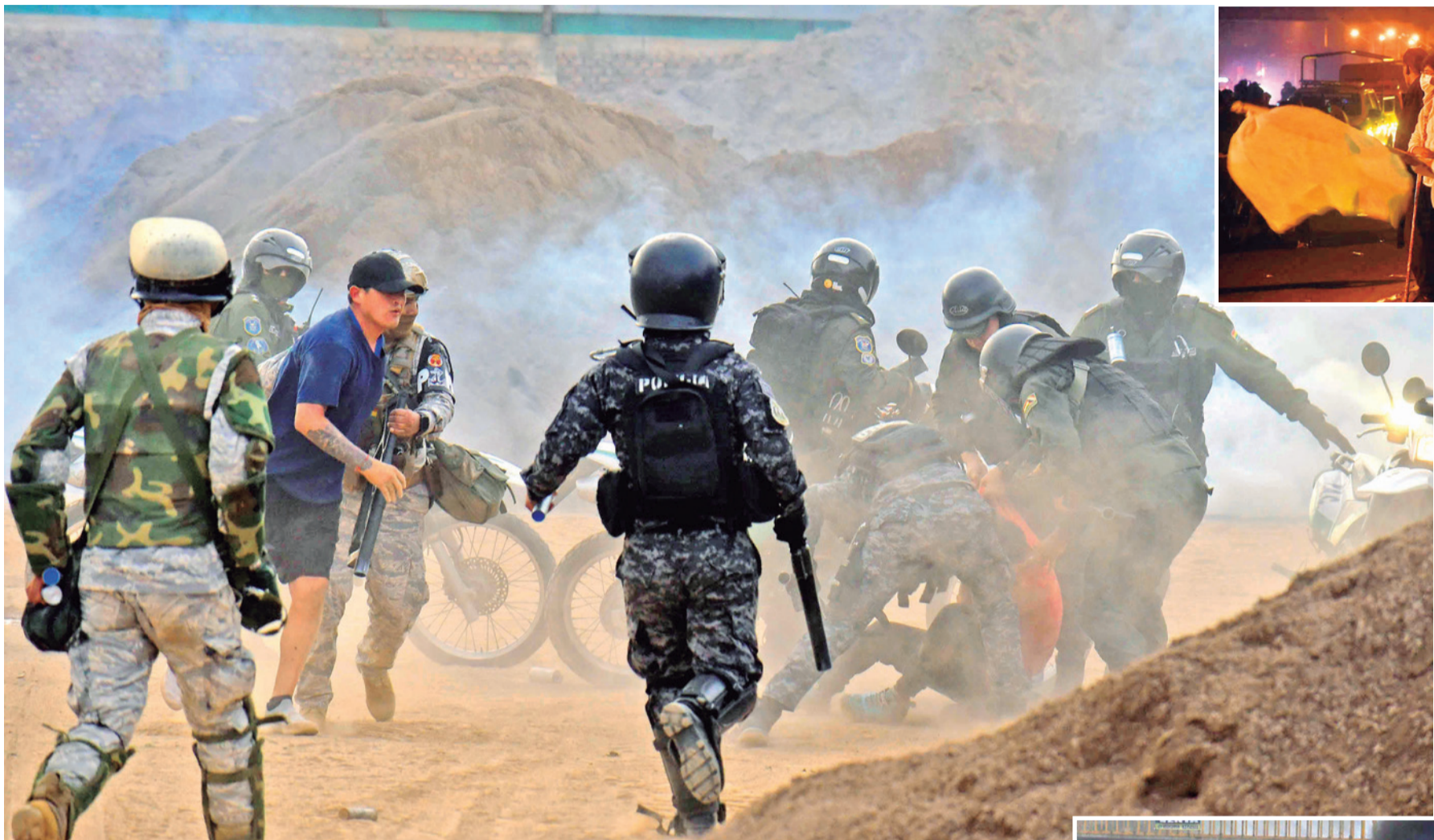
La Policía detuvo a participantes del enfrentamiento y los trasladó a la Felec central.