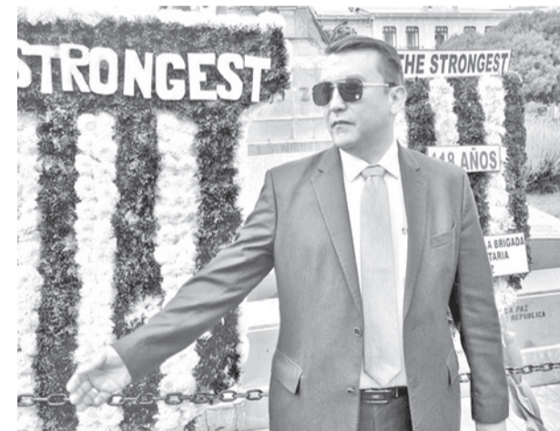
La dirigencia emitió un comunicado. LA PRENSA

En tanto, en la asamblea extraordinaria se tiene previsto aprobar los nuevos estatutos de la institución, lo que generará cambios en su administración y manejo. La realización de las asambleas son promesas de la campaña.