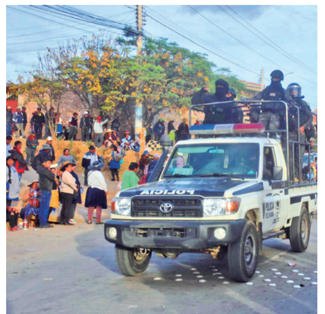
La vigilia en Uspha Uspha, hacia el valle alto.