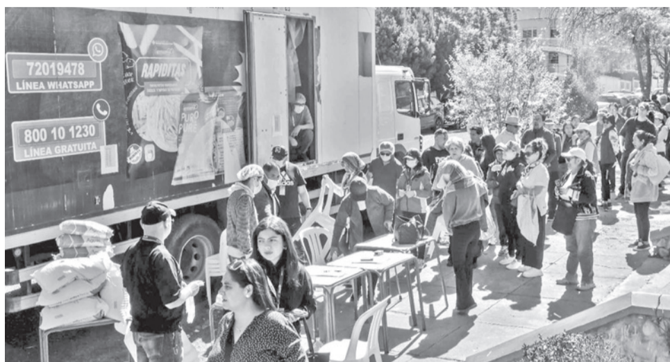
Filas de personas para comprar alimentos en la ciudad de La Paz. MARKA REGISTRADA

Tras la promulgación de la Ley de Regulación de estados de Excepción, Paz aún guarda su último recurso: emitir el decreto de estado de excepción y ponerlo en marcha ante lo que hoy catalogó como "narcoterroristas" que buscan desestabilizar al Gobierno.