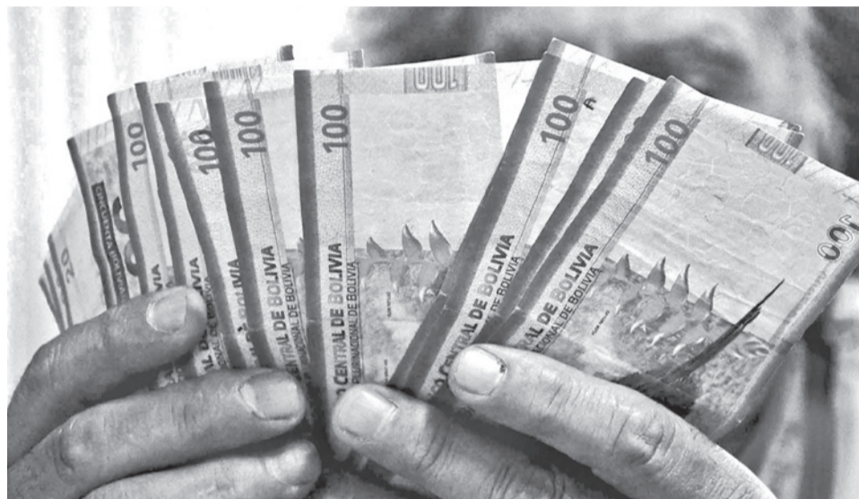
El gobierno aprobó la reprogramación de las deudas. CARLOS LÓPEZ

Además “para el compañero transportista se ha aprobado un decreto que tendrá un impacto hasta 1.000 millones de bolivianos (...), es un fondo de garantía hasta 1.000 millones de bolivianos, sobre la base de 100 millones para apalancar”, agregó.