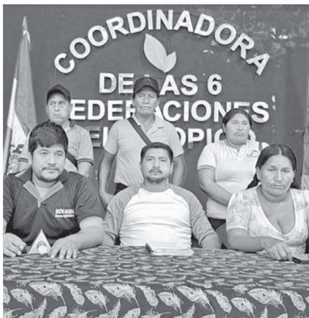
Los dirigentes del trópico en conferencia de prensa. RKC

Ratificaron que el pedido de las movilizaciones es la renuncia del presidente y re-