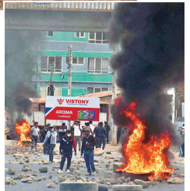
Bloquean con piedras y llantas la vía al occidente.

Los manifestantes armaron una barricada con piedras y llantas para cerrar la circulación de motorizados.