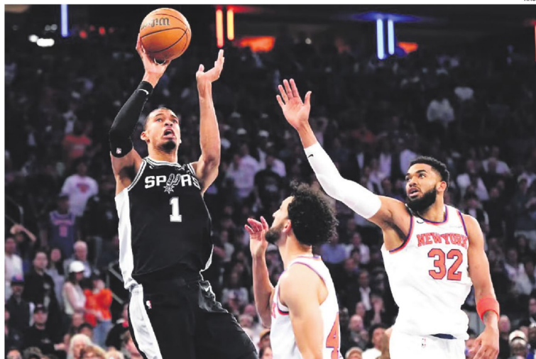
Los jugadores Victor Wembanyama y Karl-Anthony Towns disputan el balón durante el tercer partido de las finales de la NBA.