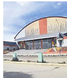
Inversiones bajo la lupa

La preocupación del sector es que los daños no terminen cuando se levanten los bloqueos. Recuperar reservas canceladas, reconstruir la confianza de los viajeros y volver a dinamizar miles de pequeños negocios podría tomar meses. Mientras tanto, hoteles, restaurantes y operadores turísticos siguen pagando el costo económico de una crisis que no provocaron. Cada semana de paralización amplía las pérdidas y retrasa la recuperación del sector.