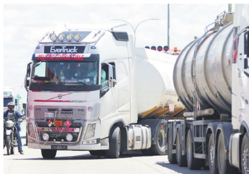
5.000 cisternas están detenidas en los diferentes bloqueos.

las unidades detenidas transportan gasolina y otros combustibles inflamables, lo que incrementa los riesgos de accidentes y derrames. También señaló que algunos conductores tuvieron que ser evacuados por problemas de salud, mientras que las bajas temperaturas agravan las condiciones en varios puntos de bloqueo.