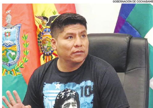
Loza niega que la Gobernación otorgue recursos para las protestas

Según precisó, el vehículo no dependía del Servicio Departamental de Salud, como se interpretó inicialmente, sino del gobierno municipal de Villa Tunari. "Es de la propia Alcaldía de Villa Tunari", añadió.