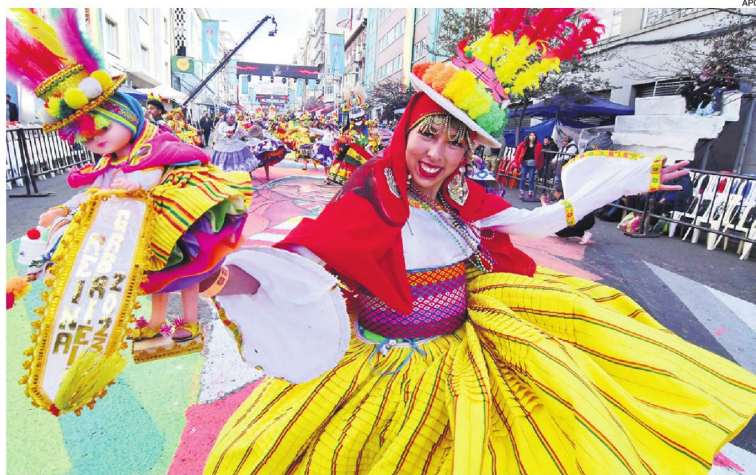
El Gran Poder, la fiesta mayor de los Andes, tuvo que ser postergada

Pero el golpe no termina en hoteles y agencias de viaje. La gastronomía, una actividad que moviliza miles de pequeños negocios y cadenas de abastecimiento en todo el país, también siente el impacto. Restaurantes, cafeterías, salteñerías, pastelerías y emprendimientos familiares reportan dificultades para conseguir insumos, caída de clientes y menores ingresos.