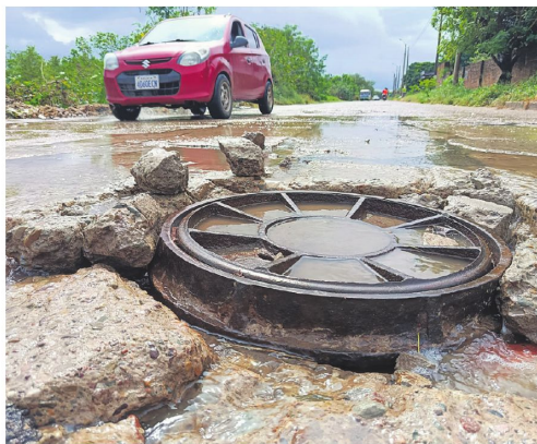
Este problema tienen los que pasan por el octavo anillo y av. Pero Vélez