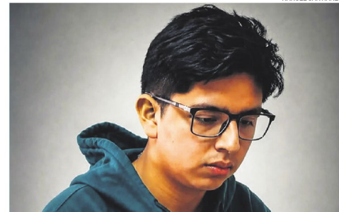
El pensador nacional se destacó en la competición que se desarrolló en Rosario.