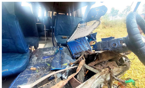
Parte de uno de los vehículos que quedó parcialmente destruido

rescatar los cuerpos sin vida de tres personas de entre los fierros retorcidos para después trasladarlos a la morgue del hospital en Cotoca. Los asientos del microbús quedaron destruidos y esparcidos en un campo abierto.