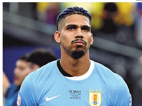
El jugador charrúa sufre una lesión en el gemelo que lo pone en duda para el Mundial.

Por otra parte, explicó que la lesión fue en un entrenamiento,