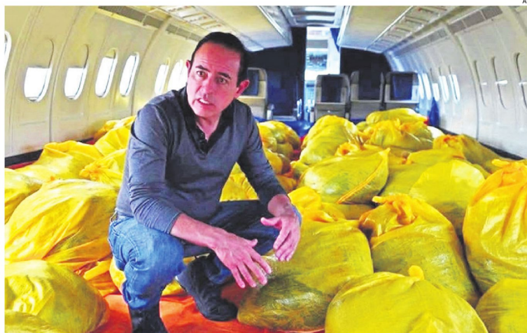
El alcalde de La Paz en el interior de un avión de pasajeros que fue adaptado para el traslado de pollos

El concejal observó, además, que Dockweiler haya anunciado que ya no trabajará con la empresa proveedora. "Dice, primero, que no contratará más a esa