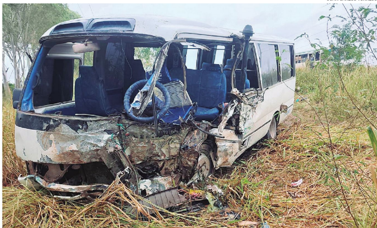
Así quedó el micro con pasajeros que fue impactado por otro motorizado tras invadir el carril contrario

Los motorizados protagonistas del accidente fatal se encontraban fuera de la carretera, semi-destruidos. Policías lograron