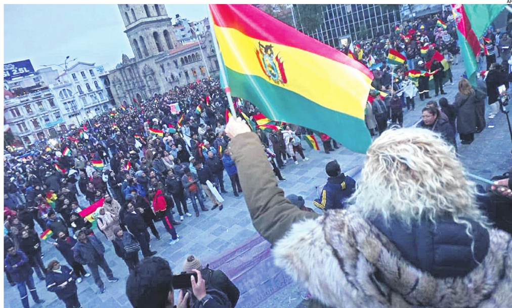
Vecinos de La Paz se reunieron anoche en la plaza de la Basílica menor de San Francisco de La Paz para pedir estado de excepción.