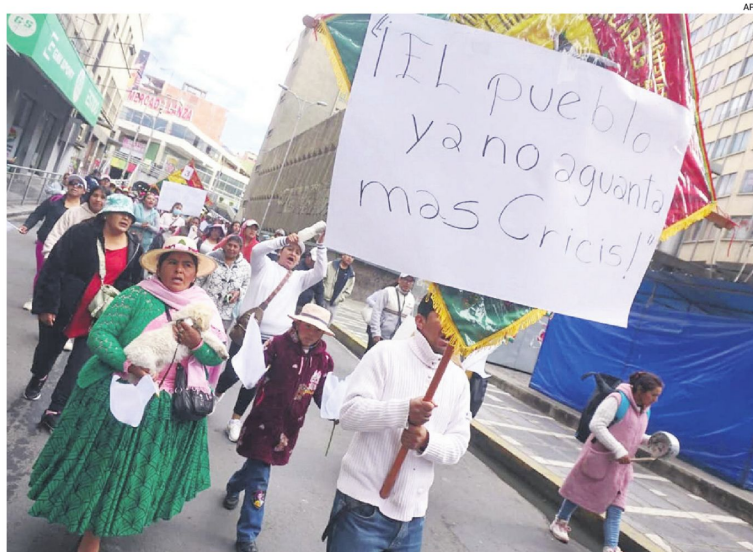
Diversos sectores solicitaron el alivio financiero tras la paralización económica por los bloqueos.

Durante una reunión sostenida este martes con autoridades del Gobierno representantes del transporte insistieron en que su prioridad es lograr una suspensión temporal de obligaciones que no derive en intereses adicionales. El encuentro concluyó con un cuarto intermedio hasta el jueves.