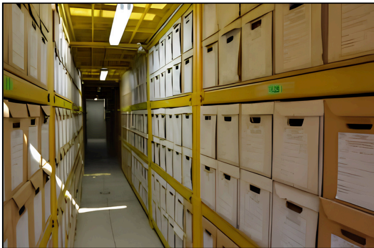
ARCHIVO INTERMEDIO SENKATA

Cada 9 de junio se conmemora el Día Internacional de los Archivos, para destacar la importancia de los archivos en la preservación de la memoria colectiva, el acceso a la información y la protección del patrimonio documental.