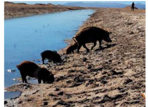
Una de las zonas del Ayllu San Agustín de Puñaca

Las organizaciones coincidieron en que, pese a las normas, sentencias y compromisos institucionales existentes, los avances para resolver los problemas ambientales siguen siendo insuficientes. Demandaron mayor responsabilidad de las autoridades, empresas y operadores mineros para garantizar el cumplimiento de la normativa ambiental y proteger los ecosistemas del departamento.