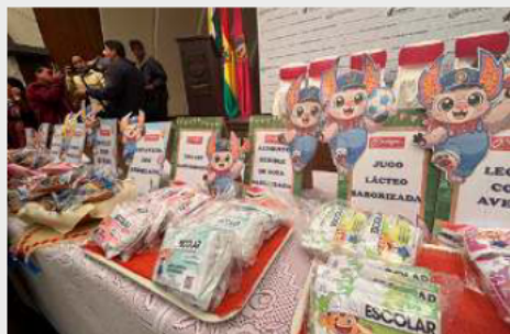
Alcalde aseguró que repondrá raciones del alimento escolar que no pudieron ser entregadas por los bloqueos

longación de los retrasos mantiene la incertidumbre sobre la fecha de conclusión del hospital, una infraestructura que busca fortalecer la atención médica de segundo nivel para la población orureña.