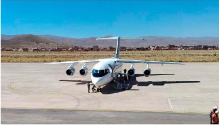
El primer puente aéreo llegó con pollo para la población orureña