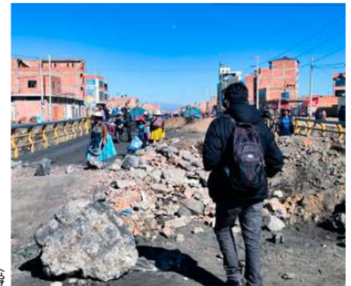
Los bloqueos han afectado a destinos emblemáticos como Uyuni y Copacabana