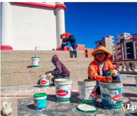
El monumento nacional fue pintado y también se instalaron cámaras de seguridad

nitoreo permanente del sector y exhortó a la población a proteger los espacios históricos y turísticos de la ciudad para evitar que vuelvan a ser objeto de vandalismo.