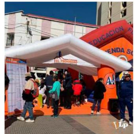
El Progreso fue una de las entidades que estuvo presente en la feria /LA PATRIA