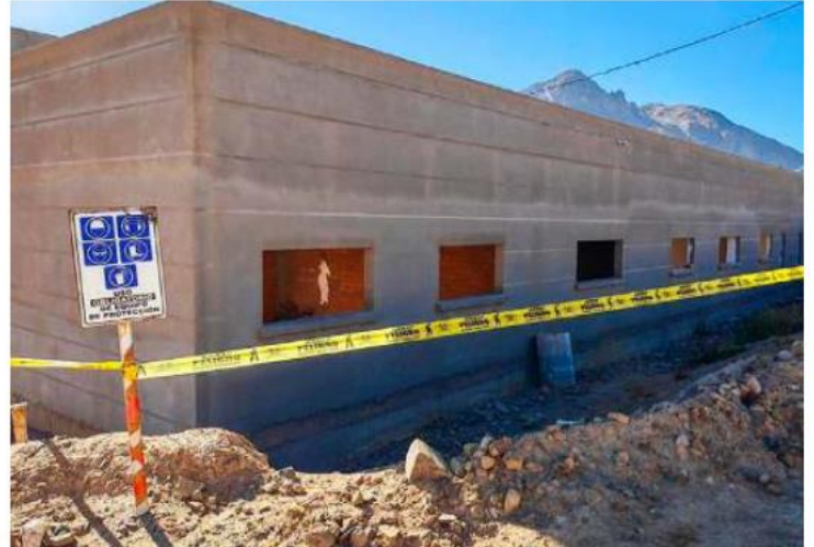
Hospital Isaías presenta un retraso en su ejecución

Sin embargo, dificultades relacionadas con los