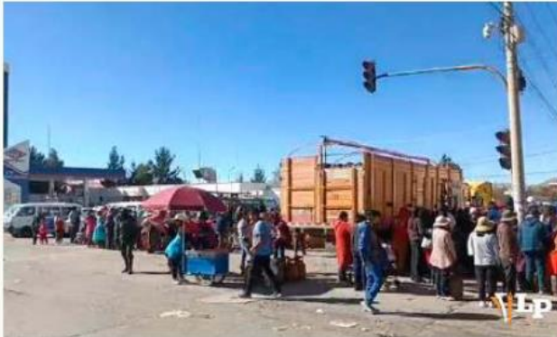
La fila en la E.S. San Pedro de YPFB alcanza la esquina, junto al carro distribuidor

Testimonios similares surgieron entre los presentes, quienes coincidieron en la necesidad de garantizar una distribución regular de GLP en la capital orureña. Esto evitaría largas esperas y desplazamientos innecesarios. LA PATRIA