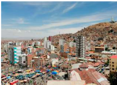
Economistas advierten pérdidas millonarias para el departamento de Oruro

Según el pronunciamiento emitido por la institución, la paralización de actividades productivas,