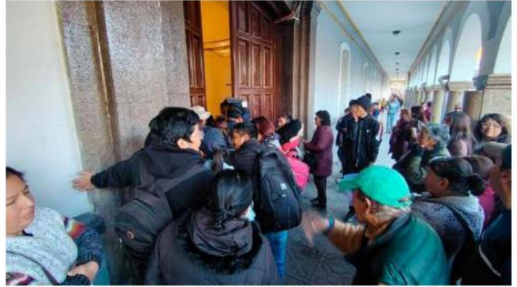
Desde antes de la llegada del pollo al Hall de la Gobernación, la fila fue larga