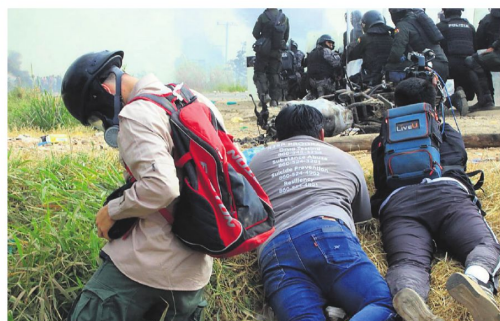
Trabajadores de la prensa y policías en el piso tras los disparos