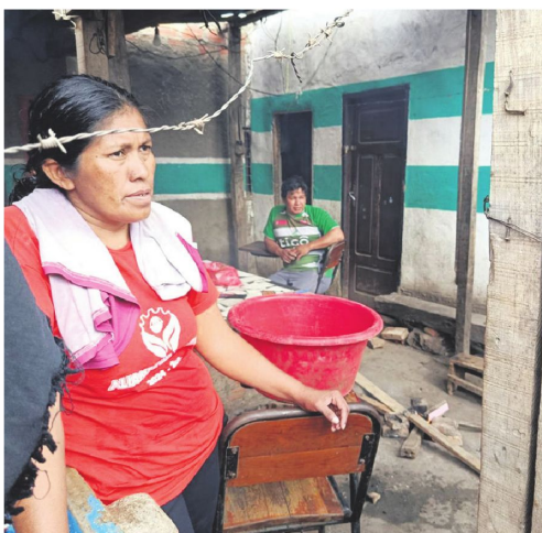
Acondicionan sus ambientes para cocinar, lavar y compartir