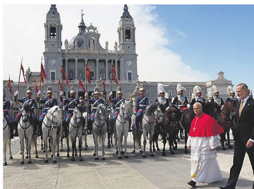
León XIV junto al rey Felipe VI en la Plaza de la Armería, en Madrid

etapa de una visita maratoniana que le llevará a Barcelona y las islas Canarias (Atlántico) hasta el próximo viernes 12 de junio, en un reto organizativo sin precedentes.