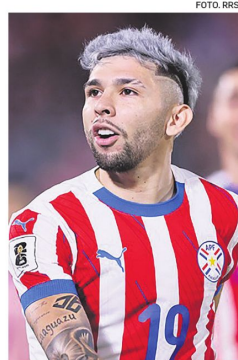
Julio Enciso es la estrella más joven de la selección paraguaya

El delantero del Estrasburgo de Francia fue retirado en camilla y visiblemente conmovido en el primer tiempo del encuentro. La imagen del joven llorando encendió todas las alarmas en el cuerpo técnico encabezado por Gustavo Alfaro, que había llegado al amistoso con la intención de ajustar detalles y no de sumar preocupaciones de este calibre.