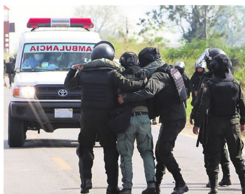
Prestan auxilio a uno de los efectivos que fue herido en San Julián

dos en diferentes rutas del país, señalando que afectan el abastecimiento y restringen el derecho a la libre circulación.