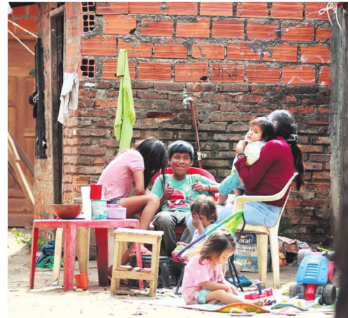
Son familias numerosas que acogen también a sus parientes