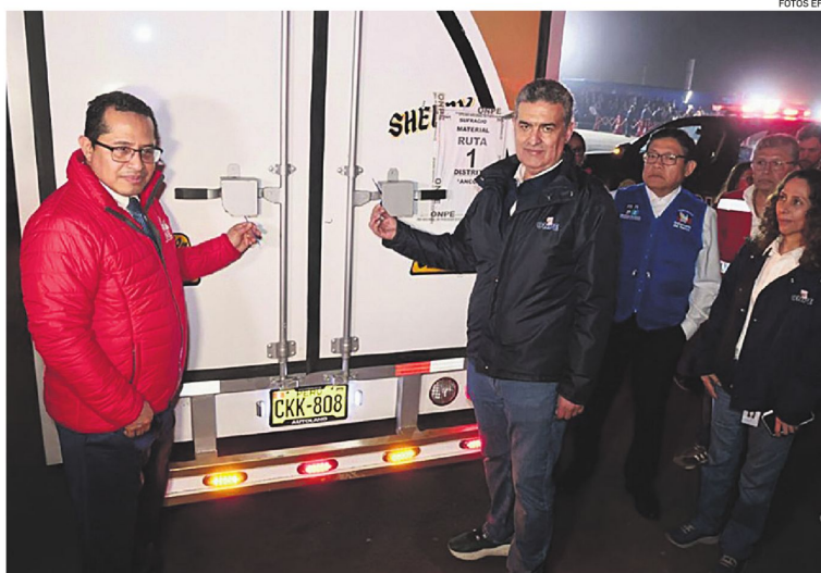
Autoridades electorales supervisan la distribución del material que será utilizado en los comicios de hoy

En las tres elecciones anteriores, el antifujimorismo se ha impuesto en ese pulso y le ha dado el triunfo al nacionalista Ollanta Humala, al derechista Pedro Pablo Kuczynski y al izquierdista Castillo, con ajustados márgenes de apenas 40.000 votos en las dos últimas votaciones.