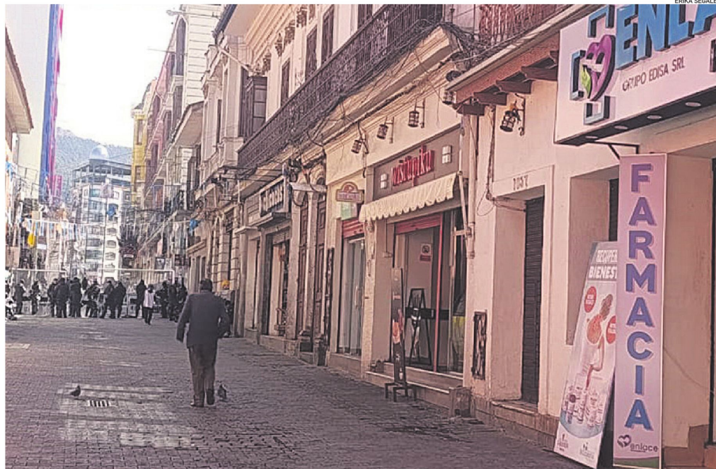
En alrededores de la plaza Murillo de La Paz algunos negocios se mantienen abiertos, aunque el paso es restringido por las marchas

Pequeños negocios enfrentan dificultades para abastecerse y reportan menores ventas y mayores costos.