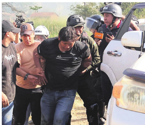
Uno de los detenidos durante los hechos violentos en San Julián

Hubo tensión entre movilizados y civiles que intentaron abrir el paso