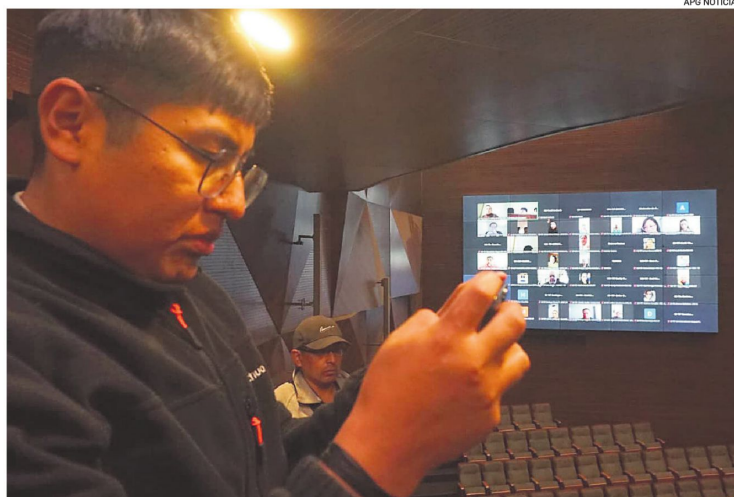
Los parlamentarios participaron de manera virtual y presencial en la sesión sabatina

Pobladores denunciaron que hubo heridos en el grupo de los movilizados, algunos que fueron asistidos en el centro de salud del lugar.