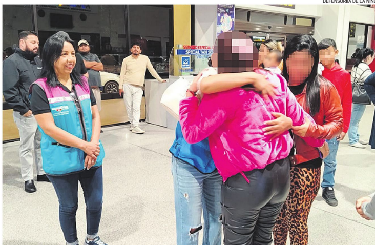
Autoridades hicieron las gestiones para que la menor pueda reencontrarse con su tía

Los escenarios de estas presentaciones enaltecen la historia y cultura de Chiquitos