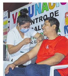
Todos pueden recibir la dosis

Los visitantes de la Feria Internacional del Libro pueden acceder también a la vacuna contra la influenza. La Alcaldía de Santa Cruz de la Sierra instaló un punto móvil de inmunización en el evento que se extenderá hasta este domingo.