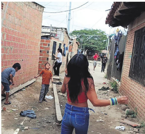
Conviven en viviendas de material, pero siguen siendo precarias