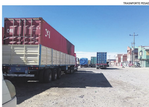
Los choferes permanecen en las carreteras hace más de un mes

"Si nos alejamos de la COB, (la Federación) Tupac (Katari) no nos va a dar nada, ni comida (...) Vamos a unirnos al bloqueo hasta que se vaya Paz, ahí hay una salida. Vendrán días negros hasta que se poseione otro presidente, hasta que haya elecciones", afirmó el