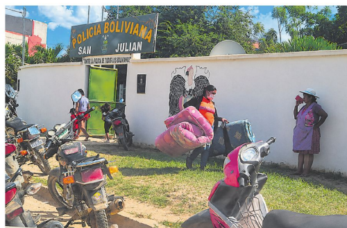
Tras el repliegue de los uniformados, saquearon el puesto policial