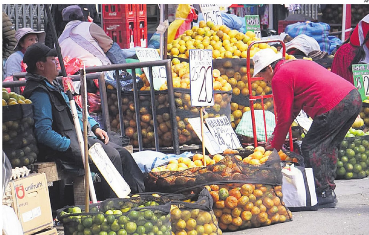
La población se abastece de alimentos, principalmente en los mercados populares de La Paz

En diversos sectores el pollo dejó de venderse por kilo y los consumidores reportan precios superiores a los Bs 100 por cada unidad, sin