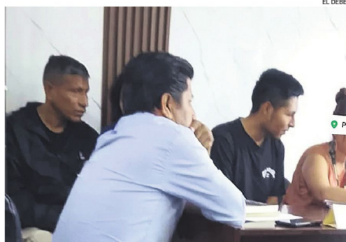
La audiencia judicial de los extranjeros, en el Palacio de Justicia

Luego trataron de huir y la víctima pidió auxilio a gritos y los atacadores fueron detenidos por la gente y entregados a la Policía.