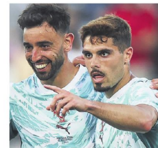
Fernandes y Guedes marcaron los goles

Además, es el único jugador que recibió el Balón de Oro en dos oportunidades (2014 y 2022) y el máximo ganador del premio al jugador del partido (11 veces).