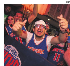
Fanáticos de los Knicks en New York

La serie viaja ahora a Nueva York, donde los Knicks recibirán a los Spurs en el Madison Square Garden, ya acariciando el anillo de campeones.