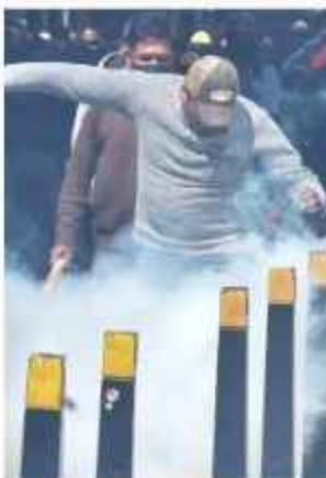
PROTESTAS. La Policía recurre a agentes químicos.

La institución reportó un crítico desabastecimiento de insumos para contener las movilizaciones de sectores sociales que, desde hace más de un mes, exigen la renuncia del presidente Rodrigo Paz mediante protestas callejeras y bloqueos de varias carreteras.