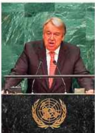
DIPLOMÁTICO. António Guterres, de la ONU.