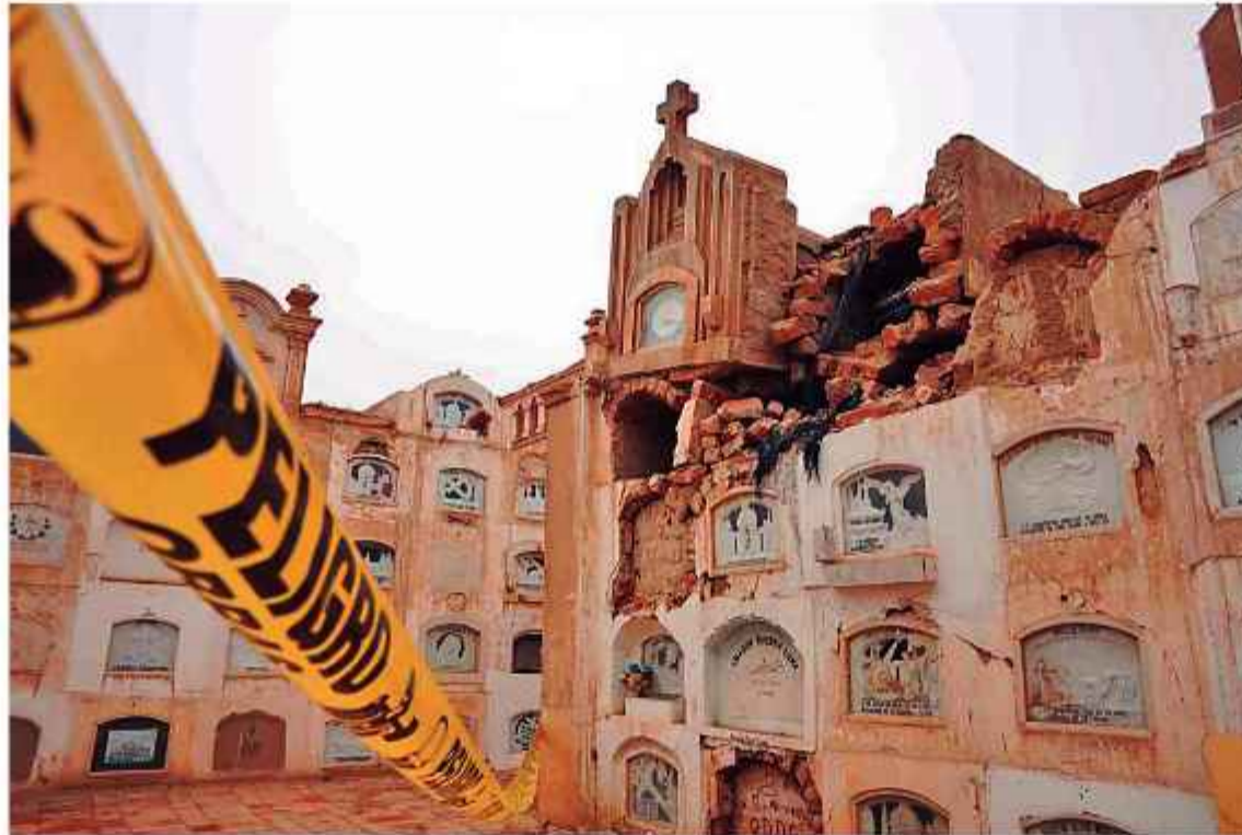
DAÑOS. Uno de los pabellones del histórico camposanto de la ciudad peruana de Ica.