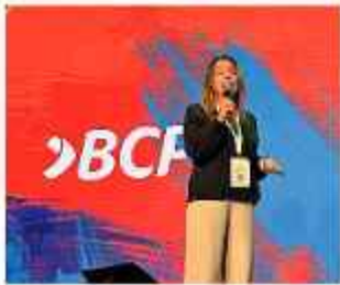
INFORME. Ejecutiva del BCP presenta un informe.

La billetera móvil se lanzó en Bolivia en 2023, alcanzó un millón de usuarios en apenas dos meses y un año después ya sumaba dos millones. Actualmente se consolida como la billetera líder del mercado y proyecta cerrar este año con 5,5 millones de usuarios.