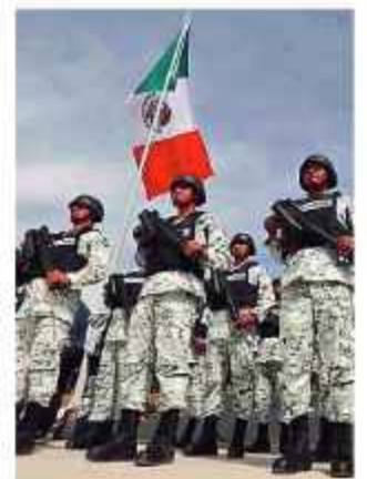
EFFECTIVOS. Personal de Sedena, en México.

La Sedena señaló que la captura de Gabriel “N” se llevó a cabo la víspera durante una operación coordinada entre el Ejército, la Guardia Nacional y el Grupo de Operaciones Especiales de la Secretaría de Seguridad Pública de Sinaloa. XINHUA