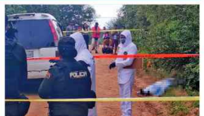
CRIMEN. El cuerpo de la víctima junto a unos matorrales, ayer.

Personal policial y del Ministerio Público llegó al sitio para acordonar el perímetro e iniciar la recolección de indicios.