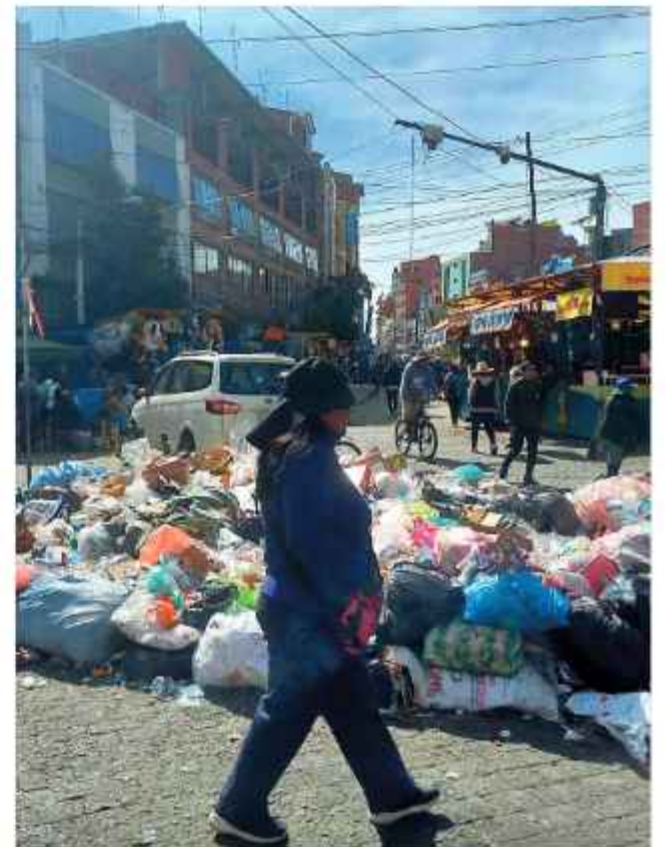
PROBLEMA. Los desperdicios se acumulan en calles de La Paz.