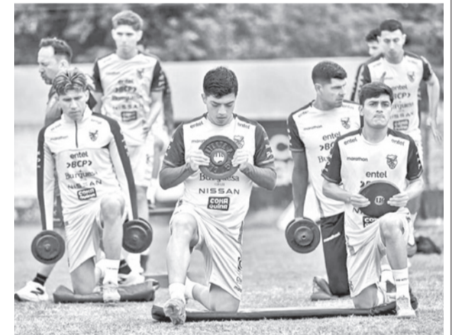
El entrenamiento de la Selección, ayer.

Tomé inclusive participó en el entrenamiento de la Verde que se realizó en horas de la mañana en Santa Cruz de la Sierra y después se trasladó a La Paz.