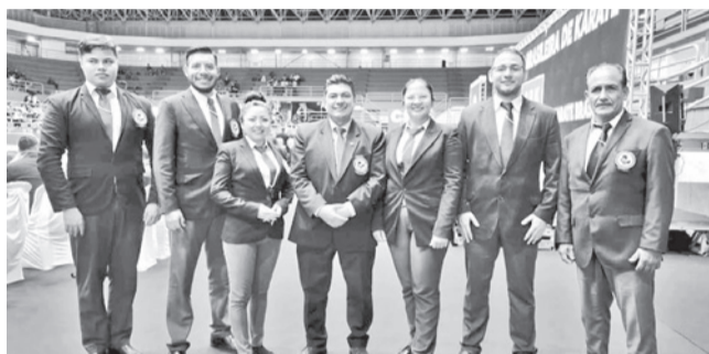
Los árbitros con Licencia Panamericana.

Logro. El país también sacó a seis nuevos árbitros con Licencia Panamericana durante el torneo que se llevó adelante en Brasil