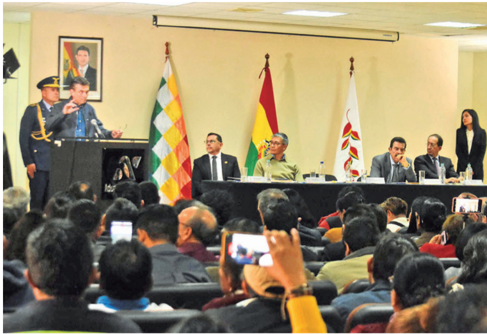
El presidente Rodrigo Paz presenta la ley de alivio tributario, ayer.

dad sea barata, hoy día ser formal en Bolivia es caro. La inmensa mayoría de los que están en la informalidad en algún momento fueron for-