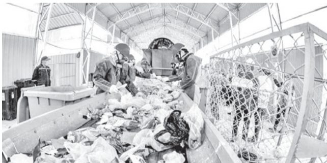
La planta de basura de Cercado en Cotapachi.

Medio ambiente. La solicitud no avanzó porque no se presentaron los requisitos de derecho propietario y cambio de uso de suelo