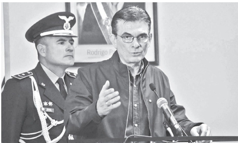
El presidente Rodrigo Paz, ayer en Cochabamba. JOSE ROCHA

En su cuenta de X, Ormachea aseguró que la iniciativa no se ajusta al marco constitucional vigente, ya que el mandato presidencial en el país es de cinco años y el mecanismo de revocatorio está previsto únicamente a mitad de gestión. “No concuerdo con la propuesta del diputado Alarcón”, señaló.