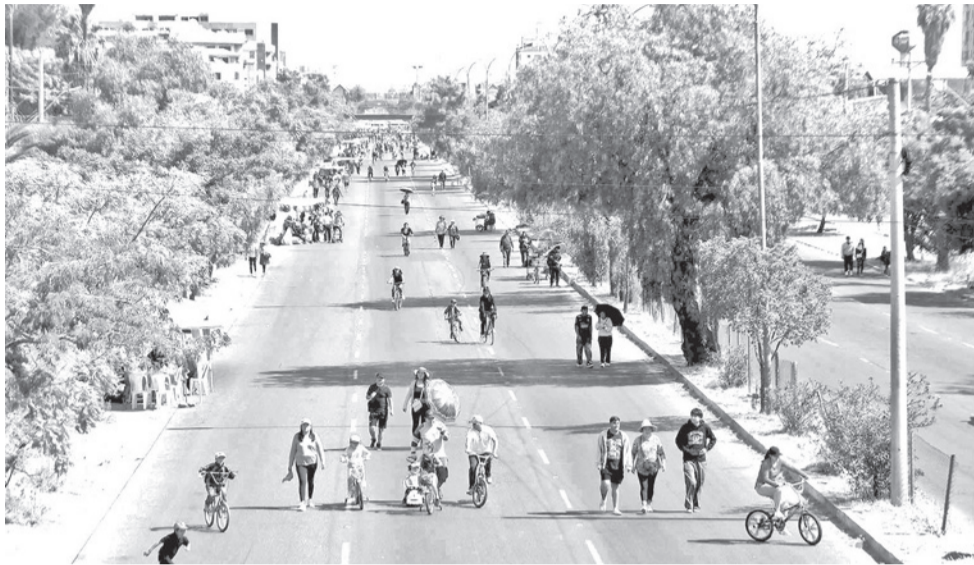
Las actividades del Día del Peatón, el domingo, en Cochabamba.