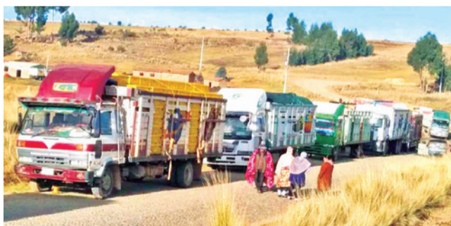
Camiones con pollos en el bloqueo en Vacas.

Pérdidas. Los granjeros afirman que los bloqueos están ocasionando la “quiebra total” en Cochabamba y Santa Cruz