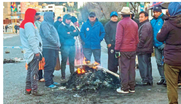
Choferes de La Paz protestan por la gasolina. RRSS

Las aves sin alimento y sin agua en medio camino están condenadas a morir.