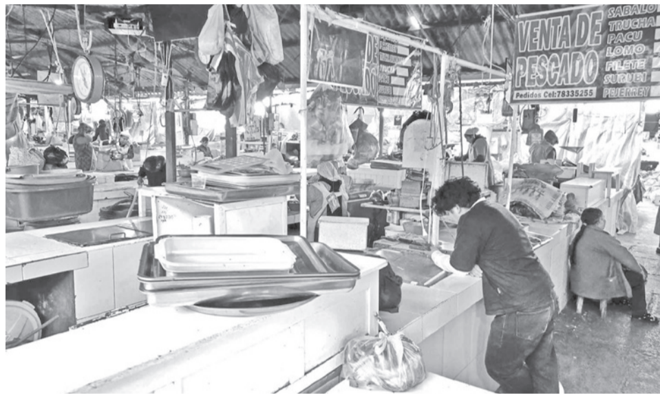
Mercados desabastecidos en la ciudad de Cochabamba.