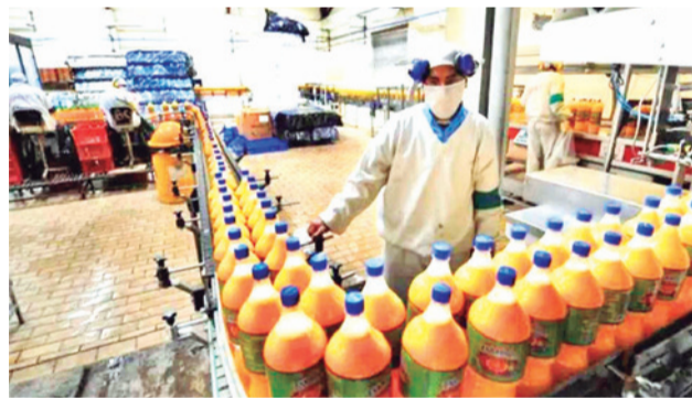
La producción de bebidas en La Paz.

El mecanismo de atención fue implementado luego de que conductores de diferentes regiones del país reportaran fallas mecánicas en sus motorizados, presuntamente ocasionadas por la comercialización de gasolina desestabilizada. Como respuesta a esta situación, se puso en marcha un sistema de recepción.