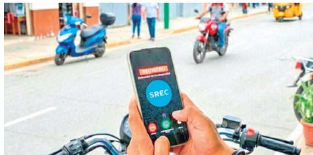
La aplicación para el resarcimiento de daños. YPFB

Atención. Los afectados envían los requisitos a la aplicación del SREC para acceder al resarcimiento