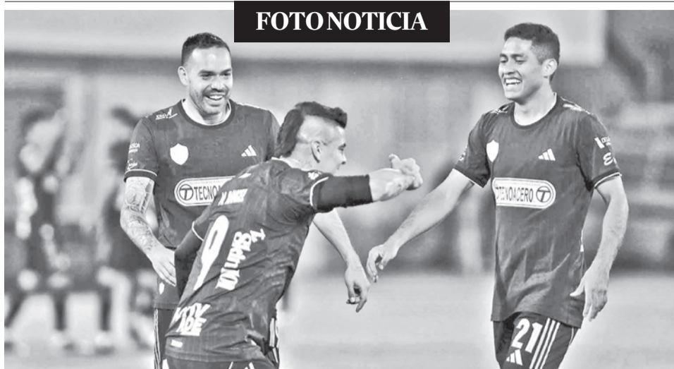
Aurora gana el clásico y suma tres puntos. El Equipo del Pueblo se impuso anoche frente a Universitario de Vinto por 2-1 en el Capriles, en la décima fecha del torneo profesional. JOSE ROCHA