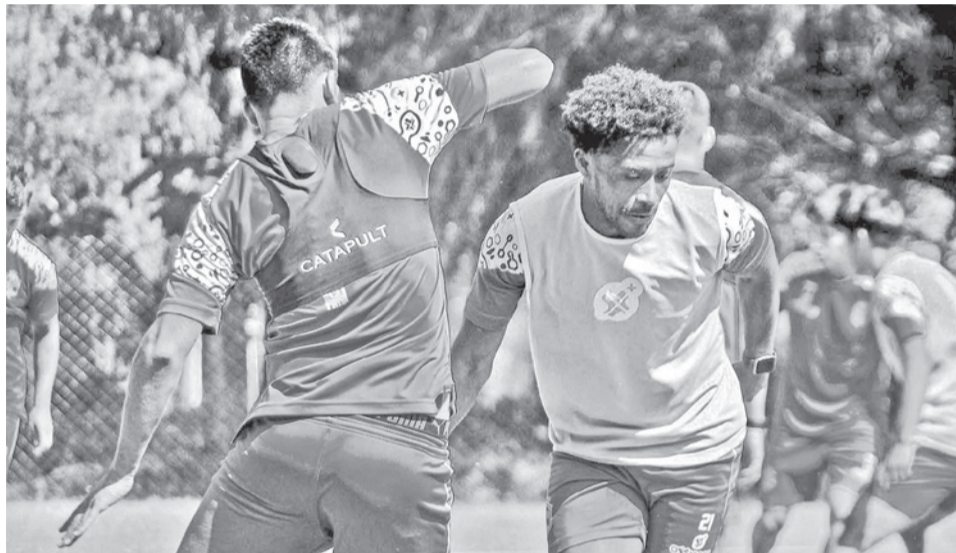
Un equipo del torneo profesional durante un entrenamiento. CLUB SAN ANTONIO

“Tenemos una seguidilla de partidos, por lo que vamos