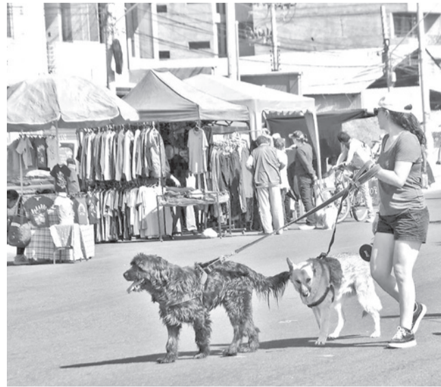
La jornada también generó comercio y basura.

Entre las principales observaciones se encuentra la incompatibilidad entre las actividades desarrolladas en el lugar y lo descrito en el manifiesto ambiental. Asimismo, se verificó que el emplazamiento no cumple con las distancia Otro aspecto observado fue la ausencia de la licencia de uso de suelo emitida por el gobierno municipal.